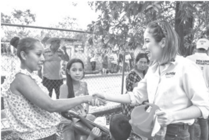
Jazmín Arroyo, ha sido la primera mujer electa como presidenta municipal de Tuzantla, y con sus ideas innovadoras es inspiración para las juventudes, mujeres y niñas.