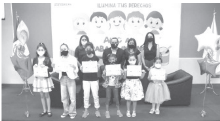
Para este concurso se convocó a niñas y niños de 6 a 12 años con residencia en Michoacán con dibujos inéditos participando en dos categorías: "A" de 6 a 9 años y la "B" de 10 a 12 años.

En la ceremonia de entrega de los premios, dijo que el fenómeno del trabajo infantil es un problema social multifactorial, que se asocia a contextos de pobreza y desigualdad; y su atención y erradicación depende de la participación de todos los actores sociales para encontrar y