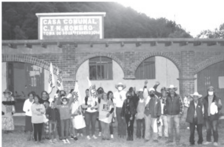
El tuzantense afirmó que irá al Congreso de la Unión a trabajar para que el presupuesto sea justo y atienda las necesidades prioritarias de los pueblos originarios.

-Su trabajo e intensa campaña, le han brindado la amistad y apoyo de los zitacuarenses