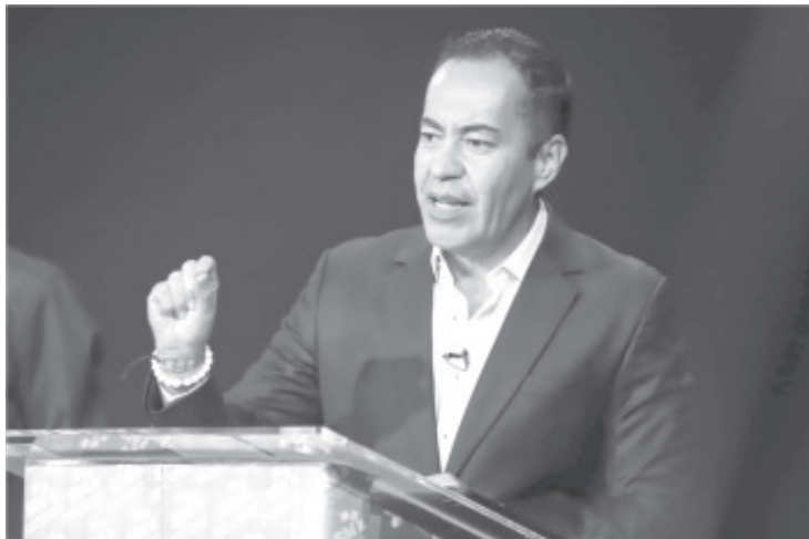
El candidato respondió a diversos cuestionamientos, y afirmó que el proyecto que él encabeza ya está al frente de las preferencias electorales.

"Trabajar con todos. Los he escuchado en este periodo para tener maestros pagados a completo y a tiempo, de la mano con el gobierno federal que comenzó con la absorción de déficit, Michoacán debe estar ahí", expresó.