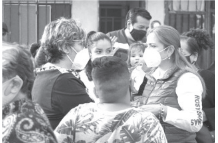
No robar, no mentir y no traicionar, serán pilares de la próxima administración que estará conformado por servidores públicos honestos.

administraciones pasadas ni en la actual. Aseguró que en su administración el deporte, ejercicio y la adopción de estilos saludables de vida serán una prioridad, ya que constituyen una herramienta esencial para alejar a las y los jóvenes de las drogas, así como para tener una vida más sana. Se