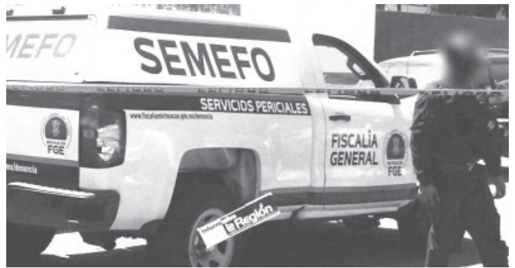
La camioneta con los cuerpos, estaba abandonada sobre la calle Benedicto López Sur, entre las vialidades Héctor Terán y Artillería Poniente.

dirección, iniciaron las investigaciones correspondientes y trasladaron los cadáveres a la morgue para la práctica de la necropsia de rigor. Hasta el momento las víctimas no están identificadas.