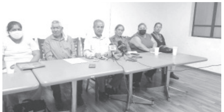
Ventura Gutiérrez señaló que el presidente de México, Andrés Manuel López Obrador, es el único que se ha acercado para prometerles apoyo en su lucha.

Finalmente manifestó que los partidos conservadores han sido hipócritas puesto que 70 por ciento de las leyes propuestas Morena han sido apoyadas por votos de la llamada oposición.