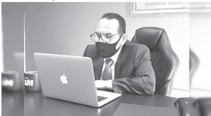
El pasado 26 de enero fueron publicados en el Periódico Oficial del Estado los Lineamientos para la Entrega-Recepción de los Gobiernos Municipales, emitidos por la ASM

El pasado 26 de enero fueron publicados en el Periódico Oficial del Estado los Lineamientos para la Entrega-Recepción de los Gobiernos Municipales del Estado, emitidos por la Auditoría Superior de Michoacán, herramienta que aporta claridad para que las autoridades cumplan a cabalidad con esta responsabilidad.