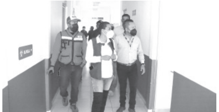
La candidata de Morena a la diputación federal, tuvo oportunidad de conocer las condiciones en las que se encuentra el Centro de Salud de Angangueo.

Fue ahí donde sostuvo una plática con los trabajadores del instituto de salud, para escuchar las problemáticas que aquejan a la institución; además recorrió habitación por habitación el hospital y recogió sus necesidades más apremiantes, que buscará atender una vez retomados las labores legislativas en San Lázaro, los siguientes tres años, si es que la población le favorece con su voto, así mismo mencionó "lucharé por que cada municipio del tercer distrito tengan mejores condiciones de salud" pues reconoció que no es un caso aislado el abandono en el que se encuentra el Centro de Salud de la localidad, sino que los diversos hospitales de la región presentan situación