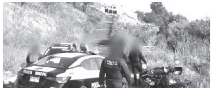
Una persona totalmente calcinada fue encontrada dentro de una zanja, se desconoce su identidad.

Los especialistas de la Unidad de Servicios Periciales y Escena del Crimen (USPEC) acudieron hasta el mencionado lugar y comenzaron las investigaciones correspondientes, consecutivamente trasladaron los restos humanos a la morgue.