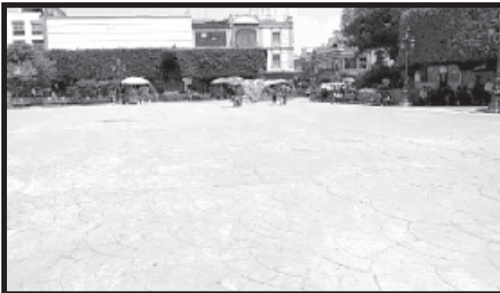
Esta apertura de espacios no quiere decir que la pandemia se ha superado, sino que se encuentra estable y mantiene al municipio en bandera verde.

H. Zitácuaro Michoacán, 18 de mayo de 2021.- Por: Guadalupe Solache Rebollo. Con autorización del Comité de Seguridad en Salud, esta semana comienza la apertura de varios espacios públicos, entre ellos el Jardín Central, el Parque de la Estación, Jardín Constitución y otros.