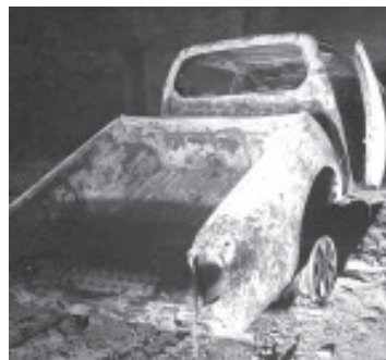
Un automovilista perdió la existencia como consecuencia de una volcadura en la que su camioneta se incendió con él atrapado en su interior.

La Unión, Guerrero.-17 de Mayo de 2021.- Un automovilista perdió la existencia como consecuencia de una volcadura en la que su camioneta se incendió con él atrapado en su interior en la carretera federal Zihuatanejo-Lázaro Cárdenas a la altura del poblado Los Llanos, en el municipio de La Unión, estado de Guerrero.