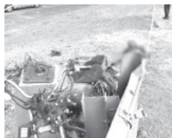
El motociclista y el niño circulaban sobre la avenida Morelos Norte, y a la altura de la colonia Soledad perdieron el control para impactarse contra la banda de contención.

su unidad para terminar impactando contra la banda de contención.