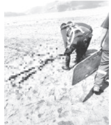
Personal del Cuerpo de Bomberos rescató de las aguas de la presa del Bosque el cuerpo de un hombre, que está en calidad de desconocido.

Comentan los presentes que pasaban por la presa que vieron un cuerpo en estado de descomposición que flotaba en el agua por lo que llamaron a las autoridades correspondientes.