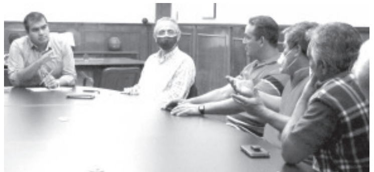
Resaltó, el presidente municipal, que existe un proyecto avanzando altamente sustentable y que cumple con los más altos estándares ecológicos.

Pidió a los zitacuareños hacer conciencia sobre dicho problema que no es exclusivo de la administración municipal, sino de crear una cultura sobre un mejor manejo y generación de los desechos.