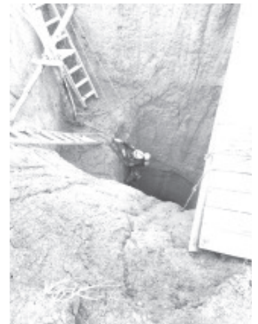
Dos hombres que trabajaban en la construcción de un pozo profundo en una huerta, en Puruándiro, perdieron la vida debido a un derrumbe.

Lo generales de los infortunados no fueron revelados por las autoridades.