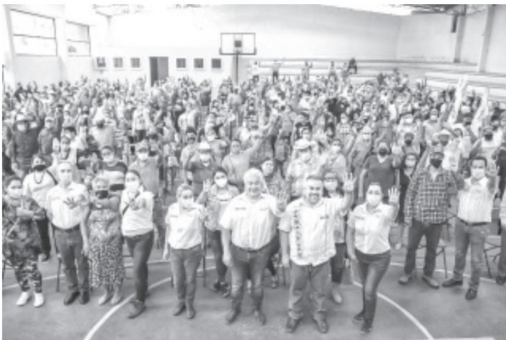
El abanderado de MORENA reafirmó su compromiso de trabajar en beneficio de los habitantes de este municipio, y mejorar las condiciones de vida de las familias tuxpenses.

Más de 400 liderazgos del municipio de Tuxpan, dieron el día de hoy su apoyo incondicional al proyecto del Doctor Domingo candidato de MORENA-PT a la alcaldía.