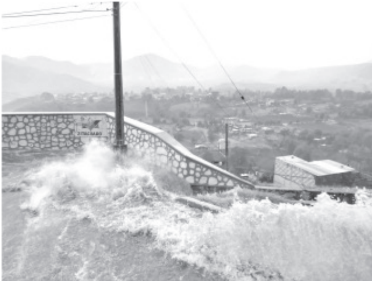
Los estragos de la lluvia de este miércoles, fueron consecuencia de algunas obras que están en construcción, pero sobre todo por la acumulación de basura en calles y alcantarillas.

-El Cuerpo de Bomberos está atento a los reportes de la población, como lo estuvo este miércoles