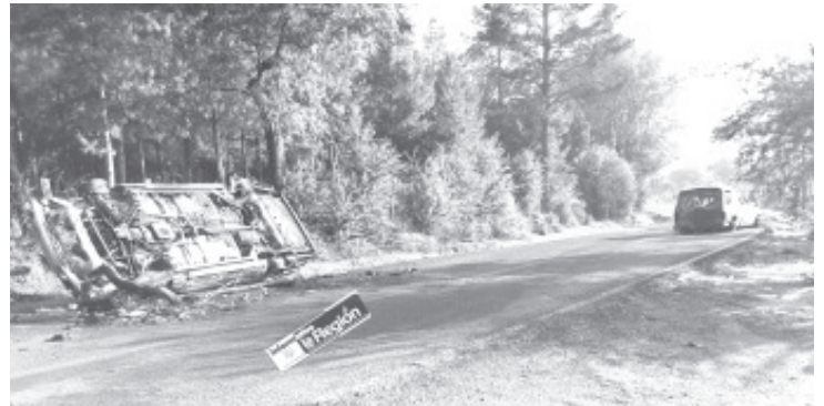
Dicha acción se debe a la lucha entre grupos delictivos por el control del territorio, ocurrió cerca de la comunidad de Ojo de Agua de Bucio, dijeron fuentes.

Los uniformados otorgaron seguridad en el área y con apoyo de unas grúas retiraron los automotores calcinados de la escena para reabrir el paso. El caso ya es indagado por las instancias competentes. Por fortuna no hubo lesionados ni fallecidos, trascendió en la labor noticiosa.