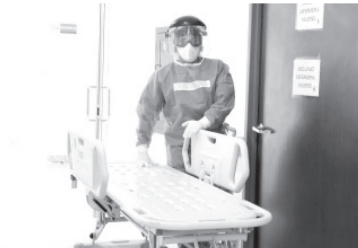
Aseguran datos de la SSM, que de las 5 mil 587 defunciones registradas a consecuencia del virus, mil 44 corresponden a personas de 50 a 59 años de edad.

Las acciones de este programa son públicas, ajenas a cualquier partido político. Queda prohibido el uso para fines distintos a los establecidos en el programa.