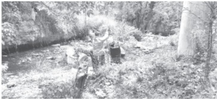
En el puente de La Encarnación, carretera a Tuzantla, policía Michoacán encontró restos humanos en el fondo, oficialmente no se informó, pero al parecer eran partes de un cuerpo.

No se informó a que sexo pertenece el cuerpo, que al parecer estaba descuartizado, ni se proporcionaron más datos sobre el caso.