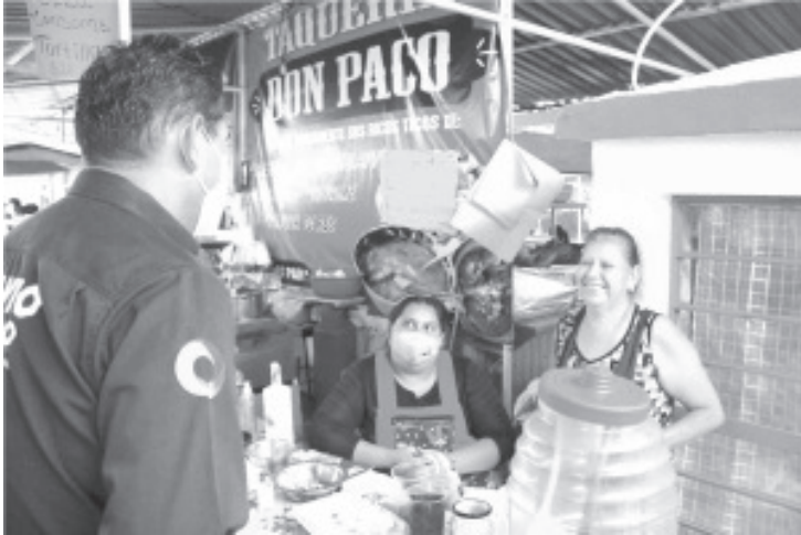
Como diputado buscaré que se reviertan las desiciones que han dejado a millones de personas en desamparo por el recorte de programas para el campo, vivienda, educación y salud.