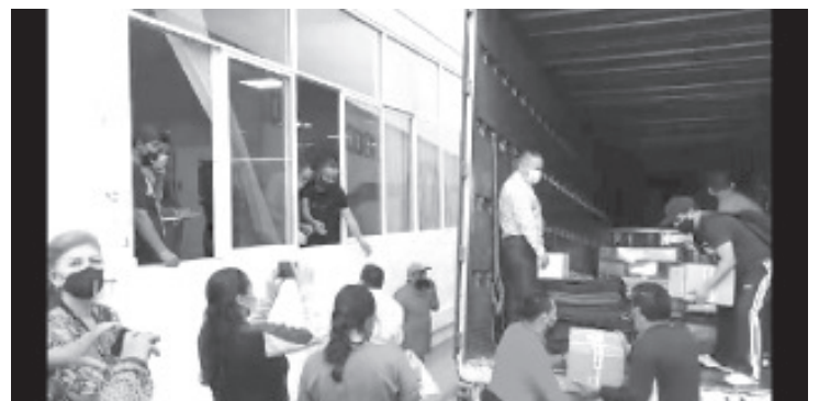
Este viernes llegaron más de 300 mil boletas electorales, así como actas de escrutinio, lo que se encuentra dentro de la paquetería custodiada.

Vargas Ortega, exhortó a los ciudadanos de este distrito, a escuchar las propuestas de los diferentes candidatos y razonar su voto; en cuanto a los candidatos: a conducirse con respeto, evitar las descalificaciones y privilegiar las propuestas enfocadas a solucionar los principales problemas de los ciudadanos.