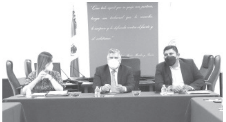
En Michoacán hemos avanzado, en el sentido de que contamos con un Tribunal autónomo y colegiado, independiente de los Poderes Judicial y Legislativo.