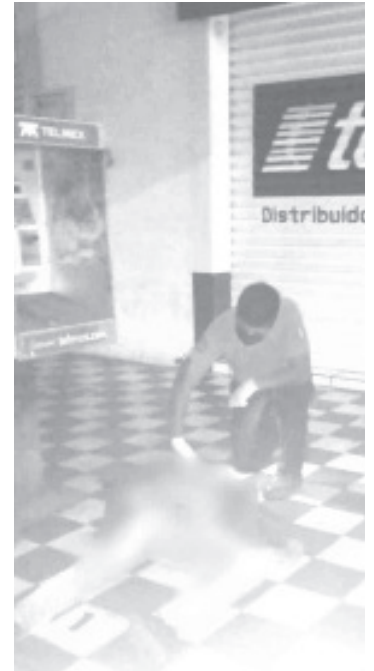
quien efectuó las primeras diligencias del caso y ordenaron que el cuerpo fuera enviado al Semefo para que se le efectuara la necropsia de rigor.

Al lugar también arribaron elementos de la Policía Municipal, quienes al comprobar que ya había fallecido, solicitaron la presencia del personal de la Fiscalía General del Estado,