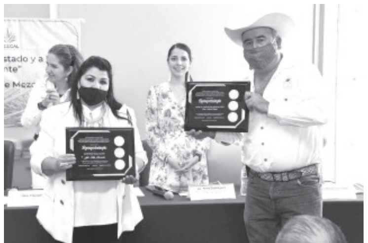
El secretario de Desarrollo Económico felicitó a las empresas que ponen en alto el nombre de Michoacán, al llevar productos de calidad a mercados internacionales.

En el evento participaron representantes de las empresas que fungen como organismos certificadores: el Centro de Innovación y Desarrollo Agroalimentario de Michoacán (Cidam), PAMFA y Certificadora Mexicana, que cuentan con autorización de la Secretaría de Economía (SE), para certificar mezcal en todo el país, mismas que reconocieron al Gobierno de Michoacán por sus gestiones para brindar más opciones a los mezcaleros.