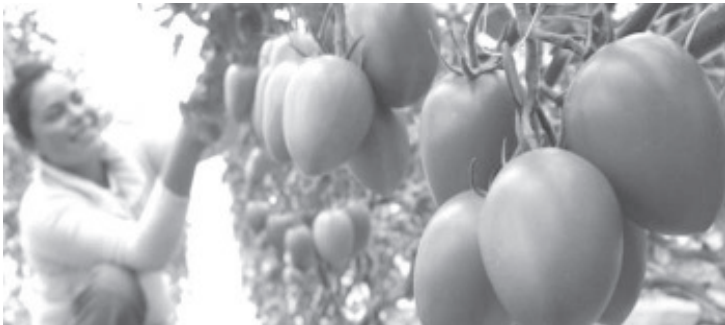
El cultivo del jitomate michoacano se ha incrementado en más del 170% en los últimos seis años, toda vez que la producción en el 2013 fue de 98 mil 435 toneladas y ahora rebasa las 281 mil toneladas.

El tomate rojo o jitomate se ubicó como el principal cultivo bajo la modalidad de agricultura Protegida, donde 81% se practica en malla sombra y el resto en invernadero.