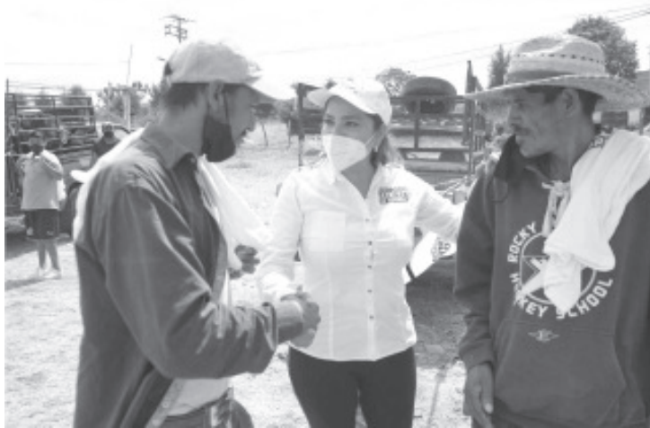
Una de sus propuestas, fundamental para la economía, es apoyar a los productores ganaderos a través de un programa de mejoramiento genético para ganado, aves de corral y traspatio.