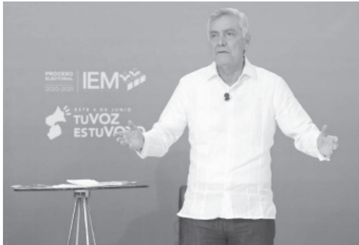
La corrupción y la impunidad, expuso, tienen que combatirse firme y enérgicamente, tiene que revisarse el pasado para deslindar responsabilidades. “No habrá borrón y cuenta nueva”.

Anunció observatorios ciudadanos en cada una de las dependencias del gobierno estatal para vigilar y dar seguimiento a las