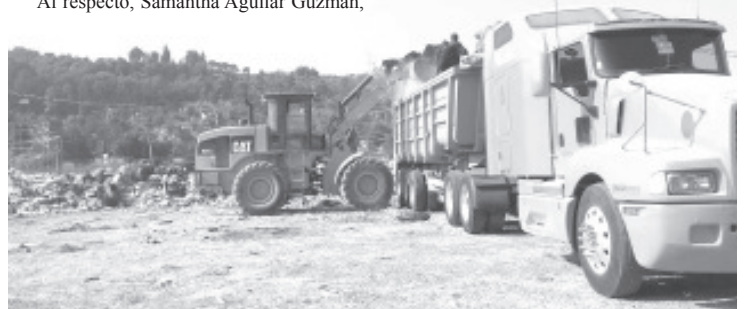
Aunque se tienen muchas dificultades, y no hay un lugar para depositar la basura que se genera en la ciudad, el servicio de recolección no se detendrá.

titular de Servicios Públicos Municipales, aseguró que aunque se tienen muchas dificultades, y no hay un lugar para depositar la basura que se genera en la ciudad, el servicio de recolección no se detendrá.