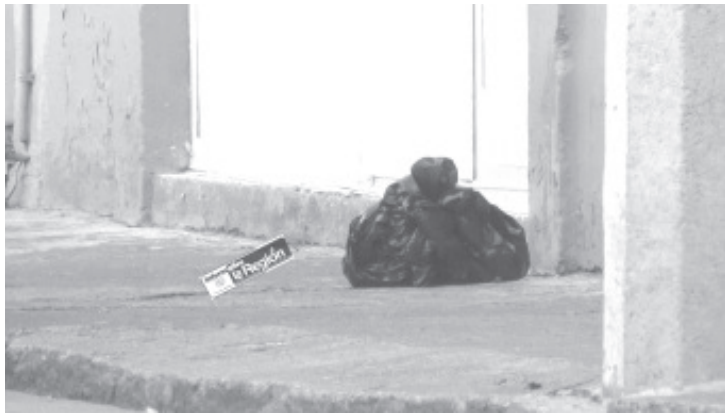
La mañana de este viernes fue encontrada una cabeza humana dentro de una bolsa negra, es de un ser masculino.

Los expertos de la Unidad de Servicios Periciales y Escena del Crimen (USPEC) se presentaron en la referida vialidad e iniciaron las investigaciones respectivas, posteriormente trasladaron la cabeza a la morgue.