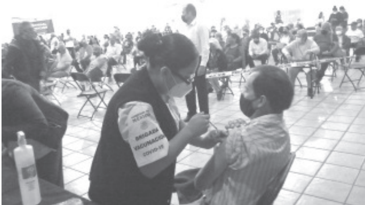
Por comentarios de médicos de los puestos de vacunación, les tocó atender a personas que tenían temperatura alta, y no les pudieron aplicar el biológico.

-Médicos detectan altas temperaturas y no los vacunan