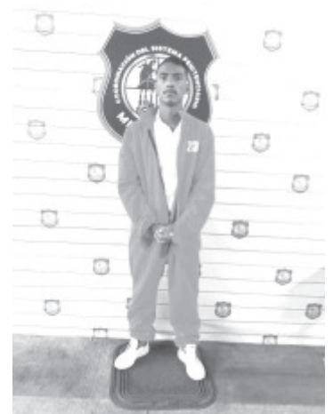
La tarde de este viernes el preso fue llevado a una audiencia a las mencionadas instalaciones, pero aprovechó un descuido de sus custodios y logró darse a la fuga.