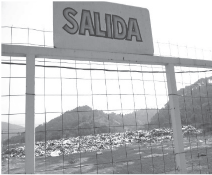
Habitantes de la zona se plantaron en la entrada a la feria para impedir que sigan llegando carros a tirar más basura.

-Se inconforman y se unen para evitar sigan tirando la basura que genera la ciudad