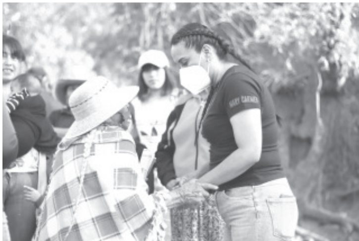
Desde la agenda legislativa trabajaremos para modificar leyes que vayan encaminadas a mejorar las condiciones de vida de las madres de familia.

-Desde la agenda legislativa trabajaremos para modificar leyes que vayan encaminadas a mejorar las condiciones de vida de las madres de familia -Mayor apertura a programas sociales que beneficien a madres solteras y madres de familia