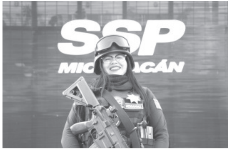
Ser policía requiere algo más que valentía, requiere compromiso, responsabilidad, amor y dedicación.

“Ser madre es algo muy bonito y requiere