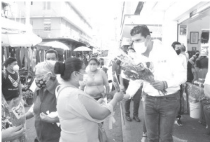
Octavio Ocampo se comprometió a legislar para que las madres jefas de familia tengan una prioridad en el acceso a programas sociales.

Zitácuaro, Mich., A 11 de mayo de 2021. A lo largo del 10 de mayo, el candidato de Va por México a la diputación federal por el Distrito 03, Octavio Ocampo saludó y felicitó a madres de familia en Zitácuaro con motivo del Día de las Madres, en diversos puntos de la ciudad.