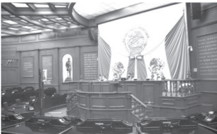
El Congreso de la Unión consideró importante romper con las inercias históricas e impulsar nuevas concepciones de lo que significa la asignación y el ejercicio del gasto público.

De esta manera, los integrantes de la 74 Legislatura respaldan la reforma constitucional aprobada por el Congreso de la Unión, considerando que deben consagrarse los principios de legalidad, honradez, eficiencia y transparencia para permitir el conocimiento público del ejercicio del gasto federal.