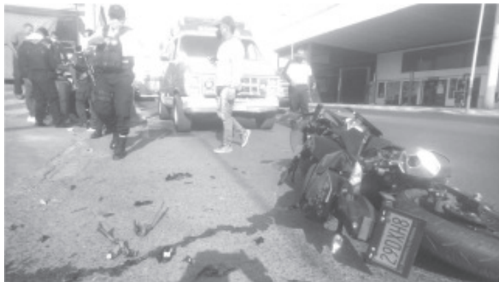
El Cuerpo de Bomberos de Zitácuaro, informa que de enero a la fecha han atendido 108 accidentes de motos, los meses con cifras más altas son abril con 28 y mayo que lleva 13.

-Sólo el 40% de motociclistas usa protección de seguridad