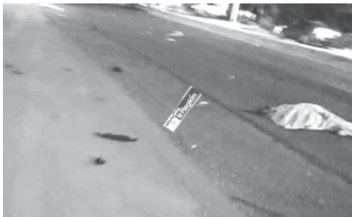
La noche de este martes un auto y una motocicleta se impactaron, dejando como saldo tres personas fallecidas, entre ellas un menor de edad.

Los peritos y los agentes investigadores de la Fiscalía General del Estado hicieron las actuaciones pertinentes para luego trasladar los tres cadáveres a las instalaciones del Servicio Médico Forense para la práctica de las necropsias respectivas. La Policía no especificó si todos los finados viajaban en la motocicleta dañada o si alguno de ellos iba en el carro perjudicado.