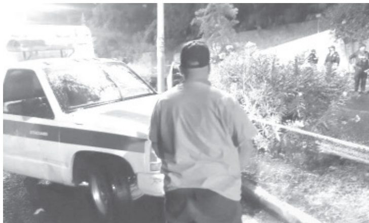
El cuerpo presentaba heridas de bala en la cabeza y tórax, al parecer conducía un auto VW Saveiro, color gris, que estaba en la escena del crimen.

También se reportó que junto al cuerpo se encontró un vehículo que aparentemente era de la víctima, un Volkswagen, tipo Saveiro de color gris, el cual también fue asegurado para su análisis.