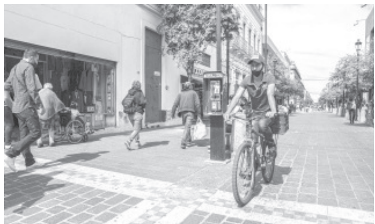
Noventa por ciento de los ciudadanos tiene previsto acudir a las urnas, aun cuando un tercio de la población no se identifica con ningún partido político.