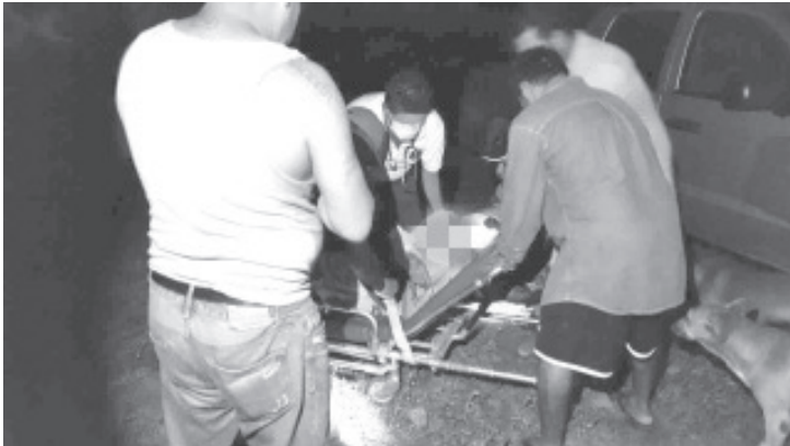
Dos mujeres fueron arrolladas, lo cuál causó que una muriera y otra resultara herida, el motociclista causante huyó.

Asimismo las personas que presenciaron el hecho relataron las autoridades que el motociclista involucrado también resultó lastimado, pero decidió huir de la zona.