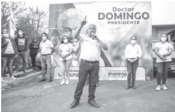
El Doctor, manifestó que será un gestor incansable para lograr un desarrollo social en estas comunidades y puedan mejorar la calidad de vida de sus familias.