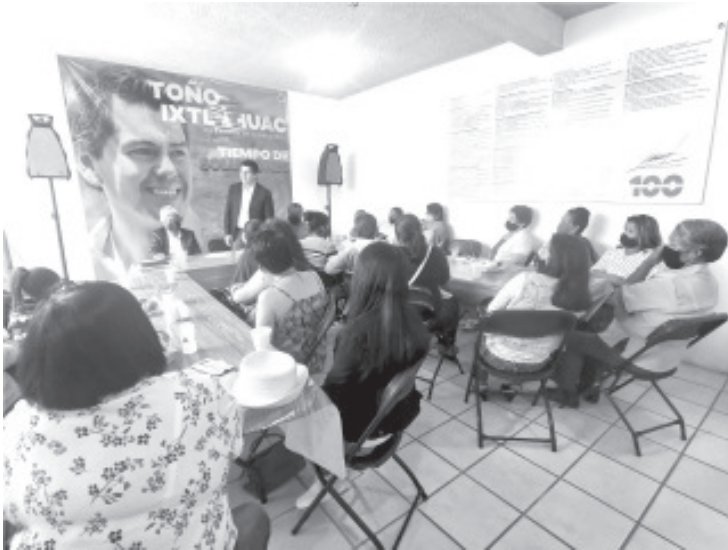
Las madres de familia y las mujeres en general tendrán un lugar privilegiado entre los sectores más apoyados por el gobierno municipal.

créditos para fortalecer sus proyectos. "Hay que escucharlas y atenderlas, son solidarias y debemos brindarles fortaleza para que sean las conductoras del eje de cambio y el gobierno de vanguardia que queremos", indicó Toño Ixtláhuac.