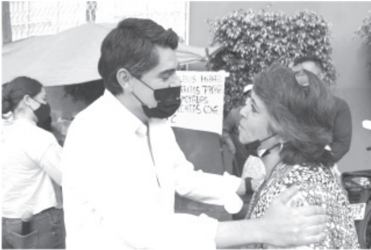
Que el Gobierno Municipal entienda que desde la secretaría más modesta hasta su servidor debemos atenderlos como ustedes se merecen.