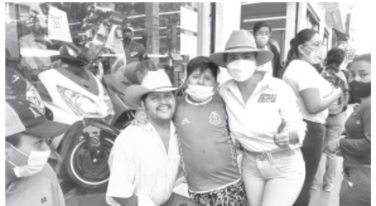
La Contadora Salinas sigue transmitiendo la esperanza de que un mejor futuro para todos los zitacuarenses es posible,