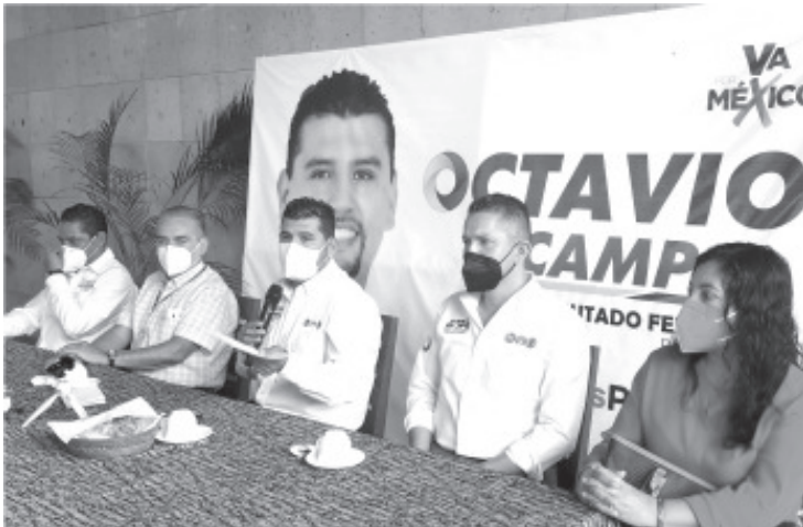
El candidato dio a conocer una de las iniciativas a presentar en San Lázaro, que será una reforma a la Ley General para la Atención y Protección a Personas con la Condición del Espectro Autista.

-Se debe garantizar el acceso a los derechos a la salud y a la educación para personas con la condición de Transtorno del Espectro Autista (TEA).