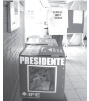
Las comunidades en conflicto son: Crescencio Morales, Francisco Serrato, Chimusdá, Carpinteros, El Tigre, Cuarta manzana de Guadalupe, La Barranca, Donaciano Ojeda, donde no se instalarían 17 casillas.

Agregó que la última oportunidad de integrar las mesas directivas de casilla en estos lugares es antes del 10 de mayo, pasada esta fecha, sería imposible por todo el proceso que tienen que pasar las boletas electorales destinadas para cada casilla.