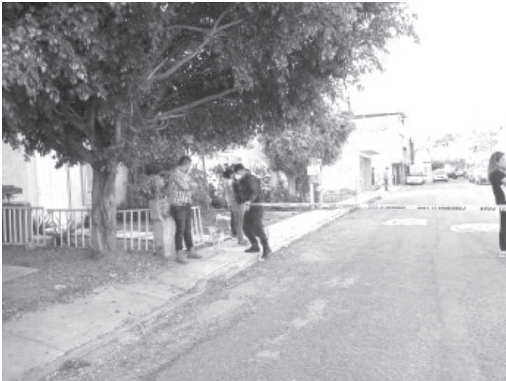
Un sujeto entró al fraccionamiento Mirador del Fresno 1 y disparó contra un hombre, provocándole la muerte, un bebé resultó con una herida en el pecho.

Testigos oculares afirman que una persona abordó de una moto sin refirir mayores características, se aproximó al hoy occiso y le disparó, provocándole las lesiones con el arma de fuego, por lo cuál vecinos pidieron apoyo a bomberos.