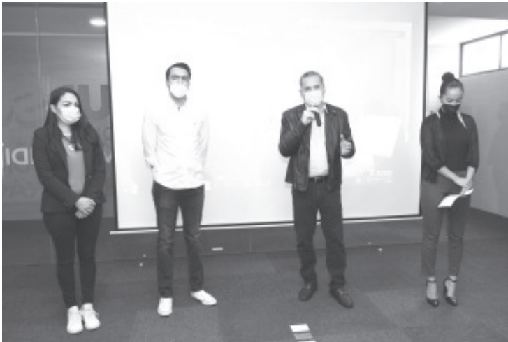
Durante 9 semanas, las y los participantes de Morelia, Uruapan, Zitácuaro, Zamora, Sahuayo y Pátzcuaro, así como de Querétaro, aprenderán a desarrollar un modelo de negocio.

Las personas interesadas en inscribirse a esta Academia de Emprendimiento pueden comunicarse al teléfono 443 113 4500 extensión 10612 en horario de 9 a 15 horas o vía correo electrónico a la dirección ursumaya@hotmail.com . El curso tiene cuota de recuperación.