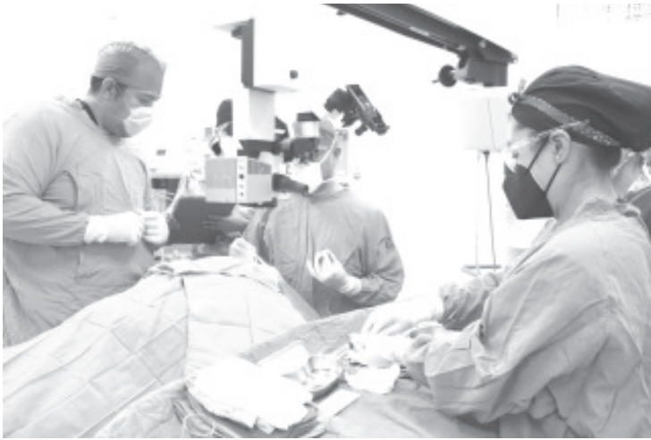
Desde las ocho de la mañana y hasta pasado el mediodía, un equipo médico quirúrgico encabezado por el cirujano oftalmólogo responsable del trasplante de córnea, efectuaron con éxito estos procedimientos.

-El Instituto Mexicano del Seguro Social (IMSS) en Michoacán, realizó trasplantes de córnea exitosos, con lo que se devolvió la vista a personas.