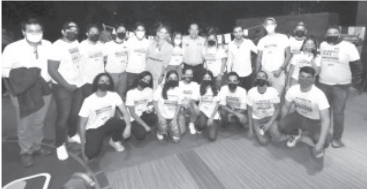
“Habrá trabajo para todos y todas las emprendedoras, con la participación de una barra completa de empresarios que fundearán proyectos”.

-El candidato del Equipo por Michoacán dialoga con jóvenes emprendedores.