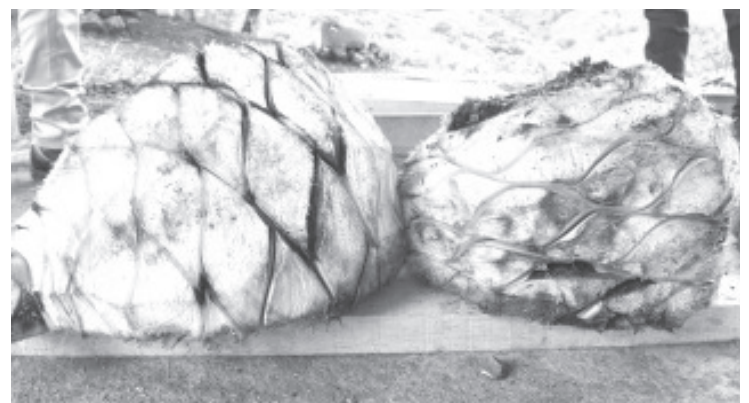
En la entidad, 29 municipios registran producción de mezcal; destacan por su volumen Madero, con el 80 por ciento del total, seguido por Morelia, Indaparapeo, Tzitzio y Charo, entre los principales.

También está el añejo, que se deja reposar por más de un año en barrica de madera; el destilado al que se le agrega algún ingrediente dentro del proceso de destilación, como pechuga de pavo, nueces, hierbas o partes de otros animales como venado o iguana; el avocado al que se agrega un ingrediente adicional como zarzamora, arándano, coco o café, entre otros.