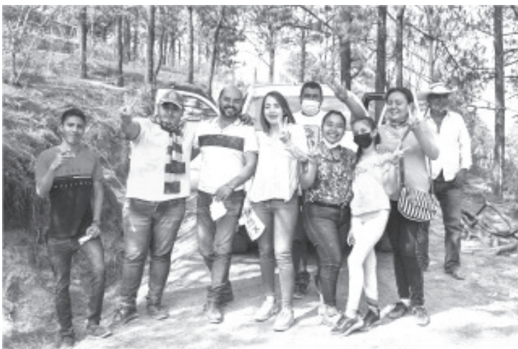
“Yo conozco el municipio y sé qué necesidades tienen en cada región y, créanme, no les voy a fallar, vamos a seguir gestionando recursos para que el municipio siga creciendo”.

candidatos a diputados federales y locales. ¡Por amor a Tuzantla, en la Dirección Correcta!