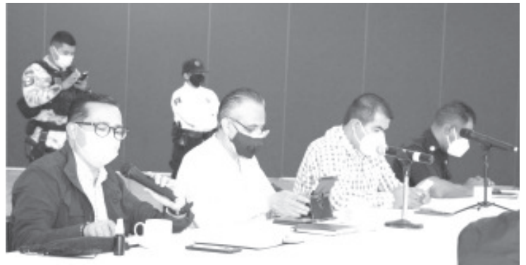
Tras recibir la solicitud de apertura del Parque de la Estación, este seguirá con sus puertas cerradas con la finalidad de evitar brotes de contagio entre los menores de edad.

Finalmente, el comité solicitó que el próximo martes se integre personal del INE y del IEM a la mesa de salud, para que informe sobre las medidas sanitarias que se están tomando en relación a las campañas políticas, y para que asuman su responsabilidad como órgano regulador en las mismas.