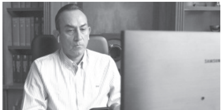
Toño: Esta manera de hacer política ha dejado bajos niveles de eficacia, promoviendo el debilitamiento institucional, el estancamiento económico y ha hundido al país en el subdesarrollo.

Además, en otra decisión sin precedente, dijo, el INE previno la creación de mayorías artificiales en la Cámara de Diputados al hacer valer el límite de 8 por ciento a la sobrerepresentación que establece el artículo 54 de la Constitución.