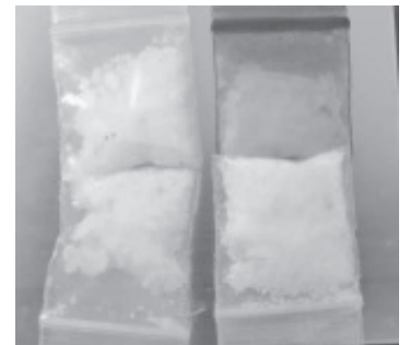
Sobre la avenida Morelia agentes de la SSP detuvieron a un sujeto con varios sobres con metanfetamina.

En caso de emergencia, a través de las líneas 911 y 089 se brinda apoyo las 24 horas del día.