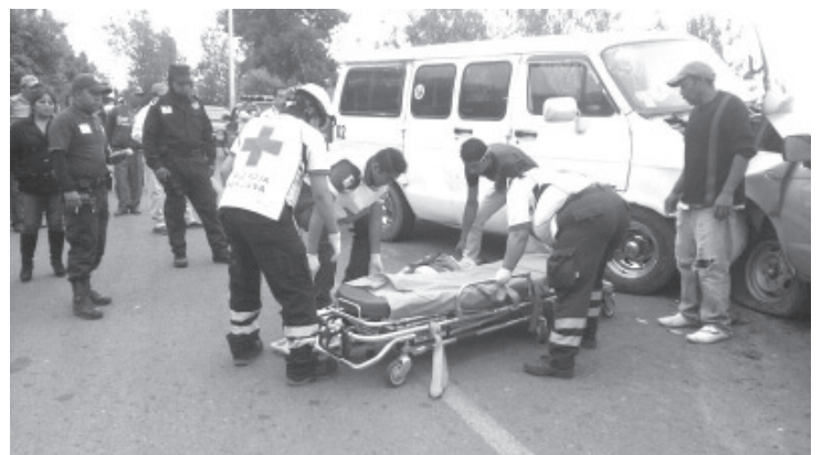
En la capital michoacana se registraron 12 accidentes, 4 en Ziracuaretiro y 3 más en Cuitzeo, siendo los municipios con mayor número de casos.

En caso de emergencia, a través de las líneas 911 y 089 se brinda apoyo las 24 horas del día.