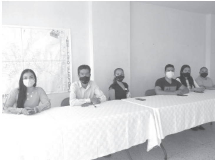
Se tuvo una buena cantidad de registros, mas de 200 personas han dejado su documentación, de ellas se elegirán a 7 supervisores y 46 capacitadores electorales.

“La importancia de estas figuras es vital para el desarrollo del proceso electoral, ya que serán quienes darán la cara ante los ciudadanos”, expresó.