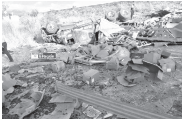
El chófer de un tractocamión perdió la vida presado por su pesada unidad, luego de que volcara sobre la carretera Zamora-La Piedad.

De las correspondientes investigaciones se hizo cargo el personal de la Fiscalía General del Estado de Michoacán, siendo trasladado el cadáver a las instalaciones del Servicio Médico Forense en espera de que sea identificado por sus deudos.