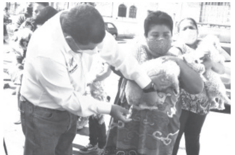
El año pasado la campaña se realizó del mes de agosto a diciembre y en total se aplicaron más de 7 mil dosis, lo que se traduce en una buena aceptación por parte de la población.

Como ya se había dispuesto, durante el desarrollo del programa, se visitarán lugares que no se visitaron el año pasado, las mascotas que ya se vacunaron, no recibirán la dosis, sino hasta el siguiente como reforzamiento. En esta campaña se van a enfocar con las mascotas que no han recibido el biológico.