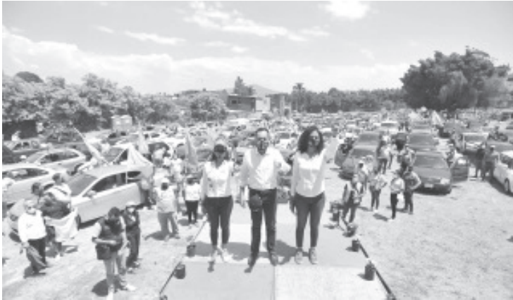
"Pudimos haber llenado estadios, pero somos seres humanos responsables, que estamos de lado de la ley. Hemos cumplido con lo que dicen los requisitos en todo momento".

*El candidato del Equipo por Michoacán destacó su interés de buscar un acercamiento con los ciudadanos, siempre acatando las medidas sanitarias.