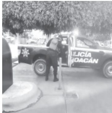
Se logró ubicar al menor en la Central de Autobuses de Zitácuaro, dijo haber recibido llamadas telefónicas donde le solicitaban ir a Zitácuaro, sin avisar.

La SSP exhorta a la ciudadanía a reportar toda conducta ilícita a las líneas de emergencias 911 o 089.