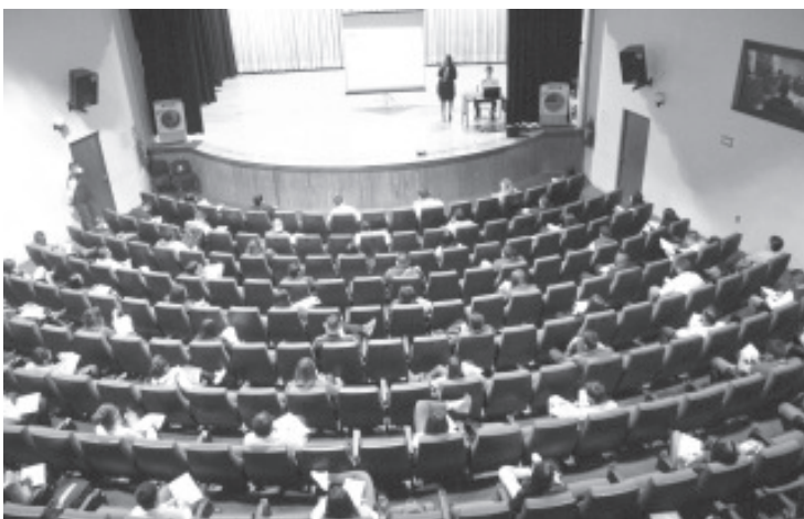
Esta capacitación será impartida de forma virtual a 90 aspirantes, quienes serán divididos en dos grupos, y que previamente cumplieron con los requisitos establecidos.

El programa académico contempla tres apartados: Formación Básica; Materias Complementarias; y Áreas de Desarrollo de Habilidades co-curriculares.