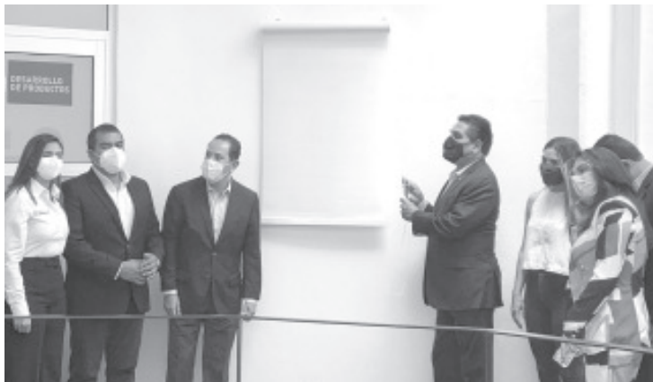
Silvano Aureoles Conejo, expuso que apoyos como los que ofrecerá este lugar permitirá hacer frente al miedo que tienen quienes quieren comenzar algo nuevo.