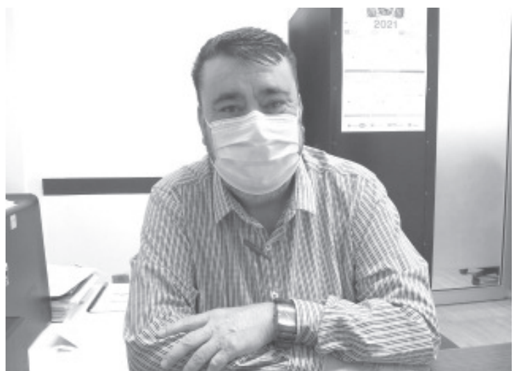
Durante el primer trimestre del año: enero, febrero y marzo, por ley se aplican una serie de descuentos para que el contribuyente se ponga al corriente, en abril se aplican recargos.

El horario en el que labora la dependencia, es de 8:00 de la mañana y a 3:30 de la tarde.