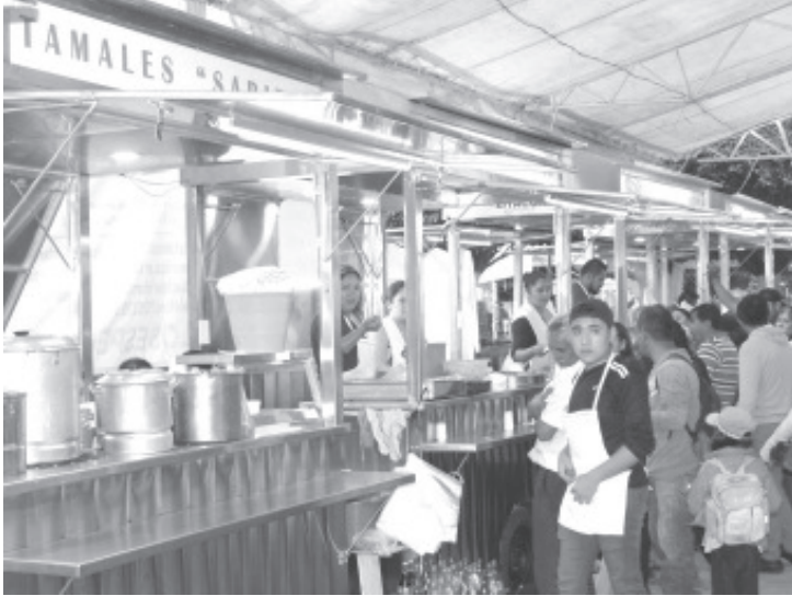
La población debe estar atenta de la sintomatología, como es la pérdida del olfato, fiebre, diarrea, dolores articulares y oxigenación, para que, en caso de alguno de éstos, acuda a realizarse la prueba en la inmediatez posible.

Zitácuaro, Mich., 6 de abril del 2021.- Durante la sesión ordinaria semanal, los integrantes del Comité Municipal de Seguridad en Salud, informaron que los días jueves, viernes y sábado de la Semana Santa se registraron más de 150 mil asistentes en el primer cuadro de la ciudad, además de la escasa atención a quedarse en casa y no visitar centros vacacionales, por lo que advirtieron, que la tercera ola de contagios pudiera iniciar en la segunda semana de abril.