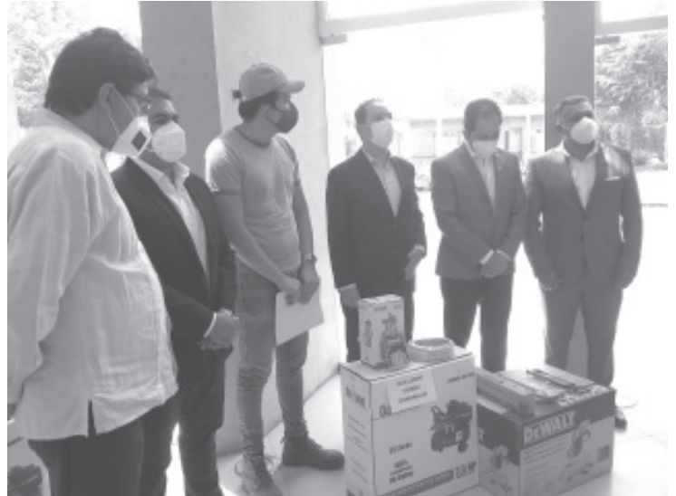
Desde 2016, un total de 150 microempresas de Zitácuaro han recibido beneficios de este programa. La inversión ha sido cercana a los 2 millones 600 mil pesos.

Vargas Ortega, precisó que por el tema, el INE no está facultado para sancionar a quienes no acaten estas recomendaciones sanitarias, de esto estarán como responsables, el comité de salud o alguna autoridad local. En este sentido, convocó a candidatos a actuar de forma responsable y privilegiar el tema de la salud, ya que durante las campañas hay varios motivos de riesgo que su equipo debe tomar en cuenta y tomar las medidas adecuadas para reducir el peligro.