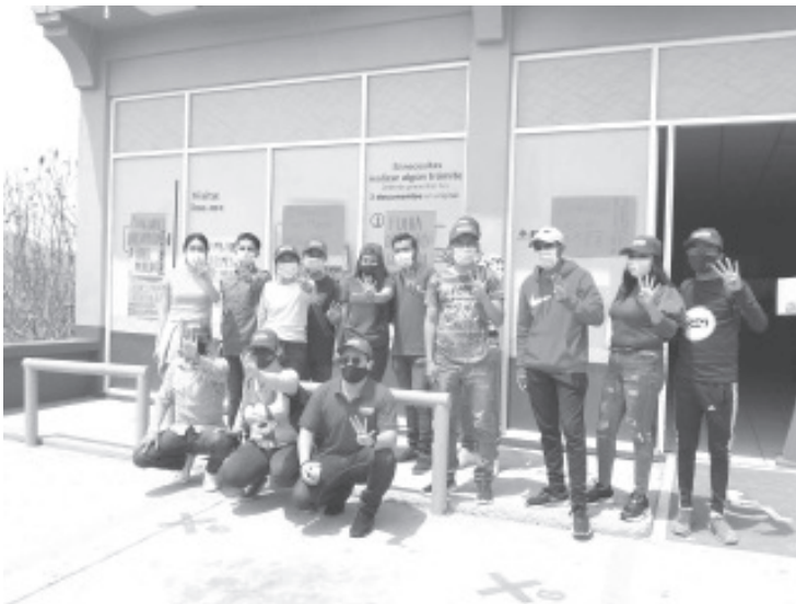
Unos 15 jóvenes llegaron frente a las oficinas del INE a bordo de una camioneta, y se postraron en el lugar con pancartas alusivas a sus demandas.

- Piden que se revoque la resolución del órgano electoral