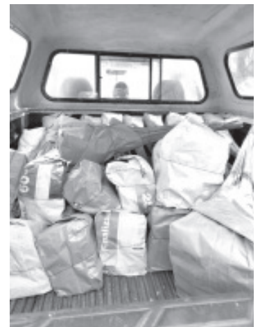
El detenido viajaba en una camioneta de la marca Chevrolet, misma en la que transportaba 10 paquetes, cada uno con 144 piezas de material explosivo.

La SSP hace un llamado a denunciar de manera inmediata todo acto que vulnere la seguridad de las y los michoacanos a la línea de emergencias 911.