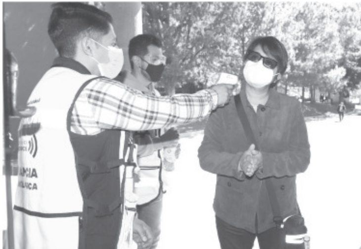
Son 20 los municipios en bandera Verde y Chilchota, Irimbo, Juárez, Tangamandapio y Tangancicuaro pasaron a Blanca, con los que suman 86 comunidades que tienen riesgo controlado de contagios.

La institución mantiene a disposición de la ciudadanía el número 800-123-2890 con 11 líneas para resolver todas sus dudas médicas, así como el micrositio bit.ly/MichCOVID-19, donde encontrará toda la información del padecimiento.