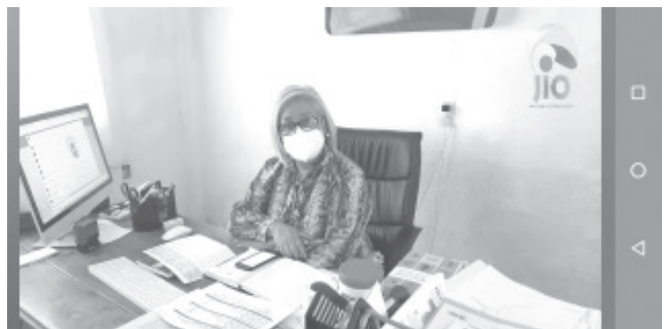
5 municipios de la región oriente se suman a la Jornada de Vacunación de Adultos Mayores contra el Covid 19: Ocampo, Jungapeo, Tuxpan, Juárez y Susupuato.

La funcionaria del gobierno federal, agregó que en el caso de adultos mayores que no hayan alcanzado a vacunarse en la primera jornada, se buscará gestionar una cantidad extra cuando se venga a Zitácuaro a aplicar la segunda dosis. Por lo tanto, pueden acercarse a los centros integradores a solicitarla para que sean tomados en cuenta, también se está trabajando para que esta vacuna llegue a médicos privados por ser un sector en riesgo