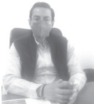
Quienes no recojan su credencial de elector, no aparecerán en la lista nominal y no podrán participar en las elecciones del 6 de junio próximo.

El funcionario del INE, resaltó que la idea de poner un plazo para la credencialización es tener un listado nominal definitivo, que es el que se utiliza el día de la jornada electoral.