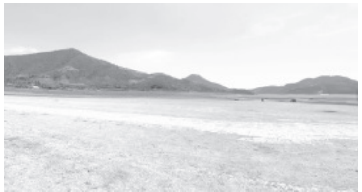
Desde el 2020, pescadores y habitantes de comunidades vecinas se mostraron preocupados por las pocas lluvias de la temporada, ya que tuvo una recuperación mínima.