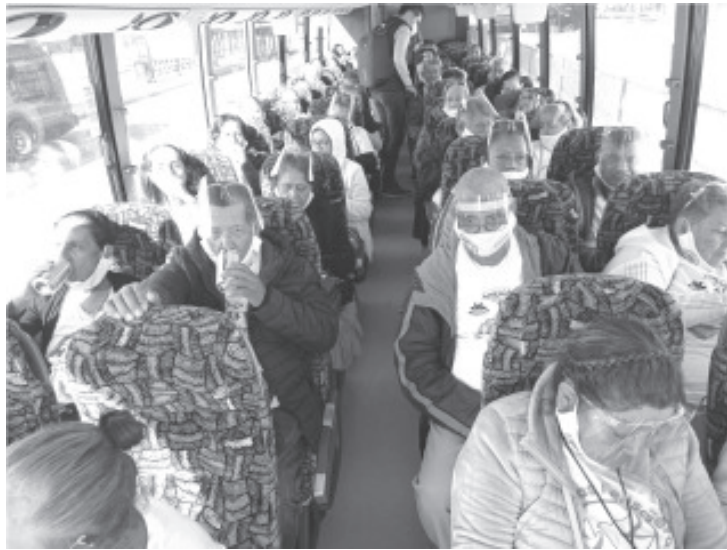
Existe un total de 1,286 Palomas Mensajeras de 26 municipios con cita ante la embajada de Estados Unidos en México, las cuales serán reprogramadas hasta nuevo aviso.

La celebración de la Noche de Muertos, degustación de platillos típicos, danza y música de mariachi enmarcaron los encuentros de las familias en California, Washington, Texas, Illinois, Georgia, Oregon, Carolina del