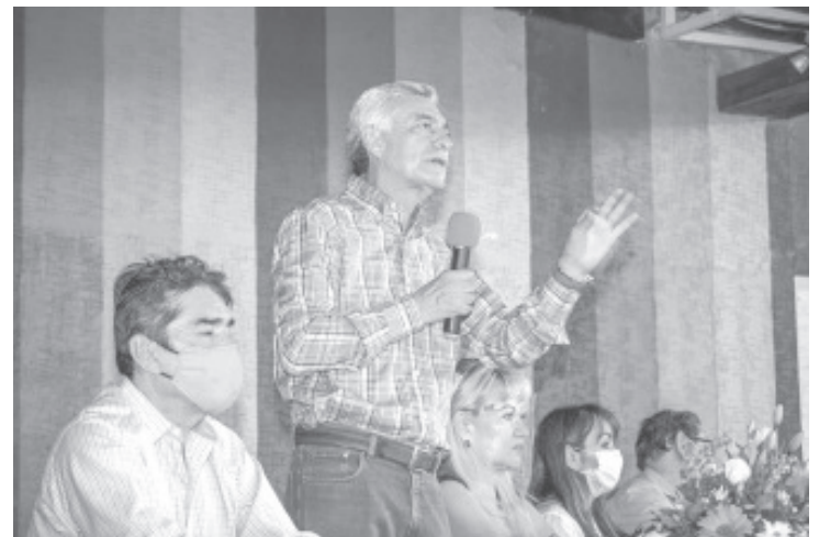
Es muy claro, si no se rindieron los informes financieros, se aplica la ley, se cancela el registro, se retira y entonces los partidos sancionados tendrán que postular nuevos candidatos.