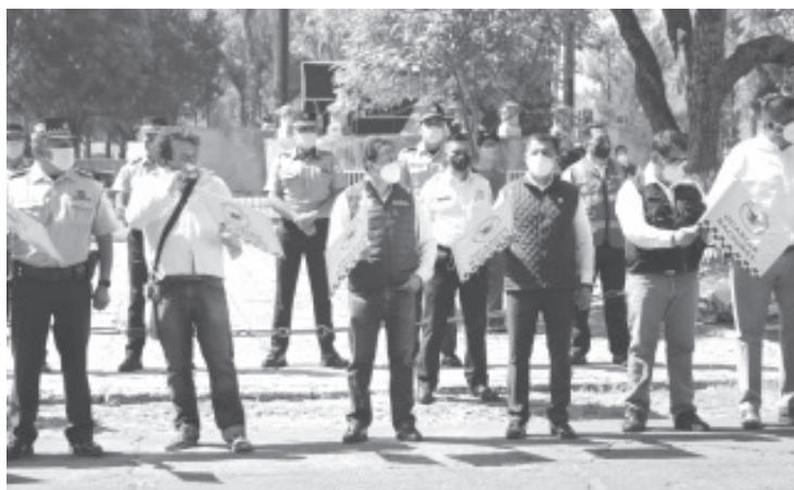
Con la intervención de la Unidad de Servicios Periciales se busca sensibilizar a la ciudadanía de los riesgos que se tienen al manejar en exceso de velocidad y manejar en estado de ebriedad.

En el simulacro participó personal de la Secretaría de Salud del Gobierno del Estado, Protección Civil del Ayuntamiento de Morelia, personal de la Guardia Nacional, Ejército Mexicano, Secretaría de Seguridad Pública y Cruz Roja.