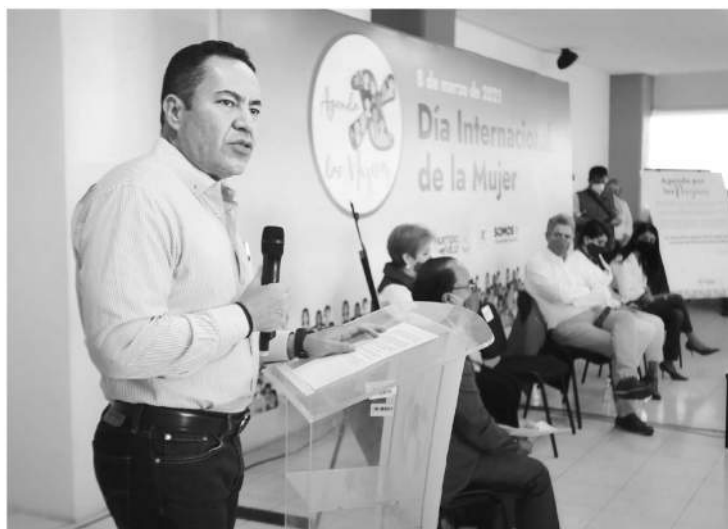
El coordinador de la Estructura tricolor afirmó que la prioridad debe ser tener una "cancha pareja" para hombres y mujeres en la búsqueda de una sociedad igualitaria.

El coordinador priísta manifestó que dentro de la agenda del Equipo por Michoacán el tema de la igualdad de género es una prioridad por lo que manifestó que seguirán impulsado el empoderamiento de las mujeres.