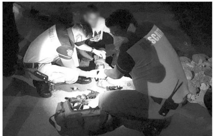
Un joven resultó lesionado luego de que fuera atacado a balazos en los momentos que viajaba a bordo de su bicicleta, recibió una herida en un pie.

En cuestión de minutos arribó el personal de la Fiscalía General del Estado el cual se entrevistó con el afectado e integró la carpeta de investigación respectiva, así mismo en la zona se realizaron varios patrullajes en busca de los agresores sin obtener resultados positivos.