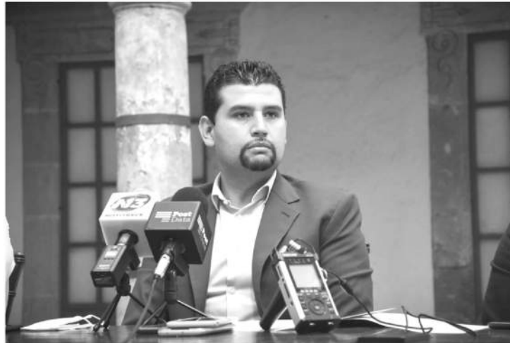
Se establece que el Parlamento Juvenil Incluyente se realizará en el mes de agosto, en donde el proponente resaltó la importancia de generar una sociedad de derechos.

En las adecuaciones al documento se estableció un porcentaje mínimo del 10 por ciento del total de los 40 espacios parlamentarios simbólicos para ser ocupados por personas con discapacidad, así como 50 por ciento de los mismos para mujeres y mínimo 10 por ciento para miembros de