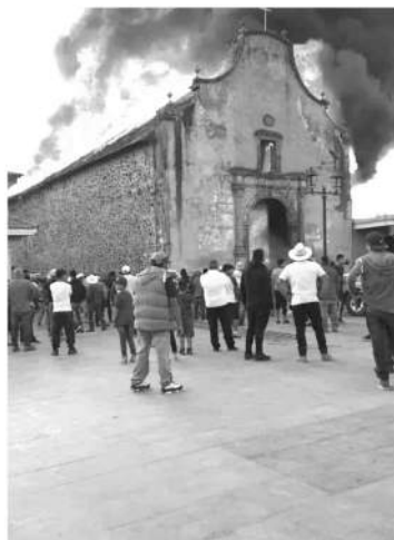
Las llamas y el humo negro se alzaron a varios metros y fue visible desde las poblaciones aledañas; el techo, construido a base de tejamanil, se consumió en pocos minutos.

Se trata de una construcción del siglo XVI, que tenía en su interior, imágenes y retablos, considerado patrimonio nacional, cultural y de identidad.