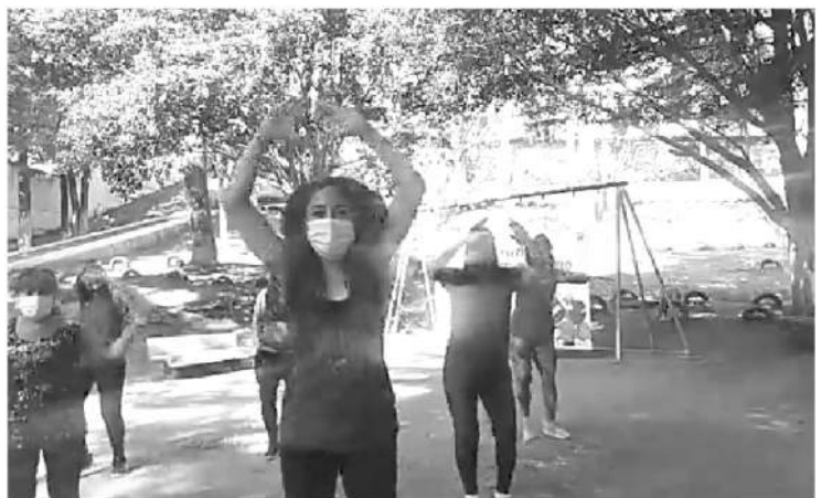
La activación física se realiza desde diferentes instalaciones deportivas con las que cuenta el municipio como la Unidad Deportiva La Joya, Siglo XXI, Pueblo Nuevo, y el Complejo Salesiano.

A quienes acuden a visitar los espacios deportivos, recordó que el uso del cubrebocas es obligatorio, también mantener la sana distancia y por el momento solo se permite la realización de actividades individuales como correr, caminar y trotar.