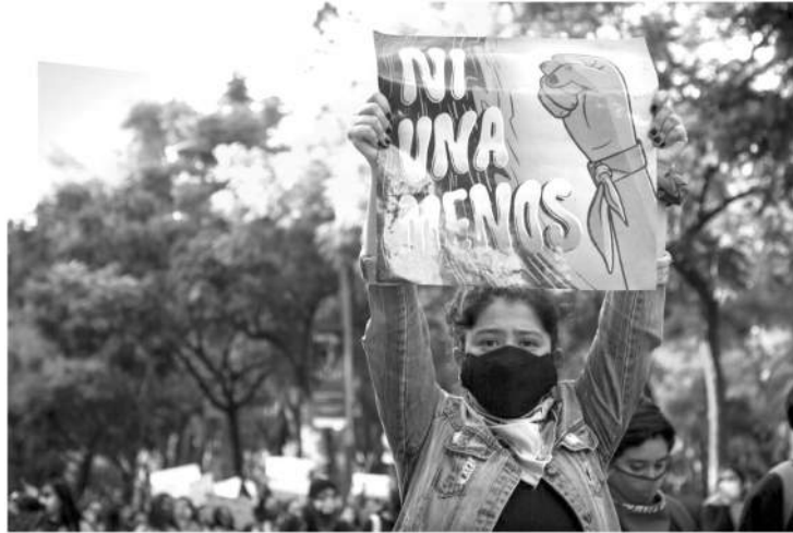
Es inaceptable que el Jefe de Estado confunda las denuncias de violencias de género con campañas partidistas negras o que deslegitime el movimiento feminista.

“Es inaceptable que el Jefe de Estado confunda las denuncias de violencias de género con campañas partidistas negras o que deslegitime el movimiento feminista, que