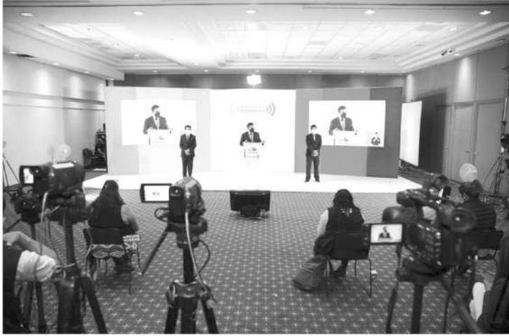
En charla con las y los representantes de los medios de comunicación, el mandatario señaló que un tercer rebrote impactaría fuertemente en la economía y en la salud de las y los michoacanos.

-A un año del primer anuncio sanitario por la pandemia del COVID-19, es necesario seguir acatando y aplicando las medidas de protección individual: Gobernador -El reto es que no se descomponga el buen manejo que hemos logrado, señala