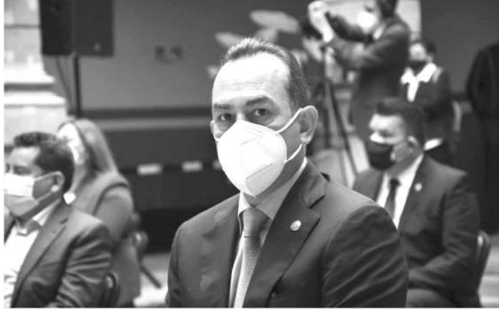
El diputado local celebró su iniciativa, ya que era una necesidad que, en todos los casos de cáncer de mama, se brinde la rehabilitación, y la atención psico-oncológica, y la reconstrucción y prótesis mamarías.

Asimismo en las reformas aprobadas este día se establece que el sector salud deberá