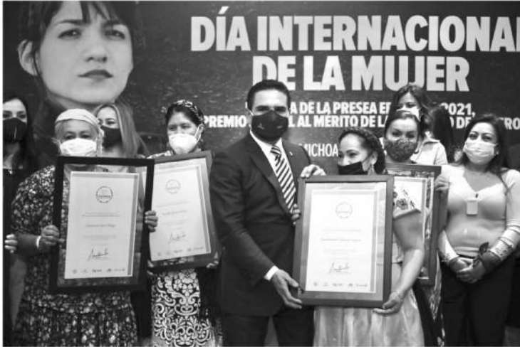
Como autoridad nos toca asumir y cumplir compromisos que pongan fin a la desigualdad, a la discriminación y a la violencia en contra de las mujeres.

-Entrega el Premio Estatal al Mérito de la Igualdad de Género, Presea Eréndira 2021 -Como autoridad nos toca asumir y cumplir compromisos que pongan fin a la desigualdad, a la discriminación y a la violencia en contra de las mujeres, señala