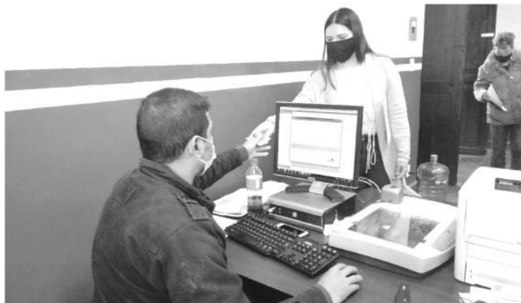
Las personas con licencia sin vencer, pero que quieran obtener la licencia permanente puedan solicitar la renovación anticipada, únicamente deberán presentar su licencia vigente y el monto para el pago.

-El costo de la licencia para conducir permanente es de dos mil pesos -Podrá solicitarse en los casos de renovación, reposición y por primera vez