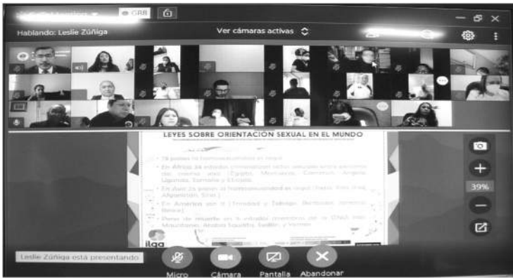
El Fiscal General ha instruido la promoción de acciones, como el taller “Relaciones Humanas y Respeto a los Derechos de las poblaciones LGBTTTI”, impartido en modalidad virtual a personal de las diversas áreas de la institución.

La Fiscalía General refrenda su compromiso de brindar atención especializada y profesional a las y los michoacanos.