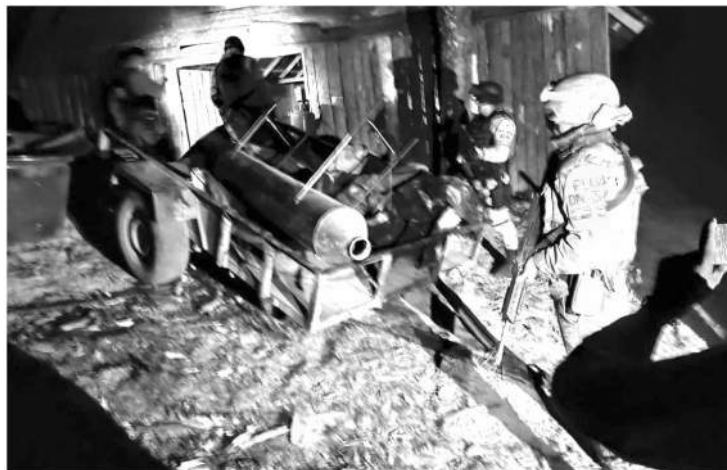
Los militares revisaron el inmueble y descubrieron un reactor metálico, un destilador, un tambor metálico con líquido en el interior, tres bidones, un rollo de manguera, 12 botes que contenían líquido.

En total, los uniformados aseguraron tres reactores, mil 810 litros de químicos desconocidos, 230 kilogramos de químicos, dos tanques de gas, una camioneta, un motociclo y un remolque. Todo lo descrito quedó a disposición de la autoridad correspondiente, la cual continuará con las diligencias respectivas.