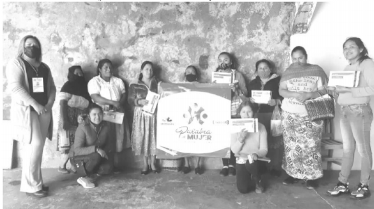
Las beneficiarias son originarias de Morelia, Huetamo, San Lucas, Tiquicheo, Zitácuaro, Salvador Escalante, Opopeo, Tacámbaro, Tarímbaro, San Lorenzo, Uruapan y Cuitzeo.

Hasta la fecha este programa sello del Gobierno del Estado ha entregado más de 180 mil créditos a mujeres de todos los municipios de Michoacán.