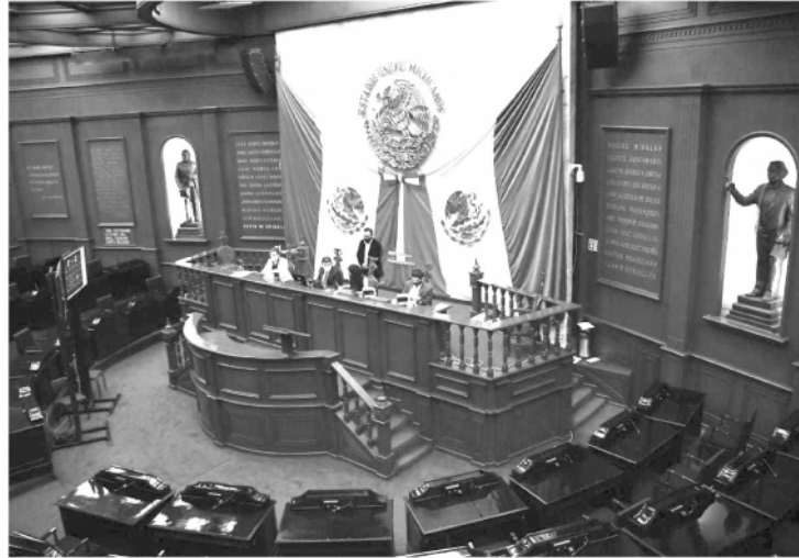
Para recibir esta prestación, deberá dársele prioridad a las y a los menores de 18 años, a las y los niños con cáncer, las y los indígenas y afromexicanos, hasta la edad de 64 años.

Así, la propuesta legal busca incorporar en la redacción del artículo 4