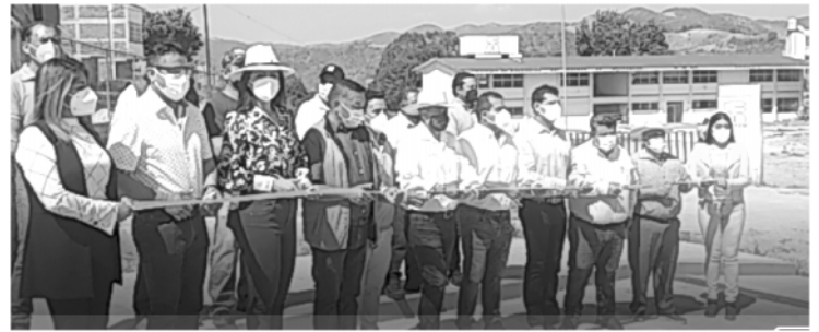
El alcalde recordó que en noviembre de 2019 lluvias atípicas azotaron la ciudad, esta zona fue la más afectada por inundaciones, incluso el agua entró a varios domicilios.