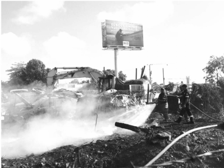
En el incendio de un pastizal, tres autos que se encontraban en el lugar también fueron alcanzados por las llamas, con pérdida total.

Aunque hubo daños materiales no se registraron pérdidas humanas que lamentar en el incendio.