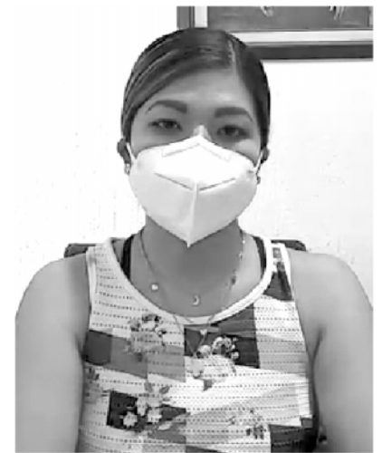
Se pretende entregar un reconocimiento a alrededor de 200 mujeres enfermeras y doctoras, así como trabajadoras que están en la primera línea de atención de Covid 19 en instituciones del sector salud.

“Si bien es cierto que no podemos realizar un evento masivo como años pasados, no queremos que esta fecha pase desapercibida para las mujeres, ya que representa una fecha fundamental para este sector que representa más de la mitad de la población total”, expresó.