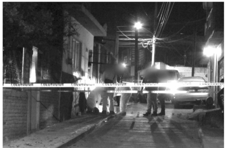
Los vecinos escucharon varias detonaciones de arma de fuego y las reportaron al número de emergencias 911, los policías municipales arribaron y hallaron al hombre sin vida.

Trascendió al exterior del hogar había al menos 20 casquillos percutidos. La identidad del difunto no fue expuesta, él tenía aproximadamente años de edad; los peritos criminalistas trasladaron el cadáver a la morgue para la práctica de la necropsia de rigor.