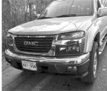
:Agentes de la SSP, detuvieron a una persona del sexo masculino, misma que cuenta con una orden de aprehensión por el delito de homicidio.

Ante toda acción ilícita, la SSP exhorta a la población a marcar a las líneas 911 y 089.