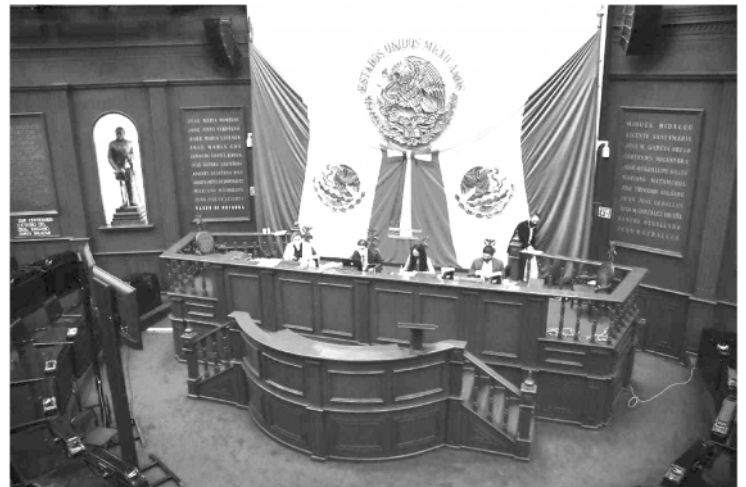
En el Congreso del Estado se recibieron las solicitudes de licencia para separarse por tiempo indefinido de su cargo de nueve diputados locales.

Posteriormente en la próxima sesión, el Pleno del Congreso del Estado analizará, discutirá y votará los dictámenes de las licencias de los legisladores locales antes mencionados y en caso de ser aprobados, las y los suplentes de quienes hoy solicitaron su licencia para separarse por tiempo indefinido de su encargo como legisladores, tomarán protesta como diputados y diputadas locales.