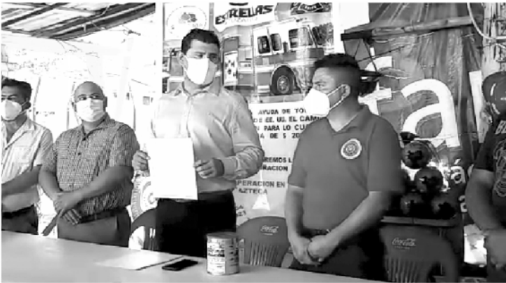
En la Base del Cuerpo de Bomberos, hizo entrega de literas y además un donativo de 20 mil pesos que servirán para traer el camión de Estados Unidos.

-A Bomberos entrega literas y 20 mil pesos para completar traslado del camión de EU.