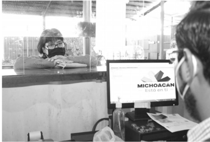
Los interesados deberán realizar previamente los exámenes médicos en instituciones públicas y el de manejo en la Secretaría de Seguridad Pública.

En la última reforma publicada en el Diario Oficial de la Federación, el primero de julio del 2020, en su Título decimotercero de nombre Falsedad, dentro de su artículo 243, especifica la pena por el delito de falsificación, indicando una condena con prisión de cuatro a ocho años y de doscientos a trescientos sesenta días de multa, tratándose de documentos públicos, entre otras especificaciones.