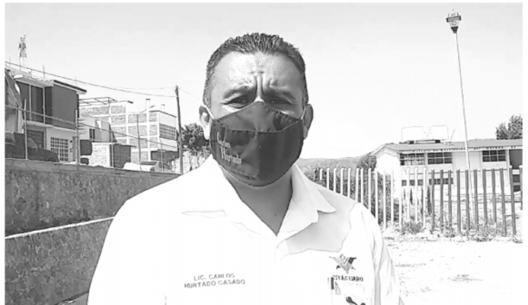
En el proceso electoral buscó encabezar la candidatura a la Diputación Local, por la conformación de la alianza del PRD, PRI y PAN, la designación le tocó al PRI y es para una mujer.