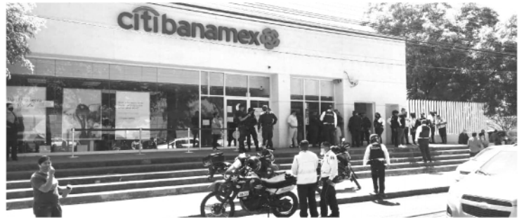
Los hampones sorprendieron a la víctima, la amagaron y la despojaron de un millón de pesos, tras obtener el botín, los sujetos huyeron rumbo a la avenida Ventura Puente.

La situación fue alertada a la Policía, de inmediato arribaron unos patrulleros, quienes realizaron recorridos en distintas áreas, pero no encontraron a los asaltantes.