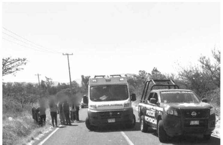
La mujer viajaba con su esposo a bordo de una moto Italika F150, pero en determinado momento el hombre perdió el control del vehículo y sucedió el accidente.

Los uniformados abanderaron el incidente y avisaron a la Fiscalía Regional, cuyos elementos realizaron las investigaciones respectivas y trasladaron el cadáver a la morgue para la práctica de la necropsia de rigor.