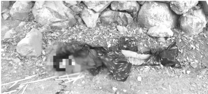
Un hombre que presenta signos de violencia, fue encontrado tirado envuelto con bolsas de plástico de color negro en la ciudad de Pátzcuaro.

El agraviado estaba envuelto en unas bolsas de plástico de color negro. Voces policíacas encionaron a esta agencia de noticias que se presume que el homicidio podría estar relacionado con los ajustes de cuentas entre bandas criminales antagónicas. La víctima vestía un pantalón de mezclilla de color azul, una sudadera gris con naranja y es de entre 25 y 30 años de edad.