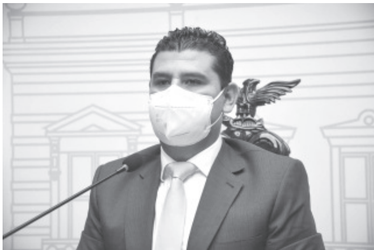
Es derecho fundamental de toda persona a estar protegida contra el hambre, de manera que el Estado adopte las medidas y programas concretos al respecto.

-Las autoridades estarán obligadas a velar por la distribución equitativa de los alimentos