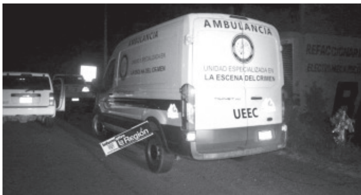
La policía encontró a unas personas que abandonaban restos humanos en las orillas de la carretera, a la altura de San Felipe de Los Alzati.