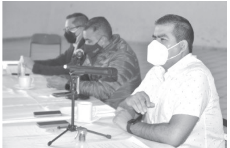
El horario de apertura de todos los comercios no esenciales es de lunes a sábado hasta las 8:00 Pm. y domingos hasta las 3:00 PM.

* Cabe señalar que la responsabilidad individual y continuar procurando evitar salir lo menor posible, así como la conciencia y el compromiso social con acatar las medidas, seguirán siendo la principal acción para combatir la pandemia.