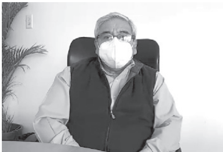
La temporada de estiaje es la más crítica para nosotros, pues los manantiales bajan sus niveles y al mismo tiempo por el clima se consume más agua por parte de la población.

Recalcó que es importante que los mismos ciudadanos cuiden el agua, que reporten a tiempo las fugas para que éstas puedan ser reparadas de inmediato.