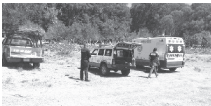
En un momento determinado el ciudadano cayó de la lancha en la que viajaba y al verlo que se sumergía sus compañeros trataron de ayudarlo.

De esta manera luego de hacer una minuciosa inspección en el lugar finalmente fue hallado el cuerpo sin vida del pescador, de quien las autoridades policíacas no revelaron sus generales. Los expertos de la Fiscalía General del Estado de Michoacán tomaron conocimiento del asunto y emprendieron las diligencias de ley.