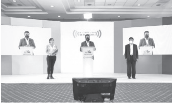
El reto es implementar una apertura gradual sin que nadie relaje medidas; con mucho esfuerzo logramos que la estrategia implementada en el Estado fuera exitosa, destaca.

-El reto es implementar una apertura gradual sin que nadie relaje medidas; con mucho esfuerzo logramos que la estrategia implementada en el Estado fuera exitosa, destaca -Uso de cubrebocas, lavado de manos y la sana distancia sigue siendo el pilar de la estrategia para contener los contagios