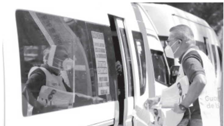
Después de varias semanas en Bandera Roja, por el alto índice de contagios, Morelia pasó a Bandera Amarilla, con 11 mil 950 casos confirmados, mil 147 defunciones y 297 activos.

Asimismo, mantiene a disposición de la ciudadanía la línea 800-123-2890, donde se brinda orientación sobre COVID-19 y acerca de las unidades médicas más cercanas capacidad resolutiva.