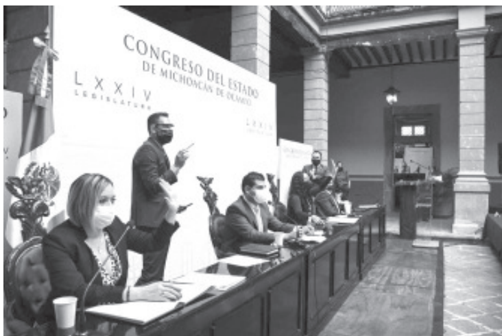
La licencia permanente para las modalidades de automovilista y motociclista particulares, con un costo de 2 mil pesos, deberán actualizarse cada 5 años con sus datos biométricos y de manera gratuita.

Finalmente la reforma establece que todo los contribuyentes que cuenten con licencia permanente deberán de actualizar cada cinco años de forma gratuita, sus datos biométricos, con la finalidad de que se encuentre vigente el padrón y el seguro que ampara la licencia.