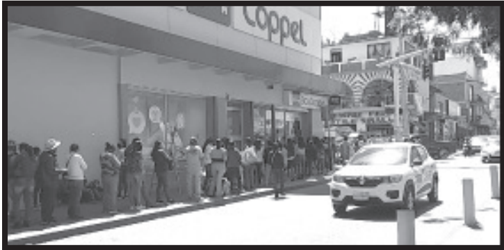
En diciembre y enero, Zitácuaro alcanzó los picos más altos en cuanto a contagios del Covid-19, de acuerdo a los reportes diarios, hubo días hasta con 6 fallecimientos.