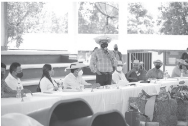
Inicia Gobernador trabajos para la construcción de la primera etapa de la calle Peregrinos y supervisa avance de la plaza principal y presidencia municipal.

-Entrega Gobernador 10 sementales a la Asociación Ganadera Local de Carácuaro -Inicia Gobernador trabajos para la construcción de la primera etapa de la calle Peregrinos y supervisa avance de la plaza principal y presidencia municipal