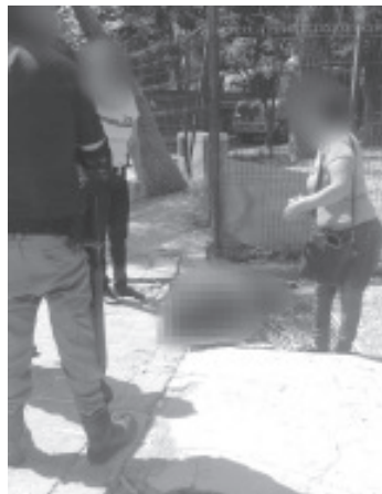
El peatón comenzó a sentirse mal y perdió el conocimiento. Unas personas pidieron ayuda, arribaron los paramédicos, pero el afectado ya no tenía signos vitales.

Información obtenida en la labor noticiosa reveló que el peatón comenzó a sentirse mal y en determinado momento perdió el conocimiento. Unas personas pidieron ayuda, después arribaron unos paramédicos, pero el afectado ya no tenía signos vitales.