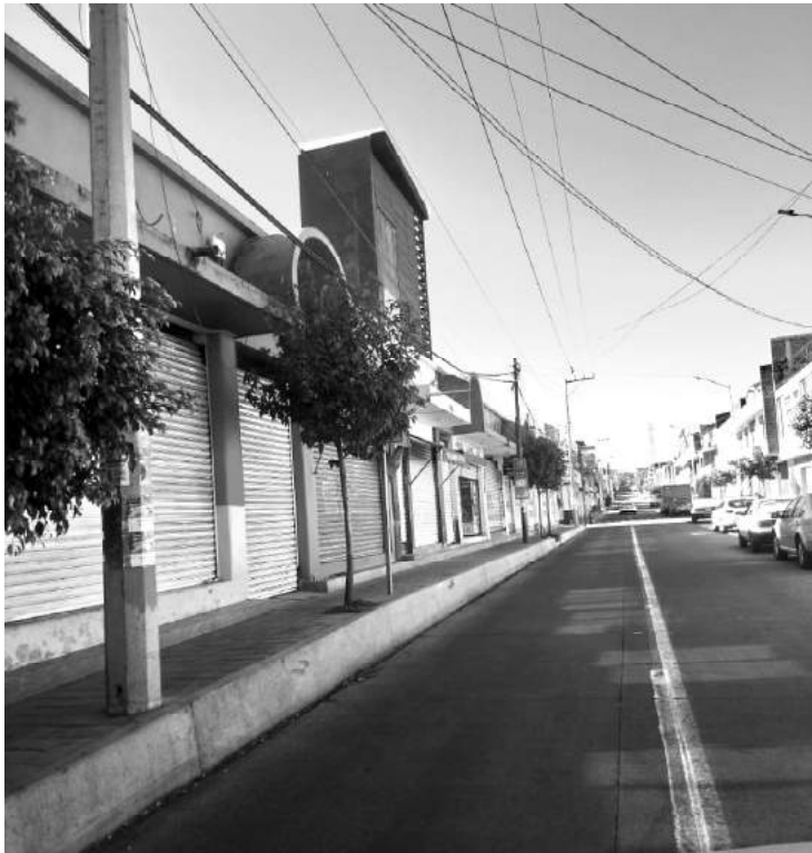
La siguiente semana podrían cambiar las medidas, de acuerdo a la información que instruya la autoridad estatal de salud, pronostica el ayuntamiento.

-Jueves, viernes y sábado continúa horario permitido hasta las 7:00 Pm -El martes que sesione el Comité Municipal de Seguridad en Salud, se emitirán nuevas disposiciones.