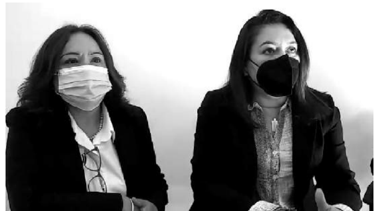
Este módulo será de gran ayuda para los trabajadores, ya que no tendrán que acudir hasta la ciudad de Morelia y hacer gastos innecesarios.