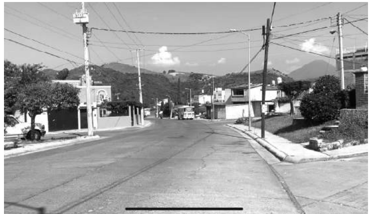
Vecinos del fraccionamiento FOVISSSTE se organizan para cortar la racha de contagios del COVID 19, sanitizarán las áreas comunes.

Se recordará que hace muchos años, los colonos, obligadamente se regían por la PRODEC, (Promotora de Desarrollo Comunitario), cuya directiva también la integraban los representantes de cada manzana, existía un reglamento que regularizaba el aseo público y recolección de basura, agua potable, alumbrado y vigilancia, para pagar esta, cada dueño de vivienda aportaba una cuota mensual, existía una buena organización, que al paso de los años desapareció. La PRODEC, estaba coordinada por la FSTSE, (Federación de Sindicatos de Trabajadores al Servicio del Estado).