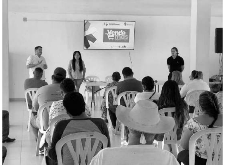
Con Vende Más, la Sedeco busca promover el desarrollo económico a través de apoyos integrales que constan de: capacitación, consultoría, remozamiento y equipamiento productivo