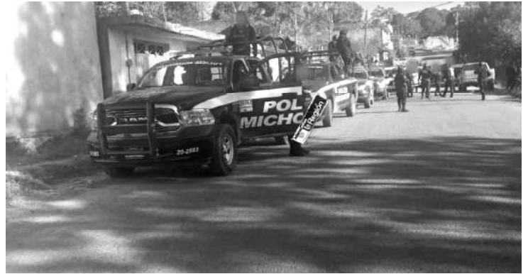
Los oficiales realizan recorridos a pie tierra en brechas, y mantienen puestos de revisión en puntos estratégicos a fin de prevenir, detectar y combatir actividades ilícitas.

La SSP hace un llamado a las y los michoacanos a reportar todo acto que vulnere la tranquilidad de la población a la línea de emergencia 911, la cual, se mantiene en operación las 24 horas del día.