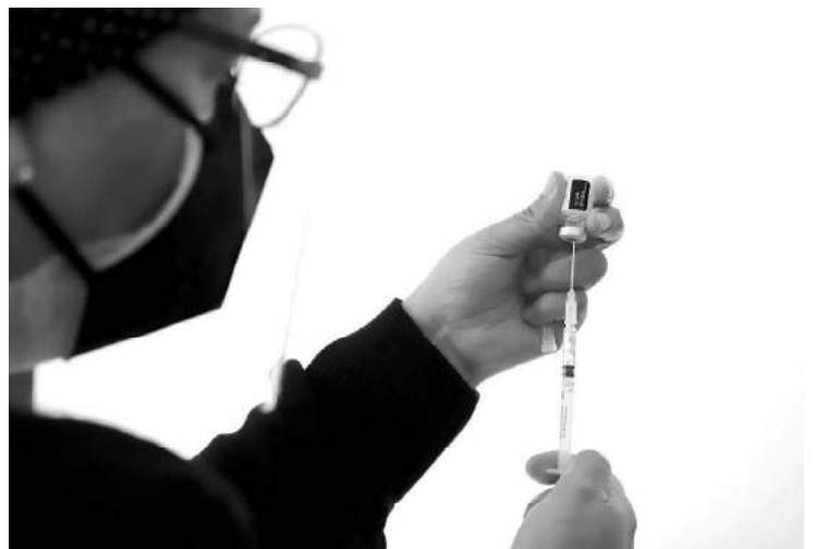
La alerta emitida por la Federación la vacuna contra el virus SARS-CoV-2 BNT162B2 Pfizer/Biontech es apócrifa, situación que pone en peligro la salud de la población.

La aplicación de la vacuna preventiva contra COVID-19 es gratuita y solo se aplica de acuerdo con la Política Nacional de Vacunación contra el Virus, establecida por la Secretaría de Salud. Se puede obtener mayor información en la página de internet www.coronavirus.gob.mx .