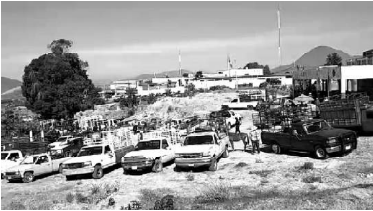
Desde que se instala el tianguis ganadero, se ha convertido en la mejor oportunidad que tienen ganaderos de vender al contado cabezas de ganado o aves.

- Este jueves retomó actividades pero descansará las siguientes dos semanas