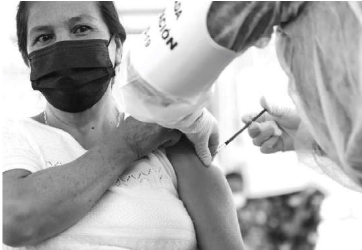
Después de la aplicación, la SSM recomienda identificar la vacuna que recibieron, marcar en un calendario la fecha de la segunda dosis, no dejar de utilizar el cubrebocas, cubriendo perfectamente boca y nariz

-Ciudadanos deben brindar toda la información médica necesaria para un buen proceso