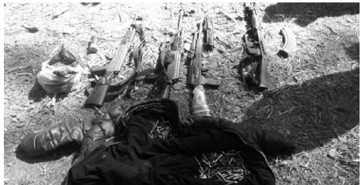
Tras repeler el ataque, se logró el aseguramiento de 3 personas, y se ubicó el cuerpo de una persona fallecida, posiblemente relacionada en el hecho.

En dicha zona se mantiene el despliegue de labores preventivas para preservar el orden y la tranquilidad de la población.