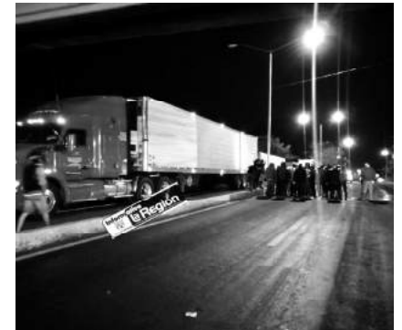
Una turba lo persiguió por varias calles y le dio alcance y lo golpearon y pretendían lincharlo, pero llegaron los elementos de Seguridad Pública y se lo llevaron .

A raíz de lo anterior y con la preocupación de que sea liberado, los vecinos se organizaron para bloquear el Boulevard Industrial como señal de protesta para exigir que todo el peso de la justicia caiga sobre el presunto abusador. Los manifestantes también solicitaron reunirse con las autoridades de la Fiscalía Regional de Uruapan para que el caso no quede impune.