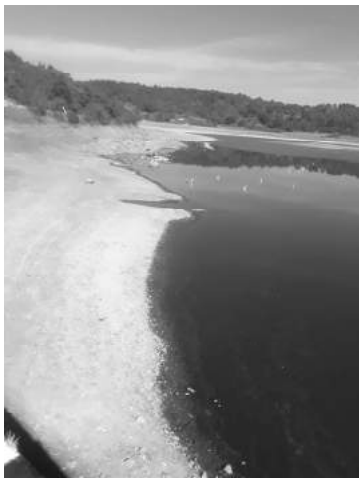
El aumento de plantación de aguacate que se ha venido dando, muchos productores agarran de ese canal para regar sus árboles y este año no la administraron bien, eso afecta los cultivos de riego.

Finalmente, el 7° Estudio de Búsqueda de Empleo por Internet en México destaca la manera en la que se llevan a cabo los procesos de contratación en nuestro país; en el año 2020 el promedio de contratación fue de una semana y WhatsApp destacó como el canal social de preferencia por la practicidad e inmediatez que ofrece.