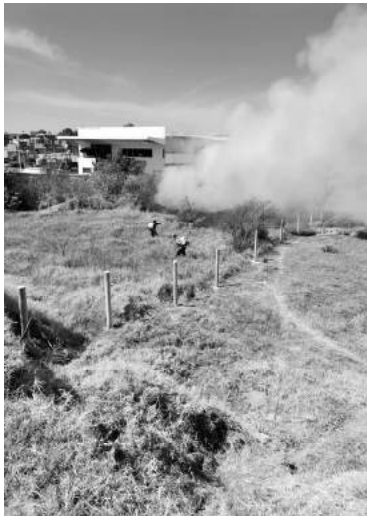
El más grave fue el que se suscitó este jueves a un costado del libramiento Suprema Junta Nacional Americana, pues fue más de una hectárea la afectada y peligraban varias viviendas.