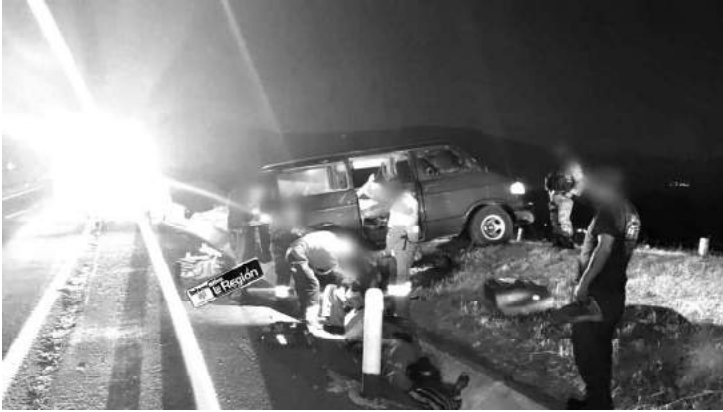
4 personas lesionadas cuando la camioneta en la que viajaban fue chocada por un vehículo desconocido, el cual huyó.

Los uniformados de la GN realizaron el peritaje correspondiente y después pidieron el apoyo de una grúa, la cual finalmente retiró el automotor perjudicado.