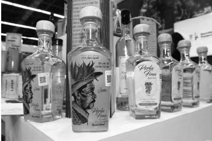
Las bebidas con denominación de origen en el estado de Michoacán, durante el 2021, cuentan con un subsidio del 100 por ciento en el cobro de este impuesto.

-Este impuesto durante el 2021 cuenta con un subsidio del 100 por ciento para las bebidas con denominación de origen en Michoacán -Los interesados podrán solicitar asesorías vía whatsapp de lunes a viernes de 9 a 17 horas