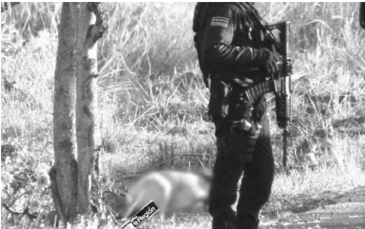
Se informó sobre el hallazgo de cinco cadáveres del sexo masculino, que a simple vista presentaron heridas producidas por arma de fuego, en una localidad de Zamora.

La FGE continúa realizando diligencias, a efecto de establecer las circunstancias en las que sucedieron los hechos.