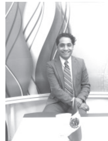
Se busca que dicha capacitación otorgue las herramientas de oralidad suficientes para colocar entre los primeros lugares del certamen 2021, a las representantes del Estado de Michoacán,