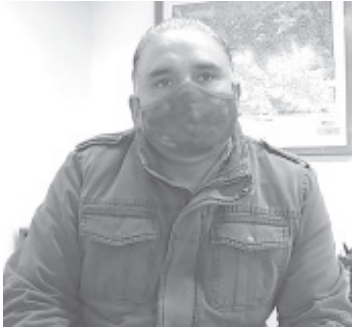
Se pretende que en los siguientes días estén listas la que corresponde a la Reserva de la Biosfera, así como la de la Comisión Forestal de Michoacán y de la Comisión Nacional Forestal.

- Autoridades estiman que temporada será crítica