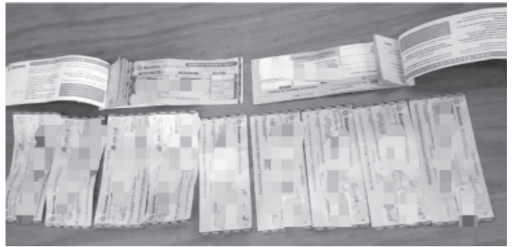
Elementos detuvieron a un hombre, quien se llevaba 10 cheques sin fondos que en total sumaban la cantidad de 92 mil pesos, así como una sustancia granulada, al parecer metanfetamina.

La SSP hace un llamado a denunciar a las líneas de emergencias 911 y 089 cualquier acto que atente en contra de la seguridad de las y los michoacanos.