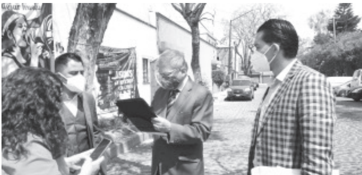
El Sindicato Único de Trabajadores de Notimex denuncia que hoy fue víctima de un ataque coordinado en sus cuatro campamentos, con el ánimo de romper el derecho de huelga y amedrentar a sus agremiados.

Asimismo, en seguimiento a las demandas presentadas durante más de un año de resistencia, interpusimos nuevas cartas a la Comisión Interamericana de Derechos Humanos (CIDH) y a la Organización Internacional de Trabajo (OIT), con el objetivo de que se pronuncie sobre el conflicto laboral, debido a que la negativa de solución por parte de la Dirección General ha puesto en riesgo el derecho humano a la salud de las y los huelguistas.