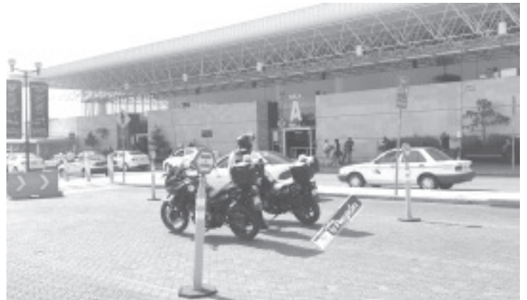
En la policía recibieron un reporte sobre unos adultos que se encontraban en la Terminal de Autobuses y viajaban con 6 menores con quienes, presuntamente, no tenían parentesco.

“A través de una acción coordinada con la @Policia_Morelia, se atendió el reporte y se realizaron las actuaciones ante la autoridad correspondiente a fin de esclarecer los hechos y preservar la integridad de los menores”.