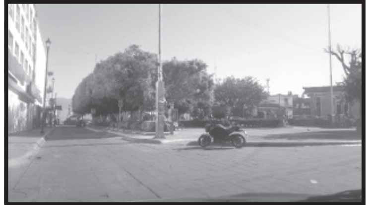
De acuerdo al informe de la SSP y de la Dirección de Ingresos Municipales, los comerciantes y prestadores de servicios, dieron nuevamente muestra de solidaridad y responsabilidad.