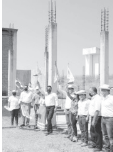
El mandatario estatal dio arranque a la construcción del Puente en Tziritzicuaro, a la terminación del Rastro Municipal, así como a la rehabilitación de los portales y vialidades del Centro.

En otro punto de la gira por el municipio, y luego de más de 60 años de que fueron ignorados por otros gobiernos a los que solicitaron la construcción de un puente vehicular, habitantes de la comunidad de