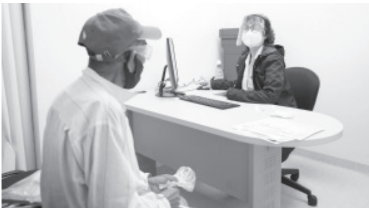
La institución recomienda a los hombres, a partir de los 40 años, realizarse periódicamente la prueba de antígeno prostático, debido a que el cáncer de próstata y testículo no se pueden prevenir.

Para la atención integral de pacientes con cáncer próstata y testículo, la SSM cuenta con una unidad médica acreditada, el Centro Estatal de Atención Oncológica (CEAO).