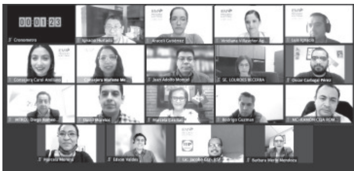
Quienes decidan ejercer el derecho a ser reelegidos en sus mismos cargos no estarán obligados a renunciar a los mismos, por lo cual, quienes decidan permanecer en su función no podrán dejar de acudir a las sesiones o reuniones,