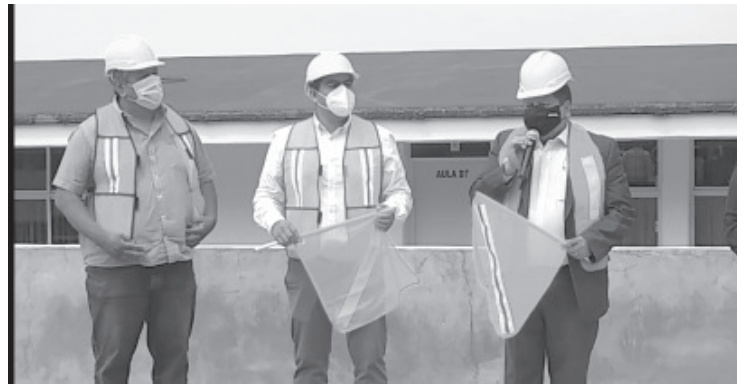
Las dos aulas estarán en la parte de arriba del edificio E, también el centro de cómputo se ampliará para mejorar la atención hacia los alumnos. El costo de la obra será de 760 mil pesos.

Reiteró su apoyo a esta casa de estudios y confió que con ajustes al presupuesto la cancha de basquetbol para la UPN unidad 164 será una realidad este mismo año.