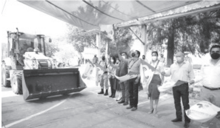
Se mejora la comunicación entre la localidad de Los Guajes y Rancho Viejo, lo que acorta los tiempos de transporte de productos agrícolas y ganaderos que se producen en la zona.

-Arranca la construcción de la techumbre y remodelación de la cancha de basquetbol de la Escuela Secundaria Vicente Guerrero; también entrega apoyos para el DIF Municipal