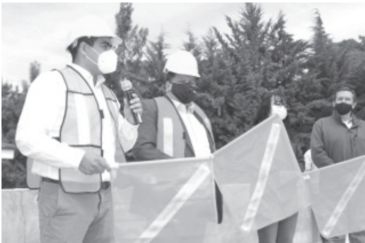
Preciso, al presidente municipal, que la construcción que inicia representa el gran esfuerzo y compromiso de las autoridades educativas por mejorar la calidad de su alumnado.

Por su parte, el director de la UPN reconoció la coordinación que existe entre la actual administración municipal y la institución que él dirige. Agradeció la visita del edil al banderazo de arranque de obras y solicitó al mandatario, la continuidad del respaldo de su administración para la universidad.