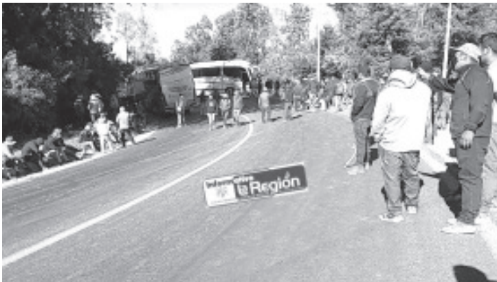
Una de las condiciones para esta segunda reunión, era que el Fiscal Regional acudiera con los comuneros para sostener otro encuentro, sin embargo nunca llegó.

La idea de los manifestantes es resistir el bloqueo durante varios días a fin de que esta vez, las autoridades de los tres niveles de gobierno, los tomen en serio y les den respuesta a sus demandas.