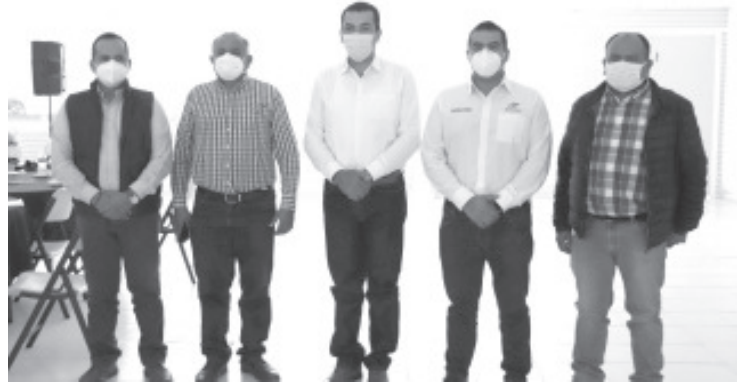
En Zitácuaro, aún están en espera más de 700 trabajadores de la salud de ser inyectados por formar parte de la primera línea. Finalizada esta etapa, seguirá la siguiente fase dirigida a adultos mayores