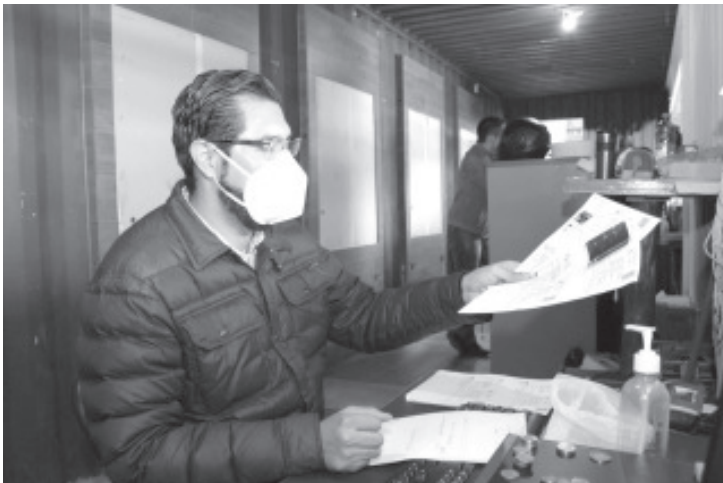
En Michoacán, la SFA continúa con los apoyos a la ciudadanía mediante programas como el Borrón y Cuenta Nueva 2021, mismo que tendrá vigencia del primero de enero al 30 de abril.

Para mayores informes respecto a medidas de prevención e información general sobre el COVID-19, la Administración Estatal pone a disposición de la población el número 800-123-2890, con 11 líneas para resolución de dudas, así como un microsítio donde encontrarán toda la información disponible sobre COVID-19, ingresando a la liga bit.ly/MichCOVID-19.