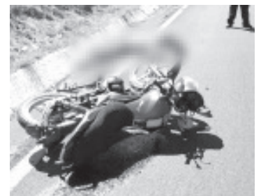
El desconocido tenía aproximadamente 45 años de edad, complejión media y piel blanca; vestía pantalón de mezclilla azul, chamarra negra, playera de franjas azules y blancas y zapatos deportivos.

Se apreció que la moto del finado es de la marca Italika 125, color azul, la cual no tenía matrícula de circulación. Oficiales de la Guardia Nacional (GN), adscritos a la