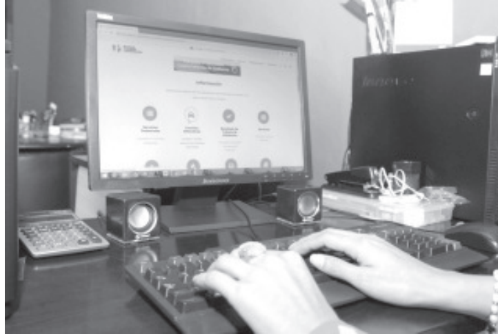
Para el pago en línea se debe ingresar a la página oficial de la dependencia en el menú Trámites Vehiculares, opción Consulte sus adeudos de tenencia y/o refrendo.

Finalmente se mostrará una pantalla, en la que se indicará a la o el contribuyente que el pago fue autorizado.