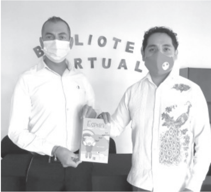
La obra resalta los valores cívicos y morales e invita a no discriminar e integrar a todas las personas para la mejor convivencia.

H. Zitácuaro Mich. a 12 de febrero de 2021.- Espokv, es el niño más tierno y simpático que se puedan imaginar, además es muy valiente. Lamentablemente se ha perdido porque se alejó de su hogar al buscar a su perrito. En su búsqueda, un día Espokv, llegó a un pueblito llamado Villa Arcoiris, muy colorido y lleno de alegría, con un gran río y enormes montañas verdes; cuando llovía, se formaban hermosos arcoíris que admiraban a todos. En ese pueblito conoció a tres simpáticas niñas, llamadas Mily, Aly y Saly, quienes a pesar de la apariencia de Espokv, lo quisieron conocer, y fue ahí donde comenzó una gran amistad. Tiempo después lo invitaron a cenar y le brindaron hospedaje, para que pudiera descansar y ducharse, Espokv, al igual que sus nuevas amigas, guardaba un secreto, que pronto compartirán. Sin embargo, una increíble sorpresa les espera a todos.