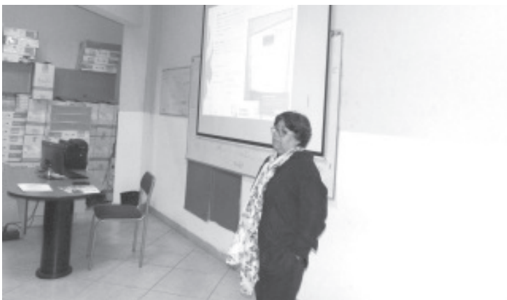
Los cursos son en las modalidades cuatrimestral y trimestral de manera virtual y en línea e iniciarán el 24 de febrero en la modalidad directa y el 29 del mismo mes en la sabatina.

Para mayor información, los interesados podrán consultar la convocatoria correspondiente que se encuentra publicada en el portal del IMCED, www.imced.edu.mx o bien puede ser visitada en www.facebook.com/CIIMCED