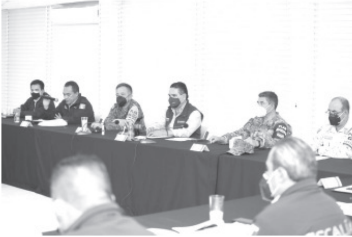
No se permitirá que grupos delictivos quieran ingresar al estado para explotar los recursos naturales y afectar la tranquilidad de la ciudadanía, destaca el Gobernador.

• No se permitirá que grupos delictivos quieran ingresar al estado para explotar los recursos naturales y afectar la tranquilidad de la ciudadanía, destaca el Gobernador