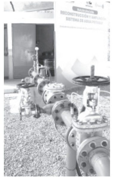
En los últimos cinco años, aproximadamente 318 mil residentes del oriente del estado han sido beneficiados con proyectos hidráulicos en la cabecera y tenencias, y otros municipios.

Para culminar ese círculo virtuoso en el que se logra sanear las aguas residuales y su reutilización en otras actividades, la CEAC edificó la planta tratadora de Tuzantla y en 2015 se sustituyeron equipos en la de Zitácuaro, para este año dar un paso más con la rehabilitación y construcción de un emisor en esta misma infraestructura.