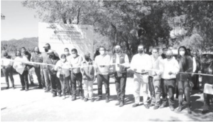
Carretera que conecta al panteón de la tenencia de San Felipe y calle de acceso al COBAEM en la colonia INFONAVIT, en la cabecera, fueron las obras inauguradas.

-Carretera que conecta al panteón de San Felipe y calle de acceso al COBAEM en la colonia INFONAVIT, fueron las obras inauguradas.