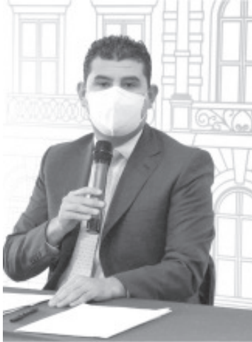
El marco legal aprobado en sesión del Congreso del Estado atiende las necesidades de los municipios, acorde a la realidad que en estos momentos se enfrentan.

-El diputado local celebró la aprobación de la Ley Orgánica Municipal del Estado de Michoacán, que integra tres de sus propuestas, entre las que destacan servicio civil de carrera y creación de instancias de la mujer en municipios.