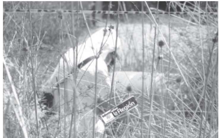
El macabro hallazgo se registro en la ranchería de Cuatro Ojos, a un costado de la carretera que conecta a El Carrizal con la cabecera municipal.

Los peritos y agentes de la Unidad de Servicios Periciales y Escena del Crimen se encargaron de efectuar las respectivas averiguaciones y de trasladar los huesos al Servicio Médico Forense de la región, siendo iniciada la correspondiente carpeta de investigación.