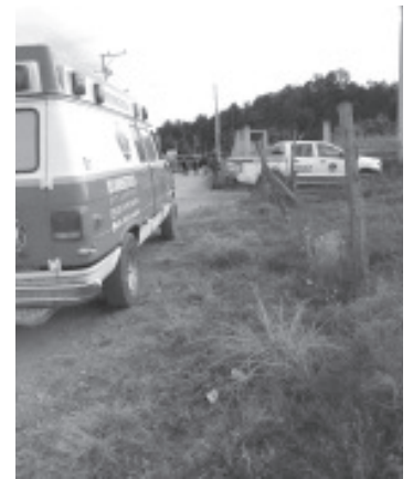
Personal de Bomberos, recibió el reporte sobre una persona herida a consecuencia de una agresión a balazos, pero al revisarla no presentaba signos vitales.

Del ahora finado se ignoran sus generales, así como el móvil del asesinato, a decir de las autoridades policiales. De las correspondientes averiguaciones se hicieron cargo los agentes y peritos de la Fiscalía General del Estado.