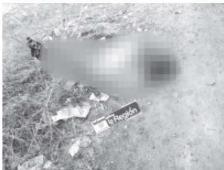
El cuerpo de un hombre sin vida fue encontrado en la colonia Aquiles Serdán, de Morelia, tenía cubierta la cabeza con una bolsa de plástico.

En el mencionado lugar se presentaron los elementos de la Unidad de Servicios Periciales y Escena del Crimen (USPEC), quienes iniciaron las investigaciones correspondientes y luego trasladaron el cadáver a la morgue para la práctica de la necropsia de rigor.