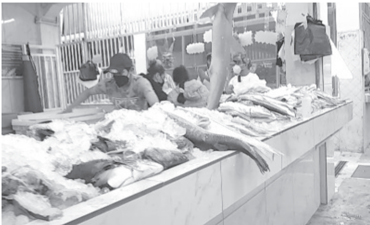
Una de las recomendaciones para los expendedores de pescado es que no lo descongelen, que lo hagan hasta su venta, y además el que se encuentra en el mostrador, tenga suficiente hielo.

Recordó que en años pasados se ha decomisado producto y se ha destruido por representar un peligro para la población