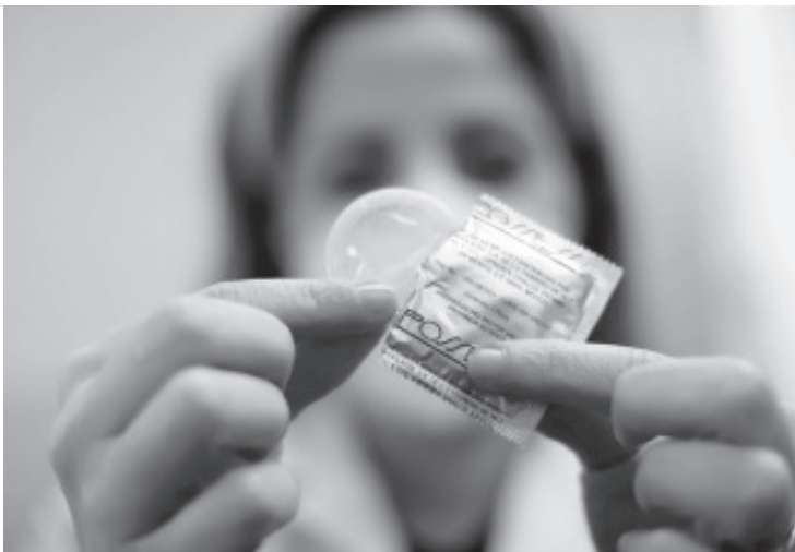
El condón protege de más de 30 virus, bacterias y parásitos que se transmiten por contacto sexual, de ellas la sífilis, gonorrea, clamidiasis y tricomoniasis son curables, pero para la hepatitis B, virus del herpes simple, VIH y virus del papiloma humano, no hay cura.

La SSM recomienda usar condón siempre que se tenga relaciones sexuales, para lo cual es importante comprobar la fecha de caducidad, cerciorarse que no tenga defectos o rupturas, guárdalo en un lugar fresco y seco, no en la cartera, ya que el calor y la fricción lo pueden dañar y no reutilizarlos.