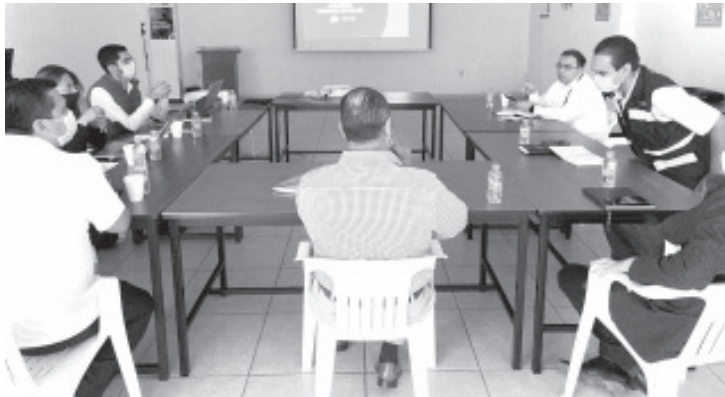
Los 364 centros de salud realizan la toma de muestras rápidas de antígeno o PCR, y el Centro de Inteligencia en Salud, que da seguimiento a los pacientes positivos a través de la aplicación Mi Salud.

Los 364 centros de salud de la SSM, operan bajo los protocolos nacionales e internacionales establecidos para garantizar seguridad tanto de personal y de pacientes que asisten a recibir atención.