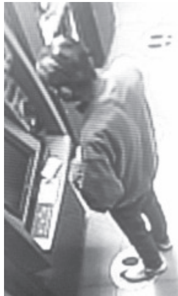
Los tipos insertan una "trampa" en los cajeros con el objetivo de apoderarse del dinero en efectivo de los cuentahabiente o clonan los plásticos.

Ante tal situación, las autoridades policiales implementaron un operativo para atrapar a los involucrados en los hechos ya descritos, pero hasta el momento no hay resultados positivos.