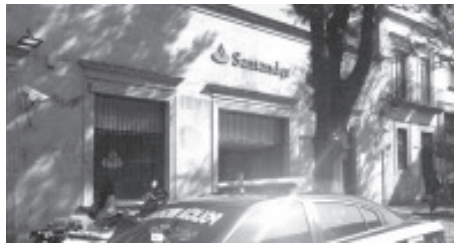
Los tres delincuentes huyeron llevándose un botín de aproximadamente 900 mil pesos, de tres cajeros.

Morelia, Mich.- Jueves 11 de febrero de 2021.- En una sucursal de Banco Santander, ubicada en el Centro Histórico de Morelia, se registró un robo con violencia y los perpetradores lograron escapar con rumbo incierto, hecho que ocurrió la mañana de este jueves, comentaron fuentes allegadas a las autoridades policiales.