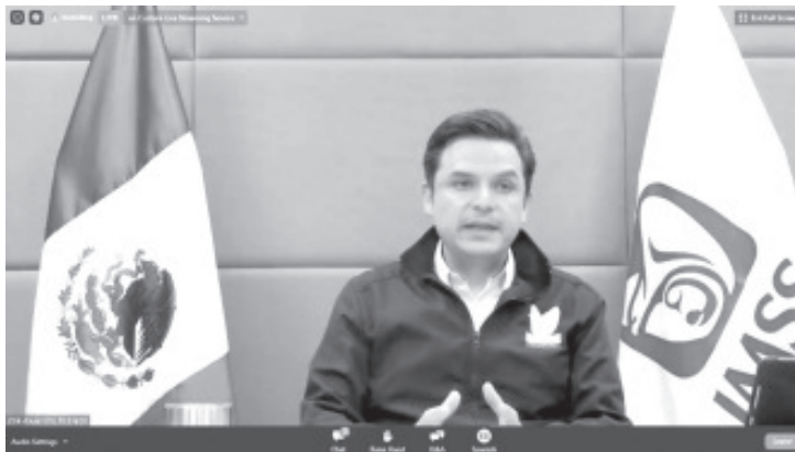
2019 el Instituto contaba con 463 camas para atender enfermedades respiratorias, y con la pandemia llegó a cerca de 19 mil destinadas exclusivamente al tema de COVID, de 32 mil camas que tiene el país

El director general del Seguro Social apuntó que dimensionar el desafío de la pandemia