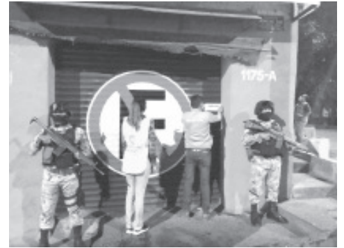
Del 1 de julio del 2020 al 7 de febrero del 2021, la Secretaría de Salud de Michoacán, a través de la Coepris, desplegó al personal verificador en 39 municipios prioritarios en la entidad.

Se mantiene a disposición de la ciudadanía el 800-123-2890 con 11 líneas para resolver todas sus dudas médicas, así como el microsítio bit.ly/MichCOVID-19, donde encontrará toda la información del padecimiento.