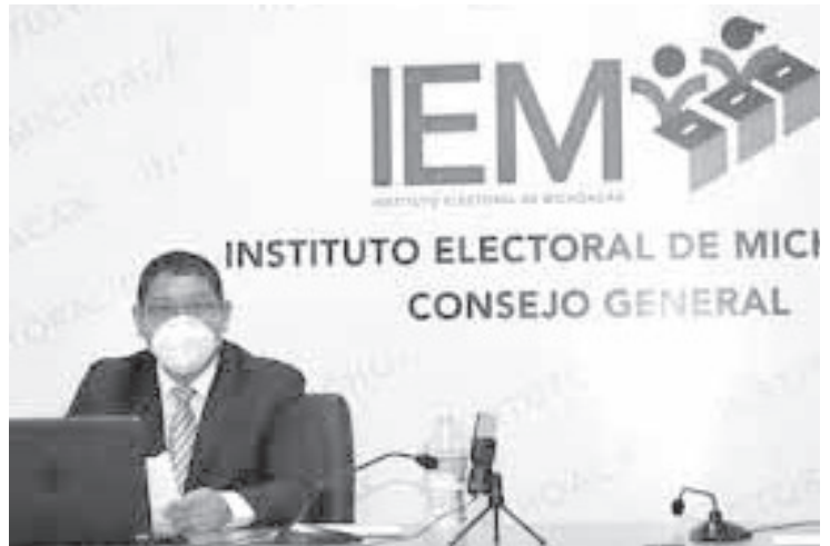
Los registros se han presentado desde el extranjero en la plataforma www.votoextranjero.mx , donde las y los ciudadanos michoacanos, tienen hasta el 10 de marzo para asentar sus datos en el sitio web.

Por lo anterior, se invita a la sociedad en general, en especial a las personas que cuenten con familiares o amistades que migraron a otro país por mejores condiciones de vida, para que les hagan saber que pueden ejercer su voto a la Gubernatura de Michoacán en el actual Proceso Electoral, ya que con la participación de todas y todos los sectores se aporta a la democracia del estado y del país. COVID-19.