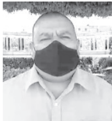
Hasta ahora, la mayor parte de los puntos vertidos en el encuentro tienen que ver con el tema de la seguridad, ésta ha sido una demanda de muchos años.

Como regidor encargado de atender el tema de las comunidades indígenas, aseguró que respaldará el sentir de la gente y en el pleno del cabildo defenderá las propuestas que sean necesarias. Reconoció que por años estas comunidades han sufrido de inseguridad y han sido olvidados, pero es momento de corregir la situación actual.