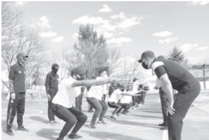
El IEESSPP dará inicio con las evaluaciones finales de la formación inicial que cursan actualmente 138 discentes y futuros funcionarios encargados de hacer cumplir la ley de Policía Michoacán.

Dominar las competencias es un requisito mínimo indispensable para los funcionarios, contemplada en el programa rector de profesionalización y en la ley General del Sistema Nacional de Seguridad Pública. Son: Acondicionamiento Físico y Uso de la Fuerza y Legítima Defensa; Armamento y Tiro Policial; Conducción de Vehículos Policiales; Detención y Conducción de Personas; Manejo de Bastón PR-24; Operación de Equipos de Radiocomunicación y Primer Respondiente.