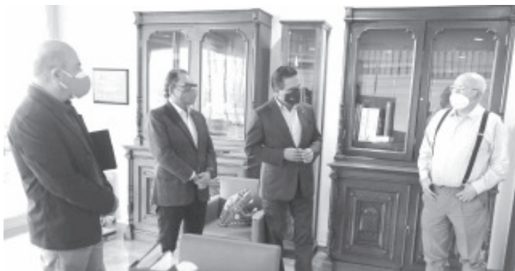
Aureoles Conejo mostró el interés general del Gobierno del Estado de dar seguimiento a la labor auditora y procesos de rendición de cuentas en el ejercicio de los recursos públicos.

-El Gobierno de Michoacán refrenda su disposición y voluntad para llevar a cabo procesos de rendición de cuentas, destaca Silvano Aureoles