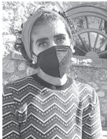
Con motivo de la pandemia del Covid-19, la subdirección de Cultura Municipal ha limitado todas sus actividades, actualmente se encuentran trabajando a puerta cerrada y a distancia.

Reiteró el llamado a la población a cuidarse, tomar en serio la emergencia sanitaria y acatar todas las disposiciones vigentes que la autoridad municipal ha dispuesto para bajar la ola de contagios.