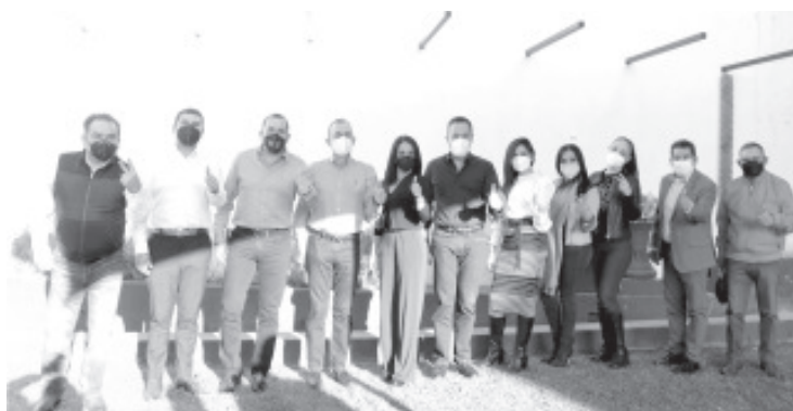
El encuentro realizado con los diputados locales busca construir una agenda común por el progreso de la entidad, la justicia y desarrollo de las y los michoacanos.

· El proyecto de Gobierno que enarbola la alianza "Equipo por Michoacán", es de todas y todos los ciudadanos, afirman legisladores perredistas