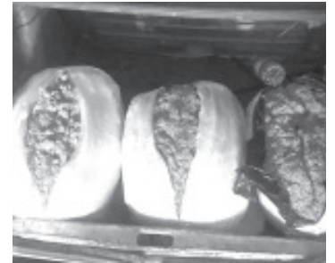
Durante el mes de enero el aseguramiento fue de 153 kilogramos de diversas drogas, 151 pastillas psicotrópicas y la destrucción de 16 mil 400 plantas de marihuana.

La SSP continúa con su tarea de inhibir todo hecho ilícito que ponga en riesgo el bienestar de las y los michoacanos, por lo que hace un exhorto a denunciar cualquier delito a las líneas de emergencias 911 y 089.