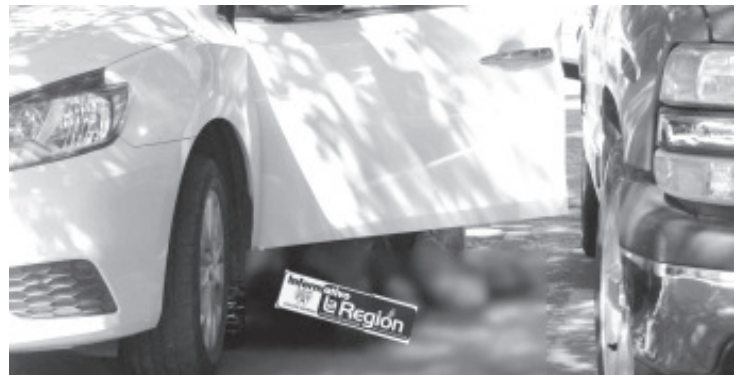
Fueron acribillados a balazos, dos personas cuando lavaban un auto, por sujetos desconocidos que al parecer se dieron a la fuga caminando.

La zona quedó bajo resguardo de un fuerte dispositivo de seguridad, mientras el personal de la Unidad de Servicios Periciales y Escena del Crimen se encargaba de recolectar todos los indicios y testimonios para integrar la investigación correspondiente.