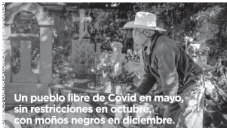
Un pueblo libre de Covid en mayo, sin restricciones en octubre, con moños negros en diciembre.