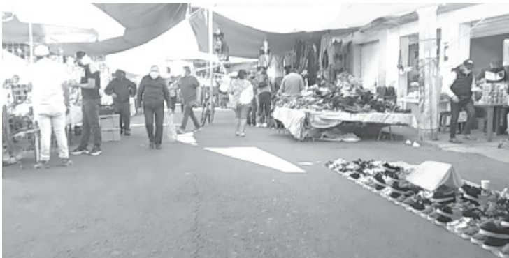
Esta ocasión se instalaron menos comerciantes, porque muchos que tienen miedo de contagiarse, inclusive hay algunas enfermas.