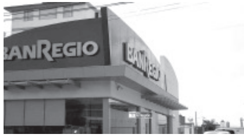
El asalto ocurrió la mañana de este viernes, en la avenida Camelinas, al menos tres sujetos, amagaron a los empleados y sustrajeron dinero, no se dijo que cantidad.

Al conseguir el botín, los hampones huyeron rápidamente con rumbo incierto. Por fortuna no hubo lesionados, solo algunas personas sufrieron crisis nerviosa y fueron atendidas por paramédicos.