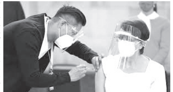
Entre los participantes se encuentran países de ingreso medio y alto “autofinanciados” que han aportado dinero y 93 países de ingresos bajos que esperan beneficiarse.

COVAX ha recaudado más de 6,000 millones de dólares de 8,000 millones necesarios para cubrir la adquisición y distribución a los países más pobres, incluido un compromiso de 4,000 millones del Congreso de Estados Unidos en diciembre. La Unión Europea y sus miembros dehan comprometido alrededor de 800 millones y Gran Bretaña ha agregado más de 700 millones de dólares, dijeron funcionarios de GAVI.