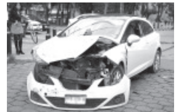
De acuerdo con el reporte, en el último mes del 2020, 87 personas perdieron la vida, en 12 de los cuales se encontró alcohol en el organismo, y en 19 presencia de alguna droga.

Las lesiones más frecuentes a las que están expuestos tanto el conductor como