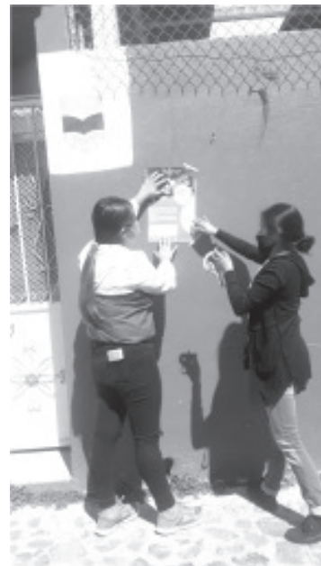
El CECyTEM, abrió su convocatoria para la entrega de fichas de nuevo ingreso para las y los jóvenes de nivel secundaria que deseen estudiar en las aulas del Colegio.

Este CEMSaD, forma parte de los 59 Centros de educación a distancia perteneciente al Colegio de Estudios Científicos y Tecnológicos del Estado de Michoacán (CECyTEM), los cuales se crearon con la visión de convertirse en espacios académicos de apoyo tecnológico, para impulsar el desarrollo de las regiones donde tienen presencia.