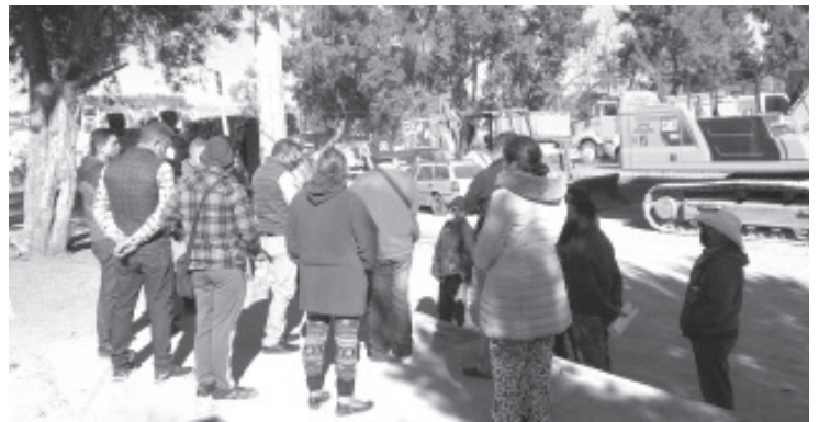
La molestia es que ampliarán la banqueta con lo que estarían invadiendo su propiedad y afectando su negocio o vivienda porque estarán tirando techos o bardas.

Agregó que sigue prohibida la participación en el tianguis de comerciantes de otros municipios y del Estado de México, se está privilegiando a los que son de Zitácuaro. Esto continuará porque muchas veces al haber personas de otros lugares aumenta el riesgo de contraer el virus del Covid-19.