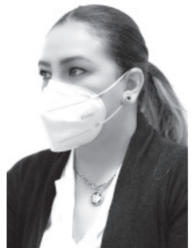
“Gracias a la atención oportuna y tratamiento gratuito que me brindaron en el Centro Estatal de Atención Oncológica (CEAO), me sumé a la lista de mujeres sobrevivientes de cáncer de mama”.

Al inicio de esta contingencia sanitaria por COVID-19, el cuidado a mi persona y mi salud ha sido más estricta, he reforzado mis medidas sanitarias tanto en casa como en mi trabajo lo que evita ponerme en riesgo, señala.