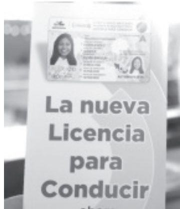
El examen médico, que conforma junto al de manejo uno de los requisitos primordiales para la expedición de la licencia para conducir, podrá realizarse en cualquier institución de salud.

dudas, así como un micrositio donde encontrarán toda la información disponible sobre COVID-19, ingresando a la liga bit.ly/MichCOVID-19.