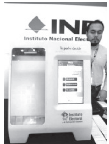
El nivel de confianza de la urna electrónica, indica que a 7 de cada 10 encuestados le generó mucha confianza, a un cuarto poca confianza y el 5.5% expresó que ninguna confianza.

Al cierre de la votación, las urnas cuentan automáticamente todos los votos sin