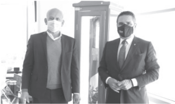
Es necesario que las personas, y los sectores vulnerables, tengan acceso a la vacuna contra el COVID-19 porque no queremos más pérdidas de vidas humanas”, dijo Silvano Aureoles.

-Gestiona Silvano Aureoles temas prioritarios como la gestión de recursos para 2021, garantía de medicamentos, basificación de trabajadores, Sustitución del Hospital de Lázaro Cárdenas, así como vacunación del personal de salud y población michoacana