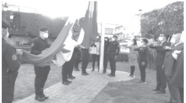
Autoridades municipales conmemoraron el 164 y 104 aniversario de la promulgación de las Constituciones Políticas de México de 1857 y 1917 respectivamente.

Cabe recordar que este año debido a la pandemia por COVID, fueron canceladas todas las demás actividades acostumbradas para conmemorar esta fecha. Seamos responsables, honremos a nuestra patria cuidándonos y cuidando a los demás.