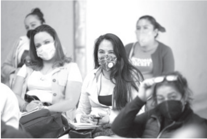
Las estancias infantiles tienen el propósito de ayudar a las madres de familia michoacanas que debido al recorte de recursos de la federación se quedaron sin este respaldo.

Uruapan, Michoacán, a 4 de febrero de 2021.- Este día la Secretaría de Desarrollo Social y Humano (Sedesoh) llevó a cabo una reunión informativa con representantes de