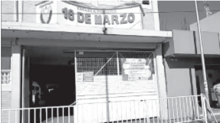
Las escuelas que tengan sobredemanda, las direcciones de estos espacios aplicarán criterios particulares para darle prioridad a hermanitos de quienes ya son sus alumnos.

- No debe haber contacto presencial, todo será virtual