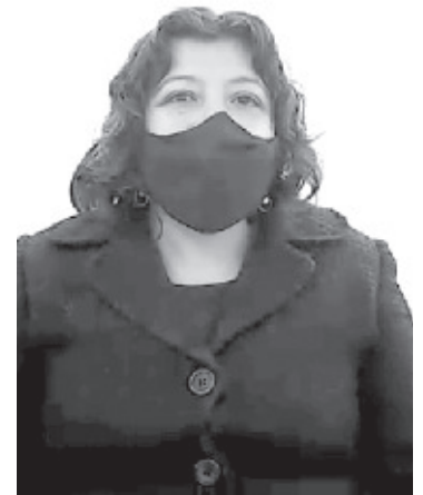
Serán 22 supervisores y 131 capacitadores, ambos serán responsables de tener contacto con los ciudadanos que participarán en las mesas directivas de casillas para recibir y contar el voto de los ciudadanos.

Agregó que la función de los supervisores y capacitadores será hacer recorrido en campo para notificar a los ciudadanos que participarán en las mesas directivas de casilla, también serán los responsables de capacitarlos.