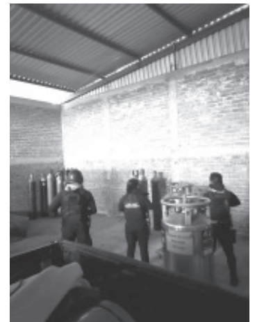
Personal de SSP y de la GN, lograron la recuperación de 25 cilindros de oxígeno medicinal con reporte de robo, durante las labores, el personal fue agredido por disparos de arma de fuego, sin que se registraran lesionados.

La Fiscalía General del Estado (FGE) fue alertada de la situación y sus agentes emprendieron las investigaciones correspondientes para esclarecer el hecho y atrapar al responsable.