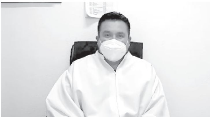
"El Día de la Candelaria es un día muy grande, de fiesta y mucha fe ante el Niño Dios, pero también queremos que las familias ya no sufran y haya menos muertes", expresó el parroco.

- La Iglesia Católica llama a feligreses a acatar recomendaciones y privilegiar la salud