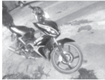
En esta motocicleta viajaban e intentaron huir, dos sujetos que trataron de robar en tienda de autoservicio de la calle Pueblita sur.

El procedimiento abreviado, es una forma de terminación anticipada del proceso, que consiste en el reconocimiento del imputado en su participación en el hecho delictivo y como consecuencia, se valora la pertinencia de reducir en un margen acotado, la sanción que se impondrá.