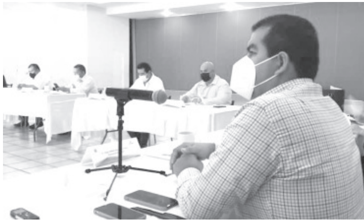
El alcalde dijo que en los siguientes días se dará a conocer el mecanismo para adquirir los tanques y las áreas municipales que brindarán esta ayuda.

Ante el desabasto del vital suministro en Zitácuaro y luego de la alta demanda en las últimas semanas, además de las complicaciones que enfrenta la población para conseguirlo, la iniciativa del actual Gobierno local, fue acreditada por el presidente municipal y los demás integrantes del Cabildo. El edil destacó que el cierre del 2020 y el arranque del 2021 han sido complicados para muchas