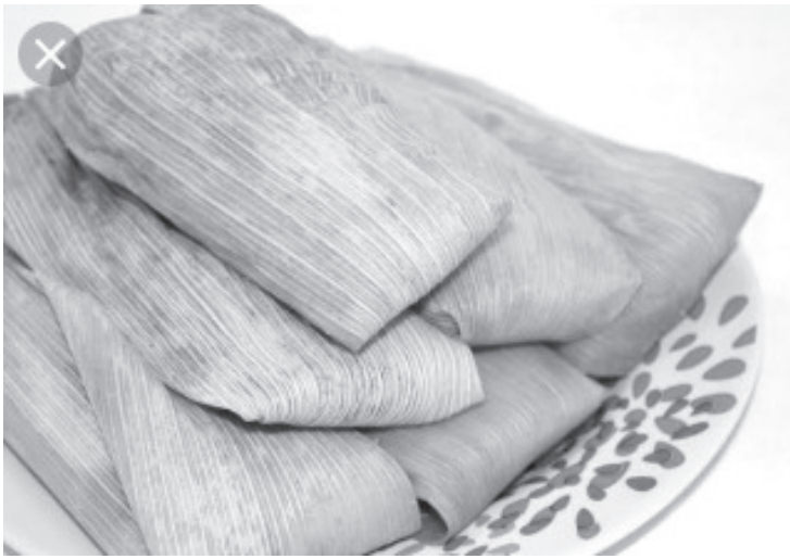
A partir de este sábado y en los siguientes días, se habrán de difundir las direcciones, números de teléfono de las personas que estarán vendiendo tamales y atoles.

- Hay desanimo en el sector porque no serán las mismas ventas