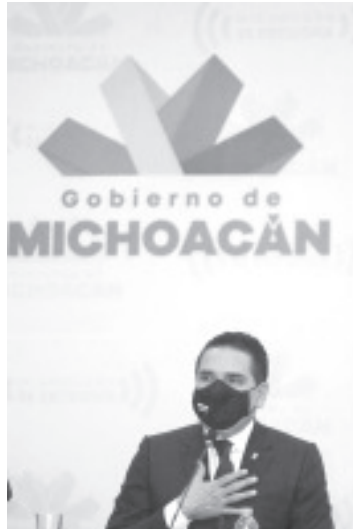
El gobernador indicó que los 4 mil 192 casos activos y la alta movilidad colocan al estado en un nivel que riesgo y se deben tomar medidas.

Acompañado por miembros de su gabinete y en presencia de representantes de los servicios de salud del estado, del sector empresarial y medios de comunicación, el gobernador indicó que