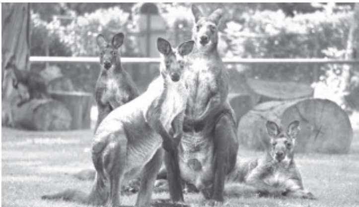
Cabe resaltar que a pesar del cierre, la alimentación, cuidado y mantenimiento de los 2,054 ejemplares que se encuentran en el recinto prosigue de manera normal.