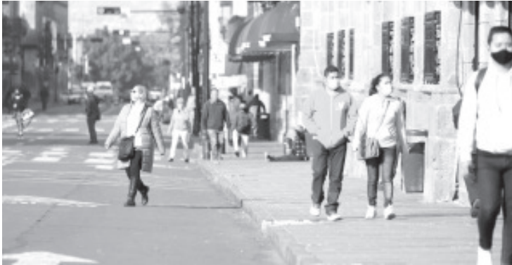
De los 41 mil 213 casos confirmados de COVID-19 en la entidad, el 59.95 % corresponde a personas entre los 20 y 49 años de edad, dice la SSM.