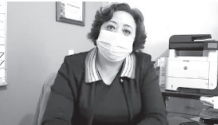
En Zitácuaro no hay registrado ningún negocio para aplicar sanitización, por lo que quienes ofrecen este tipo de servicio lo hacen fuera de la Ley de Salud.

Asimismo, a quienes solicitan este tipo de servicio les recomendó que exijan la licencia sanitaria de quien contratan para verificar que reciben una atención de calidad, esto les da certeza y confianza además que se toman las medidas respectivas en materia de salud.