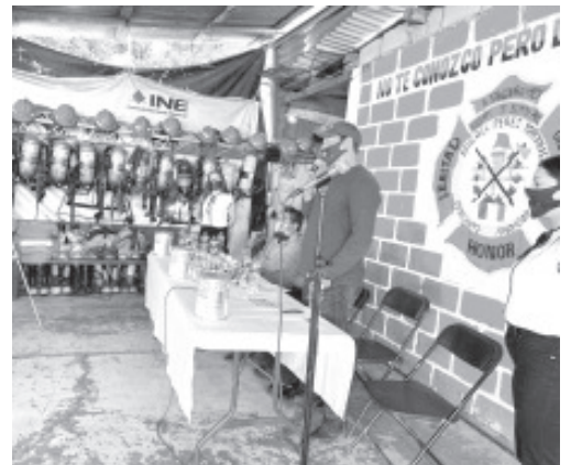
También en Estados Unidos se abrió otra cuenta a fin de que los connacionales que quieran sumarse a esta noble causa.

Para cumplir con tales fines, se tendrán 100 botes que servirán como alcancía, 50 estarán en poder de los Bomberos y las 50 restantes en los