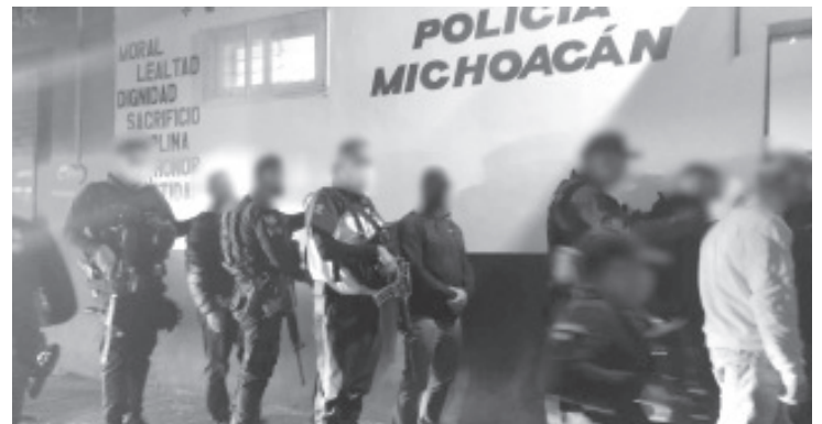
SSP, remitió al área de Barandilla a 15 personas por faltas a la Nueva Convivencia, mismas que se encontraban consumiendo bebidas embriagantes en una plaza pública.

Se exhorta a reportar a las líneas 911 y 089 todo acto que atente contra la salud de la población.