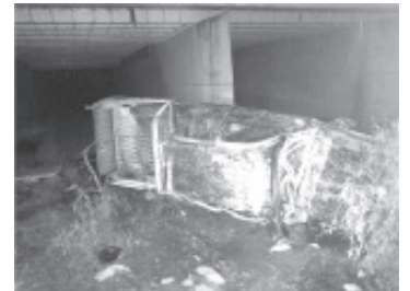
El ahora occiso quedó completamente carbonizado y está en calidad de desconocido, no llevaba acompañantes.

El ahora occiso quedó completamente carbonizado y está en calidad de desconocido. El cuerpo fue trasladado en una ambulancia de uso forense a la morgue de la región para la práctica de los estudios de ley. Se espera que sus deudos acudan a reclamarlo a dichas instalaciones, dijeron fuentes policíacas.