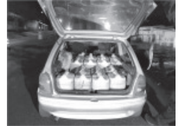
Tras realizar una revisión al vehículo fueron encontradas 16 garrafas cada una con 20 litros de hidrocarburo, sin la documentación que acreditara la legal procedencia.

La SSP hace un llamado a denunciar a la línea de emergencias 911 todo hecho delictivo que vulnere la seguridad de la sociedad michoacana.