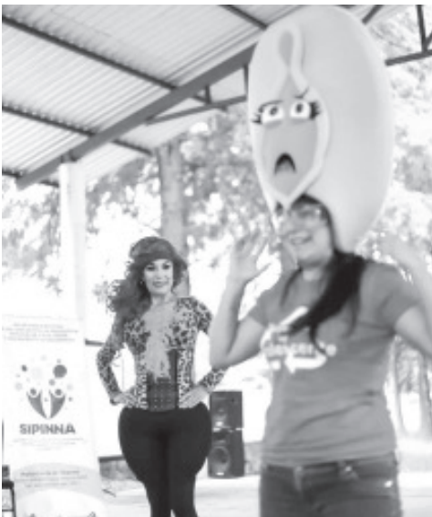
La puesta en escena permite a las y los jóvenes visualizar los riesgos de un embarazo a temprana edad, que los puede llevar desde dejar sus estudios o poner en riesgo su salud.

•La puesta en escena tiene como objetivo sensibilizar a las y los jóvenes sobre los riesgos y problemas que genera un embarazo