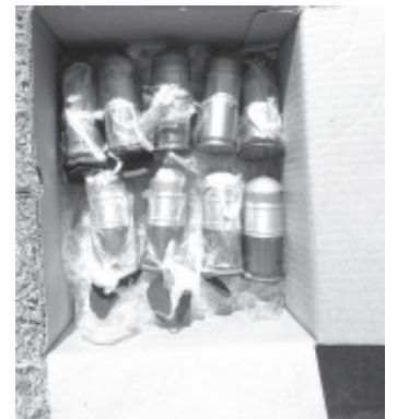
Las nueve granadas son completamente nuevas y útiles, mismas que son empleadas en aditamentos lanzagranadas colocados en armas largas.

Mandos castrenses dijeron a esta agencia de noticias que se presume que el material explosivo iba a dar a las manos de los integrantes de grupos delincuenciales.