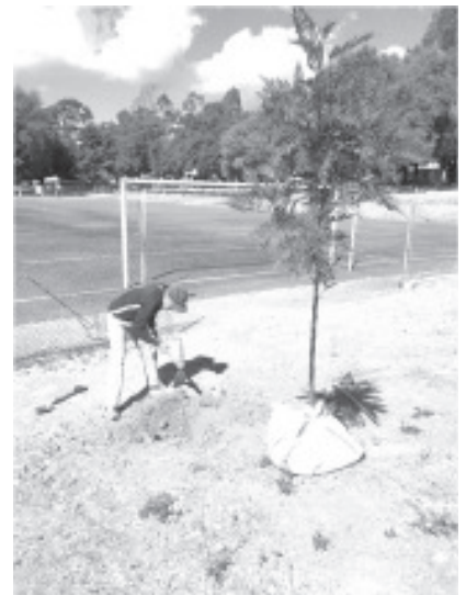
Niños y jóvenes que integran diferentes clubes deportivos, son responsables de ayudar en las tareas de trasplantarlos, también de regarlos durante las mañanas y las tardes.

Para garantizar que dichos árboles sobrevivan, agregó que están recibiendo asesoría de personal especializado que conoce del tema, tal es así que están cumpliendo con los requerimientos necesarios, uno de ellos es el enraizador que ayuda a que tales árboles resistan el cambio de suelo.