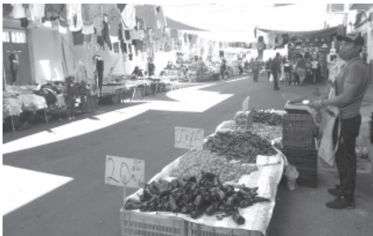
A diferencia de ocasiones anteriores, este día no hubo puestos a mitad de la calle, sólo a los costados, y la afluencia de visitantes fue mínima.

Aseguró que los comerciantes del tianguis que no acaten las medidas se les estará suspendiendo temporalmente, ya que son acuerdos que se toman de forma colectiva y no hay excusas para no cumplir.