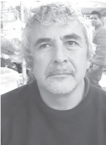
En caso que se llegue a cerrar más días, sería el colapso del comercio, pues hay productos perecederos que no aguantarían estar guardados tanto tiempo.