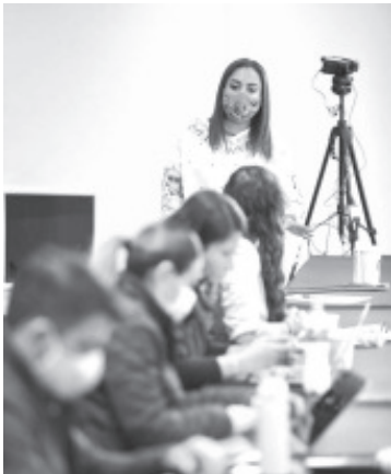
La coordinadora hizo un llamado a que el proceso de entrega - recepción se realice conforme a los lineamientos jurídicos y administrativos establecidos.

Morelia, Michoacán, a 22 de enero de 2021.- Con el propósito de cumplir en tiempo y forma el proceso de entrega-recepción de la administración pública 2015-2021 que encabeza el Gobernador, Silvano Aureoles Conejo, la Coordinación General de Comunicación Social sostuvo una primera reunión de trabajo con el área de estructura.