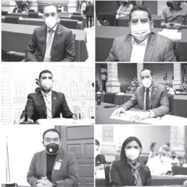
Al abandonar el recinto legislativo, los diputados de Morena, además de evidenciar su irresponsabilidad, por estar en contra de la Ley, demuestran su inconcurrencia y desinterés por la salud de las y los michoacanos.

-Celebran que en Michoacán prosperara Ley para garantizar el uso obligatorio del cubrebocas para salvar vidas -Al abandonar la sesión demuestran que no les importa la salud de la población