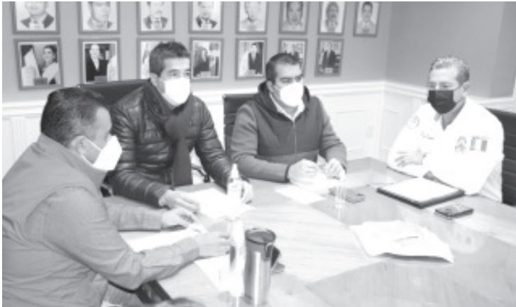
Los integrantes del comité coincidieron en la cancelación oficial de la Feria del 5 de febrero, adelantándose a los permisos y preparativos que podrían iniciar algunos sectores.

Zitácuaro, Mich., 11 de enero del 2021.- Ante la alerta epidemiológica en Bandera Amarilla que padece el municipio, emitida por el Gobierno del Estado a través de la Secretaría de Salud, el Comité Municipal de Seguridad en Salud, llevó a cabo la Sesión Ordinaria que realiza cada