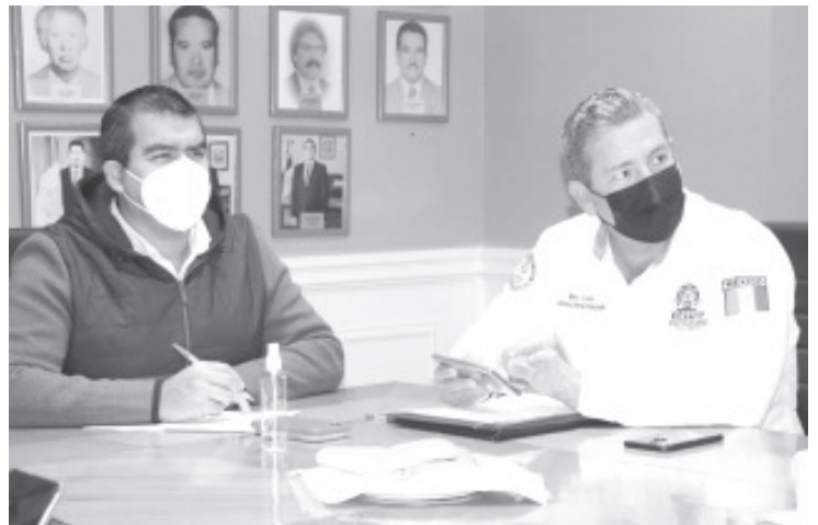
Se destacó la necesidad de aumentar las medidas preventivas y restrictivas para lograr cortar la cadena de contagio y bajar las cifras, que en la segunda semana del año fueron las más altas registradas.

Durante la reunión se destacó la necesidad de seguir endureciendo las medidas preventivas y restrictivas para lograr cortar la cadena de contagio y bajar