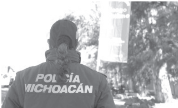
A fin de contener la propagación del virus en el municipio, elementos de la Policía Michoacán colocaron las Banderas Rojas en las principales salidas y accesos a la ciudad.

El Gobierno del Estado pone a disposición de la población el 800-123-2890 con 11 líneas para resolver todas sus dudas, así como el microsítio bit.ly/MichCOVID-19, donde encontrarán toda la información disponible sobre COVID-19.