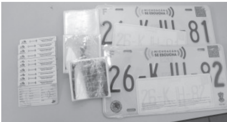
La Secretaría de Finanzas de Michoacán informa a la población que para el ejercicio fiscal 2021 no se contempla la implementación de un nuevo reemplacamiento.

Mismo que permite la impresión del formato para pago de refrendo vehicular 2021 en ventanilla bancaria, o si así lo prefiere el contribuyente, el pago en línea con cargo a tarjeta de crédito o débito; este último proceso es el que el Gobierno de Michoacán aconseja para la cobertura de los pagos en el tema.