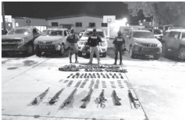
Policía Michoacán, GN y de la FGE, detuvieron a 17 personas del sexo masculino y 4 del sexo femenino, quienes se encontraban en posesión de droga.

-Durante el reforzamiento de trabajos operativos se ubicaron y destruyeron tres campamentos