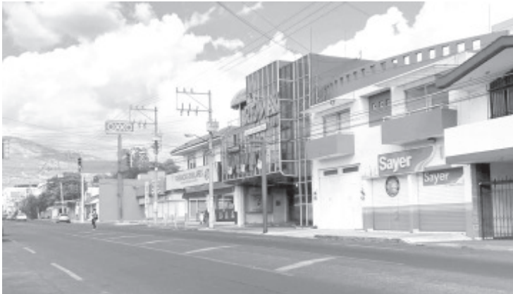
47 municipios se sumaron a las medidas de mitigación para romper la cadena de contagio de COVID-19 en el estado, acataron el decreto estatal que busca proteger la vida y la salud de la población.

-Autoridades locales acataron el decreto que busca romper la cadena de contagio