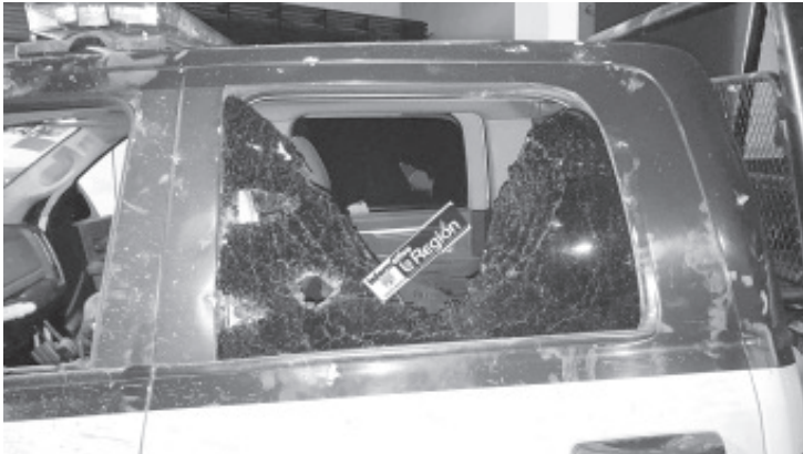
Cinco elementos de la Policía Michoacán resultaron lesionados al ser agredidos por un grupo de asistentes inconformes con la acción de la autoridad, que los dispersó de un jaripeo

Morelia, Mich.- 11 de enero de 2021.- La Secretaría de Seguridad Pública (SSP), llevó a cabo un operativo para dispersar un jaripeo que se realizaba en la localidad de La Cofradía, municipio de Morelia, al contravenir el Decreto por el que se establecen medidas emergentes ante el incremento de contagios por la epidemia del COVID-19.