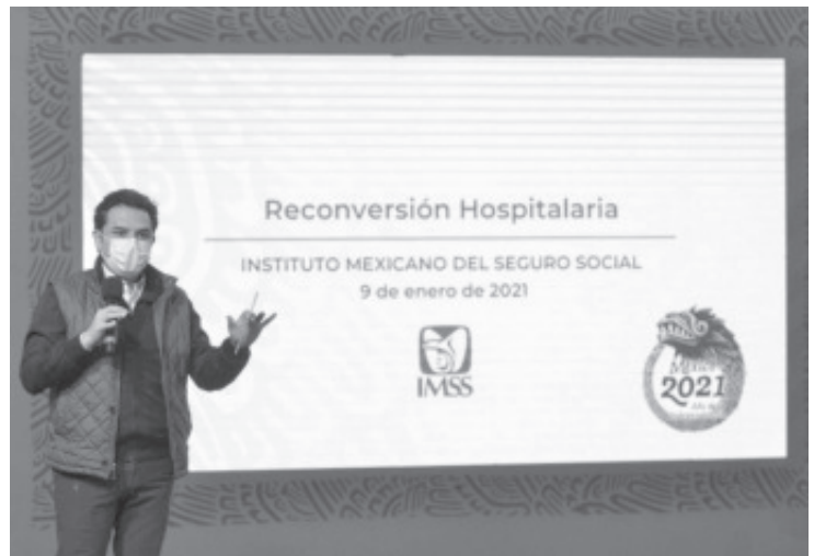
Michoacán tiene 221 camas y se aperturarán 195, para ser un total de 416 que es un incremento del 88 por ciento, esto en tres de los ocho hospitales en la entidad.

Finalmente, el director general del IMSS reiteró el llamado, por parte del personal de salud, que "les echen tantito la mano cuidándose, manteniendo la sana distancia, continuando con el lavado y la higiene personal, y lo más importante no salir de casa si no es necesario en los estados que tienen estos niveles de contagios".