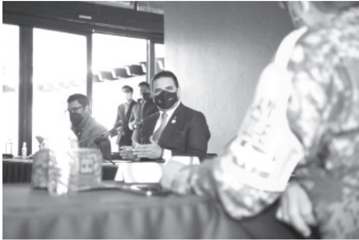
Serán 16 mil 575 dosis las que de inicio serán enviadas al estado y resguardadas por la Sedena, para ser aplicadas a médicos, enfermeras, químicos, camilleros e intendentes.

-Encabeza Gobernador reunión de coordinación para recibir e iniciar con el proceso de vacunación en la entidad