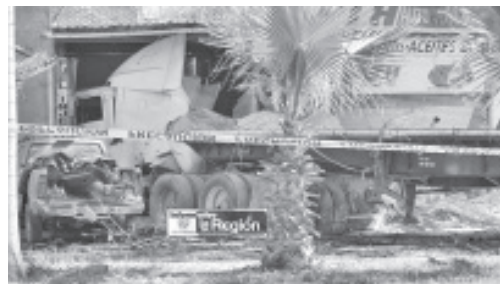
Un pesado tráiler con un cargamento de cal agrícola embistió a tres vehículos y acabó estrellado contra una refaccionaria y un taller mecánico, no hubo lesionados.

Al sitio acudieron los elementos de la Policía Michoacán y de Tránsito Municipal de Jiquilpan, éstos últimos hicieron el peritaje correspondiente. También llegaron los paramédicos de Protección Civil de Jiquilpan y de Sahuayo para atender la emergencia.