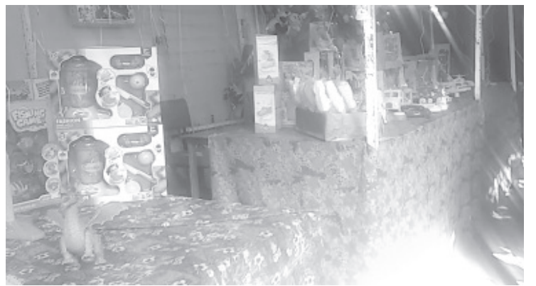
“Los Reyes Magos no nos abandonaron, estamos agradecidos con ellos porque logramos sacar lo invertido y quedarnos unos pesos mas”.

Reiteró que desde que se instala la Feria del Juguete, en el Jardín Constitución, los comerciantes que participan ofrecen juguetes para todas las economías y para todos los gustos de los pequeñines.