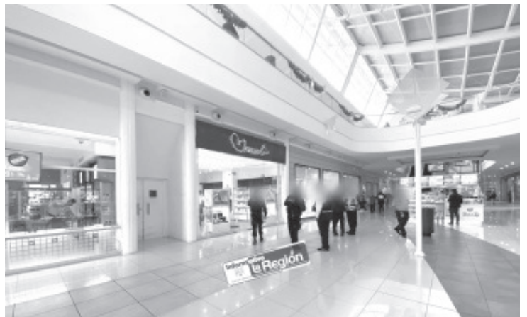
Uno de los hampones entró al lugar y a punta de pistola amagó a los trabajadores, en tanto que su cómplice vigilaba la entrada.

De los asaltantes solo se conoció que uno de ellos media 1.74 metros de estatura, vestía una camisa a cuadros de colores azul y negro, tenía una marionera negra y usaba una gorra azul. El caso fue alertado a la Fiscalía General del Estado (FGE), a efecto de emprender las diligencias correspondientes.