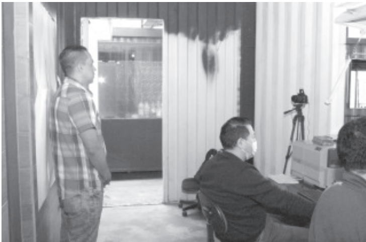
Las licencias para conducir vuelven a su trámite normal, teniendo como vigencias dos, cuatro y nueve años, mismas que pueden ser solicitadas en todo el estado.

-El programa estuvo vigente hasta el 31 de diciembre en todo el estado -A partir del primero de enero estos documentos pueden ser solicitados por dos, cuatro y nueve años