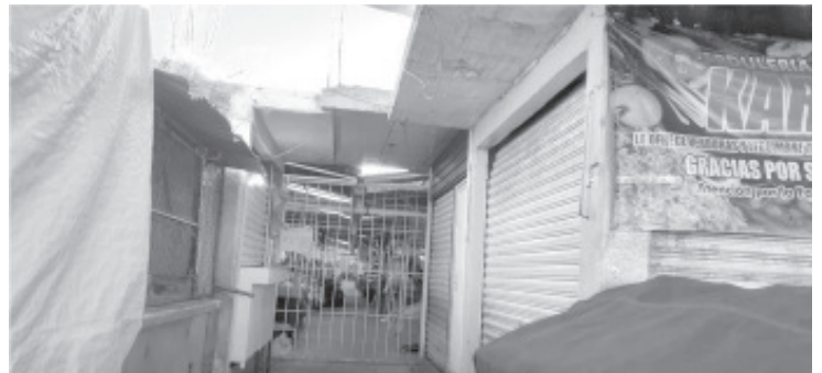
Tras registrarse los mil contagios en el municipio y cercanos a las cien defunciones, el Gobierno del Estado, anunció la suspensión de actividades los domingos, zona urbana y conurbana, a partir del 10 de enero.

En caso de incumplimiento de la normatividad, se impondrán sanciones que van desde la clausura de los establecimientos hasta la aplicación de multas que oscilan entre las 100 y 400 UMAS. Estas acciones son en función al contexto epidemiológico que padece el municipio, en caso de que la situación continúe agravándose, por disposición de las autoridades federales y estatales, se anunciarían nuevas medidas más estrictas.