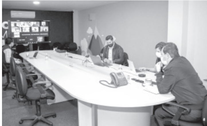
Los empresarios, que se enlazaron de manera virtual, se pronunciaron porque la aplicación de las medidas de cierre intermitente sean aplicadas tanto al comercio formal como al informal.

comida, se dejó en claro que se permitirá operar también los domingos todo el día, pero únicamente para llevar, sin permitir consumo en los locales. En el caso de los hoteles, el servicio en restaurante será únicamente para los huéspedes, sin permitirse en ningún caso la operación de los bares.