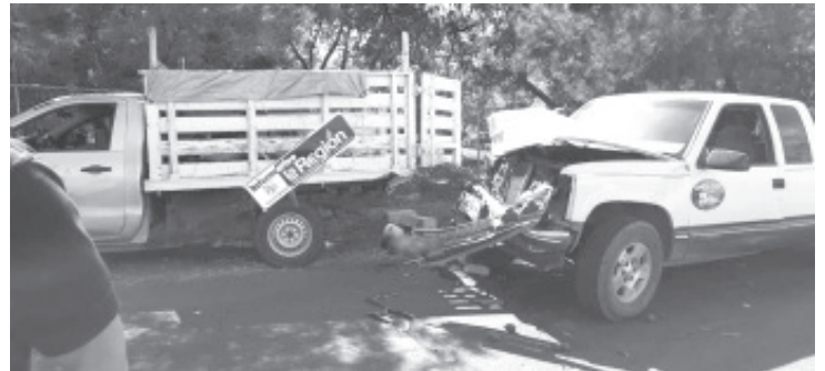
Los accidentados fueron embestidos por unidad Chevrolet blanca, con láminas de circulación de Michoacán, que era conducida con exceso de velocidad.

Finalmente, el personal de la Fiscalía General del Estado efectuó las primeras investigaciones, abriendo la carpeta correspondiente y ordenando que el cadáver del menor fuera enviado al Servicio Médico Forense para realizarle la necropsia de ley. Se espera que en las próximas horas sea detenido el responsable.