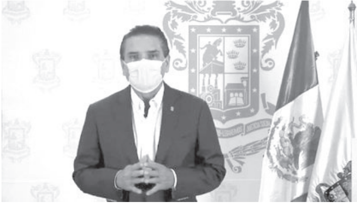
Cierres parciales en actividades no esenciales de jueves a sábado a partir de las 19: 00 horas y cierres totales los domingos, los puntos principales del decreto.

•Cierres parciales en actividades no esenciales de jueves a sábado a partir de las 19: 00 horas y cierres totales los domingos, los puntos principales.