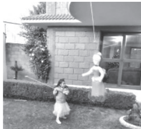
La Niña SOFI URBIZO PAZ Tratando de pegarle a su Piñata de Cumpleaños.