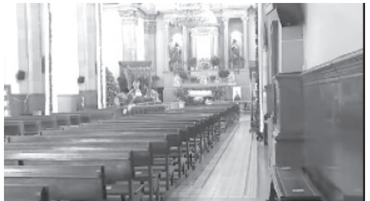
“Ojala que todos luchemos por la vida y la salud, ojalá que nos demos cuenta y usemos el cubrebocas que ayuda para proteger el contagio”, dijo el sacerdote.

Agregó que se pretende que esta misma medida la lleven a cabo todas las iglesias de la zona urbana, y también las que se quieran sumar de las comunidades. Esto debido a que actualmente hay varios sacerdotes que han contraído el virus del Covid 19 y están delicados de salud.