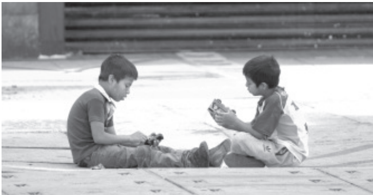
Hoy la celebración es en casa, solo con familiares, en algunos casos seguramente no llegaron los regalos esperados por la crisis económica.

En las calles, no se percibe ese ambiente de fiesta de años anteriores, no hay niños corriendo, ni llenando con risas lugares o tiendas, aquellos menores que salieron y están en la calle es porque seguramente salieron a acompañar a sus papas a trabajar. Por lo tanto no es un día especial.