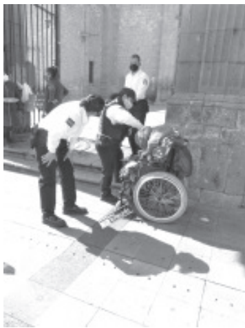
Un adulto mayor en silla de ruedas falleció en la vía pública del Centro Histórico de Morelia, a un costado de la Catedral, se desconoce su identidad.

Morelia, Mich.- Jueves 07 de enero de 2021.- Un adulto mayor en silla de ruedas falleció en la vía pública del Centro Histórico de Morelia, a un costado de la Catedral. De acuerdo con contactos policiales y de rescate, el deceso del