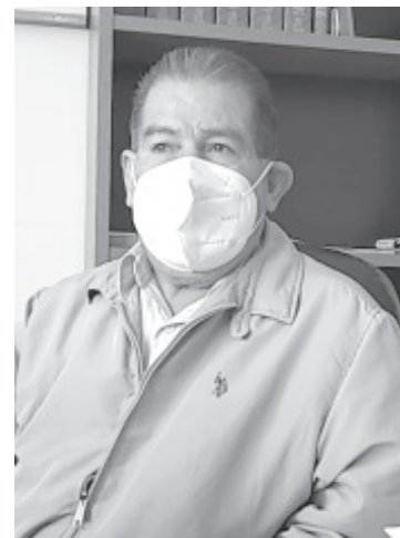
Entre los derechos fundamentales que pudieran ser transgredidos se encuentra la no discriminación, derecho a la legalidad, a la seguridad pública y al libre tránsito.

La oficina de la CEDH en esta ciudad se encuentra en la calle Moctezuma esquina con Altamirano, y funciona de lunes a viernes en un horario de 9 de la mañana a las 4 de la tarde. Ahí pueden acudir los ciudadanos a interponer alguna queja, en caso que se hayan sentido violentados por los actos de la autoridad estatal y/o municipal.