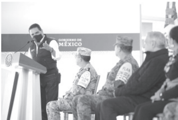
En Michoacán, le manifestamos nuestro compromiso, firmeza y voluntad para avanzar, de manera coordinada y junto con las instituciones federales de seguridad, en la construcción de la paz, le dijo a AMLO.

Maravatío, Michoacán, a 8 de enero de 2021.- Michoacán avanza de manera coordinada, firme y con voluntad en el combate a la incidencia y la construcción de la paz, aseguró el Gobernador Silvano Aureoles Conejo.