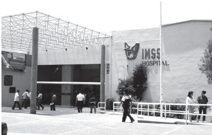
Los decesos que se han suscitado son: cuatro, el día sábado y siete, el domingo de la semana anterior y no son imputables a los trabajos mencionados.

Morelia, Michoacán, a 06 de enero de 2021.-Con relación a los señalamientos de supuestos fallecimientos de pacientes en el Hospital General de Zona (HGZ) No. 83 Camelinas Morelia, por fallas en el suministro de oxígeno en el área covid, la Oficina de Representación Michoacán del Instituto Mexicano del Seguro Social (IMSS) informa: