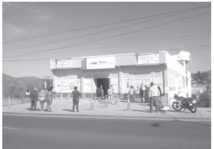
El modulo fijo que se encuentra en esta ciudad, desde este día atiende a casi 300 personas, la mayoría mediante el mecanismo de cita programada; son pocos quienes acuden al azar.

Asimismo, las 3 unidades móviles también ya están funcionando y recorren los municipios que conforman este distrito electoral para los ciudadanos que habitan dichos lugares.