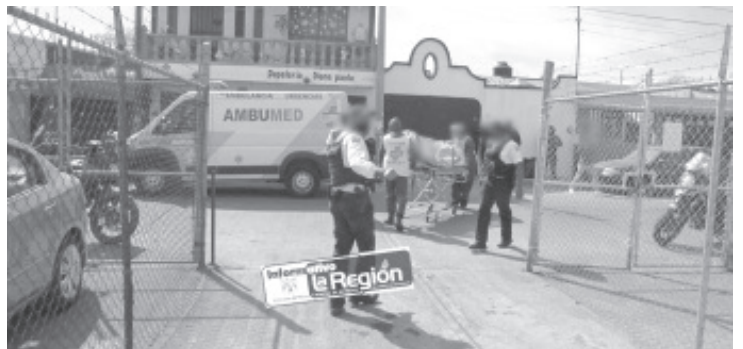
La mujer enferma fue auxiliada por técnicos en urgencias médicas, quienes la sacaron dentro de una capsula adaptada para pacientes COVID-19.

Trascendió que la fémica enferma fue auxiliada por los técnicos en urgencias médicas, quienes la sacaron dentro de una capsula adaptada para pacientes COVID-19 y consecutivamente la canalizaron a un hospital para su adecuada atención. La mencionada dama tiene 73 años de edad. Por obvias razones la identidad de los afectados no fue expuesta.