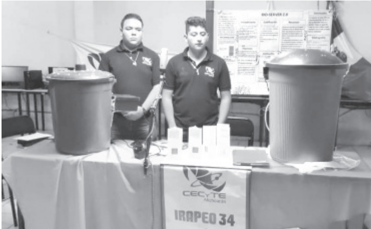
Estudiantes de los planteles de Puruándiro e Irapeo ganaron 7 medallas y mismo número de acreditaciones internacionales en la Copa Tec 2020, edición virtual, con sede en Asunción, Paraguay.

-Siete medallas en total y siete acreditaciones internacionales ganaron los alumnos