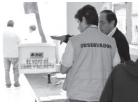
El único requisito, para ser observador electoral, es ser mexicano, mayor de edad, mandar una solicitud, acreditar un curso de capacitación y no ser parte del equipo de algún candidato, ni ser miembro activo de un partido político.

Tello Sepúlveda agregó, que todo ciudadano tiene derecho a solicitar ser observador electoral y aunque históricamente era considerable el número de personas que llegaban a hacer su registro en las últimas elecciones, ha bajado el número de solicitudes, esto se traduce en que hay más confianza en las instancias.