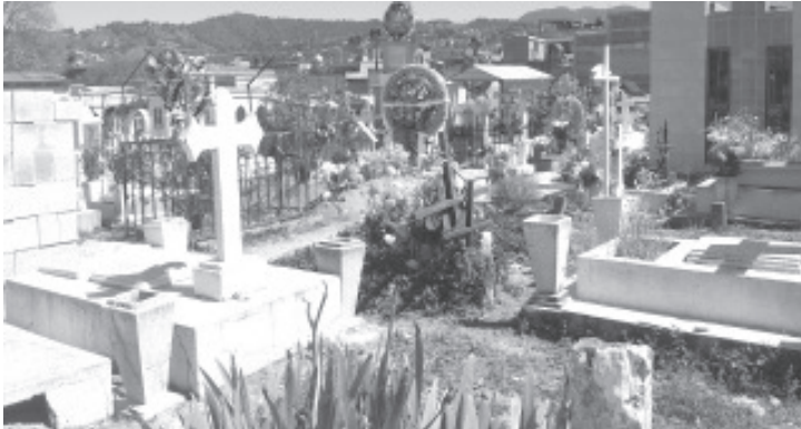
La realidad es que quienes regularizan su situación es porque tienen necesidad de utilizar el espacio para sepultar a algún familiar, de lo contrario el tema no les interesa.

- La mayoría de ciudadanos pagan refrendo hasta que tienen la necesidad de utilizar el espacio