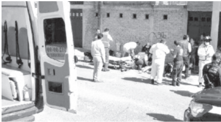
Una niña de 12 años, que era acompañada de su mamá, aprendía a conducir un auto, se subió a la banqueta y atropelló a una mujer y tres niños, uno de ellos murió.

Policías acordonaron el área, aseguraron a las ocupantes del mencionado vehículo y posteriormente se constituyó en la escena el personal de la Fiscalía General del Estado (FGE), mismo que emprendió las investigaciones correspondientes y trasladó al difunto a la morgue para la práctica de la necropsia de rigor.