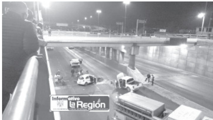
El fue el impacto, entre una camioneta y un taxi dejó un hombre muerto y tres lesionados sobre el Periférico Paseo de la República de Morelia.

El sitio de la tragedia fue acordonado y consecutivamente se constituyó el personal de la Fiscalía General del Estado (FGE), el cual hizo las averiguaciones respectivas y trasladó el cadáver a la morgue para la práctica de la necropsia de rigor.