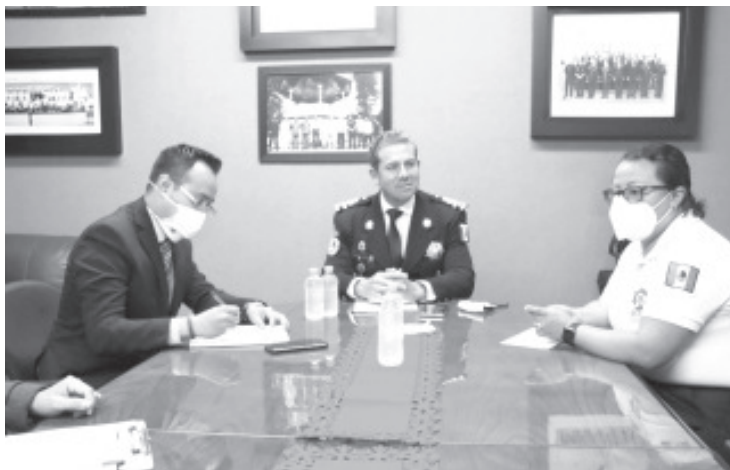
Se trabaja en tres objetivos primordiales: mejoramiento en la docencia, el fortalecimiento del modelo educativo policial y el crecimiento de la infraestructura institucional.

-Fortalecer la capacidad institucional a través de la especialización, el objetivo -Delinean tres ejes con los que se trabajará el próximo año