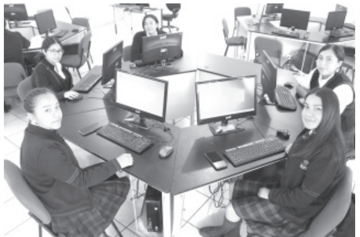
El Conalep cerró el año 2020 certificando a más de 10 mil 200 estudiantes y docentes en Microsoft Office Specialist e inglés.

Finalizó al mencionar, que para las certificaciones en inglés se hace uso de una plataforma digital llamada Lingochamp, mientras que Microsoft Office avala la certificación de manera internacional.