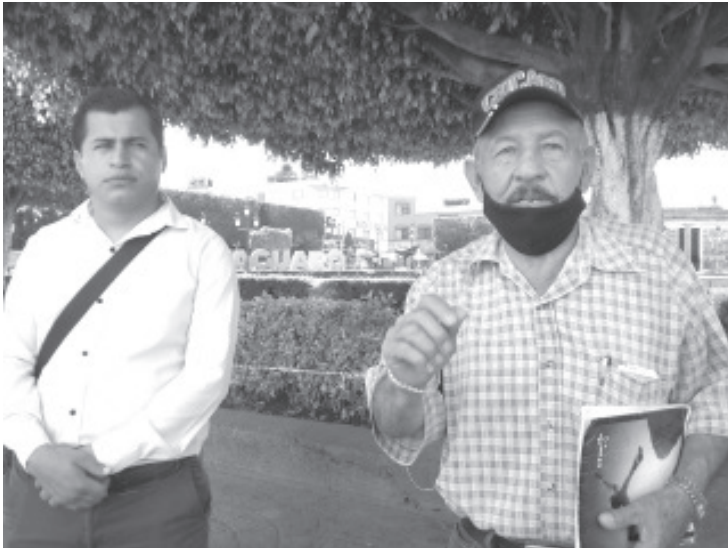
Queremos que el Gobierno Municipal cumpla los acuerdos que hizo con nosotros, de ayudarnos a detener la tala que se sigue presentando en nuestros cerros, dijeron los campesinos.

- En septiembre el Ayuntamiento se comprometió a ayudarlos, pero no ha cumplido