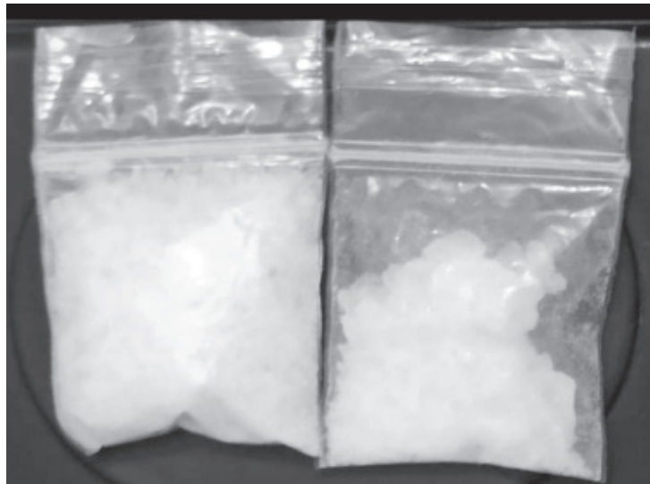
En pleno centro de Maravatío la SSP detiene a dos hombres con envoltorios con metanfetamina, iban muy rápido en moto.

La SSP hace un llamado a denunciar cualquier acto ilícito que atente en contra del bienestar de las y los michoacanos a las líneas de emergencias 089 y 911