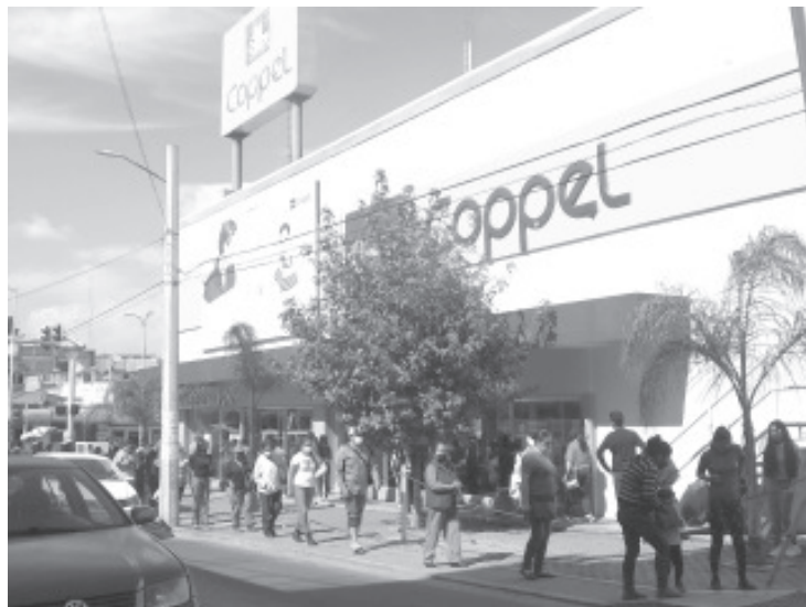
En días previos a la celebración de Nochebuena, las calles de la ciudad durante todo el día se encuentran abarrotadas de gente, resulta difícil caminar por la banqueta.

Desde el inicio de la pandemia hasta el día de hoy, las recomendaciones para evitar contraer el virus del Covid-19 son: lavado frecuente de manos, uso de gel antibacterial, sana distancia, evitar aglomeraciones, no saludar de mano o beso, y no salir a la calle si no es necesario, principalmente niños, adultos mayores, personas enfermas, y mujeres embarazadas.