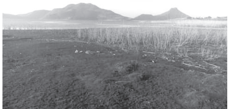
Según pescadores, desde que comenzó la temporada de lluvias, la recuperación de la Presa fue muy lenta, por lo que previeron que este año no llegaría al 100% de su capacidad.

Reiteró el llamado a las autoridades competentes a tomar cartas en el asunto; llevar a cabo medidas que ayuden a que este cuerpo de agua mantenga el nivel mínimo que debe tener para no poner en peligro su permanencia, para ello debe haber un equilibrio que no afecte a nadie, esto es que no les saquen más agua de la mínima.