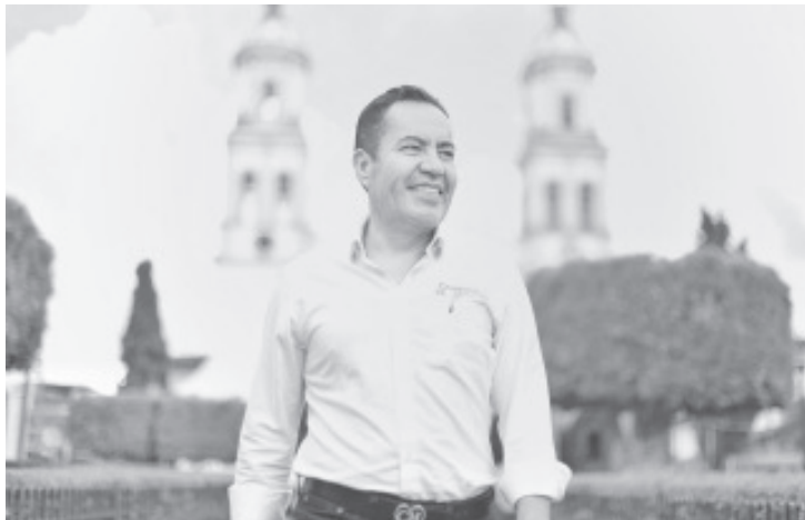
En el ánimo de construir, sumar y lograr un proyecto conjunto con las y los michoacanos, Carlos Herrera anunció que se registrará en el proceso de selección de candidaturas del PRD.

Finalmente, y tras aceptar la invitación Herrera Tello anunció que en los próximos días estará dialogando con las y los integrantes de dicho instituto político.