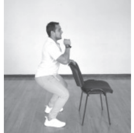
Es importante un calentamiento previo, para evitar lesiones como desgarros esguinces torceduras u otras cosas.

“Invité a la población en general, a que durante esta temporada decembrina y de confinamiento realicemos actividad física en casa y en caso de acudir a algún gimnasio o club deportivo, acatar todas las medidas básicas sanitarias por COVID-19, que prevengan la propagación del virus”, concluyó Zamudio Rodríguez.