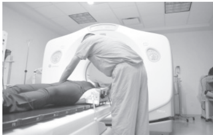
Actualmente se tienen acreditadas ocho patologías cancerígenas, entre ellas mama, cérvico uterino, ovario (epitelial y germinal), próstata, testículo, endometrio, colon y recto.

La institución hace un exhorto a la población que tenga antecedentes familiares de cáncer, para realizar estudios que permitan detectar a tiempo alguna patología que pueda poner en riesgo su salud y su vida.