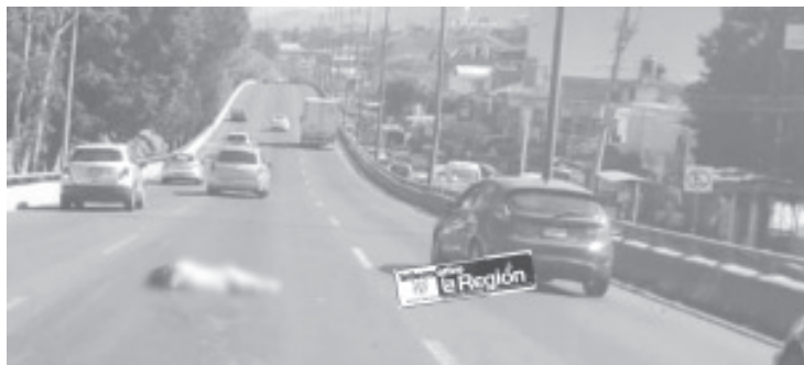
La señora descendió de su unidad para abanderar el sitio para evitar algún accidente contra su vehículo, pero fue arrollada por un auto.

Los dos niños que iban con la mujer fueron resguardados por la Policía, siendo entregados a sus familiares. En tanto, el piloto del Ford fue detenido por los guardianes del orden y puesto disposición de la representación social para que su situación legal le fuera definida conforme a Derecho. Todo fue a la altura del establecimiento "Suspensiones Automotrices San Nayarit", el cual está en la colonia Lago II al norponiente de esta capital michoacana. El personal de la Fiscalía General del Estado tomó conocimiento del asunto se encargó de las diligencias de rigor.