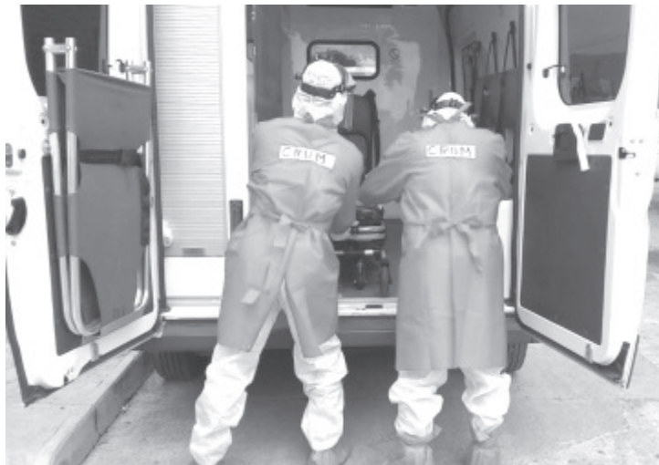
Star Médica y Ángeles reportaron a través de sus respectivos enlaces con el Centro Regulador de Urgencias Médicas (CRUM), que no cuentan con camas disponibles para recibir a pacientes de COVID-19.

-Autoridades reiteran exhorto a la ciudadanía a extremar las medidas de prevención