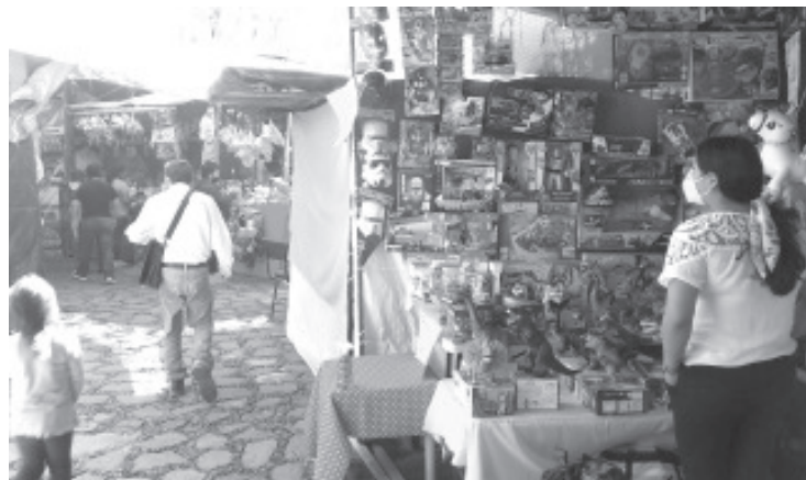
Sinceramente no esperamos mucho, sólo recuperar lo invertido y continuar con la tradición, hay que mencionar que no hay empleos, la economía ha caído mucho, indicaron los jugueteros.

El líder comerciante aseguró que por la pandemia del covid-19, estarán tomando medidas como la colocación de letreros en las 4 esquinas del jardín, uso obligatorio del cubrebocas, en cada puesto se dispone de gel antibacterial, y además a los asistentes se les estará invitando a que solo acuda una persona por familia, no vayan menores de edad, ni adultos mayores. Para reducir la cantidad de asistentes también, estarán colocando filtros a las entradas al Jardín Constitución.