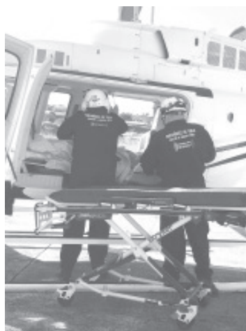
Durante el traslado en el helicóptero, paramédicos de la SSM, cuidaron la salud del joven hasta su llegada a Morelia, por cualquier complicación que se pudiera presentar durante el trayecto.

La SSM trabaja coordinadamente con las diferentes instituciones a fin de brindar atención oportuna y de calidad a las y los michoacanos que así lo requieran.