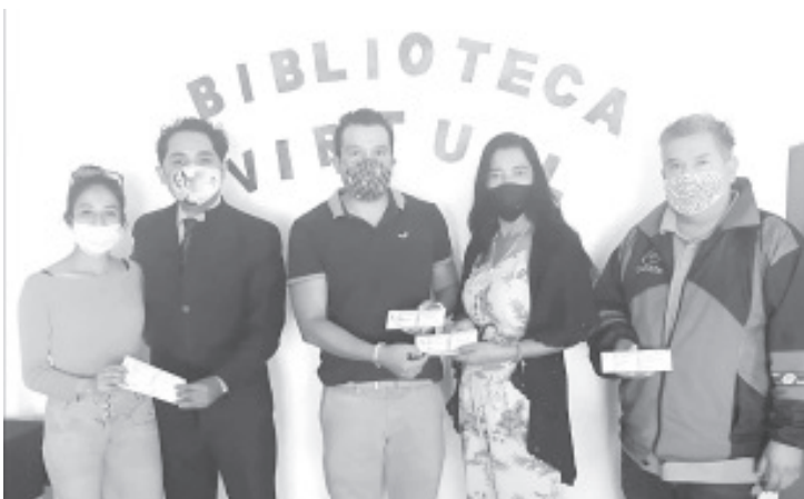
Se llevó a cabo en las nuevas instalaciones de la Biblioteca Virtual de Zitácuaro, de La Joya, la entrega de credenciales.