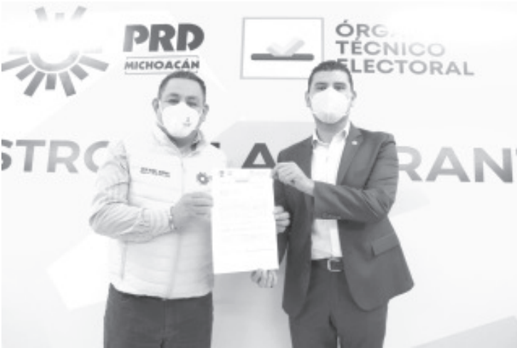
El ex presidente municipal de Tuzantla y actual diputado de la LXXIV Legislatura Local, acudió a las oficinas del PRD a manifestar su interés de participar en el proceso electoral 2021.

Distrito de Huetamo, en donde ha destacado por su trabajo y apertura para la construcción de acuerdos.