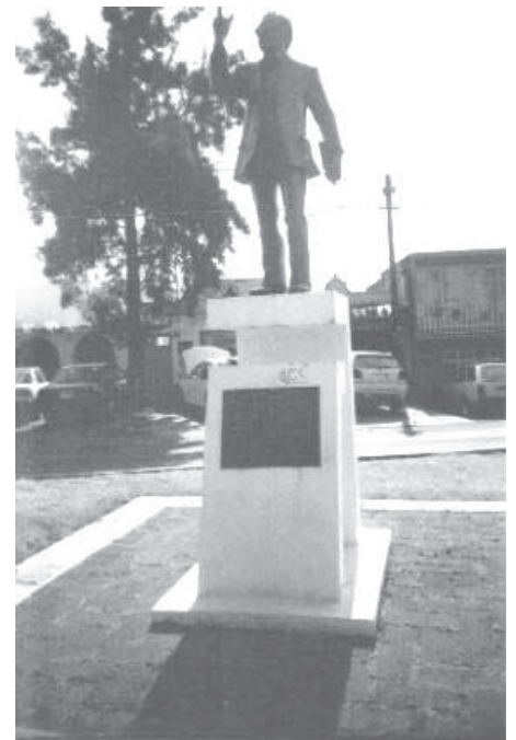
Dos monumentos fueron removidos, el que está dedicado al periodista zitacuarenses Manuel Buendía Téllez Girón y el de la Mujer Mazahua, serán reubicados dentro de la remodelación.

Hay que recordar, que esta obra tiene una inversión de casi 400 millones de pesos, y desde que comenzó ha generado inconformidad a los comerciantes de esta zona, ya que desde el primer día las ventas cayeron hasta el 90%, muchos han despedido personal y otros han optado por cambiar de domicilio su negocio para no quebrar de forma definitiva.