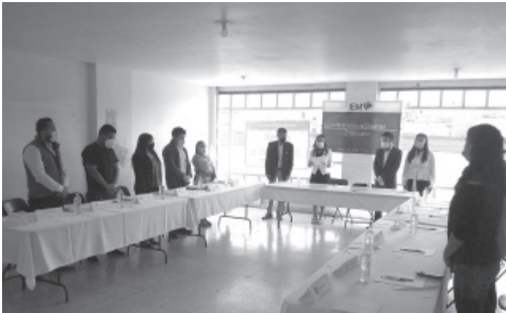
Los integrantes del Consejo rindieron protesta y reiteraron que velarán por los principios que rigen a este órgano electoral, como la transparencia y la legalidad, entre otros.

- Consejeros se comprometen a organizar unas elecciones a la altura de los ciudadanos