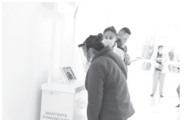
Personal del Departamento de Trabajo Social del hospital, ha realizado mil 930 videollamadas entre familiares y los pacientes que se encuentran aislados por ser positivos a este virus.