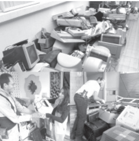
Dichos residuos fueron canalizados para su desarmado, destrucción, separación, almacenamiento y posterior exportación para su disposición final.

Asimismo, el gobierno de Michoacán que encabeza Silvano Aureoles hace el llamado a la ciudadanía para que continúen llevando sus residuos de electrónicos a la ProAm, con domicilio en calle 8 de septiembre, número 183 en la colonia Chapultepec Sur, Morelia; o a cualquier otro centro de acopio, para así contribuir al cuidado del medio ambiente.