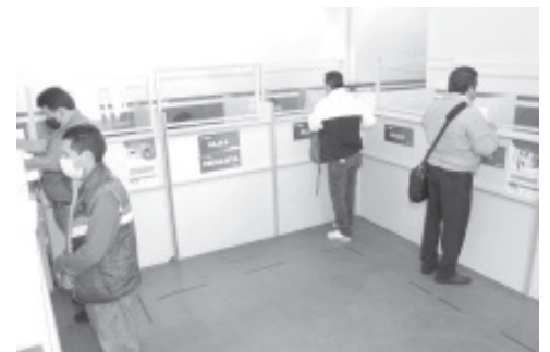
La SFA de Michoacán, informa que sus oficinas de Rentas en todo el estado estarán abiertas para la atención a la ciudadanía, con excepción del día 25 de diciembre, en el que no tendrán servicio.

Para mayores informes respecto a medidas de prevención e información general sobre el COVID-19, la Administración Estatal pone a disposición de la población el número 800-123-2890, con 11 líneas para resolución de dudas, así como un micrositio donde encontrarán toda la información disponible sobre COVID-19, ingresando a la liga bit.ly/MichCOVID-19.