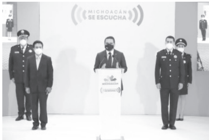
Los delitos en Michoacán están muy por debajo de la media nacional, ya que el estado ocupa en la tabla el lugar 20 en delitos de alto impacto, la posición número 8 en homicidios y 10 en robo de vehículos.

NINGÚN INMUEBLE QUE SEA SUJETO A ESTE ESTÍMULO FISCAL PODRÁ PAGAR IMPORTE MENOR A LA CUOTA MÍNIMA, Y CONTAR CON CREDENCIAL EXPEDIDA POR EL INSTITUTO NACIONAL DE LAS PERSONAS ADULTAS MAYORES (INAPAM), CREDENCIAL PARA VOTAR (INE O IFE), PASAPORTE O CARTILLA MILITAR PARA QUE ACREDITE LA EDAD, CREDENCIAL EXPEDIDA POR LA INSTITUCIÓN CORRESPONDIENTE QUE ACREDITE LA PENSIÓN, LA JUBILACIÓN O EN SU CASO LA DISCAPACIDAD.