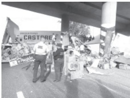
Un camión de pasajeros y un tráiler de la empresa de paquetería "Castores" protagonizaron un choque sobre la carretera Morelia-Salamanca.

Tarímbaro, Mich.- Jueves 17 de diciembre de 2020.- Un camión de pasajeros y un tráiler de la empresa de paquetería "Castores" protagonizaron un choque sobre la carretera Morelia-Salamanca; a raíz del percance, la caja del tractocamión quedó destrozada y su cargamento regado; hay seis heridos.