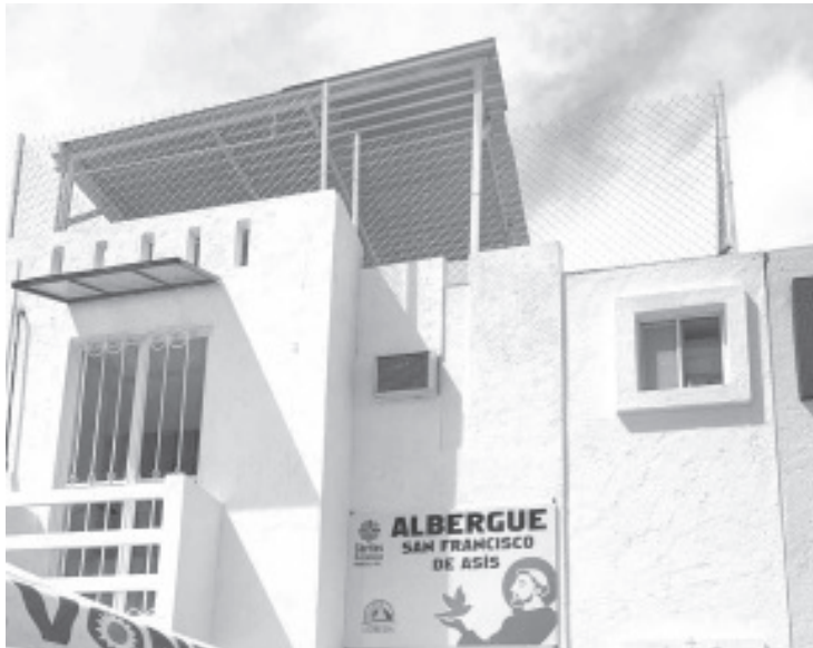
Este albergue brinda varios servicios: hospedaje con dormitorios para hombres y mujeres, en la cocina se da desayuno, comida y cena, hay servicio de baños y regaderas, quien pueda pagar algo.

- Espacio destinado para las personas que tienen un enfermo en el Hospital Regional