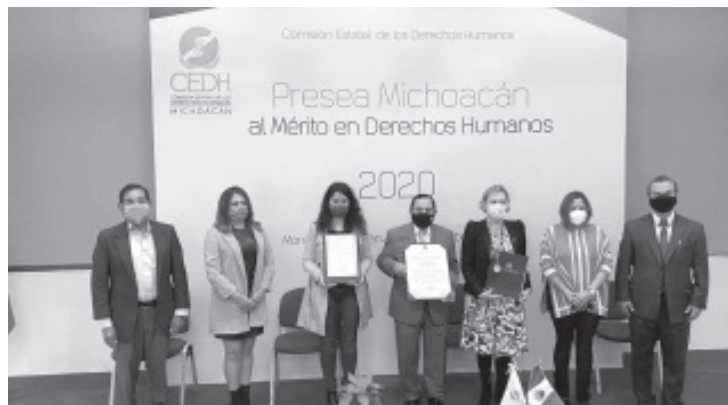
Se entregó la Presea Michoacán Mérito en Derechos Humanos 2020 a la Universidad Magno Americana, por su trabajo en la formación de adultos profesionistas bajo la enseñanza en el respeto a los derechos humanos.