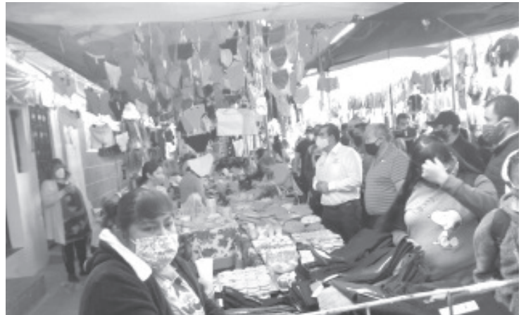
El munícipe invitó a los comerciantes y asistentes a acatar las medidas sanitarias como el uso del gel antibacterial, la sana distancia, que no acudan sectores vulnerables y se cumpla con el uso del cubrebocas.

La idea de esta actividad fue medir y tener un indicativo de lo que ocurre en este tipo de lugares donde el movimiento de personas es alto. En los siguientes días podría haber nuevas medidas para contener las aglomeraciones en estos lugares.