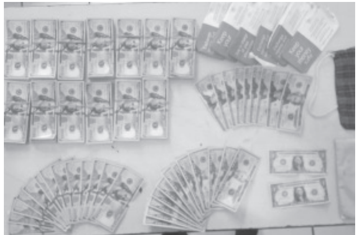
Agentes de la Secretaría de Seguridad Pública, aseguraron a un hombre quien se encontraba en posesión de 67 mil 82 dólares cuya procedencia no fue acreditada.

Ante cualquier hecho que atente contra la seguridad y la tranquilidad, la SSP exhorta a la población a reportar a la línea de emergencias 911.