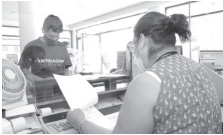
El módulo de la TAM laborará de lunes a domingo en los horarios indicados, todos los demás módulos y oficinas de Rentas tanto en Morelia como en el interior del estado laborarán de lunes a viernes.

En Morelia la ciudadanía podrá acudir a las siguientes oficinas: Dirección de Recaudación, ubicada en calle Ortega y Montañez número 290, colonia Centro; Administración de Rentas, en avenida Lázaro Cárdenas número 1016; Centro de Convenciones y Exposiciones (CECONEXPO); instalaciones centrales de la SFA, ubicadas en Avenida Acueducto número 644; Sala C de la Terminal de Autobuses de Morelia (TAM) y Macromódulo avenida