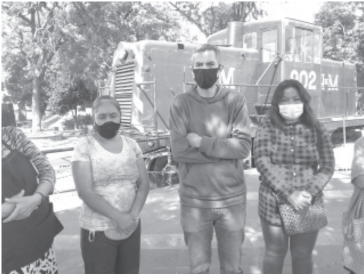
Los comerciantes dijeron sentirse abandonados por parte de la autoridad, ya que jamás han tenido algún acercamiento, tampoco han recibido ningún tipo de apoyo como otros sectores.

- Para resistir crisis se dedican a vender comida y están llenos de deudas