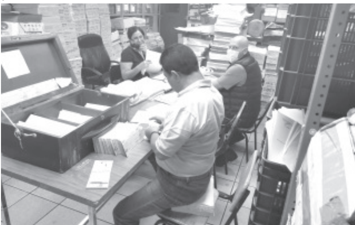
Dentro de la nómina extraordinaria se hizo el pago de la primera parte de aguinaldo a docentes y administrativos, donde se ejercieron mil 32 millones pesos.

Pese a la contingencia sanitaria por COVID-19 que se vive en el estado, el titular de la SEE Héctor Ayala Morales, informó que en la dependencia continúan cumpliendo el compromiso de cubrir los pagos de quienes integran el magisterio estatal en Michoacán, por lo que la distribución y entrega de los cheques se realiza en estricto apego a las medidas de seguridad implementadas por la pandemia, como es la sana distancia, el uso de cubrebocas, guantes y gel antibacterial.