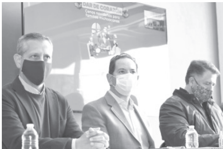
A partir de este miércoles y hasta los primeros días de enero, la organización altruista estará recibiendo donativos en especie y en dinero, de personas, empresas e instituciones que deseen contribuir.