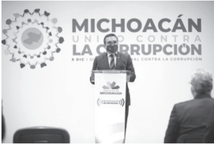
El gobernador indicó que con el Sistema Estatal Anticorrupción, se ha promovido la participación social contra la corrupción, a través de la articulación de acciones y de los sectores sociales.

Morelia, Michoacán, a 9 de diciembre de 2020.- Michoacán ha dado pasos contundentes en la lucha contra la corrupción, afirmó el Gobernador Silvano Aureoles Conejo, quien además consideró que esta batalla debe ser la bandera en la que todas y todos trabajen para que no se normalice la corrupción en ninguna de sus formas.