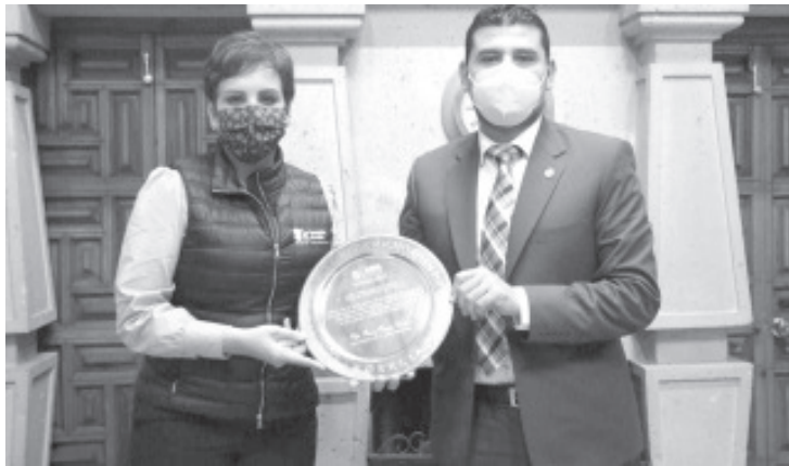
El diputado convocó a proteger la vida de los profesionales de la salud, quienes se juegan la vida en la lucha contra el Covid-19, por lo que se debe garantizar su protección en su imprescindible labor.