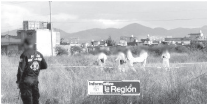
Un hombre ejecutado a balazos fue encontrado en un predio cubierto de vegetación ubicado al poniente de Morelia.

En el mencionado lugar se presentaron elementos de la Fiscalía General del Estado (FGE), adscritos a la Unidad de Servicios Periciales y Escena del Crimen (USPEC), quienes iniciaron las investigaciones respectivas y llevaron el cuerpo a la morgue.