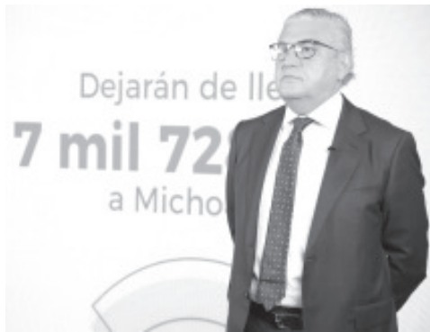
En infraestructura carretera en el año 2019 se asignaron al estado 985 millones de pesos, en el 2020 se etiquetaron, 569 millones; para el 2021 no habrá asignación de recursos en este rubro.

Al presentar un análisis de los recursos que dejarán de llegar al estado el próximo año, el funcionario estatal recordó que, el pasado mes de noviembre, los diputados federales de Morena y sus aliados en el Congreso de la Unión, aprobaron