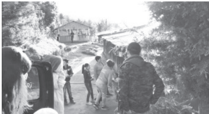
Tal decisión obedece a las indicaciones que les dieron los responsables del Programa Operación Pollo a nivel nacional de cancelar este año la actividad tradicional, por el Covid 19.

Para cuidar las medidas sanitarias, la entrega de hará en pequeños grupos evitando en todo momento las aglomeraciones. Por el momento ya se tienen trazadas las rutas que seguirán.