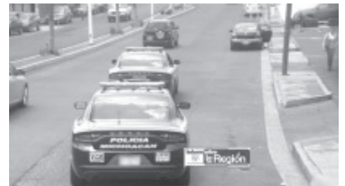
Se dijo que los hampones consiguieron un botín de más de medio millón de pesos y escaparon a bordo de un vehículo Honda.

Trascendió que los hampones consiguieron un botín de más de medio millón de pesos y escaparon a bordo de un vehículo Honda. El caso fue reportado a la instancia competente, a efecto de que emprenda las averiguaciones respectivas.