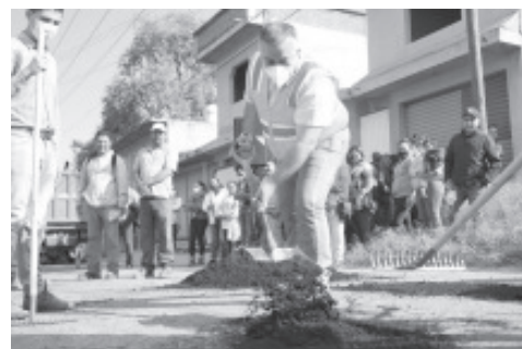
Mediante estos trabajos se facilitará el acceso a la comunidad y se podrán disminuir los accidentes relacionados con el mal estado del camino, además los vehículos que transitan por esta zona no presentarán ningún daño.