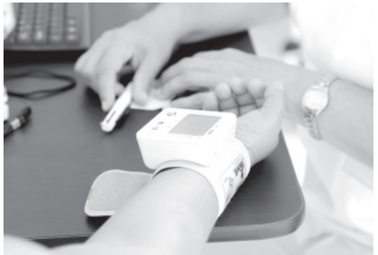
De las 2 mil 361 defunciones registradas por COVID-19 en la entidad, el 48.2% de los pacientes, mil 139, eran hipertensos.

En caso de tener presión arterial alta u otra enfermedad subyacente, la SSM recomienda llevar un estricto control de sus padecimientos, y seguir las medidas de cuidado que se han establecido para toda la población, como son el distanciamiento social, el lavado frecuente de manos y el uso de cubrebocas.