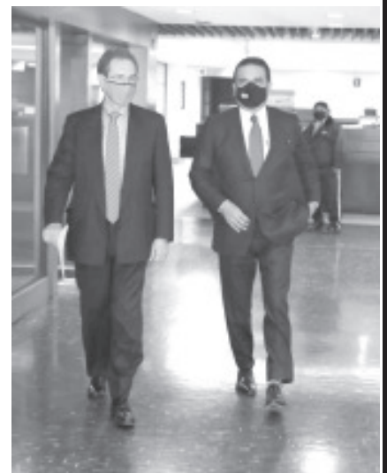
El mandatario refrendó que el Gobierno de Michoacán mantiene firme su convicción de encontrar una solución de fondo al conflicto educativo del estado.

“Nosotros seguiremos trabajando para resolver la situación de las y los maestros y garantizar que las y los niños y niñas de Michoacán reciban una educación de calidad”, aseguró Silvano Aureoles.