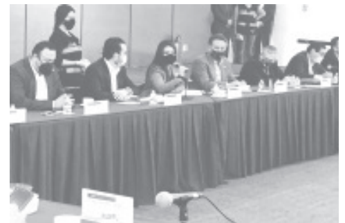
Mantenemos una comunicación permanente con las instancias de atención y defensa de los derechos humanos para trabajar en conjunto en favor de quienes se han visto violentados.

“Felicitamos y reconocemos la importancia de la labor de las personas defensoras de derechos humanos y periodistas por su incansable labor”, concluyó.