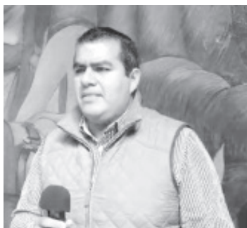
Se conformó una Coordinación Interinstitucional para atender el tema de Seguridad Pública, encabeza el Fiscal Regional y como coadyuvantes: Policía Michoacán, Guardia Nacional, Gendarmería y Gobierno Municipal.

Dejó claro que los asuntos que tienen que