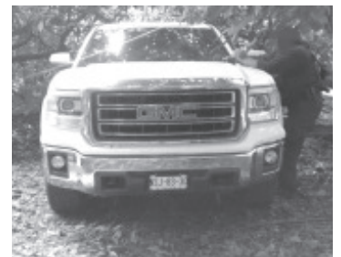
Con dispositivos de seguridad agentes de Policía Michoacán localizaron 4 automotores de las marcas Toyota, GMC, y Ford, los cuales están relacionados en la comisión de delitos.

La SSP hace un exhorto a denunciar a la línea de emergencias 911 todo acto que atente en contra de la tranquilidad de la población michoacana.