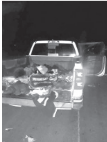
El resultado de las balaceras entre pistoleros rivales ocurridas la tarde noche del pasado miércoles al occidente de Michoacán fue de seis muertos y hubo dos detenidos.

La tragedia sucedió durante los últimos minutos del pasado jueves, en el municipio de Copándaro de Galeana. Al enterarse de la emergencia, los oficiales de la Guardia Nacional (GN), adscritos a la Dirección General de Seguridad en Carreteras e Instalaciones, acudieron al citado lugar para