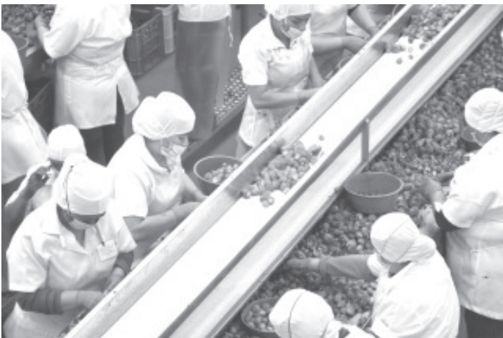
Ante el impacto económico del COVID-19, Michoacán se ubicó en el segundo mejor lugar nacional con el menor porcentaje de cierre de negocios hasta el mes de septiembre.

La institución explicó que “las medidas de confinamiento obligaron a los negocios a pausar sus actividades e incluso a cerrar definitivamente, pero también, se convirtió en una oportunidad de reconversión de muchas actividades económicas para adaptarse a las nuevas necesidades y tendencias”, de ahí la importancia del estudio, que realizan países como Reino Unido y Canadá.