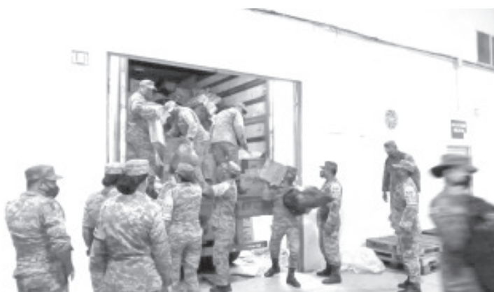
Integrantes de la Secretaría de la Defensa Nacional se encargaron de recibir las más de 28 toneladas de víveres y artículos no perecederos que se lograron recaudar en los centros de acopio de Michoacán.