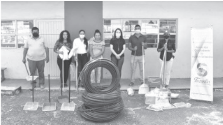
La edil hizo entrega de materiales de limpieza en la escuela primaria de la Tenencia del Salitre, dando respuesta a la solicitud realizada por el directivo de la escuela.