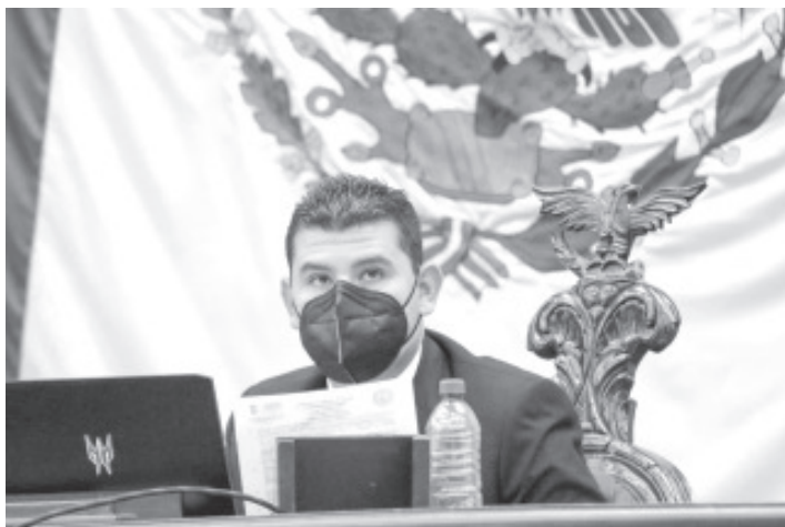
Ocampo Córdoba celebró que se incluyeran las tres reformas que propuso para la profesionalización de los servidores públicos municipales.

Tras la aprobación de la primera lectura del dictamen que contiene la nueva Ley Orgánica Municipal para Michoacán, el diputado Octavio Ocampo Córdoba celebró que se incluyeran las tres reformas que propuso para la profesionalización de los servidores públicos municipales, para la creación de direcciones para la atención a la mujer y para garantizar un lenguaje incluyente en este marco jurídico.