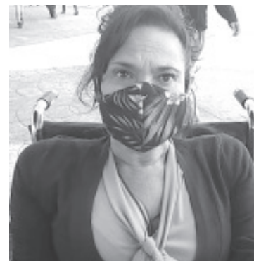
Este día, diciembre 3, no es para festejar porque no hay motivos para hacerlo, pero si debe servir para que las autoridades de los distintos niveles hagan conciencia en el tema.

Recalcó que este año a nivel local, no hubo ninguna actividad sobre el tema, pasó desapercibido, pero el año pasado se hizo un foro destinado a funcionarios públicos para que conocieran las obligaciones que tienen, así como los derechos de las personas con discapacidad, lamentablemente pocos asistieron, el alcalde llegó tarde y se comprometió a cosas que hasta la fecha