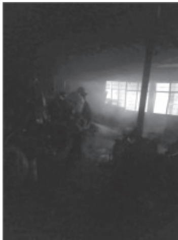
Socorristas del Cuerpo de Bomberos, atendieron esta madrugada dos incendios y a un hombre, herido, también hubo una mujer fallecida, en Valle Verde, Tenencia de Curungueo.

Después de casi tres horas de trabajo, los bomberos regresaron su base, cansados, pero satisfechos de haber cumplido una vez más, con su lema: "No te conozco, pero daría la vida por tí".