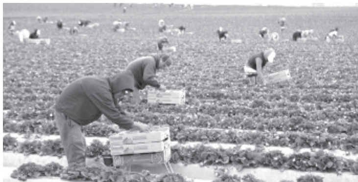
Actualmente no hay vacantes en aquellos países, por lo que ha optado por tomar los datos de quienes buscan un empleo de este tipo y en cuanto haya una oportunidad, los llaman.

Agregó que espera que en este mes se generen vacantes y de ser así, otros jornaleros agrícolas se estarían yendo a trabajar, en marzo o abril.