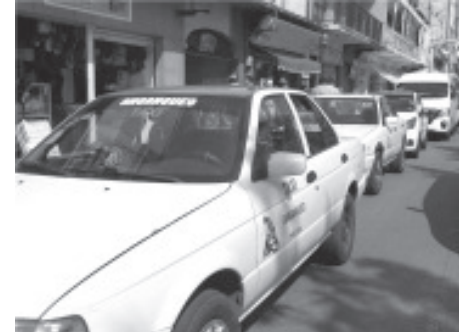
Sobre la avenida Revolución, desde Moctezuma hasta Ocampo, colocaron combis y taxis; sobre las unidades destacaron mensajes alusivos a sus demandas, principalmente “Alto a las extorsiones”.

Luego de entrevistarse con la autoridad local, optaron por retirar el bloqueo de la Avenida Revolución, pero si no hay respuesta de las autoridades, en los próximos días volverían a realizar acciones como ésta.