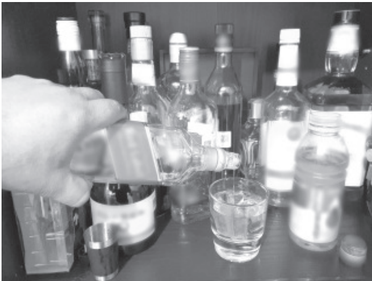
En muchos establecimientos ofrecen a sus clientes, en su mayoría a jóvenes, una mezcla de bebidas energizantes con vodka, ginebra u otro tipo de alcoholes, sin prever los daños a la salud.

Por ello, no deben ser consumidas por menores de edad, mujeres embarazadas, personas sensibles a la cafeína o a cualquiera de los ingredientes, personas con padecimientos cardiacos o deportistas.