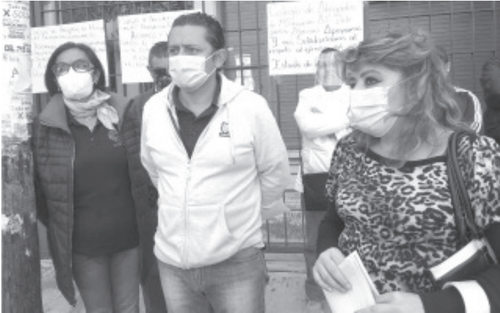
La acción se extendió al bloqueo de las oficinas de Rentas y de las calles Cuauhtémoc esquina con Salazar y Leandro Valle esquina con Cuauhtémoc; donde suspendieron la circulación vehicular.

- Paralizaron juzgados, Rentas y cerraron dos calles