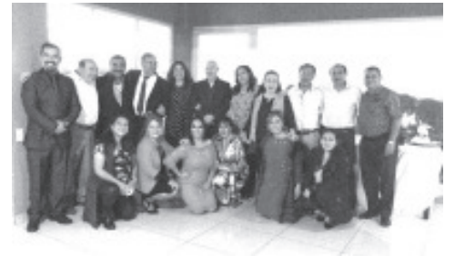
RECIBIERON RECONOCIMIENTOS En su 25 ANIVERSARIO Los Profesionales de Contaduría Pública de Zitácuaro A.C., ¡FELICITACIONES!