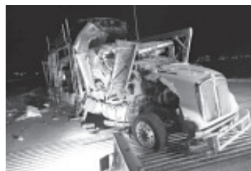
Un tráiler chocó contra tres tractocamiones sobre la autopista Pátzcuaro-Cuitzeo, a la altura del entronque con la autopista de Occidente, una persona falleció y otra resultó herida.