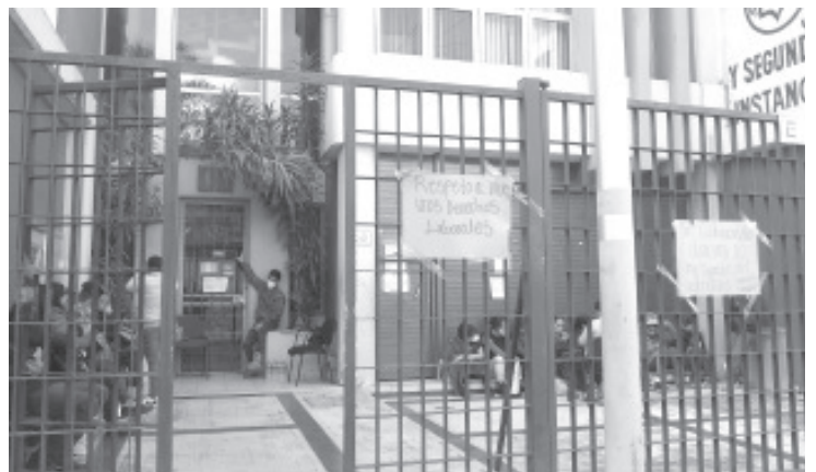
Esta acción incluyó los juzgados civiles y mercantiles, penales, del Nuevo Sistema de Justicia Penal, familiares y los de Ejecución de Sanciones. Se desarrolló de 8 de la mañana a 2 de la tarde.

"Nuestra manifestación es completamente pacífica, y solo la hacemos para mostrar nuestra inconformidad, creo que hemos realizado nuestro trabajo y merecemos nuestro pago, es un derecho que tiene todo trabajador", dijo el líder sindical.