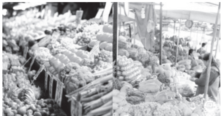
Cambiar a un sistema alimentario predominantemente vegano podría crear millones de oportunidades laborales en América Latina y el Caribe.

«El informe comparte lecciones oportunas para ayudar a guiar una recuperación posterior al coronavirus que prioriza la creación de trabajos decentes y un futuro más inclusivo, sostenible y resiliente», agregaron Rodríguez-Ortiz y Oumarou. «Este puede ser un camino para crear un mundo mejor para los trabajadores y las empresas y, al mismo tiempo, abordar la crisis climática».