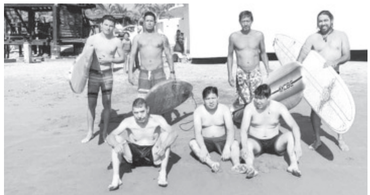
En playa Eréndira, surfistas de Lázaro Cárdenas salvaron a cinco bañistas durante un día y Protección Civil rescató a uno más.

Protección Civil indicó que estos incidentes se debieron al nivel del mal y falta de precaución.