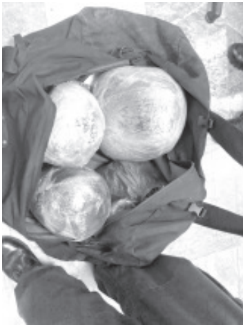
La Policía Michoacán fue alertada sobre la presencia de una maleta aparentemente abandonada al interior de un sanitario, al revisarla encontraron la droga.

Morelia, Michoacán, a 28 de noviembre de 2020.- En atención a un reporte, elementos de la Secretaría de Seguridad Pública (SSP), aseguraron una maleta que contenía 4.9 kilos de hierba verde seca, con las características propias de la marihuana.