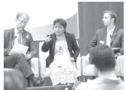
El premio reconoció el trabajo de la mexicana e indígena maya Leydy Pech, quien encabezó una coalición que detuvo con éxito la plantación de soya genéticamente modificada por Monsanto.

Este 2020, el premio Goldman también fue para otras seis mujeres: Kristal Ambrose, de las Bahamas, quien convenció a su gobierno de prohibir las bolsas de plástico de un solo uso, los cubiertos de plástico, las pajitas y los recipientes y vasos de poliestireno; Lucie Pinson, de Francia, que en 2017 presionó con éxito a los tres bancos más grandes y a las compañías de seguros de su país a eliminar la financiación de nuevos proyectos de carbón y empresas de carbón; y a Nemonte Nenquimo, de Ecuador, quien lideró una campaña indígena y una acción legal para proteger 500 mil acres de selva amazónica y el territorio Waorani de la extracción de petróleo.