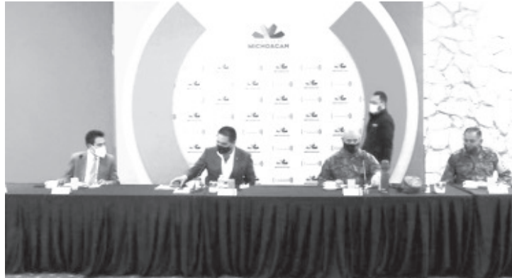
En el encuentro, destacó la posibilidad de la pronta aprobación del uso obligatorio del cubrebocas en Michoacán, que se discute en el Congreso del Estado.

-La posibilidad de la pronta aprobación del uso obligatorio del cubrebocas en Michoacán, se discute en el Congreso del Estado.