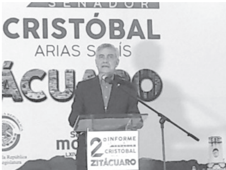
Llamó a los ciudadanos del oriente a reflexionar su voto en los próximos comicios electorales, es decir, elegir a los mejores que pueden dar seguimiento a la 4T.

- Convoa a elegir a los mejores en el siguiente proceso electoral