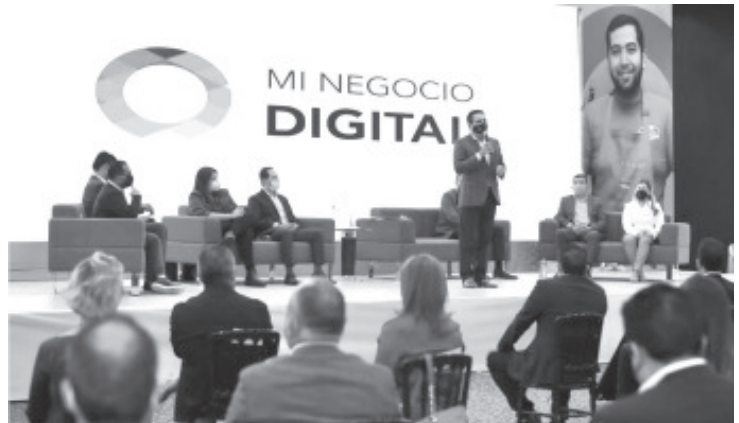
Lo que hoy estamos haciendo es un paso fundamental para el desarrollo económico de Michoacán, ante los retos que se tienen por delante, por la crisis económica generada por COVID-19,