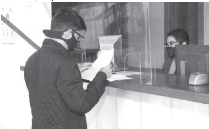
La SFA, pone a disposición de los michoacanos el número 070 opción 2, para la solicitud de información y asesoría en el rubro de trámites vehiculares.

Para mayores informes respecto a medidas de prevención e información general sobre el COVID-19, la Administración Estatal pone a disposición de la población el número 800-123-2890, con 11 líneas para resolución de dudas, así como un micrositio donde encontrarán toda la información disponible sobre COVID-19, ingresando a la liga bit.ly/MichCOVID-19.