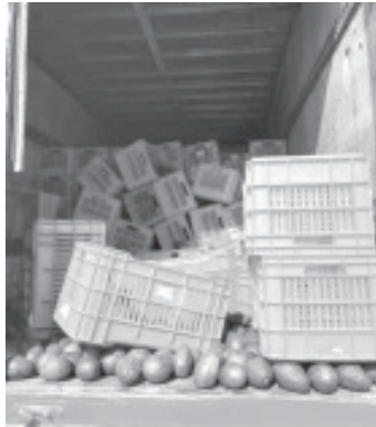
Los uniformados localizaron en el interior del vehículo 4 mil 220 kilos de aguacate, del cual Aron P., y Josué A., no presentaron la documentación que acreditara su legal procedencia.

Para solicitar de manera inmediata algún servicio de emergencia, la SSP invita a marcar a la línea 911, disponible las 24 horas del día.