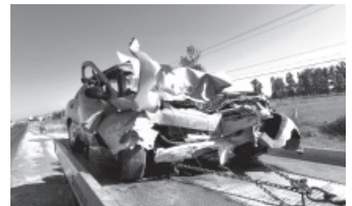
Una camioneta, un auto y un triciclo repartidor de pan protagonizaron un aparatoso choque en el que tres personas fallecieron y otras siete resultaron lesionadas.

Los uniformados acordonaron el área y alertaron a la Fiscalía General del Estado (FGE), posteriormente unos agentes de la Unidad de Atención Inmediata se encargaron de las investigaciones respectivas a efecto de determinar responsabilidades. Al final, unos peritos criminalistas llevaron los cadáveres a la morgue para la práctica de la necropsia de ley.