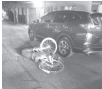
Un hombre que viajaba a bordo de su bicicleta fue asesinado de al menos tres balazos por sujetos desconocidos.

Finalmente, el cadáver fue trasladado al Servicio Médico Forense de la Región, donde se le practicaría la necropsia de ley, siendo iniciada la correspondiente carpeta de investigación.