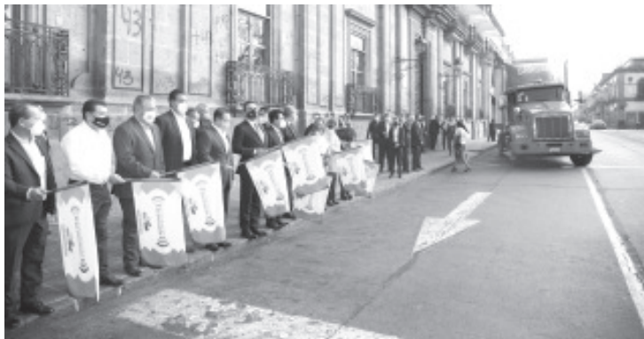
El pueblo de Michoacán envió un tráiler con cerca de 28 toneladas de víveres y artículos no perecederos para ayudar a los damnificados en Tabasco.

•Da Gobernador banderazo de salida al tráiler que transporta los víveres •Michoacán siempre ha estado y estará respondiendo ante el dolor y la necesidad de los demás, destaca Silvano Aureoles