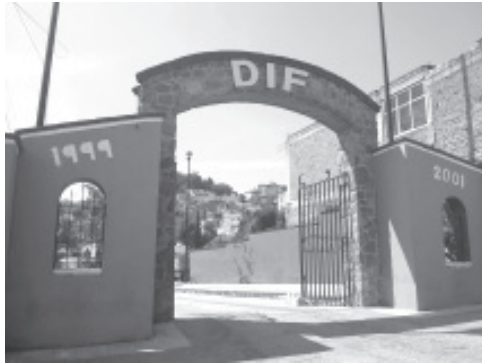
La dependencia ofrece de forma gratuita consultas médicas, psicológicas, y asesorías legales; además despensas a bajo costo, campañas visuales y apoyo diverso a quien lo solicite.

H. Zitácuaro Michoacán, 23 de noviembre de 2020.- Por: Guadalupe Solache Rebollo. Ninguno de los sectores vulnerables que atiende el DIF Municipal como adultos mayores, mujeres violentadas, menores de edad y discapacitados, quedarán desprotegidos, la dependencia trabaja para que continúen los programas sociales vigentes, esto a pesar de los recortes presupuestales que se han autorizado en los últimos meses.