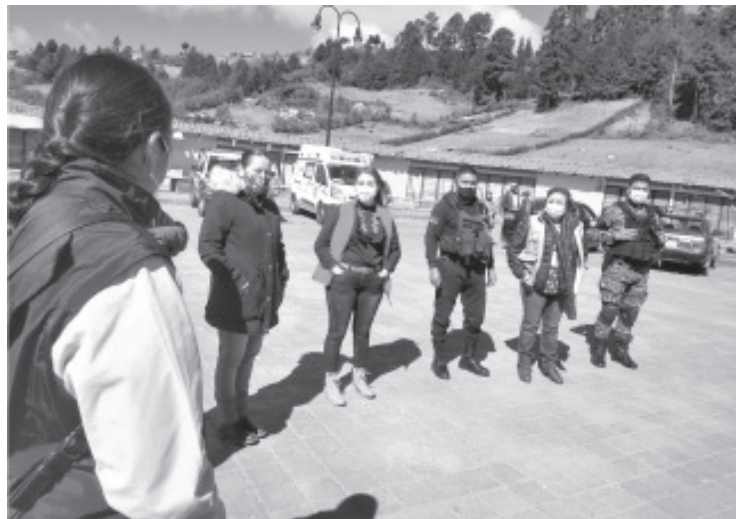
Se deben respetar las siguientes medidas de protección: instalación del filtro covid, así como reducción del aforo al 50% de los visitantes, sana distancia y grupos pequeños.