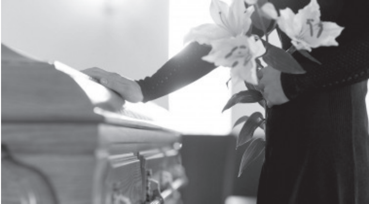
La causa de muerte del trabajador asegurado puede ser por riesgo de trabajo o enfermedad general, y cuando la muerte se deba a riesgo de trabajo no se requerirán semanas de cotización.

-La Ley del Seguro Social tiene prevista esta prestación económica que sirve en momentos críticos a la familia