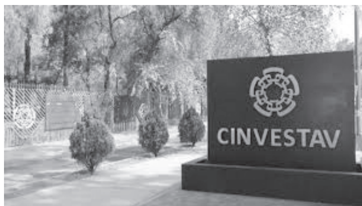
El país iba mejorando lentamente en el tema de la calidad y esperanza de vida, pero de repente ante el fenómeno de la violencia y con el problema de la infección por covid-19 se detuvo.