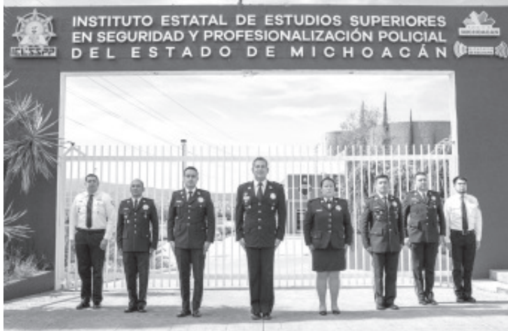
Al inicio de los trabajos de la antes llamada Academia Estatal de Policía, de noviembre de 1990 a enero de 1992, se graduaron 390 elementos del curso básico.

-El instituto de formación policial ha sido punta de lanza en materia de capacitación nacional e internacional