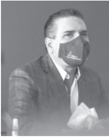
Descuidarnos significaría retroceder y en consecuencia tener problemas en la reapertura económica y volver a paralizar las actividades económicas, eso no queremos hacerlo.