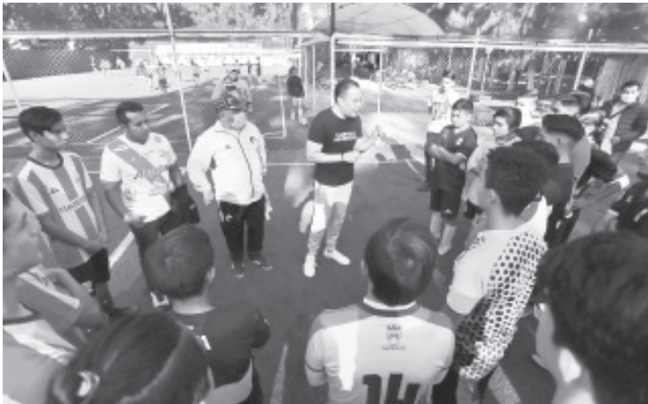
Carlos Herrera refrendó el compromiso de buscar una alianza real para transformar las condiciones de vida de las y los michoacanos.

construir un proyecto viable, claro y conciso a través del diálogo horizontal con las y los michoacanos que habitan cada rincón de la entidad.