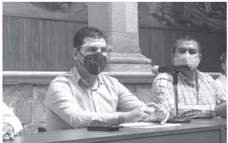
Ocampo Córdoba, negó que se haya endeudado a Michoacán, dijo que este asunto es una mentira de representantes de Morena, que quieren darle un rumbo político.

Agregó que en meses atrás el personal, ha recibido capacitación por parte del Gobierno Federal para adaptar los programas actuales a las nuevas reglas de operación y con ello cumplir con las disposiciones vigentes y al mismo tiempo tener oportunidad de recurrir cuando se requiera apoyo.