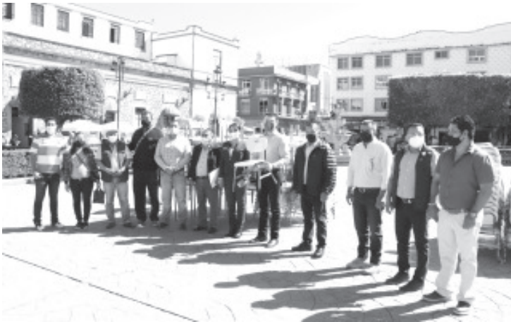
Es un reto para su Gobierno, la educación, y con estrategia se replantarán los mecanismos para no dejar de atender: la salud, el desarrollo social, la seguridad y la inclusión social.

-Entregan autoridades estatales y municipales, mobiliario para escuelas del municipio por un monto superior a los 700 mil pesos.