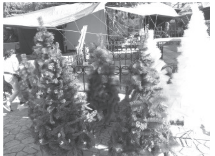
Los comerciantes de esta temporada mantendrán los mismos precios del año pasado. Están conscientes de los problemas económicos que se viven las familias zitacuarenses, por la pandemia.

Como acuerdo con la autoridad, en cada puesto hay un número limitado de personas, todos deben usar de forma obligatoria el cubrebocas y disponen de gel antibacterial.