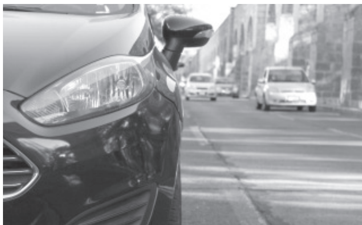
Se mantiene la extensión del periodo de pago sin multas y recargos del Refrendo Vehicular 2020, el cual tendrá también como fecha límite de aplicación el lunes 30 de noviembre.

Para mayores informes respecto a medidas de prevención e información general sobre el COVID-19, la Administración Estatal pone a disposición de la población el número 800-123-2890, con 11 líneas para resolución de dudas, así como un microsítio donde encontrarán toda la información disponible sobre COVID-19, ingresando a la liga bit.ly/MichCOVID-19.