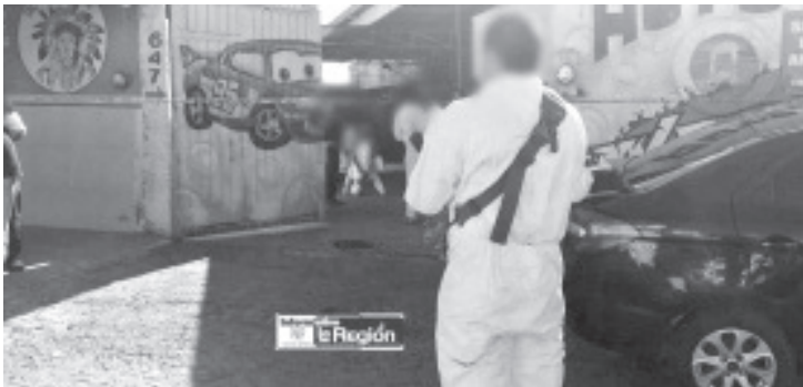
De un balazo en la cabeza fue asesinado un hombre al interior de un autolavado ubicado en la colonia Ejidal Francisco Villa, cerca de Santiaguito.

Del o de los homicidas solo se conoció que huyeron a bordo de una camioneta. Los oficiales acordonaron el área y solicitaron la intervención de la Fiscalía General del Estado (FGE), luego se presentó la Unidad de Servicios Periciales y Escena del Crimen (USPEC), la cual inició las investigaciones correspondientes.