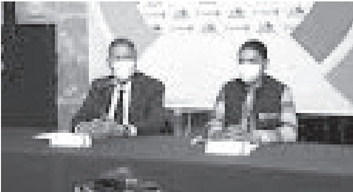
La aglomeración de personas sigue representando un alto riesgo y por disposición se deben suspender las actividades masivas y fiestas patronales, a partir del 20 de noviembre.

Ante los medios de comunicación, Arróniz Reyes indicó que en los siguientes días se buscará trabajar con organizaciones y comerciantes que se instalaban en esta área de la ciudad para crear soluciones y no se afecte la economía de quienes ofertan sus productos a las y los capitalinos.