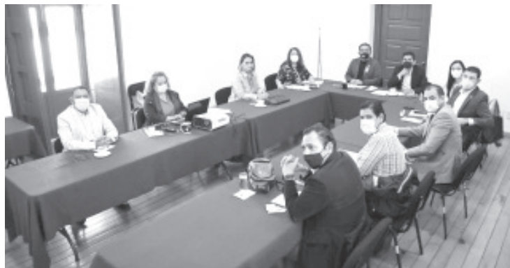
Integrantes de las Comisiones Unidas de Programación, Presupuesto y Cuenta Pública, y de Hacienda y Deuda Pública, en reunión, aprobaron el dictamen que reforma el Artículo 26 de la Ley de Ingresos del Estado.