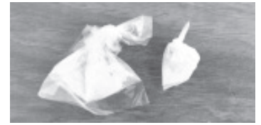
Los elementos fueron alertados sobre un hombre, quien se encontraba realizando alteraciones al orden público sobre la calle Guadalupe Victoria, al revisarlo le encontraron la droga.

La SSP invita a la población a contactarse a las líneas 911 o 089, para solicitar algún servicio de emergencia.