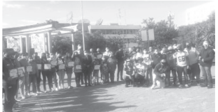
Por el virus del Covid 19, este año la celebración del 110 aniversario de la Revolución Mexicana se redujo al izamiento de Bandera y a un acto cívico alusivo a esta fecha.

En entrevista, destacó que ya se han comenzado a registrar descensos en la temperatura, principalmente donde tiene más efecto es en las comunidades que se