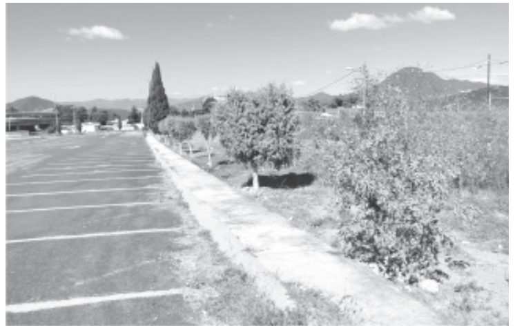
Por la edad del árbol y otras condiciones, los más grandes no lograron resistir el cambio y se secaron, sólo los más jóvenes siguen verdes.

Asimismo, agregó que por el momento, quedan alrededor de 20 árboles sobre Revolución Sur, los cuales también serán retirados; ellos en cambio serán reubicados a la comunidad de Lindavista donde hay espacio en una unidad deportiva que tiene áreas verde.