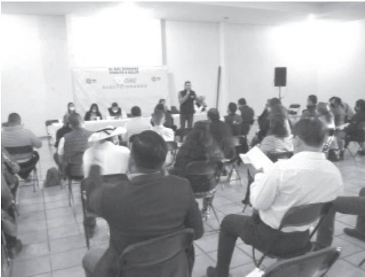
El PRD está trabajando, debemos tener a las personas preparadas para darle al proceso que vamos a vivir en el 2021 en Michoacán, vamos a dar la batalla porque vamos a reafirmar el gobierno en el estado.

- Visita Zitácuaro donde se reúne con dirigentes municipales