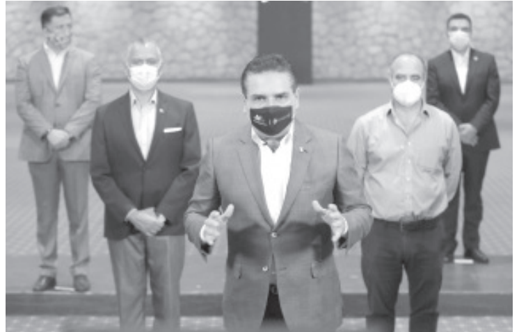
Quienes hoy tienen tomadas las vías del tren, no llegan ni a 5 personas y el daño es al patrimonio y bienestar de millones de michoacanos y michoacanas.

Reiteró el llamado para que el Gobierno del Presidente Andrés Manuel López Obrador y la Secretaría de Gobernación, Olga Sánchez