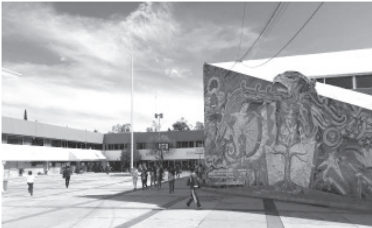
Es una medida de control que advierta a las y los jóvenes estudiantes que no se seguirán tolerando actos vandálicos ni de violencia para exigir se cumplan sus demandas.

Asimismo hizo un exhorto a las y los jóvenes a abstenerse de participar en este tipo de manifestaciones y conductas, que sólo afectan su imagen, perjudican y causan un impacto negativo en la sociedad.