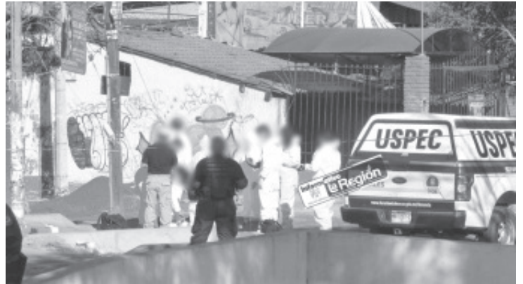
Un hombre fue ultimado a balazos en la vía pública de la colonia Felicitas de Río, justo frente a una de las entradas de Ciudad Universitaria.

Morelia, Mich.- Jueves 19 de noviembre de 2020.- Un hombre fue ultimado a balazos en la vía pública de la colonia Felicitas de Río, justo frente a una de las entradas de Ciudad Universitaria (C. U.), en la capital michoacana.