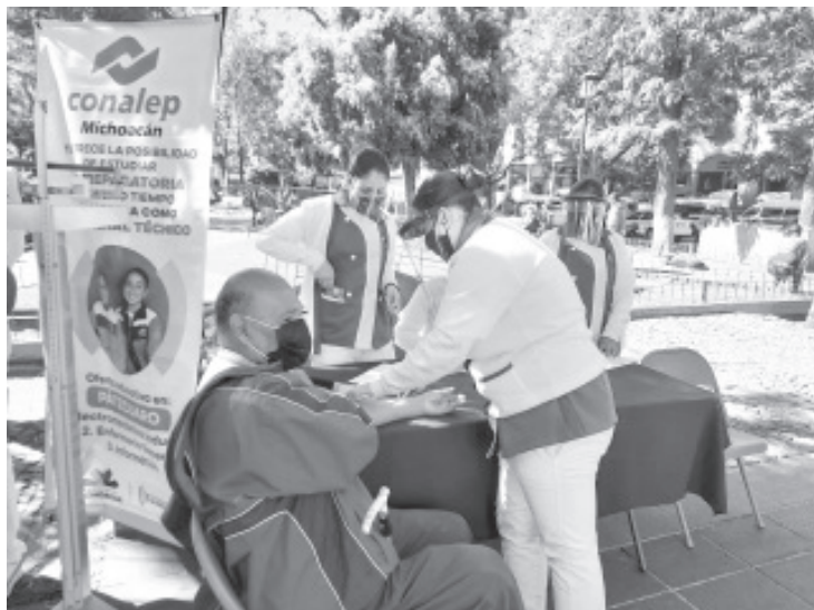
El propósito de entregar esta presea es reconocer el desempeño del personal de enfermería que presta sus servicios en los planteles del Colegio.

Finalizó al decir que actualmente, el Conalep ofrece la carrera de enfermería en 8 planteles y cuenta con una matrícula de 2 mil 810 estudiantes atendida por una plantilla de 50 docentes del área de la salud, además de 615 enfermeras y enfermeros pasantes en servicio social.