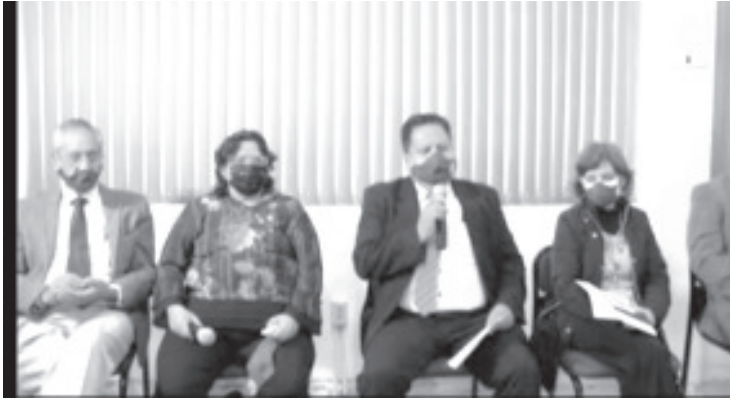
En el XXV Aniversario de la Universidad Pedagógica Nacional, Unidad 164, los días 27 y 28 de noviembre se llevará a cabo el 4º Foro Regional de Licenciaturas: "Construyendo la Ciudadanía Digital"

H. Zitácuaro Michoacán, 20 de noviembre de 2020.- Por: Guadalupe Solache Rebollo. Como parte de las actividades para conmemorar el XXV Aniversario de la Universidad Pedagógica Nacional, Unidad 164, durante los días 27 y 28 de noviembre se llevará a cabo el 4º Foro Regional de Licenciaturas, que ha sido denominado "Construyendo la Ciudadanía Digital".