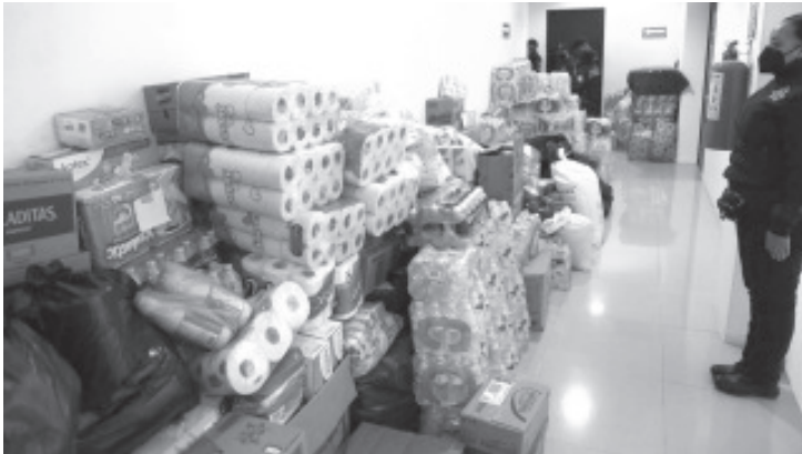
Los víveres fueron trasladados desde las instalaciones de la SSP en 12 patrullas de las diferentes corporaciones de la Policía Michoacán, hasta el módulo instalado en la Plaza Melchor Ocampo.

-Alimentos, artículos de limpieza y aseo personal fueron entregados en el centro de acopio de la plaza Melchor Ocampo, de Morelia -Lo recaudado será enviado a Tabasco como muestra de solidaridad con las personas damnificadas