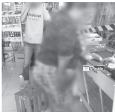
Un joven fue atacado por otros a bordo de motocicletas, y se refugió en un minisuper donde le dispararon, pero hirieron a una mujer y un niños, no están graves.

Al lugar del atentado llegó el personal de la Fiscalía General del Estado, cuyos peritos embalaron cinco casquillos percutidos para arma corta e integraron la carpeta de investigación correspondiente.