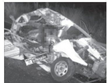
El coche particular terminó completamente deshecho y el copiloto quedó atrapado entre los hierros retorcidos de la unidad, mientras que el chofer quedó malherido y fue canalizado a un nosocomio.

Los peritos y los agentes de la Fiscalía General del Estado se encargaron de realizar las actuaciones respectivas y de trasladar el cadáver a las instalaciones del Servicio Médico Forense para la práctica de los estudios competentes. Las corporaciones de auxilio locales fueron las que ayudaron en las maniobras de rescate.