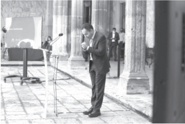
En primer lugar voy a recorrer las calles, pueblo por pueblo, camino por camino, ciudad por ciudad. Voy a llegar de todas las formas posibles a cada rincón, porque quiero seguir escuchando a la gente.

-Inicia su sueño por la búsqueda de un proyecto ciudadano, “sin pedir prestado ningún color ni alguna marca”, destaca