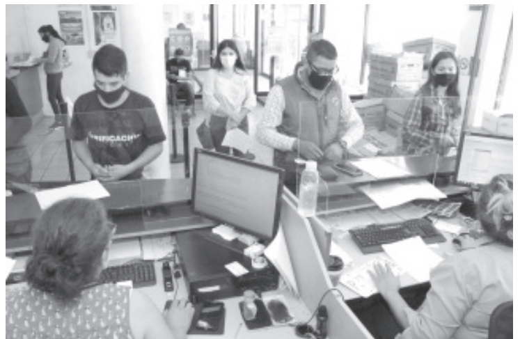
El objetivo de la SFA es el de ofrecer un abanico más amplio de opciones a la ciudadanía para el cumplimiento del pago de sus contribuciones en el rubro de trámites vehiculares.

Para mayores informes respecto a medidas de prevención e información general sobre el COVID-19, la Administración Estatal pone a disposición de la población el número 800-123-2890, con 11 líneas para resolución de dudas, así como un microsítio donde encontrarán toda la información disponible sobre COVID-19, ingresando a la liga bit.ly/MichCOVID-19.