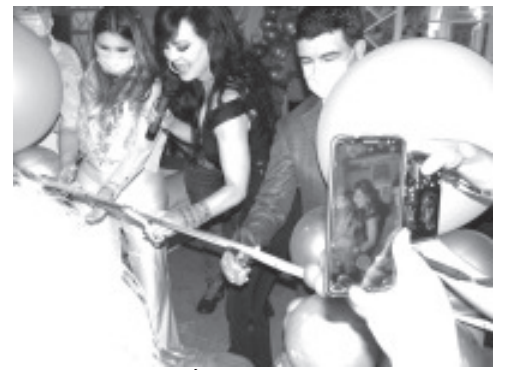
CORTANDO EL LISTÓN INAUGURAL Al Abrir sus Puertas "CANDY SPA Y TE" "La guapa Actriz y Madrina MARIBEL GUARDIA.