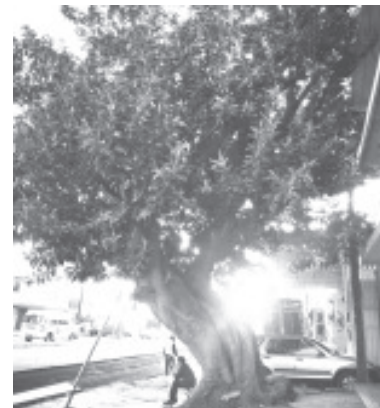
Sobre el derribo de un árbol emblemático en Revolución, casi esquina con Mora del Cañonazo, reiteró la petición a la SCOP que lo respetaran y fuera contemplado en la nueva imagen urbana.

Aseguró que él es el principal aliado para continuar cuidando los recursos naturales y el entorno del municipio. Agradeció el interés de la población en la protección de la ecología. Sentenció que este rubro no dejará de ser elemental en la agenda pública de su Gobierno.