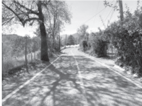
Con este tipo de obras se refleja el trabajo intenso que se realizó este año en cuanto a obra pública a pesar de los recortes presupuestales y en donde los trabajos reflejan el buen manejo de los recursos en el municipio, partes del municipio.