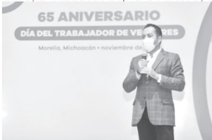
“Todo el equipo de la Secretaría de Salud representa un ejemplo para las y los michoacanos. Son un ejemplo de cómo sí es posible hacer las cosas y tener buenos resultados”.

Finalmente, el secretario de Gobierno puntualizó que tener a personal experto en la SSM, llena de esperanza ante las adversidades generadas por el COVID-19, lo cual ha permitido que en Michoacán, sean atendidas con integralidad y calidad a las personas contagiadas de SARS-CoV-2.