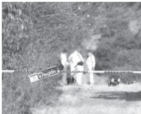
El finado es un desconocido, de entre 30 y 35 años de edad, de piel morena y de compleción media; vestía un pantalón de mezclilla de color azul, una playera negra y calzado de color café.

A la escena del crimen acudieron los agentes y peritos de la Fiscalía General del Estado, quienes realizaron el procesamiento del área de intervención y de igual forma realizaron el levantamiento de los cuerpos. Siendo iniciada la correspondiente carpeta de investigación.