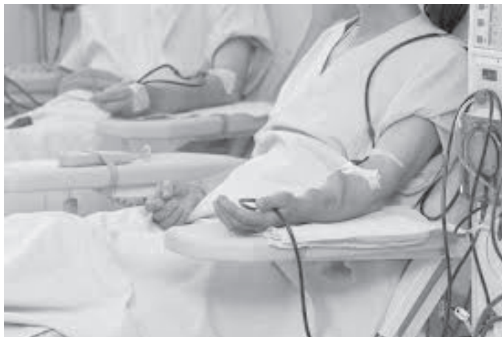
El daño renal ocasionado por la diabetes se denomina nefropatía diabética.

Alrededor de uno de cada cuatro adultos con diabetes tiene deficiencias renales.2