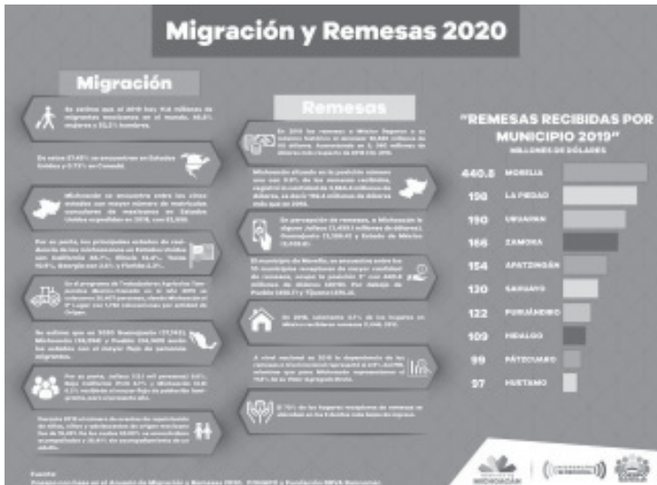
Entre los municipios de la entidad, a Morelia le siguen La Piedad (198 millones de dòlares), Uruapan (190), Zamora (166), Apatzingàn (154), Sahuayo (130), Puruãndiro (122), Hidalgo (109), Pátzcuaro (99) y Huetamo (97).