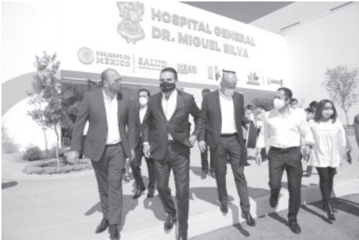
Con estas dos magnas obras y el fortalecimiento en toda la red de 27 hospitales regionales, 430 centros de salud y más de 900 casas de salud, "Michoacán está destinado a tener los mejores servicios de salud en el país"

Morelia, Michoacán, a 12 de noviembre de 2020.- Michoacán cuenta ya con el complejo hospitalario más grande de los últimos años, el que se convertirá en gran fortaleza para atender la salud del estado, afirmó el gobernador Silvano Aureoles Conejo, al encabezar la inauguración del Hospital General "Dr. Miguel Silva" y el Hospital Infantil "Eva Sámano de López Mateos".