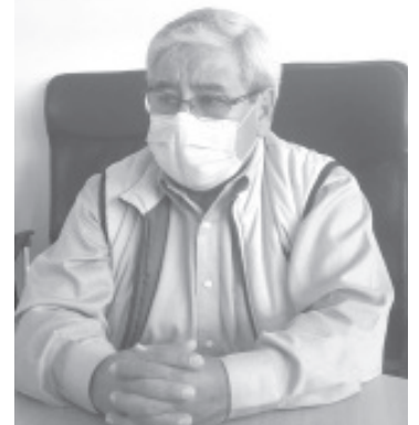
Los beneficios de este programa consisten en que los usuarios solo pagan 11 meses y les descuentan uno, además el pago se hace con la tarifa del 2020 y evitan pagar de más.

El descuento del 50% a los adultos mayores se les respeta, siempre y cuando se demuestre que ellos viven ahí o que sean los titulares. Esto como una forma de garantizar que se benefician con el descuento.