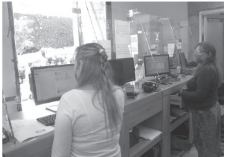
Los ingresos obtenidos son buenos, cuando apenas ha pagado el 56% de los usuarios, pero ha ayudado el hecho de que en los tres bimestres del año, se han condonado multas y recargos.

Aunque dijeron que no quieren más acciones como esta, sí continúa la falta de respuesta, aseguraron se verán obligados a realizar bloqueos carreteros y la toma de otras dependencias.