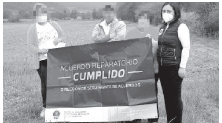
La FGE a través del Centro de Mecanismos Alternativos de Solución de Controversias (CMASC) logró la restitución de un inmueble a su legítima propietaria, hechos ocurridos en el municipio de Angangueo.

La FGE, refrenda su compromiso de hacer valer las disposiciones establecidas en el Sistema de Justicia Penal, para que las víctimas de un delito ejerzan su derecho de acceder a la justicia y a la reparación del daño.