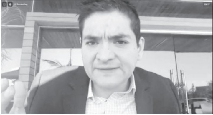
Con hacer su pago del 2020, entre noviembre y diciembre, se les hará el descuento del 100 por ciento, con eso se borra su deuda anterior y estaràn regulares,

-Se otorgaràn descuentos del 100% de las deudas de años anterior para dueños automòviles particulares y del transporte pùblico. -El apoyo permanecerà vigente en noviembre y diciembre, una vez que haya sido aprobado por el Poder Legislativo.