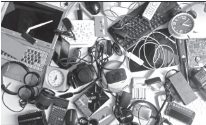
Desecha todos los electrónicos y electrodomésticos que llevan años arrumbados en tu hogar, en tu oficina o espacio de trabajo y, que además de estorbar en tu entorno, generan contaminación.

Puntualizó que no existe ningún fin de lucro, por el contrario es una actividad que la administración municipal coordina con una empresa legalmente constituida que reutiliza un porcentaje mínimo de estos materiales, pero que el beneficio para la población es sustancial.