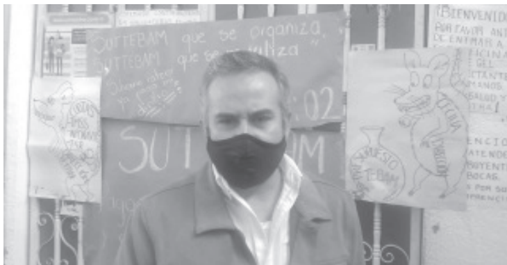
Convocaron al mandatario estatal a cumplir con lo que le corresponde ya que está afectando a cientos de familias, cuyo sustento depende del salario que ellos aportan.