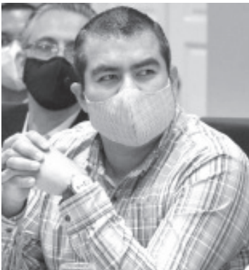
Hernández Suárez precisó que estas nuevas disposiciones obedecen al equilibrio logrado en el municipio, gracias a la responsabilidad y participación ciudadana.

- Gracias a la responsabilidad y participación ciudadana, el municipio continúa en Bandera Verde epidemiológica. - Giran circular a todos los comercios para que apliquen los nuevos lineamientos.