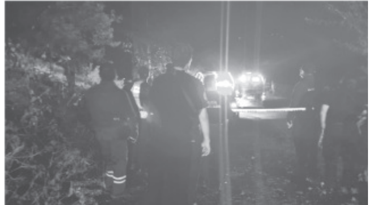
El conductor de una camioneta Ford Ranger Pick Up, perdió el control del vehículo y se salió en una curva, yendo a caer a un barranco y falleció.

Los socorristas esperaron la llegada del personal judicial y de Policía Michoacán, para que se hicieran responsables del caso.