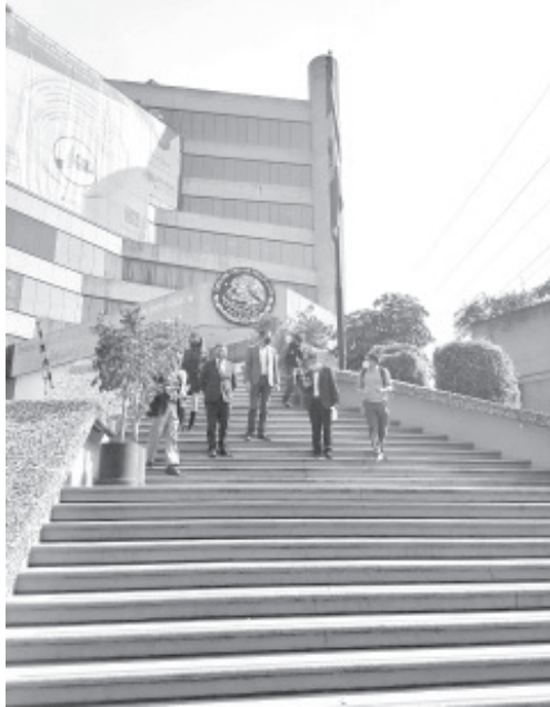
En el año 2020 se han presentado 53 denuncias, integrándose 52 carpetas de investigación, "sin que a la fecha se tenga conocimiento de que se haya ejercido ninguna acción legal".

-Líderes de organismos empresariales de Michoacán destacan que en 2020 han presentado 53 denuncias por este delito y no conocen de alguna acción penal ejercida -La queja ante la FGR fue presentada en la Ciudad de México por una representación integrada por los presidentes de Canacintra Morelia, Canainma y Aiemac