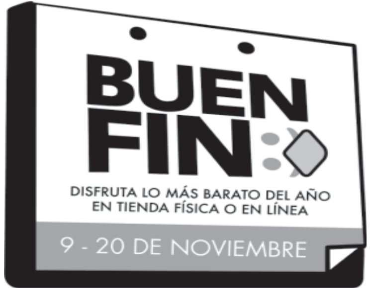
En años pasados, el BuenFin no ha interesado a todos los agremiados de la CANACO, y solo participa en el programa alrededor del 60%, hoy oficialmente la Camara no participa.