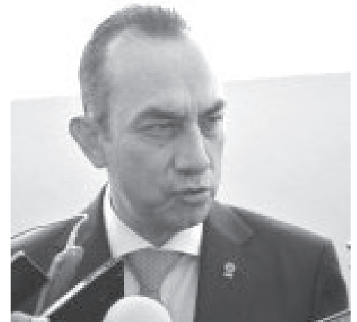
El diputado calificó motivo de preocupación nacional, la postura asumida por el Gobierno Federal en torno al proceso electoral en los Estados Unidos.

En el jardín central hay dos uniones de lustradores de calzado, la que se denomina Benito Juárez con 24 agremiados y la Melchor Ocampo con alrededor de 14.