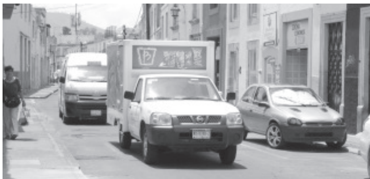
Los apoyos estarán dirigidos a todo tipo de vehículos, incluyendo transporte público en adeudos del automotor, así como en sus concesiones.

Morelia, Michoacán, a 10 de noviembre de 2020.- El Gobierno de Michoacán, en el marco del programa federal Buen Fin, activó a partir de este nueve de noviembre el esquema de apoyo a la economía de las familias en trámites vehiculares, el cual consta de descuentos en multas y recargos para todo tipo de vehículos, incluyendo