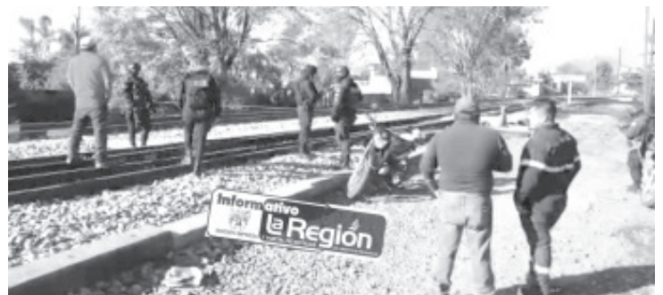
El cadáver yacía cerca de donde los agremiados de la Coordinadora Nacional de Trabajadores de la Educación mantienen el bloqueo a las vías.

Los patrulleros acordonaron el área, después arribaron los especialistas de la Unidad de Servicios Periciales y Escena del Crimen (USPEC), dependiente de la Fiscalía General del Estado (FGE), quienes comenzaron las averiguaciones correspondientes y trasladaron los cadáveres a la morgue.