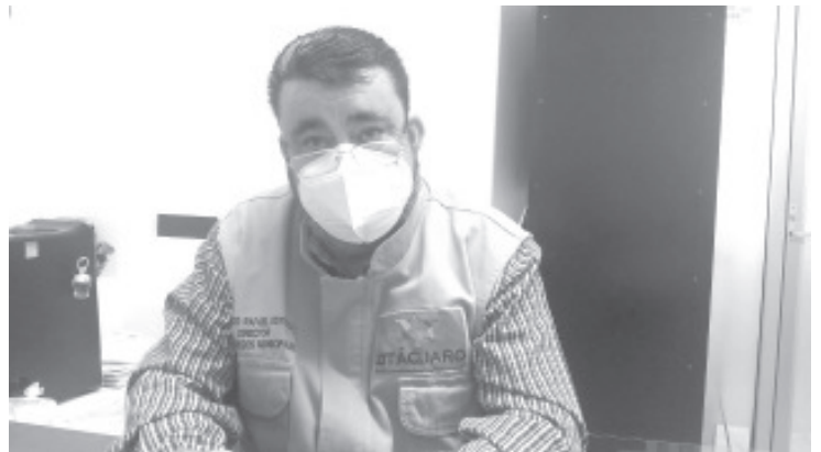
“La reapertura económica no implica que la epidemia este superada, sin embargo la autoridad determinará semanalmente el nivel de alerta”, en apoyo a mejorar sus ventas.

fiestas, bailes siguen sin permiso y el personal de la dependencia estará vigilante de que los horarios se acaten, con la aplicación de las medidas sanitarias ya conocidas.