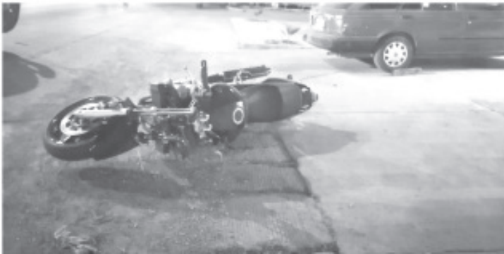
Una señora de 76 años perdió la vida al ser atropellada por una motocicleta, cuyo conductor, resultó con varias fracturas, según la valoración previa realizada por socorristas del Cuerpo de Bomberos.

El conductor del que no se dieron sus datos personales, presentaba posibles fracturas en fémur izquierdo, rótula y pelvis, por lo que fue trasladado por el Cuerpo de Bomberos al hospital regional.