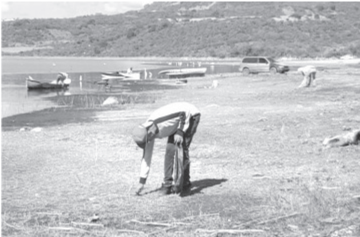
Solicitarán al ayuntamiento la instalación de un contenedor permanente para almacenar la basura que se genere en este sitio.

Baños Gomora, reiteró que la presa del bosque es uno de los lugares simbólicos de Zitácuaro y además a este lugar acuden muchas personas que nos visitan, por lo tanto debe estar en buenas condiciones y dar una buena imagen. En este sentido invitó a quienes acuden a no tirar basura y mantenerla limpia.