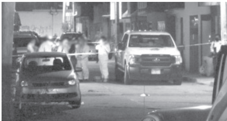
El hecho ocurrió la noche de este lunes en un inmueble de la calle Apolinar Martínez, casi esquina con Santiago Tapia, a una cuadra de la avenida Michoacán.

Voces policíacas dijeron a esta agencia de noticias que el finado está en calidad de desconocido, es de entre 20 y 25 años de edad, se espera que sus seres queridos acudan a reclamarlo a las instalaciones del Servicio Médico Forense, ahí fue trasladado para la práctica de los estudios respectivos.