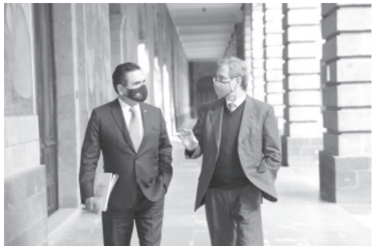
El Gobernador Silvano Aureoles se reunió con el secretario de Educación Pública, Esteban Moctezuma, para revisar el cumplimiento de varios acuerdos en materia educativa.

Aureoles Conejo, reiteró que se camina con paso fuerte hacia un nuevo modelo educativo que sirva a Michoacán para atender las demandas de maestras, maestros y alumnos, con una educación de calidad y pagos justos a profesores.