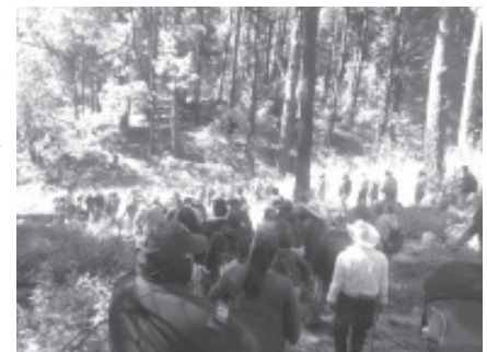
Integrantes de la Mesa de Seguridad Ambiental con los vecinos de Crescencio Morales, se llevó a cabo un recorrido por los bosques que rodean a esta tenencia.

Cabe mencionar que al inicio de esta semana, se instaló en Crescencio Morales, la Mesa de Seguridad Ambiental conformada por las fuerzas de seguridad, tales como: el Centro de Inteligencia, la Guardia Nacional, Fiscalía Regional, Policía Michoacán y Policía Municipal, continuando con la implementación de este esquema que también ya fue constituido en Nicolás Romero y Zirahuato, con el mismo fin.