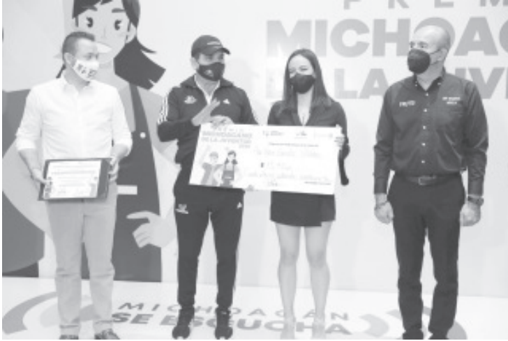
Michoacán necesita a sus: El Gobernador reconoció a quienes hoy fueron galardonados por poner en alto la grandeza de Michoacán, de quienes dijo, su esfuerzo y talento serán ejemplo para otras y otros jóvenes.

Morelia, Michoacán, a 4 de noviembre de 2020.- Vivimos un momento importante y Michoacán tiene que estar a la vanguardia de los acontecimientos, al frente de la defensa de México y para eso necesitamos a nuestras y nuestros jóvenes, dijo el Gobernador Silvano Aureoles Conejo, al presidir la entrega del Premio Michoacano de la Juventud 2020.