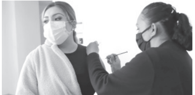
La vacuna reduce la aparición de enfermedades relacionadas con la influenza, así como el riesgo de sufrir complicaciones graves que pueden dar lugar a hospitalizaciones o incluso la muerte.

En caso de presentar fiebre mayor a 38 grados, dolor de cabeza, tos, malestar general, dificultad para respirar, falta de apetito, dolor muscular, congestión nasal, diarrea o vómito, se recomienda no automedicarse y acudir a su unidad de salud más cercana para ser atendido por un especialista.