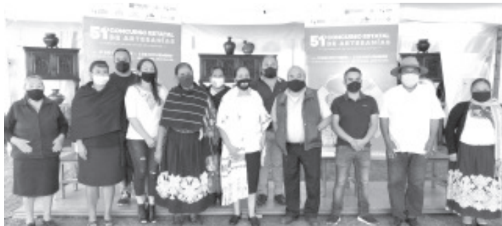
Las piezas vendidas fueron adquiridas por turistas nacionales y extranjeros provenientes de Europa de lugares como Francia y España; de EU como Nueva York, Washington, y México.

Detalló que lo anterior se realiza como fue la inscripción del concurso y todo este evento, cuidando todas las medidas preventivas para evitar la propagación del virus del COVID-19, es decir, todo el sector artesanal que vaya por su premio y piezas deberá usar el cubrebocas y se les estará proporcionando gel antibacterial, además de contar con tapetes sanitizantes en la entrada del Antiguo Colegio Jesuita.