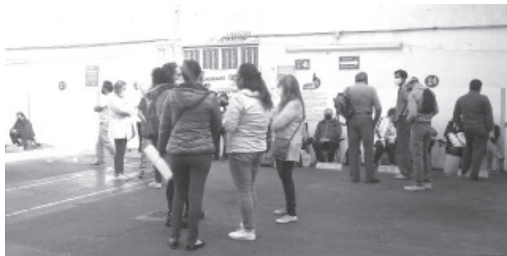
El reclamo consiste en la falta de pago de 5 bonos a más de 32 mil maestros que tienen plaza estatal y cuyo adeudo consideró que es millonario porque se ha ido incrementando.

De continuar la falta de pago de estos bonos, en los siguientes días, adelantó que se espera realizar otras acciones como bloqueos carreteros, liberación de la autopista, y la toma de otras dependencias.