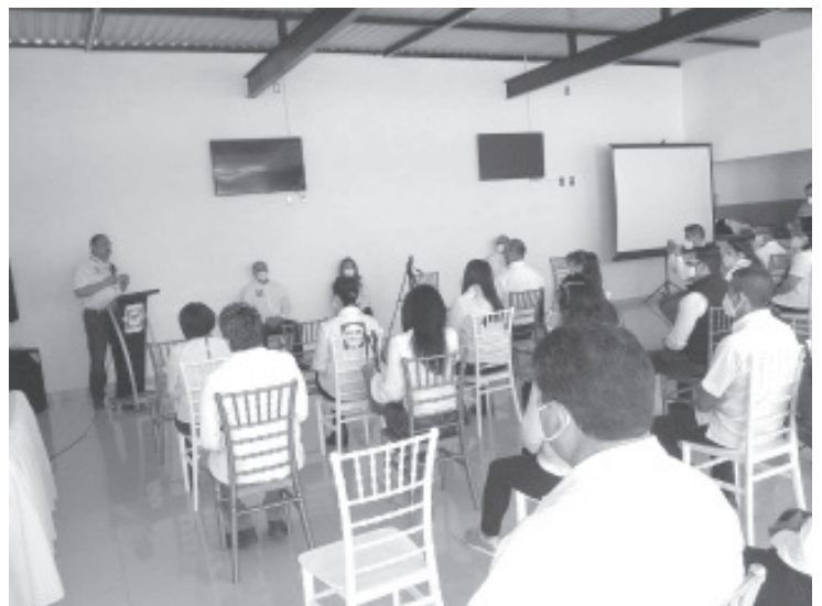
Consideró que es necesario aprender y hacer una política diferente, esto será posible diciendo la verdad, de la situación que se vive a nivel nacional y estatal.