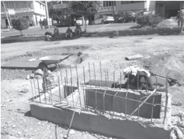
Vecinos aseguran que las ventas han bajado más del 90%, son pocos los que se animan a opinar, señalan que no tiene caso porque la autoridad no los toma en cuenta.

H. Zitácuaro Michoacán, 06 de noviembre de 2020.- Por: Guadalupe Solache Rebollo. Con la inconformidad de quienes viven en esa zona, hace dos meses inició la obra de modernización de la Avenida Revolución Sur, en su segunda etapa que abarca desde la esquina con Leandro Valle hasta el entronque con la salida a Toluca.