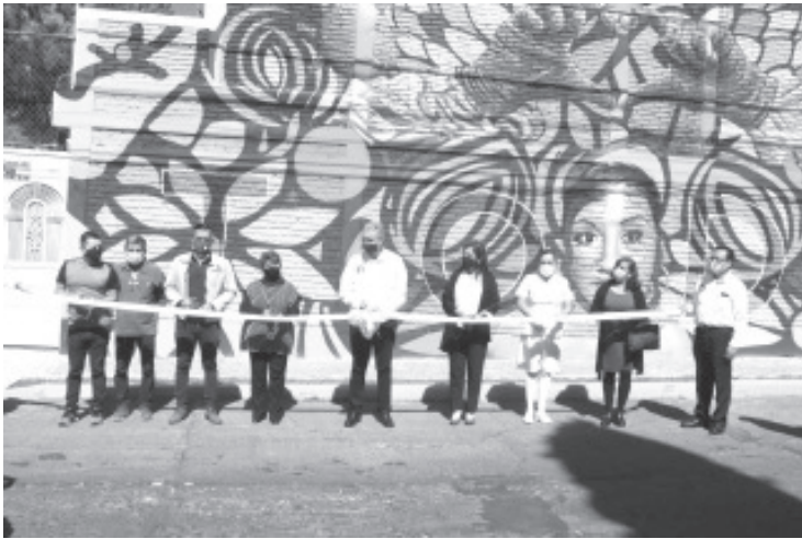
Entre las cosas que se deben aprender de la actual emergencia sanitaria es que existen pérdidas humanas entre el personal del IMSS y que la población debe hacer conciencia en materia de prevención.

Con el objeto de preservar su memoria y homenajear al personal fallecido en la presente emergencia sanitaria, se inauguró un muro en las oficinas sindicales con los rostros de trabajadoras y trabajadores del Instituto Mexicano del Seguro Social (IMSS) en Michoacán.