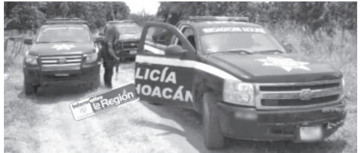
Varios sujetos armados realizaron disparos contra los agentes en la ranchería de El Pedregal, cerca de la carretera Morelia-Ciudad Hidalgo.

El caso fue reportado a la Fiscalía General del Estado (FGE) y se espera que sus especialistas emprendan las correspondientes investigaciones del asunto.