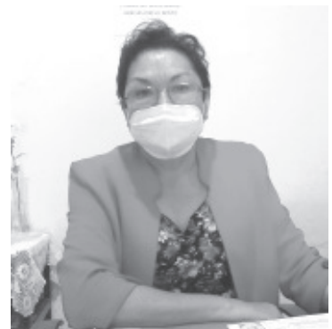
Para cualquier trámite de Hacienda es vital la firma electrónica, por lo que en adelante será un duro golpe al bolsillo de los contribuyentes, ya que tendrán que ir a Morelia.

Como representante de contribuyentes de Zitácuaro y de otros municipios vecinos, agregó que esto dará pie a la informalidad ya que es como si Hacienda no dejara cumplir con las obligaciones fiscales; es incongruente que les exijan estar dentro de la formalidad si se llevan este módulo de firma electrónica.