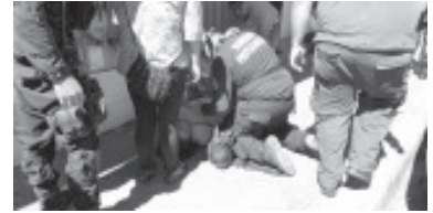
Una señora de 45 años de edad, presentaba crisis nerviosa, estaba tirada sobre el piso, momentos antes tres mujeres le habían robado 45 mil pesos en efectivo.

Sobre el asalto perpetrado por tres mujeres, no se ofrecieron detalles, solo que tras despojarla de los 45 mil pesos, huyeron, sobre calles muy concurridas