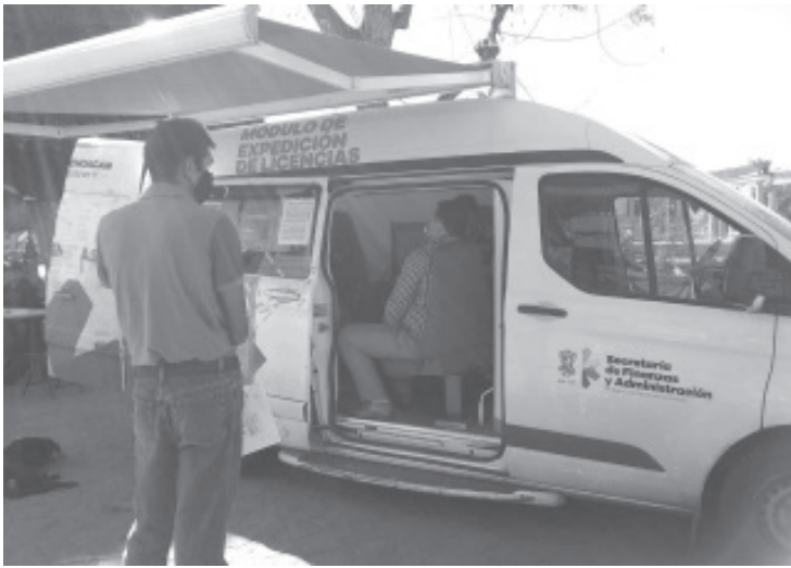
El beneficio que tienen quienes hacen el trámite en este espacio, es la condonación de multas y recargos en el caso de las licencias vencidas.

- El beneficio: condonación de multas y recargos para las licencias vencidas