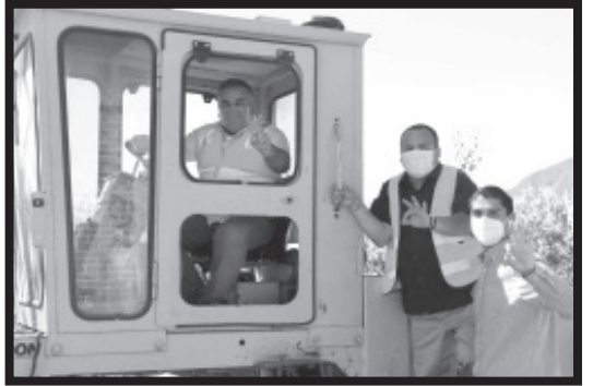
La obra tendrá una gran beneficio para toda la comunidad, ya que es un tramo carretero que permite a los productores transportar sus cosechas y llevarlas a distintos puntos del municipio.