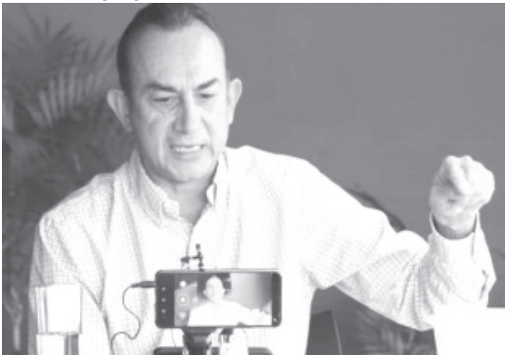
Esos 33 mil millones de pesos serán concentrados por la Tesorería de la Federación, para que sean utilizados a criterio del Ejecutivo, bajo el pretexto de la atención a la salud.

Presupuesto de Egresos de la Federación para el 2021, en donde la mayoría de Morena y sus aliados, optarán por la línea presidencial en lugar de la viabilidad financiera nacional.