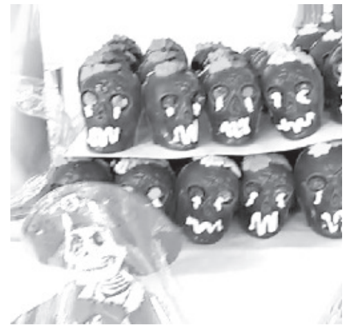
Desde este sábado en el Jardín Constitución ya se instalaron comerciantes de calaveritas de chocolate y todo tipo de productos para la celebración de Día de Muertos.

En estos puestos se venden calaveras de chocolate de todos los tamaños de alfeñique, amaranto, azúcar, paletas, adornos, y hasta tazas alusivas a la celebración de Día de Muertos