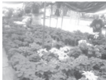
Durante el año pasado la producción fue de 8.7 millones de plantas y este 2020 apenas si se lograrán 8 millones, la pandemia afectará el mercado.

“Nosotros como productores quisiéramos mantener los precios del año pasado, pero estaríamos castigándolos mucho, y no es posible, menos ahora por la crisis actual que a todos nos ha pegado”, dijo.