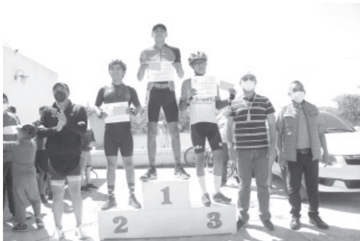
El diputado atendió una invitación a la carrera ciclista en Zitácuaro, que en su edición número 20 que contó con alrededor de 150 competidores de Ciudad Hidalgo, Tuxpan, Maravatío, Zitácuaro y Morelia.

Expuso que la labor primordial e imprescindible de un diputado, además de legislar, es estar de manera presente y constante, apoyando a los ciudadanos y contribuir a que mejoren sus condiciones de vida.