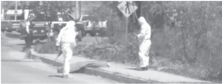
El ahora occiso sufrió al menos 10 lesiones de proyectil de arma de fuego en distintas partes de su humanidad.

Voces policiales dijeron a esta redacción que el finado está en calidad de desconocido. Al concluir las diligencias de ley los expertos de la Fiscalía hicieron el levantamiento del cadáver para trasladarlo a las instalaciones del Servicio Médico Forense, donde le serían practicados pos estudios respectivos y se espera que hasta ahí acudan sus deudos para reclamarlo.