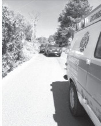
El hombre presentaba heridas de bala, conductor de una combi de la ruta Ziráhuato, que al ser examinado por los socorristas, ya no presentaba signos vitales.

Pero después reportan en el mismo lugar a una persona de 16 años de edad, con crisis nerviosa, por lo que retornan y le brindan las atenciones que ameritaba, no requiere traslado a ningún nosocomio y se queda en el lugar.