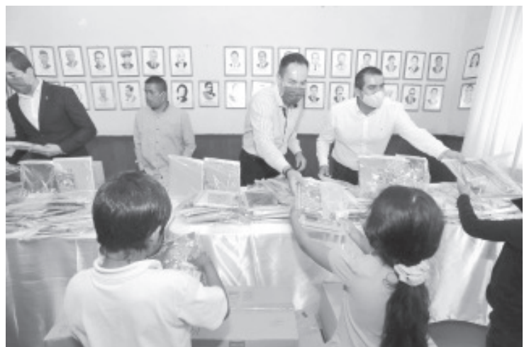
El encargado de la política interna destacó que para la niñez michoacana no habrá limitantes para que continúen con su formación académica.

El encargado de la política interna recaló que los contagios de COVID-19 siguen muy activos, por lo cual llamó a la sociedad a no bajar la guardia y seguir todas las recomendaciones sanitarias: lavado constante de manos, uso de gel anti bacterial, no tocar manos, boca o nariz y mantener la sana distancia.