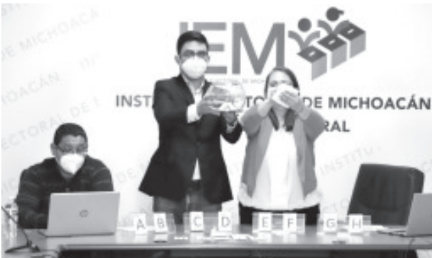
la Junta Estatal Ejecutiva del IEM en compañía de los representantes de los Partidos Políticos, desahogaron el sorteo donde incluyeron 9 números, mismo número de partidos.

Las Consejeras y Consejeros que integran el Consejo General del Instituto Electoral de Michoacán atestiguaron y dieron seguimiento al desarrollo del sorteo antes mencionado.