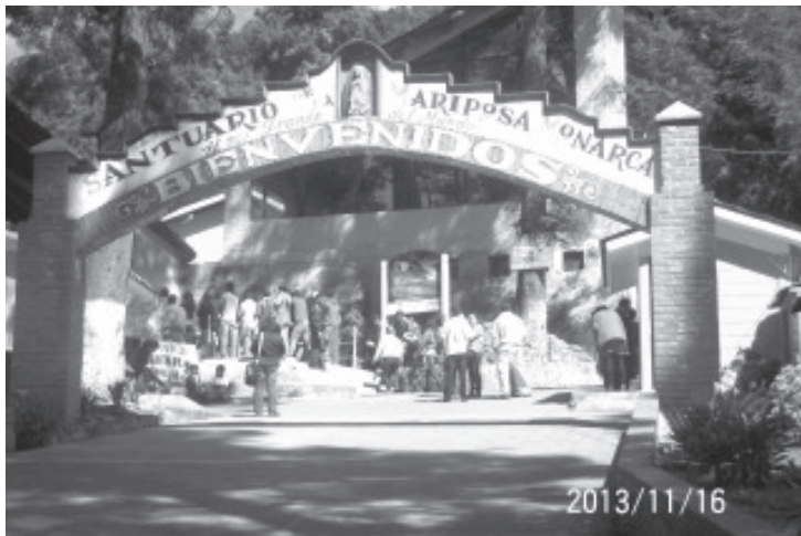
Precisó que cada 15 días se reúnen los 85 ejidatarios que están involucrados en el manejo del Santuario, y todos participarán en los cursos de capacitación.

Agregó que este año el boleto para ingresar al santuario se mantiene en la misma cantidad del año pasado 50 pesos adultos y 40 para los niños, en el caso de la renta de caballos será de 100 pesos.