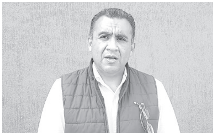
Jefes de Tenencia deberán implementar medidas sanitarias para evitar aglomeraciones y haya menos contagios.

como transcurra esta celebración y de ser necesario intervendrán según se requiera, la idea es garantizar el buen desarrollo de la celebración del Día de Muertos.