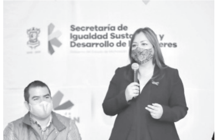
Primero, durante el aislamiento y ahora en la Nueva Convivencia, la violencia doméstica ha registrado un considerable incremento, siendo los hombres los principales agresores.

En Zitácuaro también se pusieron en marcha los talleres de Madres Solteras y de Duelo, dirigidos al empoderamiento de las mujeres.