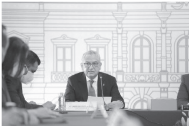
En cinco años se ha logrado un ahorro de 980 mdp en el pago del servicio de la deuda pública y para los próximos 10 años, se tiene proyectado un ahorro de 3 mil 600 mdp más.

“Con diversas acciones, el Gobierno del Estado que encabeza Silvano Aureoles Conejo, Michoacán hoy es diferente, con mejores condiciones para todas y todos, con una administración transparente y finanzas públicas sanas que abonan a la legalidad, certeza y crecimiento de nuestro estado”, finalizó el secretario de Finanzas.