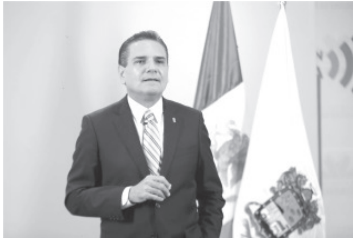
“Les puedo asegurar, que no hay un sólo municipio en el estado de Michoacán, que no haya sido beneficiado con una obra importante del Gobierno del Estado; logramos hacer dos obras por día”.

El gobernador también destacó la dignificación de 900 casas de salud, la creación de los convoyes de la salud y el trabajo coordinado con las auxiliares de salud,