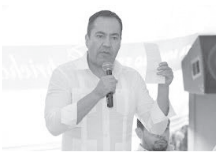
Espacio Emprendedor aglutina diversos programas y servicios, tanto públicos y privados, con lo cual se inserta al emprendedor en una red empresarial.

Sólo el 15 o 20% de los niños deben tener problemas con la entrega de libros, pero no por completo, ya que por grado solo faltan de 2 a 3 títulos.