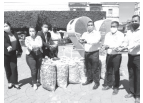
Autoridades municipales entregaron de 60 costales de tapitas de plástico, para el programa RECICANJE, que otorga apoyos a niños enfermos de cáncer.