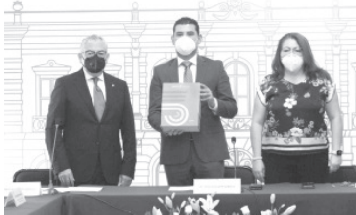
Octavio Ocampo, manifestó que con esta entrega, el Poder Ejecutivo cumple con lo que mandata la constitución local en su artículo 60, fracción décima.

“Michoacán es una entidad con grandes pendientes, no podemos dejar de reconocer el esfuerzo que ha hecho el Gobernador del Estado a lo largo de estos cinco años al frente de esta administración, por ello no debemos dejarnos vencer ante las adversidades, somos un Estado emblemático, que está obligado a ser protagonista en los procesos de transformación de esta nación, por ello convoco a cerrar filas en favor de Michoacán,