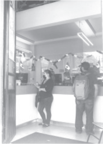
Los descuentos de multas y recargos incluyen: predial, el refrendo del panteón, licencias, así como la expedición de permisos y otros tramites que tienen un costo.