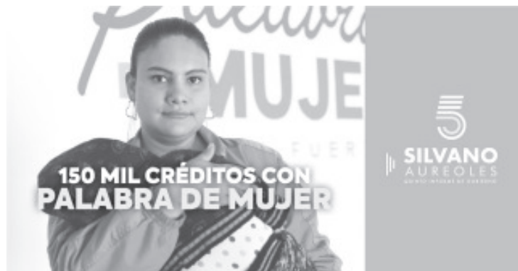
En estos cinco años de la administración del Gobernador, Silvano Aureoles Conejo, el programa Palabra de Mujer acercó créditos a 150 mil michoacanas emprendedoras.

“En Michoacán durante estos cinco años hemos aprendido a avanzar y a brindar acompañamiento a las mujeres”, finalizó.