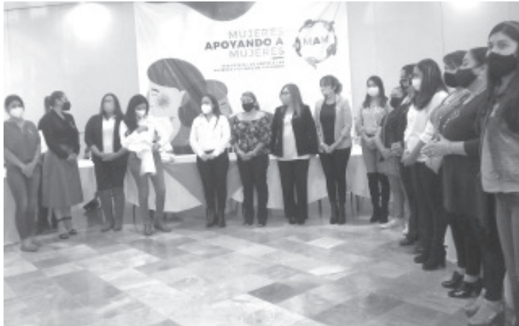
A partir de hoy, el MAM estará integrado por mujeres de 16 municipios de esta parte de Michoacán.

- Lo integran mujeres de 16 municipios del oriente del estado