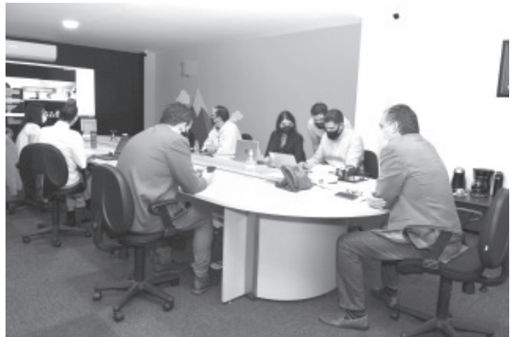
El centro regional Zitácuaro estará a disposición de las más de 24 mil unidades económicas que operan en los 16 municipios que serán atendidos en ese espacio.

En el encuentro se revisaron los requerimientos para la obra, el equipamiento del espacio físico y la próxima puesta en marcha.