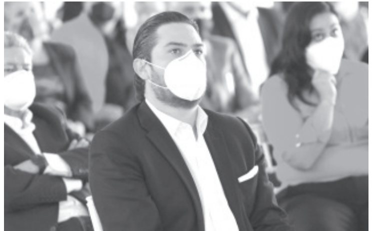
El legislador celebró la rápida actuación de las autoridades en la posible solución de uno de los casos que tanto han dañado a la sociedad michoacana.