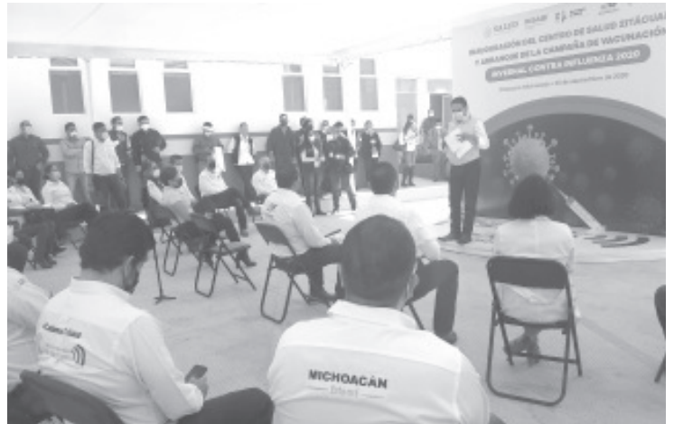
En toda la entidad se han rehabilitado Centros de Salud, se ha mejorado el abasto de medicamento y todo el sector salud se ha ido transformando.

Cómo parte final del evento, el Gobernador del Estado y otros funcionarios develaron la placa alusiva y posteriormente realizaron un recorrido por las nuevas instalaciones.