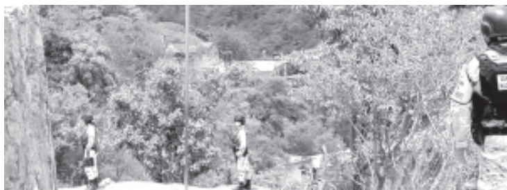
La situación generó un intenso despliegue policiaco en la zona, se sumó la Guardia Nacional y el Ejército para buscar a los delincuentes.

Contactos gubernamentales mencionaron a esta redacción que el lesionado fue canalizado a un nosocomio en un helicóptero.