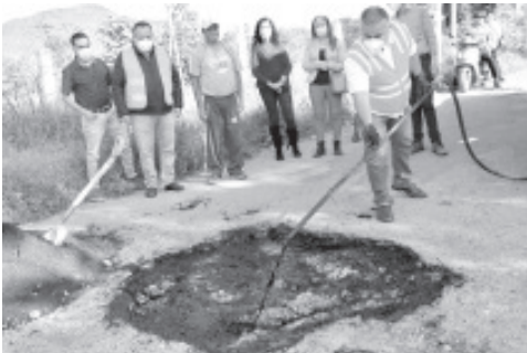
Dignificar el camino a Cofradía de Guadalupe y San José respectivamente, representa un beneficio importante para los tuxpenses que a diario transitan por esta vialidad.

Finalmente los vecinos del lugar agradecieron el apoyo y las atenciones recibidas por el alcalde y su equipo de trabajo, para que se pueda rehabilitar esta importante vialidad en beneficio de todas las familias de la zona.