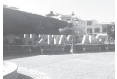
Por comentarios de funcionarios del Ayuntamiento, se sabe que el mantenimiento a estas letras es caro y por este motivo no se ha realizado la reparación.

H. Zitácuaro Michoacán, 30 de septiembre de 2020.- Por: Guadalupe Solache Rebollo. Muchos de los que vivimos en Zitácuaro y también quienes nos visitan se han tomado una foto en las letras turísticas "H ZITACUARO" que se encuentran en una de las jardineras del jardín central.