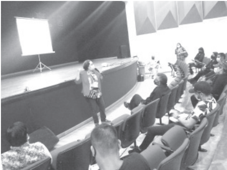
Con esta capacitación, los instructores y entrenadores contarán con las herramientas necesarias para reducir al máximo cualquier riesgo de contagio.