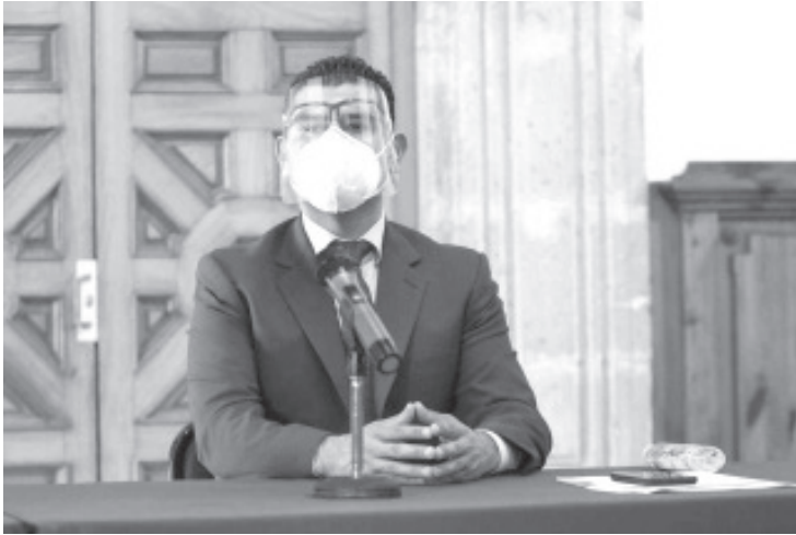
Este es un gran reto y lo asumiré con toda responsabilidad, debemos privilegiar el bienestar del Poder Legislativo, y no deben anteponerse intereses particulares o personales.

intereses particulares o personales, por ello estoy comprometido con mis compañeros diputados y seguro estoy que lograremos los consensos y los acuerdos suficientes para generar un gran trabajo en favor de Michoacán y su gente”, finalizó.