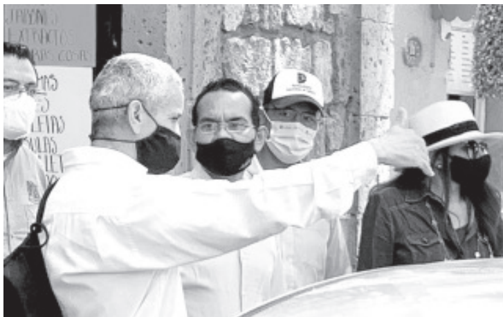
En los trabajos participa el laboratorio de materiales del ITESM, los ingenieros residentes del Ayuntamiento de Morelia y personal de las propias compañías constructoras de las obras en revisión.

obra pública; La jornada comenzó en la vialidad denominada “Cantera”, en el tramo comprendido entre la Av. Madero y Michoacán para, posteriormente, desplazarse a la calle Manuel Muñiz, en el tramo comprendido entre Juárez y Mina.