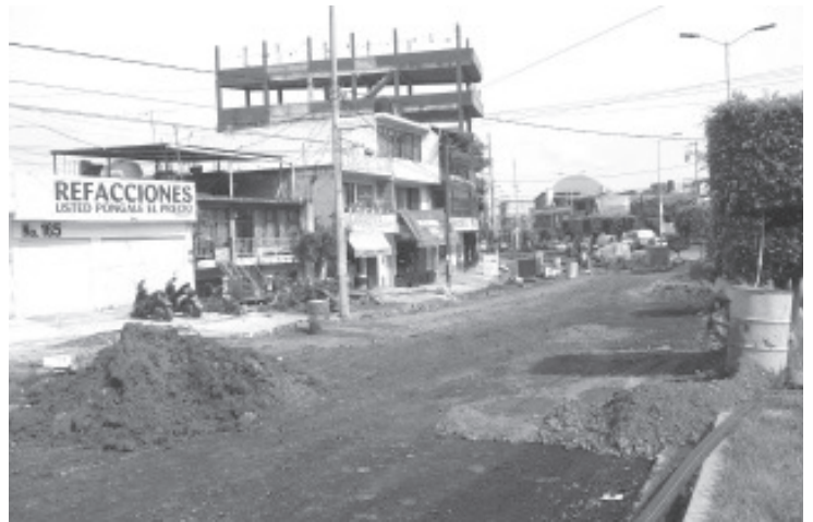
No existe apoyo económico para quienes se vean afectados en sus ventas, aseguró que el Gobierno Municipal no los dejará solos, y buscará la forma de ayudarlos.