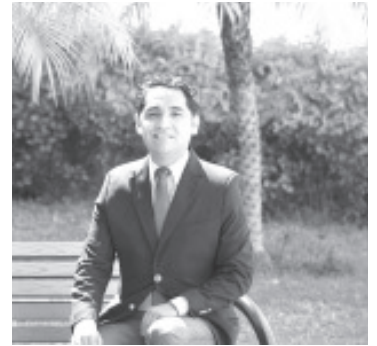
El programa contempla talleres de oratoria, presentación de libros, así como ponencias que se estarán desarrollando del 15 de septiembre al 04 de octubre.