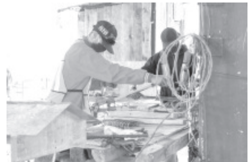
En el mes de agosto, el número de asegurados en Michoacán creció 3 mil 526 trabajadores, equivalente a casi 1 por ciento, respecto a julio del año en curso.

El Gobierno de Michoacán, a través de la Sedeco reconoce y apoya los esfuerzos que cada día realizan las micro, pequeñas, medianas y grandes empresas para conservar las fuentes de empleo. Tan solo las Mipymes son responsables de generar más del 90 por ciento del total de las plazas laborales en la entidad.