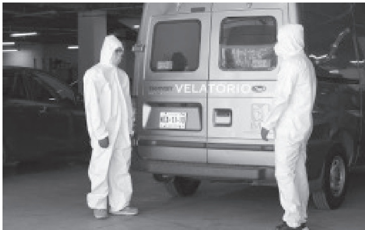
El personal de salud que atienda y entregue el cadáver de la unidad hospitalaria deberá informar y capacitar previamente al personal que intervenga en el transporte.

Para conocer el documento completo, los interesados pueden acceder a https://bit.ly/3bWv4LL para consultar los pormenores del acuerdo, mismo que prevé sanciones aplicables a quien no acate las disposiciones.