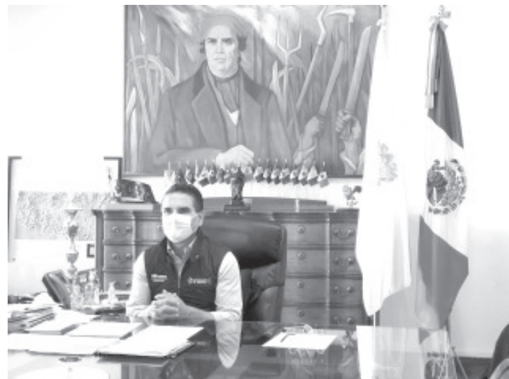
El mandatario envió un mensaje a las y los michoacanos para reiterarles que el virus del COVID-19 sigue latente, y es necesario que las personas se protejan con toda responsabilidad.

-Comparte su experiencia y hace un llamado a no asistir a lugares donde haya concentraciones de gente -Es necesario adoptar el uso del cubrebocas como una medida de seguridad personal y responsabilidad social, señala