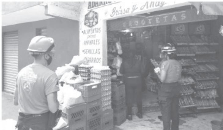
Personal de Protección Civil Estatal ha visitado 13 colonias, entre ellas el Infonavit, La Joya, entre otras, donde dan explicaciones sobre medidas preventivas y regalan cubrebocas.

Lamentó que a pesar de la gravedad de casos que se han registrado hasta ahora, en la calle hay mucha afluencia de personas y también de vehículos, muchos de ellos salen sin tener que realizar una actividad esencial que amerite dejar su casa.