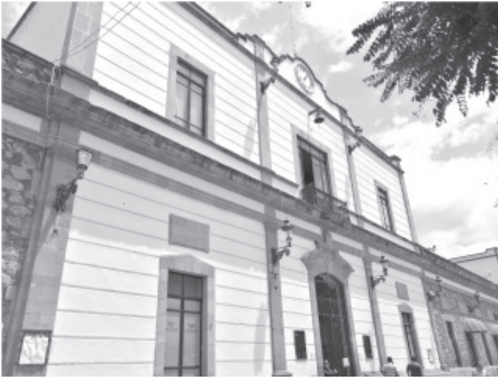
Esquinas y calles del centro de la ciudad se encuentran vacías, no hay ningún adorno alusivo a esta fecha que motive el espíritu patrio entre los ciudadanos.

Por Covid-19 este año la celebración solo será simbólica