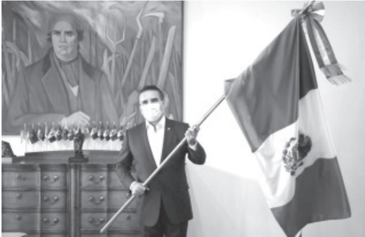
El titular del Poder Ejecutivo llamó a conmemorar las fiestas patrias haciendo conciencia de la epidemia que hoy nos toca vivir.

-Debemos sentirnos orgullosos del pueblo que somos y de los héroes que usan bata, destacó -Emite Gobernador mensaje por plataformas digitales en el marco del 210 aniversario de la noche del Grito de Independencia de México .-Reitera el llamado a celebrar desde la intimidad de nuestras familias, cumpliendo con el distanciamiento social