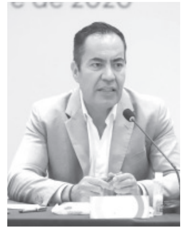
Carlos Herrera invitó a las y los michoacanos para celebrar la importante fiesta patria siguiendo todas las recomendaciones sanitarias para prevenir contagios de COVID-19.

“Solamente la corresponsabilidad ciudadana nos ayudará a frenar los brotes de contagios, si te cuidas tú, no cuidas a todos, quédate en casa, festeja desde casa”, afirmó.