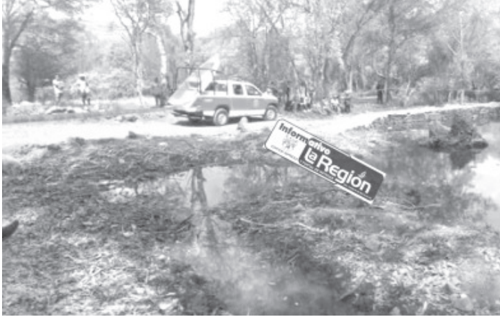
Dos hombres murieron ahogados en una presa ubicada en el municipio de Senguio, autoridades reportaron el hecho y solicitaron ayuda para encontrar los cuerpos.

+ Bomberos de Protección Civil Zitácuaro participaron en el rescate de los cadáveres.