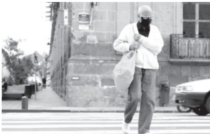
Adultos mayores, personas con hipertensión, diabetes u obesidad, son estos 4 factores los presentes en la mayoría de las mil 393 defunciones registradas en la entidad.

Lo anterior, debido a que se han registrado casos de pacientes que acuden a la unidad de salud ya en condiciones muy críticas y con pocas posibilidades de recuperarse al no haber recibido desde un inicio la atención adecuada de manera privada.