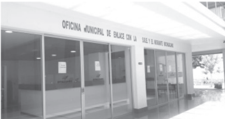
El próximo 9 de noviembre es la cita en el Consulado, de ahí se decidirá la fecha de salida de las Palomas Mensajeras a visitar a sus familiares.

Añadió que aunque estos días cierra por completo la oficina, los beneficiarios del programa de Palomas Mensajeras deben estar tranquilos, no los afectará y el depósito ya fue realizado a tiempo.