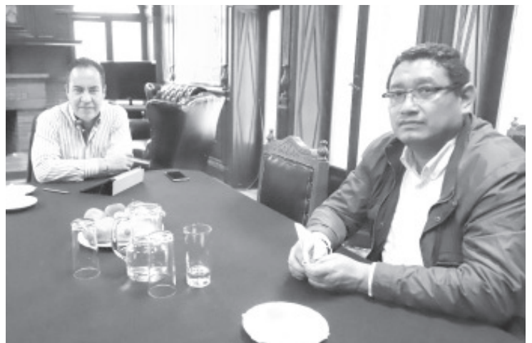
La coordinación con los distintos poderes y organismos es fundamental para que podamos tener un proceso electoral en el que las y los ciudadanos sean los beneficiados.

»Desde ahora tenemos una comunicación permanente con las distintas fuerzas políticas, con los órganos y seguiremos teniendo acercamientos para cada quien, desde nuestro espacio, hacer lo que nos corresponde», expuso.