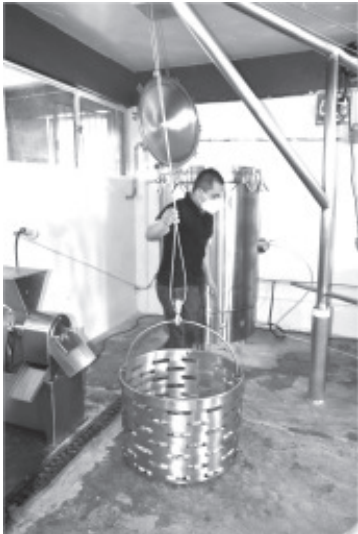
En el CBTA no. 240, se entregó equipo especializado para el Taller de Agroindustria, que garantiza a las y los jóvenes realizar sus prácticas y le da un valor agregado ya que se dedican a la elaboración de ates, frutilla, y dulces de guayaba.

En la actual administración se han atendido más de 3 mil 500 escuelas con acciones de construcción, rehabilitación y/o equipamiento