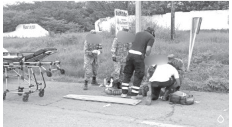
Una madre y sus dos hijos de 3 y 6 años resultaron lesionados, cuando su moto se impactó con un vehículo del transporte público.

Las unidades implicadas en el incidente fueron aseguradas por las autoridades, en tanto se desahogan las diligencias para determinar las responsabilidades correspondientes.