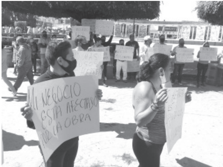
Presentan varias demandas, entre ellas que se pare o se posponga la obra, de lo contrario que se presente un plan económico integral para el comercio de la avenida.

H. Zitácuaro Michoacán, 07 de septiembre de 2020.- Por: Guadalupe Solache Rebollo. Vecinos y comerciantes de Avenida Revolución Sur llevaron a cabo este lunes una marcha contra la obra de modernización de esta vía.