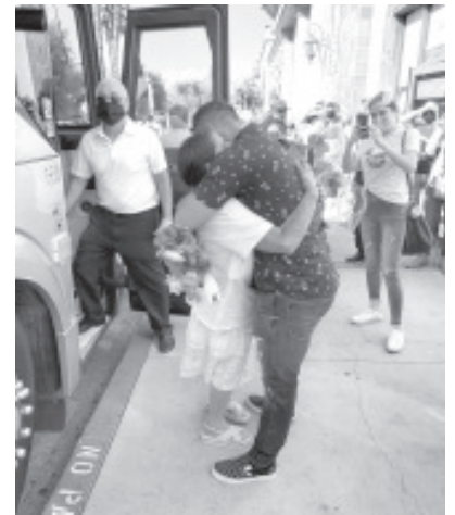
47 integrantes del programa del Gobierno de Silvano Aureoles, Palomas Mensajeras, volaron a Estados Unidos, para reencontrarse con seres queridos que no habían visto en décadas.

En esta Nueva Convivencia, el Gobierno de Michoacán, como estado binacional, sigue generando acciones que permitan a los migrantes y sus familias una buena calidad de vida, impulsado la reunificación familiar como el pilar fundamental del tejido social. Pie y foto se reencuentran: 47 integrantes del programa del Gobierno de Silvano Aureoles, Palomas Mensajeras, volaron a Estados Unidos, para reencontrarse con seres queridos que no habían visto en décadas.