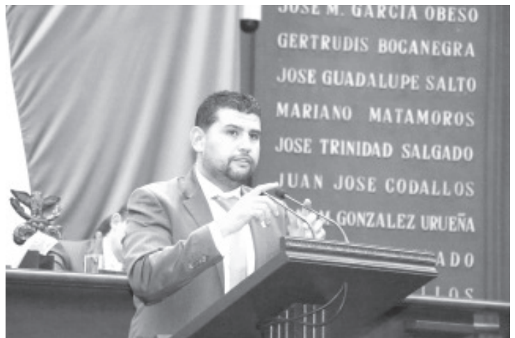
En México se debe dejar de manosear el tema del combate a la corrupción con motivos político-electorales, y aplicar medidas eficaces, con apego a la legalidad.

Destacó que el costo de la corrupción es demasiado alto para la vida pública de cualquier Estado, en tanto que la falta de ética en el sector público no es una cuestión de palabras, sino que se manifiesta mediante actos concretos con repercusiones evidentes en la que políticos y funcionarios utilizan su autoridad y sus atribuciones para beneficio propio, solos o en complicidad con grupos, desviando los recursos públicos y afectando a una parte de la sociedad al generar desigualdad.