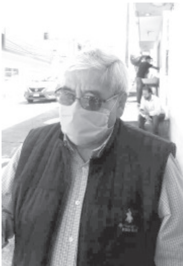
Esta obra es muy importante, ya que además de modernizar esta Avenida, también tiene contemplado cambiar toda la tubería por una nueva, la actual es de asbesto y ya es obsoleta.

- Aprovecharán para cambiar tubería obsoleta y reducir fugas.