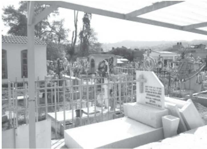
El administrador evidenció que cuando se realiza algún sepelio quiere entrar mucha gente cuando lo permitido es de 15 a 20 personas.

-Continúan medidas sanitarias en el Panteón Municipal San Carlos, pese a molestias de la gente