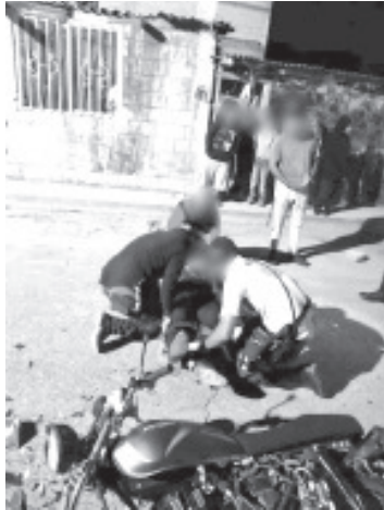
El afectado tiene 20 años de edad, padeció varios golpes, traumatismo craneoencefálico, fractura de nariz y también en la pierna izquierda.

Unos patrulleros de Tránsito realizaron una búsqueda y lograron encontrar el referido automotor, mismo que estaba abandonado, entonces fue asegurado y llevado a un corralón.