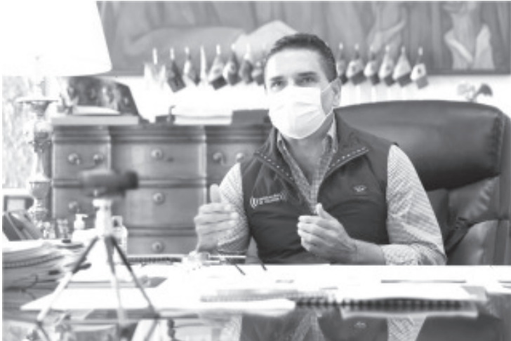
Nuestro compromiso es salvar la mayor cantidad de vidas posibles; fuimos de las primeras entidades en cancelar todas las actividades no esenciales.

Sostiene Silvano Aureoles Conejo reunión con integrantes del Colectivo Michoacán Humanitario