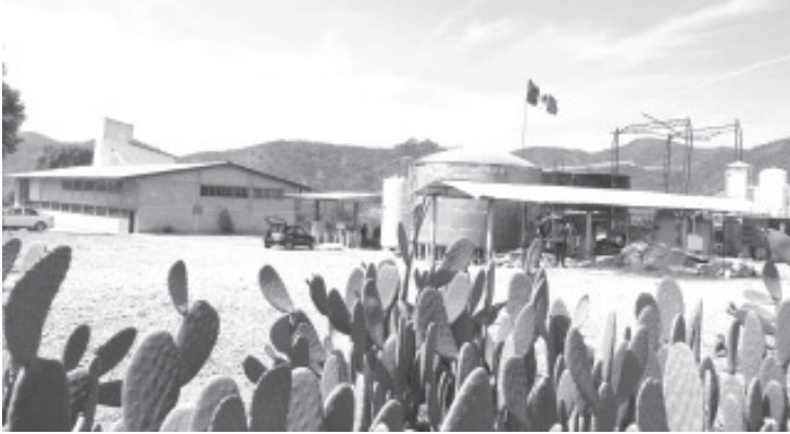
Han descubierto que se puede generar biogás con cualquier biomasa, con cualquier líquido que tenga cierto porcentaje de biomasa.

-Se utilizarían 400 toneladas que genera la Central de Abasto de la CDMX -En Uruapan se construyó una réplica que usa hueso de aguacate, también produce biocombustible.