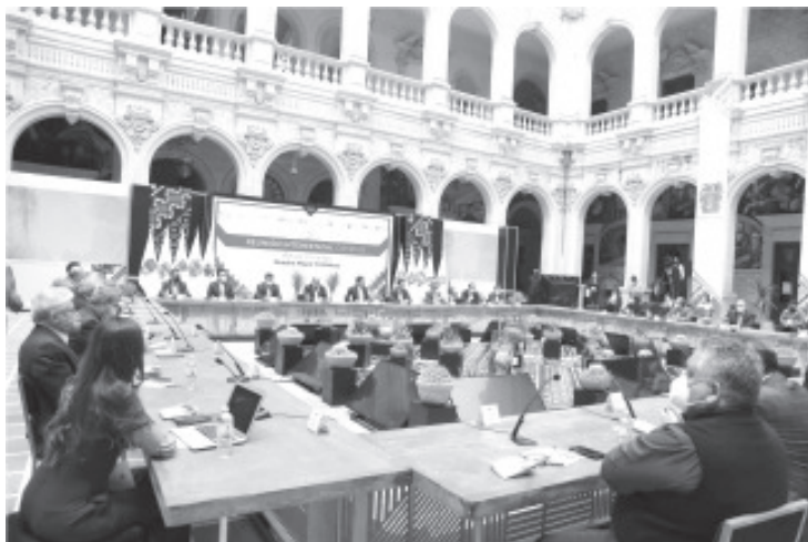
El acuerdo fue tomado en el marco de la Reunión Interestatal de los 10 mandatarios que conforman la Alianza Federalista.

• La Conago dejó de ser un espacio de construcción de alternativas y de equilibrios, acciones que demanda México hoy más que nunca, destaca • El acuerdo fue tomado en el marco de la Reunión Interestatal de los 10 mandatarios que conforman la Alianza Federalista