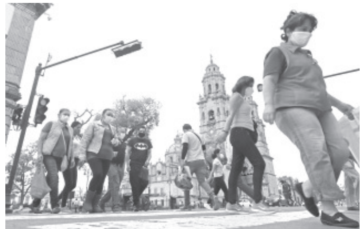
La SSM, exhorta a los padres y madres de familia a no bajar la guardia en los cuidados básicos de higiene y mantener siempre el uso de cubrebocas en sus hijos.

Finalmente dijo que en caso de que el menor presente irritabilidad, dolor de cabeza, fiebre y tos es importante acudir de inmediatamente al médico al niño para que reciba atención adecuada.