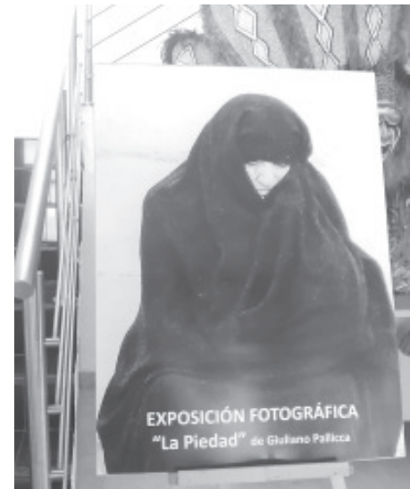
Se trata de la tercera exposición que el artista desarrolla en Zitácuaro e incluye más de 100 obras con tomas de prácticamente todo el mundo.