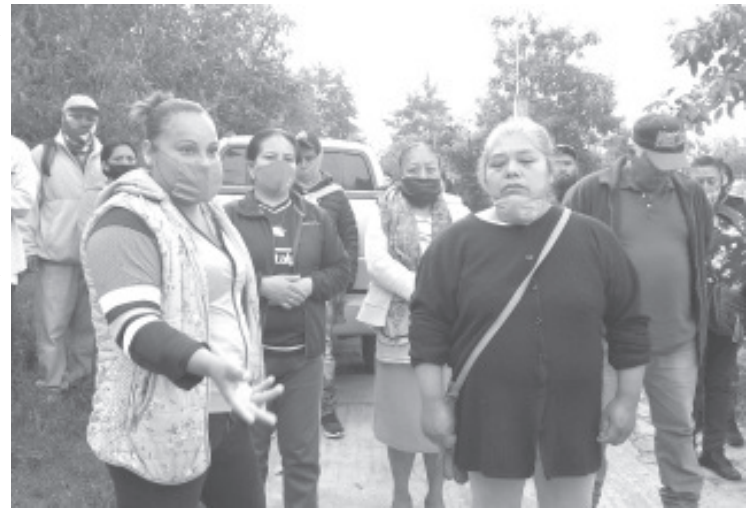
El grupo autollamado «Pueblo Unido», tiene cerradas todas las entradas a El Aguacate, piden dinero a quienes quieren ingresar y pretenden limitar derecho de los habitantes a utilizar el panteón.

Destacaron que estas personas están poniendo en riesgo la paz del pueblo y por el hartazgo de la gente puede haber un enfrentamiento.