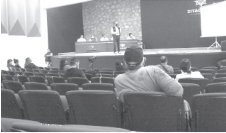
La obra contempla dos carriles de circulación y uno para estacionamiento, ampliación de banquetas, ciclovía, andador peatonal. Iluminación y alumbrado público.

-Acusan de imponer decisiones sin tomarlos en cuenta -Obra contempla 5 etapas con 2 meses de duración cada una