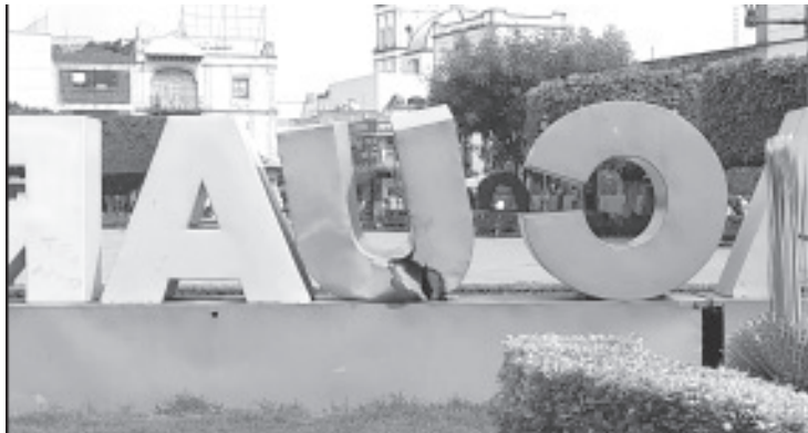
Las letras turísticas con la leyenda «H.Zitácuaro», del jardín central se encuentran completamente descuidadas, la pintura se encuentra en mal estado, otras están rotas y a punto de venirse abajo.

Aunado a la falta de mantenimiento, a las inclemencias del tiempo que ha afectado a las letras, se suma la falta de conciencia de los ciudadanos pues en meses atrás en este lugar se podía ver a niños y hasta adultos sobre ellas.