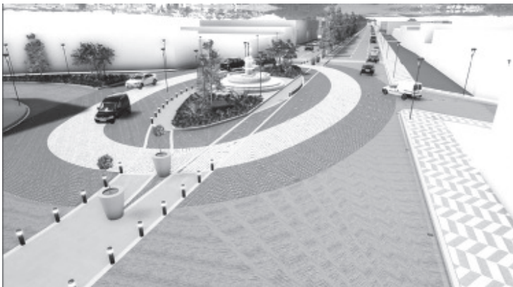
La obra comprende desde la calle Leandro Valle hasta la altura de la agencia Nissan, incluye alumbrado público, carriles, colectores pluviales, alcantarillado, drenajes, ciclovía y andadores.