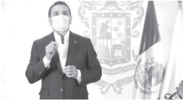
El gobernador explicó que Michoacán atraviesa por uno de los puntos más críticos de la epidemia, por lo que un regreso a clases presencial representa un grave peligro para la salud y la vida de la población.

Morelia, Michoacán, a 24 de agosto de 2020.- Ante la falta de condiciones para el regreso a clases presenciales, el Gobernador del Estado, Silvano Aureoles Conejo, hizo un llamado a las y los michoacanos a adaptarse a nuevas formas de estudio para evitar rezagos en el aprendizaje del alumnado.