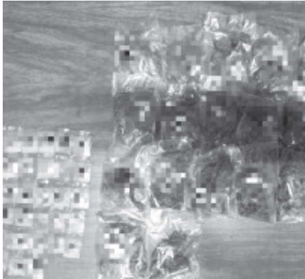
Agentes de la Policía Michoacán aseguraron a dos menores de 16 años que circulaban en un auto Vento, luego de localizar entre sus pertenencias 45 envoltorios con droga.

Durante labores de vigilancia para la disuasión del delito en la avenida Francisco I. Madero de la colonia La Floresta, agentes de la Policía Michoacán aseguraron a los menores de 16 años que circulaban a bordo de un vehículo de la marca Vento, luego de