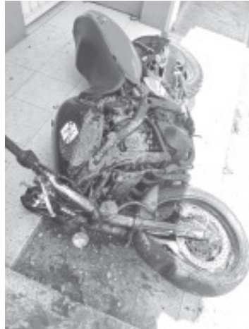
Testigos dijeron que el motociclista intentaba hacer una maniobra, pero perdió el control y se impactó con dos vehículos estacionados.

Al sitio acudieron elementos de la Policía Michoacán, quienes lo acordonaron para preservar los posibles indicios y posteriormente elementos de la Unidad de Servicios Periciales y Escena del Crimen (USPEC) se encargaron del peritaje correspondiente y el traslado de los cuerpos al Servicio Médico Forense (Semefo) para la cirugía post mortem.