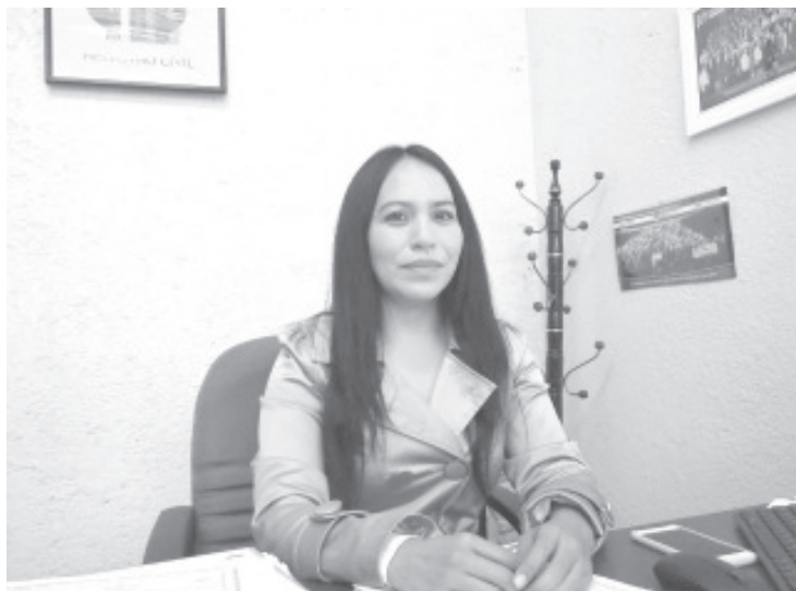
La oficina otorga únicamente dos servicios: los registros de nacimiento y certificados de defunción, ambos solo previa cita, los demás en línea.

También realizan impresiones de actas de matrimonio y de defunciones, pero esto debido a que esta información no se encuentra en la página del Gobierno del Estado, la indicación que tienen es de apoyar a los usuarios del Registro Civil.