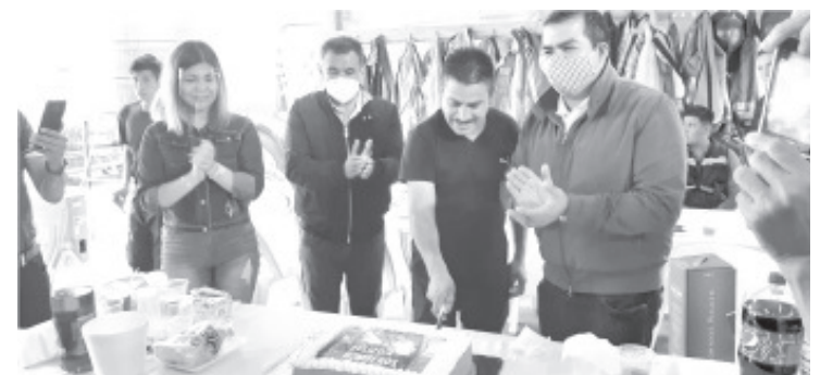
Dijo el alcalde, su trabajo es heroico porque anteponen su propia vida por salvar la de otras personas; aunado al apoyo en general que brindan a la población ante cualquier contingencia.

El edil refrendó su respaldo para ellos, en el sentido de brindarles los recursos en la medida de lo posible, para que continúen protegiendo y salvando a los zitacuarenses que se encuentren ante una situación de riesgo. Posterior a su discurso, degustó con los bomberos y el personal de esta subdirección.