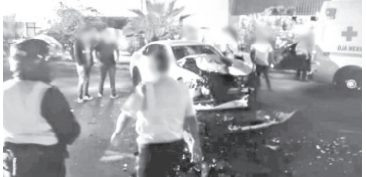
Los automotores implicados son: un Volkswagen Polo, color blanco, con placa PFH056D; un BMW 520i, color blanco, con lámina PGE853C; y una combi de la Ruta Naranja, sin matrícula y otro que se fue.

+ Una combi de la Ruta Naranja estuvo implicada. + Huyó uno de los 4 carros que participaron en el hecho.