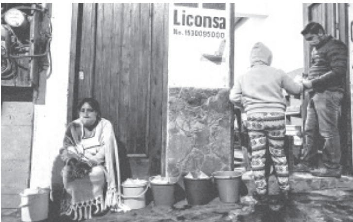
Liconsa dejó fuera del reparto de leche subsidiada a más de 478 mil mexicanos en situación de pobreza, incrementó 150% el precio del litro a los más pobres y eliminó de su lista prioritaria de abasto a 67 de los municipios con mayor marginación.

Los directivos de Liconsa habían fijado como meta suministrar en 2019 leche a precio subsidiado a 3 millones 829 mil mujeres pero sólo se atendió a 3 millones 466 mil, con lo que se dejó fuera a 363 mil, según cifras de la auditoría interna efectuada a la Dirección de Operaciones de Liconsa, de la que Mexicanos Contra la Corrupción y la Impunidad (MCCI) tiene copia.