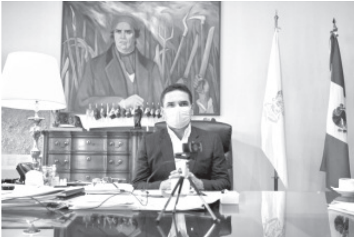
Ante dicho escenario, el mandatario estatal determinó que en la capital michoacana y Uruapan serán instalados los Comités de Seguridad Jurisdiccional.

Determinan la instalación de Comités de Seguridad Jurisdiccional en ambos municipios