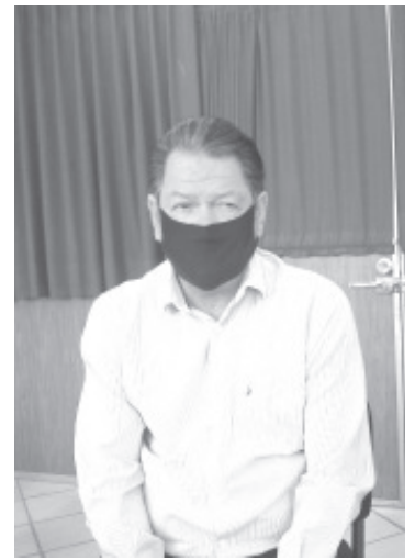
En el caso del oriente en el nivel básico iniciaron alrededor de 160 mil alumnos en más de 2 mil instituciones educativas, con clases por televisión y videollamadas.

En cuanto a comunidades alejadas dónde el nivel de marginación es alto y es complicado que llegue la tecnología para