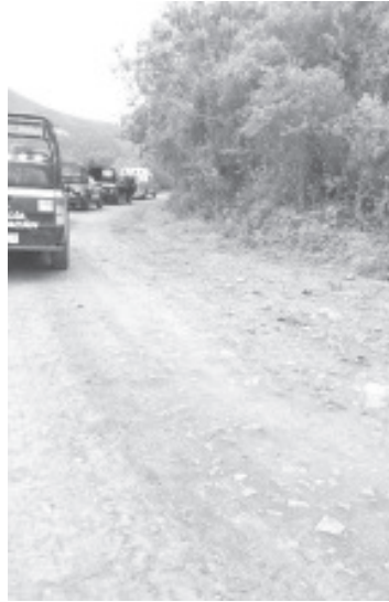
El cadáver yacía en un camino que conduce a la comunidad de La Cortina. Lugareños avisaron al número de emergencias 911, después llegaron elementos de Policía Michoacán.

Agentes de la Fiscalía Regional comenzaron las averiguaciones correspondientes en coordinación con peritos criminalistas, posteriormente el interfecto fue trasladado a la morgue para la práctica de la necropsia de rigor.