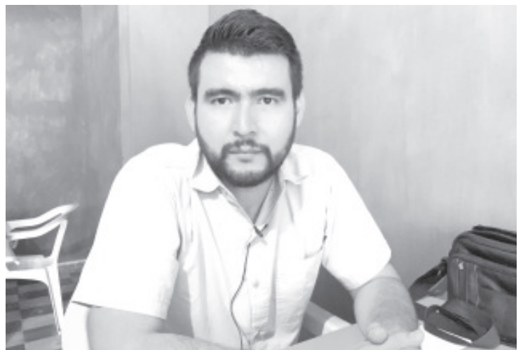
Comerciantes y vecinos de avenida Revolución sur se amparan contra la obra de remodelación anunciada

La siguiente reunión se llevará a cabo este fin de semana y se espera que sean más los comerciantes que se sumen a este movimiento, ahora participan unos cincuenta, pero a través de perifoneo están convocando a todos los que están ubicados en el tramo de la calle Leandro Valle hasta la agencia Nissan, que pueden ser varios cientos, no pretenden crear conflictos, sino buscar la mejor opción para los locatarios de esta avenida, que deben cubrir gastos de renta, impuestos, pago de empleados y otros compromisos monetarios que con esta crisis por la pandemia se han agudizado y que con los inconvenientes de los trabajos, agravarían su situación.