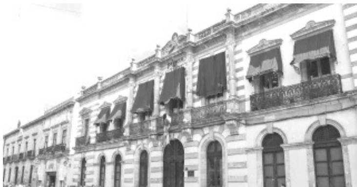
Por acuerdo de la Junta de Coordinación Política (JUCOPO), se suspenderán de nueva cuenta todas las actividades no esenciales en este Poder Legislativo.

De esta forma se detalló que el personal que asista al Palacio Legislativo, deberá de atender las medidas sanitarias como el uso de cubrebocas y la toma de temperatura durante la entrada, además de que se estará limitando el ingreso al edificio a aquellas personas que no justifiquen su presencia para asistencia o trámite en dichas áreas esenciales.