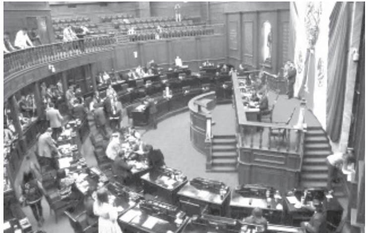
«Foro por una Ley de Trasplantes y Donación de órganos, tejidos y células, así como su fomento y cultura en el estado de Michoacán», organiza el Congreso estatal.

Organizado por la Comisión de Salud y Asistencia Social, la finalidad de este foro es generar información, a través de médicos especialistas expertos en la materia, sobre los elementos indispensables y requisitos actuales de donación; el marco jurídico nacional y estatal, costos, respetos a la voluntad del donador, La cita, será el próximo martes 18 de agosto a las 10 horas y contará con la participación de representantes de la Secretaría de Salud, del Colegio de Médicos del Estado y la Coordinación de Donación de órganos con fines de trasplante del IMSS Michoacán, además de legisladores, médicos y alumnos de la facultad de medicina.