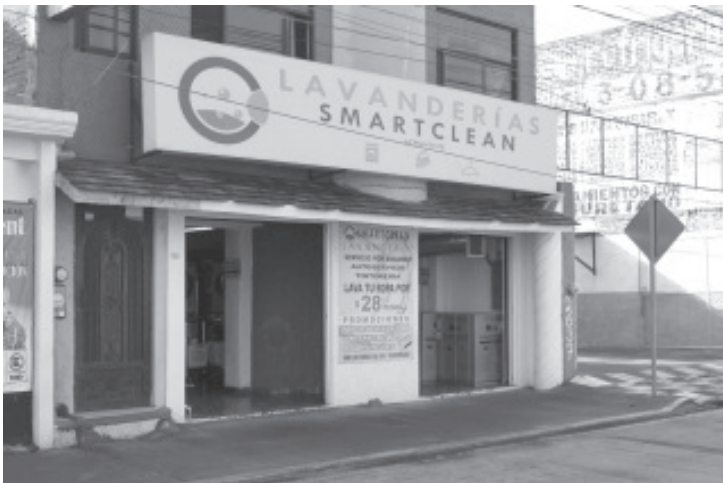
Al siete de agosto, la SFA ha aprobado siete mil 353 solicitudes en beneficio del sector empresarial y sus trabajadores, aterrizadas en tres mil 609 empresas.

Este apoyo implementado por la administración del Gobernador Silvano Aureoles Conejo, que en su primer anuncio sólo contemplaba tres de los cinco meses que finalmente se aplicó, tuvo a julio como último mes en el que se puede hacer válida la devolución de este impuesto.