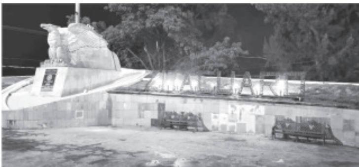
Con apoyo de empresarios de la ciudad, en el monumento a La Bandera fueron colocadas letras con la leyenda: «Heroica Zitácuaro», se podrán iluminar con antorchas.

Cuando sean encendidas tales antorchas, estará personal de la dependencia vigilando que todo transcurra con calma, esto con el fin de prever algún posible incidente.