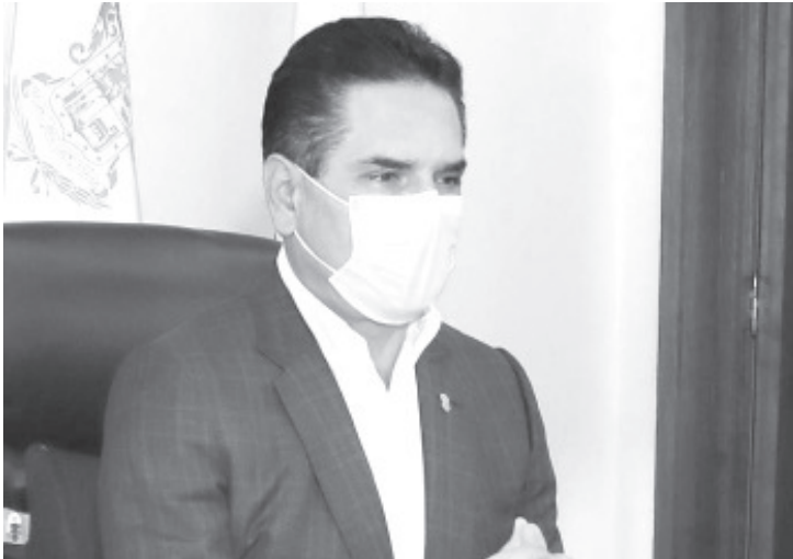
La Secretaría de Educación en el Estado se encuentra lista y con las herramientas necesarias para arrancar el ciclo escolar 2020-2021, el próximo 24 de agosto.