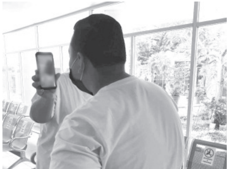
Lo que se busca es favorecer la recuperación de los enfermos y dar tranquilidad a los familiares que, aunque no pueden entrar a verlos y sin importar las condiciones, están al tanto de la salud de sus pacientes.

La SSM pone a disposición de la población el 800-123-2890 con 11 líneas para resolver todas sus dudas médicas operacionales, así como el micrositio bit.ly/MichCOVID-19 donde encontrarán toda la información disponible sobre este padecimiento.