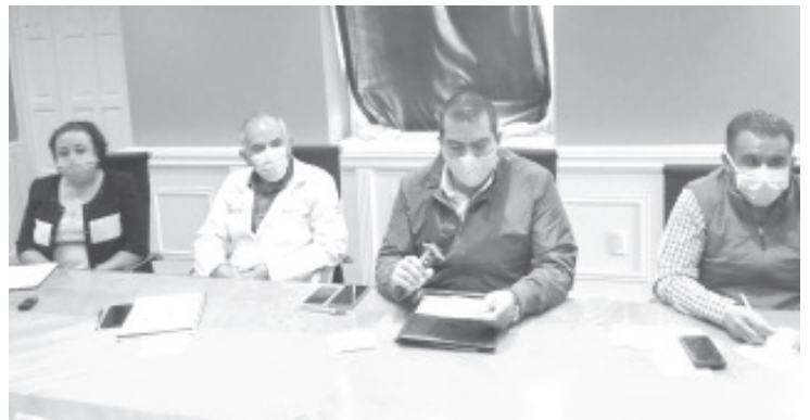
Se suspende el cierre de los miércoles, y se conformó una Comisión de Regidores para el diseño de la obligatoriedad del cubrebocas como refuerzo al decreto que hizo el gobernador del estado.

Invitó a los ciudadanos a tomar en cuenta el numero 01800 4332000 o la página de internet www.ine.mx para agendar su cita e ir a recoger su credencial, de lo contrario no podrá ser atendida.