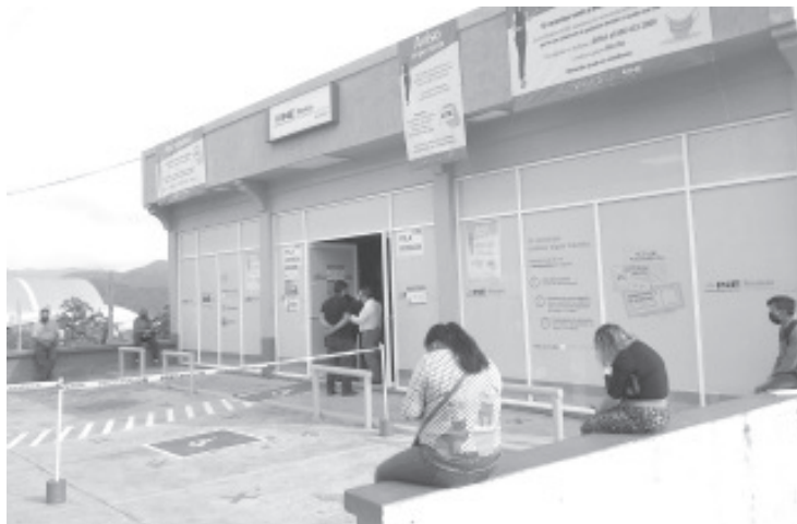
El INE reabrió los módulos de atención ciudadana solo para entregar credenciales que ya fueron tramitadas con anterioridad.