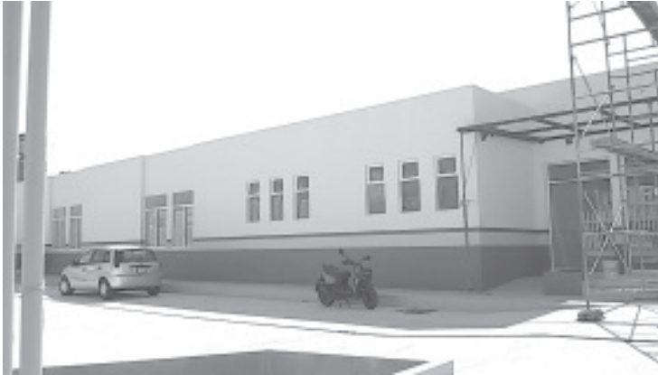
Las nuevas instalaciones del Centro de Salud Urbano, serán un moderno y funcional edificio para responder a las demandas en materia de salud de la población.

H. Zitácuaro Michoacán, 04 de agosto de finales de agosto se espera que sean 2020.- Por: Guadalupe Solache Rebollo. A inauguradas las nuevas instalaciones del