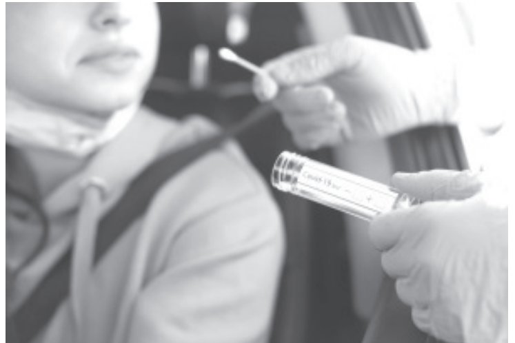
Se alerta a los ciudadanos para que no se dejen engañar, ya que a nivel local no hay ninguna farmacia que esté autorizado para hacer alguna prueba rápida.