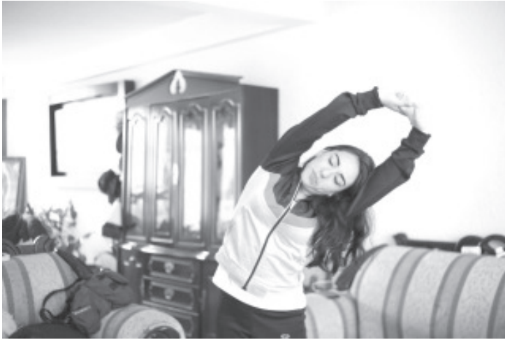
A través de la respiración profunda, suave y consciente se manda un mensaje al cerebro, lo que permite relajar el cuerpo y los niveles de ansiedad y estrés.

Recomienda la SSM realizar actividades lúdicas para frenar los niveles de ansiedad provocados por el COVID-19