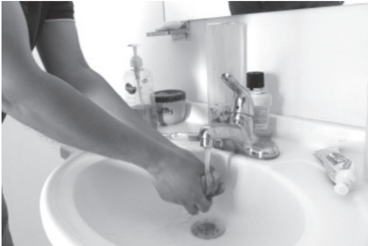
Las cuotas establecidas por los ayuntamientos no tienen como finalidad el cobro por el agua, sino por el servicio de llevarlo hasta cada domicilio.

De esta forma, la dependencia estatal mantiene una estrecha relación de coordinación, programación y capacitación con los organismos operadores, con los cuales aborda temas como la actualización de padrones de usuarios, localización de tomas clandestinas, regularización de domicilios que cuentan con el servicio y fomento de una cultura del agua mediante realización de talleres y pláticas, por mencionar algunos.