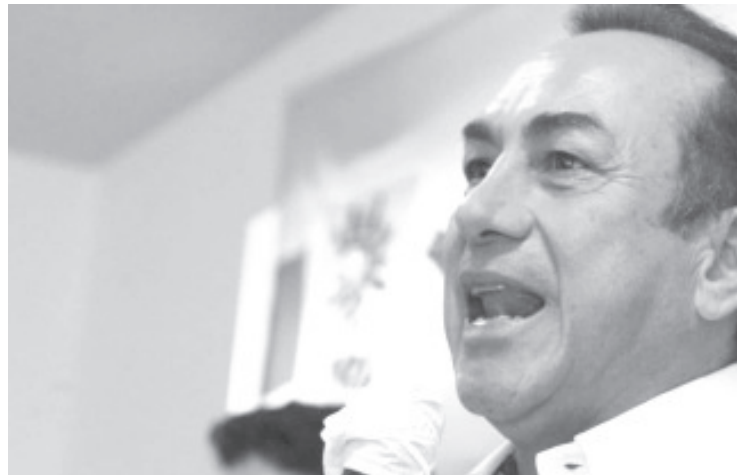
Consideró necesario que todas y todos los michoacanos usen el cubrebocas, y que acaten las acciones decretadas, en los espacios públicos y bares, antros y establecimientos nocturnos.

Llamó a las y los michoacanos a respaldar estas medidas que tienen como finalidad cuidar su salud y la de todos, con la intención de