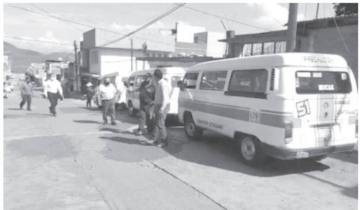
La supervisión fue para revisar que cumplan las medidas sanitarias destinadas para el transporte público como el lavado y desinfección de unidades.

Algunas de las rutas que esta ocasión fueron supervisadas son: la que presta el servicio a la Encarnación, Salesiano y Nicolás Romero. En adelante otras más serán supervisadas para invitarlos a cumplir las disposiciones oficiales y eviten cualquier tipo de sanción o multa.