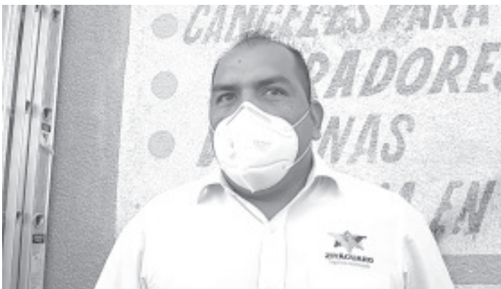
Es muy importante el cuidado de sus mascotas, quienes tengan una deben ser dueños responsables y vacunarlas.

Recalcó que estas acciones ayudarán a disminuir enfermedades en la población y además a disminuir el crecimiento de la población de caninos en el municipio.