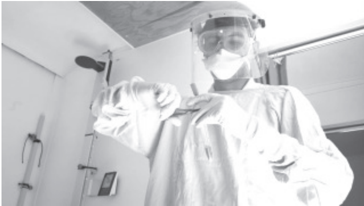
Se estableció que Lázaro Cárdenas, Múgica, Uruapan, La Huacana, Zamora, Pátzcuaro, Zacapu, Huetamo, Morelia y Sahuayo, se mantengan con Bandera Amarilla.

• Apatzingán, Zitácuaro, Puruándiro y Parácuaro disminuyeron riesgo de contagio y pasaron a Bandera Verde