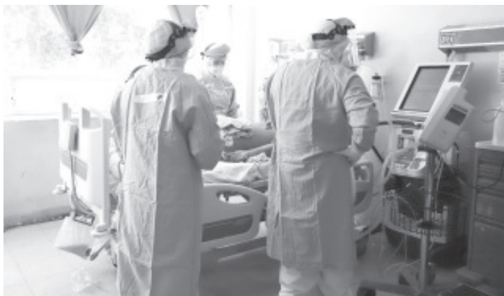
Del 12 de julio al corte del 2 de agosto, el número de camas ocupadas por portadores del virus SARS-CoV-2 pasó de 282 a 403, la ocupación se duplicó en un periodo de 3 semanas.

Con estas sencillas indicaciones se busca romper la cadena contagios, evitar la propagación del virus y con ello lograr que los servicios médicos en el estado no sean rebasados.