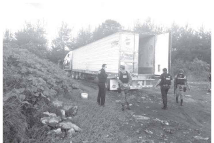
Personal de la Dirección General de Seguridad en Carreteras de la GN, dio seguimiento al atraco y localizó la mercancía oculta en un predio de la carretera federal Carapan-Playa Azul.

Los guardias nacionales subrayaron ante esta agencia de noticias que esta clase de operativos van a continuar con la finalidad de garantizar la tranquilidad de la ciudadanía y de las empresas que a diario envían vehículos de carga con sus productos para ser repartidos por la geografía michoacana y por el país.