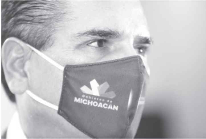
El Gobernador destacó que en los últimos 5 años se realizaron 5 mil obras que benefician a más de 4 millones de personas; lo que significa avanzar a 3 obras construidas por día.

Morelia, Michoacán, a 3 de agosto de 2020.- La transformación de la infraestructura de Michoacán que ha impulsado el Gobierno del Estado, hoy es clave para mover la economía, para generar empleos y crear espacios dignos