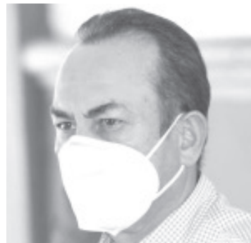
Son ya casi dos años que el sector de la construcción en nuestro país está contraído debido a una política pública federal errática y que se ha enfocado en debilitarlo.

mantenga su política restrictiva en los recursos destinados a la inversión física como lo visto en 2019 con un recorte del 12 por ciento, lo que aconteció en una recesión de la economía, México no contará con asideros reales para poder salir adelante de la crisis en la que hoy se encuentra.