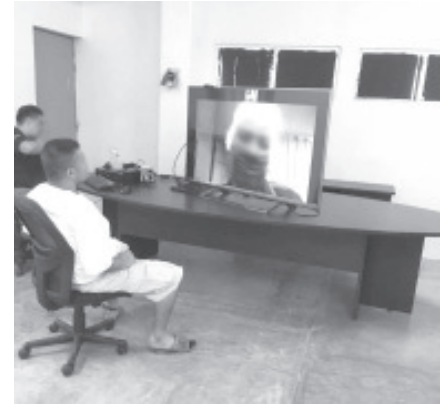
Michoacán se cuenta dentro de las pocas entidades federativas que no presentan casos, junto con Querétaro, Coahuila, Aguascalientes y Baja California Sur.

Al momento las personas privadas de su libertad a través de videollamadas han mantenido comunicación permanente con sus familiares.