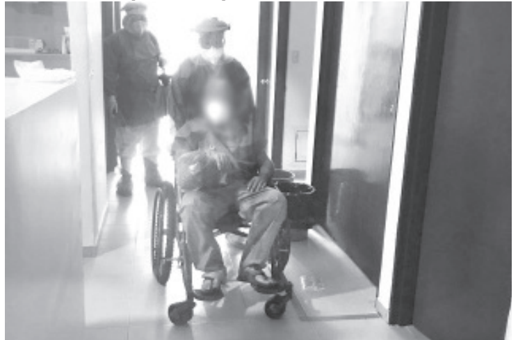
Después de más de 8 días de estancia hospitalaria, el paciente fue despedido por médicos y enfermeras con aplausos y bajo estrictos cuidados que deberá tener en casa.

La SSM mantiene a disposición de la ciudadanía el 800-123-2890 con 11 líneas para resolver todas sus dudas médicas, así como el micrositio bit.ly/MichCOVID-19, donde encontrarán toda la información disponible sobre el padecimiento.