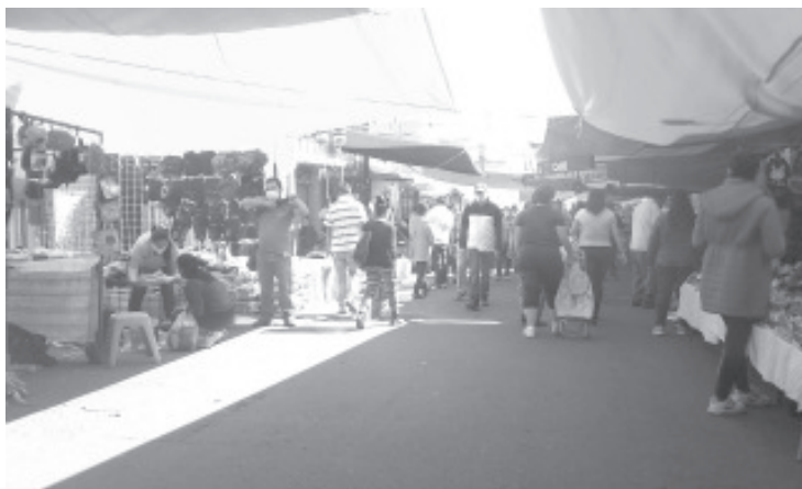
En los tianguis el ingreso de familias enteras que llegan a comprar, esto a pesar de que la indicación es que vaya solo una persona por cada familia.

El llamado desde el inicio ha sido el mismo por parte de las autoridades: permanecer en casa y solo salir si hay algún asunto importante, pero pocos lo acatan, y así se puede ver en varios sitios de la ciudad, principalmente los días jueves o los días de quincena.