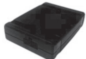
Cellocator CR300B LITE