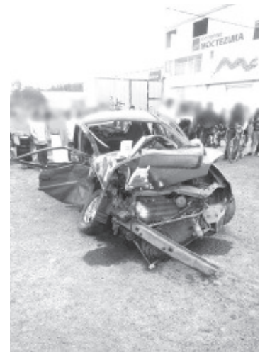
Los bomberos y paramédicos de Protección Civil Municipal acudieron y auxiliaron a los afectados, quienes fueron canalizados a un hospital.

La otra unidad siniestrada es de la marca Ford Fusion, color gris. Oficiales de la Policía de Tránsito arribaron a la escena e hicieron el peritaje correspondiente para deslindar responsabilidades. Por último, los vehículos perjudicados fueron llevados a un corralón.