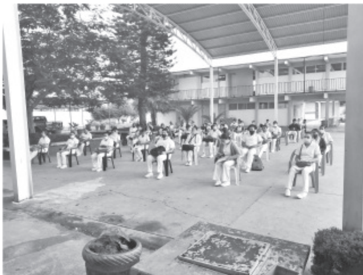
107 egresados atenderán unidades del IMSS, 12 asistirán al ISSSTE, 10 al Hospital Naval y 586 a Hospitales Generales y Centros de Salud dependientes de la Secretaría de Salud en el Estado.

Se trata de un requisito para la obtención de su título y cédula profesional como Profesionales Técnicos Bachiller