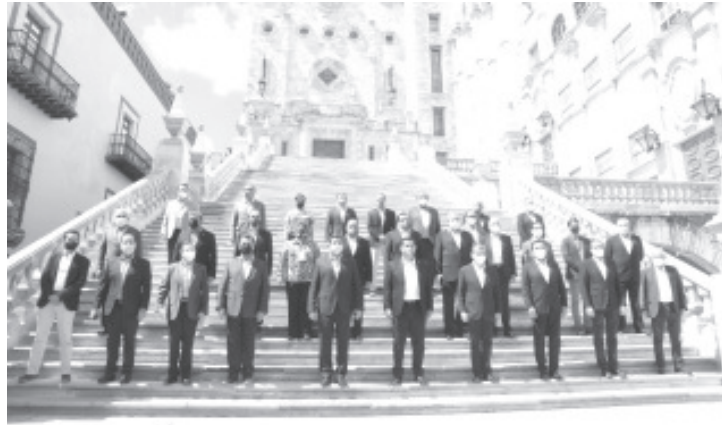
Gobernadores demandan que el Presupuesto Federal del año 2021 no se construya con la inercia negativa que se ha mantenido durante los últimos años, que en nada contribuye para que los Estados y Municipios enfrenten la crisis.

Gobernador Silvano Aureoles, explica que la desigualdad entre los estados se debe, en gran parte, por la falta de una redistribución