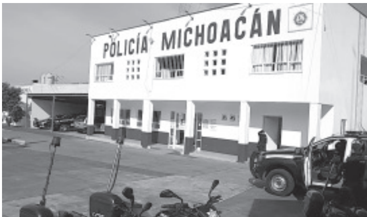
En Zitácuaro, los principales delitos que se presentan son robos a casa habitación y a comercios, así lo refleja la estadística del mes de julio que tiene la Secretaría de Seguridad Pública.

Actualmente Seguridad Pública tiene una plantilla de 500 elementos, de los cuales casi 300 son operativos. A diferencia de otras dependencias, el funcionario agregó que no se contempla disminución de esta cifra, se mantiene e incluso se pretende incrementarla.