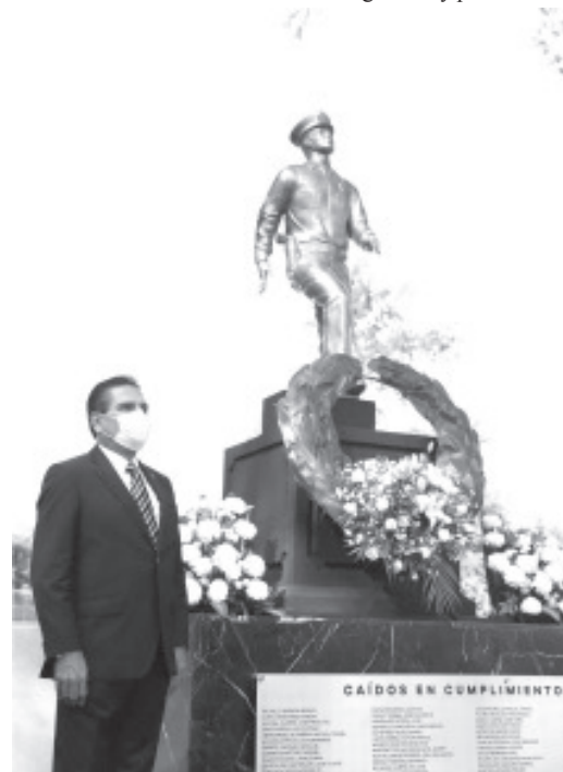
Cada 24 de julio, Michoacán reconocerá y recordará pública y merecidamente a quienes cuidan del estado, destaca el Gobernador.

En este marco, Aureoles Conejo reconoció la labor que las y los policías han desempeñado en medio de la epidemia por COVID-19, al ser los primeros en ocupar la línea de batalla, ante cualquier llamado de emergencia y apoyo que solicita la sociedad.