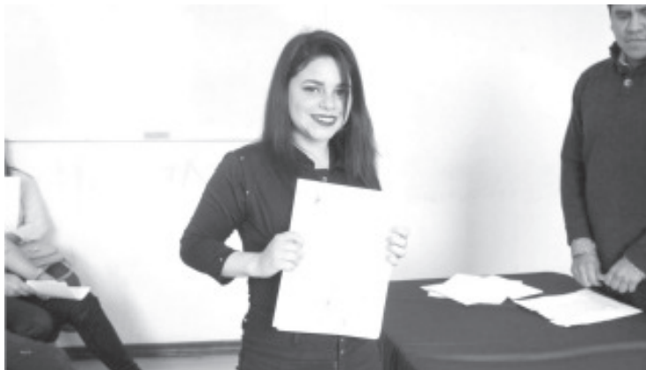
Casi 2 mil jóvenes de las escuelas normales para Educadoras y de Educación Física de Morelia, Tlaxiaco y Arteaga han recibido su constancia de liberación del servicio social.

Los interesados podrán encontrar los formatos de registro en la página web oficial del Ijumich ( jovenes.michoacan.gob.mx ).