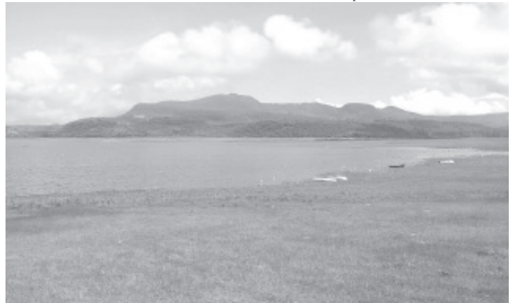
De acuerdo al monitoreo de presas que lleva la CONAGUA, el 24 de julio, la Presa del Bosque se encuentra en el 42% de su capacidad total, su recuperación es mínima.

Convocó a las autoridades competentes a tomar cartas en el asunto y llevar a cabo medidas que ayuden a que este cuerpo de agua se recupere y mantenga el nivel mínimo que debe tener para no poner en peligro su permanencia, ya que de estas aguas dependen pescadores, campesinos y hasta hogares de Toluca y la propia Ciudad de México, para ello debe haber un equilibrio.