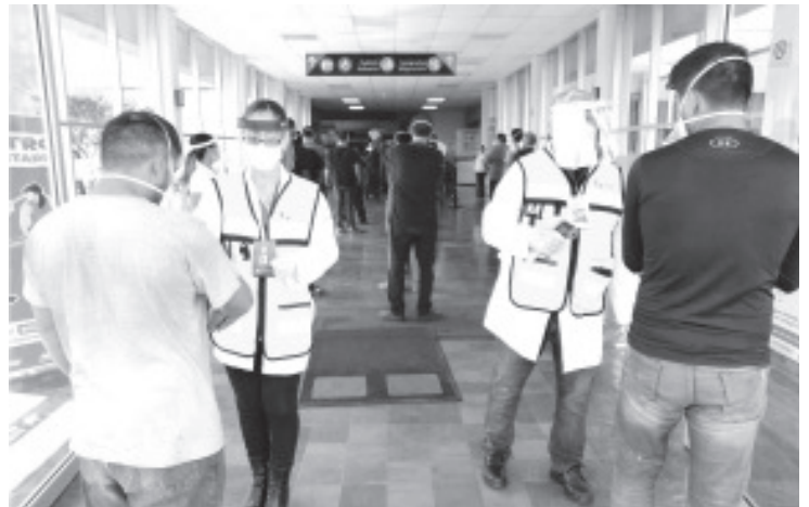
En coordinación con migración y aduanas, personal de sanidad internacional de la SSM, recibió a 135 pasajeros que arribaron en un vuelo procedente de Laredo, Texas

La SSM, en coordinación con otras instituciones vela y cuida por la salud y bienestar de las y los michoacanos que entran y salen de la entidad, así como de visitantes, por ello es importante que la población atienda las recomendaciones sanitarias emitidas para romper la cadena de contagio de COVID-19.