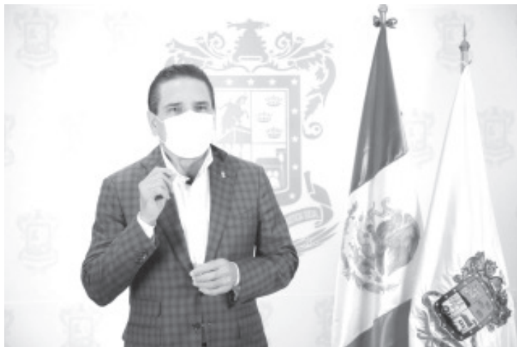
Silvano Aureoles citó tan sólo el ejemplo en Morelia en donde el pasado 31 de mayo hubo cuatro nuevos contagios, pero el miércoles 17 de junio, se confirmaron 41 casos nuevos.

El mandatario estatal consideró que Michoacán necesita que sus municipios redoblen los esfuerzos para garantizar que la población cumpla la aplicación estricta de las medidas de la Nueva Convivencia, en comercios, transporte,