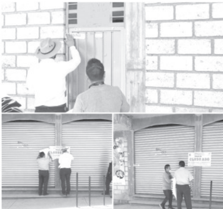
Entre los lugares clausurados se encuentran vinaterías, bares y un palenque clandestino, los cuales fueron cerrados por abrir en horarios no permitidos.

Zitácuaro se ubica en Bandera Amarilla, lo cual significa que el riesgo es alto ante el virus y sigue habiendo gente sin atender la emergencia. Al respecto, el presidente municipal destacó que el cierre de los comercios no esenciales obedece al desacato de las medidas que son instruidas desde el Gobierno federal y estatal para prevenir más contagios de Covid-19, lo cual pone en peligro a más zitacuarenses por la negligencia e inconsciencia.