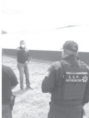
Toda especialización que imparte el IEESSPP para los funcionarios encargados de hacer cumplir la ley es integral, por lo que desde el inicio de la capacitación se realiza un diagnóstico general médico y de tiro.

Precisó que con estas acciones el Gobierno de Michoacán, a través del IEESSPP impulsa los programas de capacitación y profesionalización policial con el objetivo de forjar a la mejor policía del país.