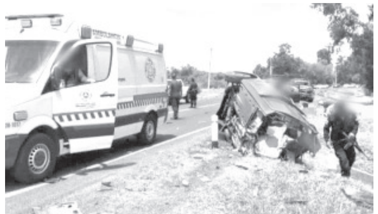
Tres personas fallecieron cuando dos vehículos protagonizaron un aparatoso choque en Indaparapeo.

Los policías acordonaron el área y pidieron la presencia de la Fiscalía General del Estado (FGE), cuyos agentes se hicieron cargo de las investigaciones respectivas y con apoyo de unos peritos criminalistas trasladaron los cadáveres a la morgue.