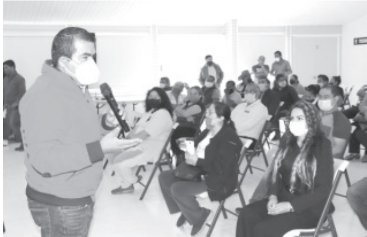
Dado el alto riesgo que existe en el municipio por COVID, se pretende evitar llegar a la Bandera Roja, donde se obligarían y extremarían medidas.