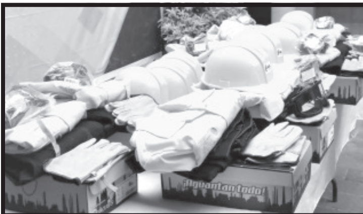
El alcalde subrayó la importancia de que los brigadistas cuenten con el equipo adecuado para atender de manera segura y efectiva los siniestros.