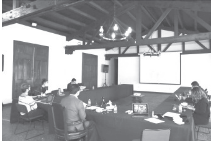
En reunión virtual y ante la velocidad de contagio que se ha registrado, el Gobernador y los alcaldes de Zitácuaro, Hidalgo y Uruapan, determinaron establecer mayores acciones.

En reunión virtual y ante la velocidad de contagio que se ha registrado, el Gobernador y los alcaldes de Zitácuaro, Hidalgo y Uruapan, determinaron establecer mayores acciones de promoción de las medidas preventivas para su implementación, como lo