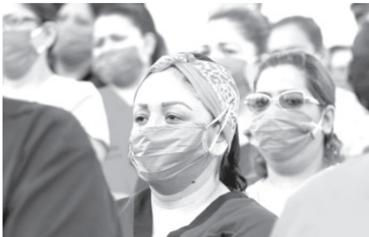
En cinco meses de pandemia, el Sars-Cov-2 ha cobrado más de 20 mil vidas sólo en México, de los cuáles se estima que cerca de 500 eran trabajadores de la salud, según cifras oficiales.

Esta información fue publicada originalmente por Mexicanos Contra la Corrupción y la Impunidad en: https://contralacorrupcion.mx/contagios-medicos-covid-19/