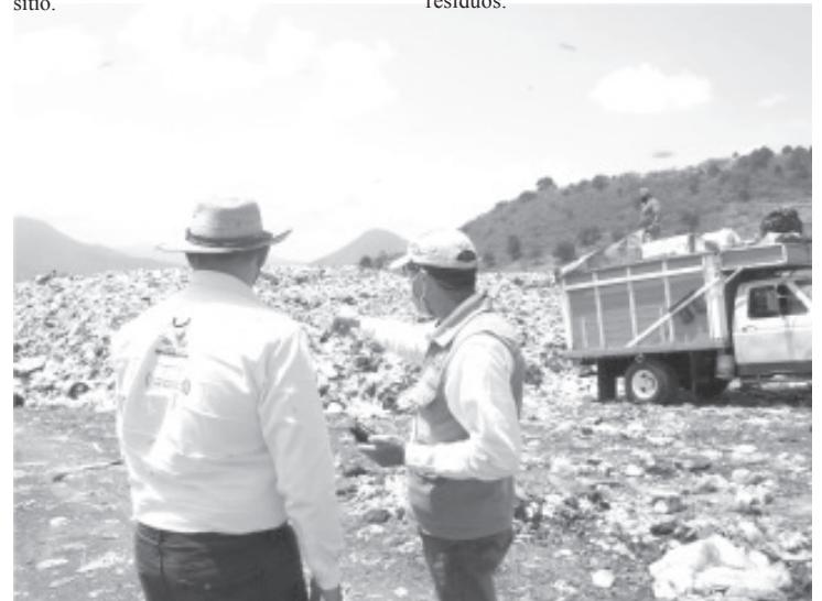
Los hechos encontrados en el sitio quedaron circunstanciados en un acta para su valoración y dictamen técnico, si son identificadas omisiones o irregularidades, los responsables serán sujetos de notificación.