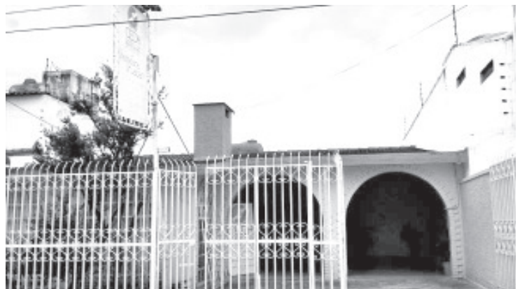
CEDH inició una investigación de oficio para verificar los abusos de que fueron objeto, cortadores de aguacate por parte de elementos policiacos, durante una revisión.

Tampoco este organismo se opone a que los servidores públicos con facultades para hacer valer la ley, cumplan con su deber; siempre y cuando tales actos se realicen conforme a las disposiciones establecidas en la Constitución Política de los Estados Unidos Mexicanos, los Tratados Internacionales y en las leyes y reglamentos locales disponibles.