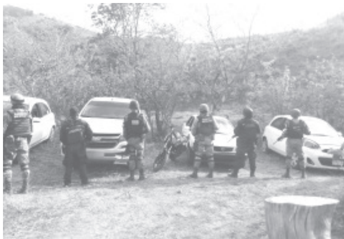
Fueron localizados tres automotores Nissan y una camioneta de la marca Ford, mismos que existen indicios de su relación en hechos delictivos, más una moto y otra unidad, robadas..

La SSP exhorta a la población a denunciar a la línea 911, todo hecho que atente contra la tranquilidad de las y los habitantes.