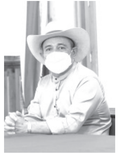
El Coordinador del Grupo Parlamentario del Partido del Trabajo, se encuentra en aislamiento voluntario y espera el resultado entre martes y jueves de esta semana.

Finalmente aseveró que, en un ejercicio de transparencia, habrá de dar a conocer el resultado de la prueba, una vez que éste le sea entregado y estará al