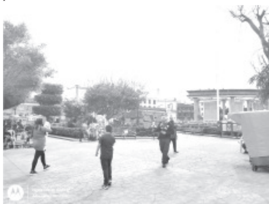
La Coordinación Municipal de Protección Civil y Bomberos y la delegación Regional de Protección Civil Estatal, reportaron saldo blanco y sin afectaciones hasta ahora.

Aunque cuerpos de auxilio no recibieron reportes por este sismo, de inmediato a bordo de unidades recorrieron las zonas de riesgo que ya tienen ubicadas, fue el caso de la Coordinación Municipal de Protección Civil y Bomberos y la delegación Regional de Protección Civil Estatal, ambos reportaron saldo blanco y sin afectaciones hasta ahora.