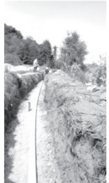
Desde el año 2015, en Zitácuaro se ha aplicado un monto por 110 millones 504 mil pesos en 32 obras y acciones que benefician a diversas localidades del municipio.

La segunda red consta de equipo de cloración y 3 mil 184 metros de tubería de PVC de 1.5, 2 y 2.5 pulgadas de diámetro. Con esto, los trabajos a instalarse suman en total 16.7 kilómetros de conductos que permitirán el acceso a agua potable de forma eficiente y regular por parte de la población, a la que se invita a realizar un consumo responsable del vital líquido.