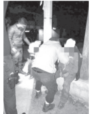
Un matrimonio de ancianos fue golpeado por su hijo, su nuera y su nieto, tras discutir por la posesión de unos terrenos.

Comentan los afectados que fueron golpeados con palos y una pala por su hijo y su esposa e hijo debido a una discusión por unos terrenos. Intervinieron elementos de Policía Michoacán.