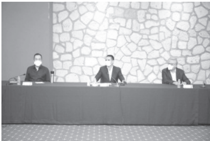
La capacidad de propagación del COVID-19 ha sido tal, que ya prácticamente en todo el territorio de Michoacán se cuenta con casos confirmados.

Morelia, Michoacán, a 15 de junio de 2020.- La capacidad de propagación de la epidemia del COVID-19 ha sido tal, que ya prácticamente en todo el territorio de Michoacán se cuenta con casos confirmados.