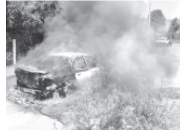
Ocurrió el incendio de un vehículo en la carretera que conduce de Macho de Agua a Crescencio Morales, a la altura de la cuarta manzana.

Asimismo señalaron que no está de más tener un extintor en la cabina del auto y capacitarse en su uso para poder combatir las llamas en caso del algún siniestro, además de tener en mente el número de emergencias 911.