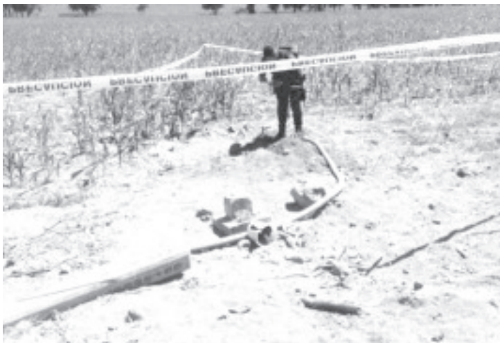
Se logró el aseguramiento de una toma clandestina de combustible, tres vehículos -uno con reporte de robo- y contenedores con hidrocarburo.

La SSP exhorta a la sociedad a denunciar a las líneas de emergencia 089 y 911 todo acto que atente en contra del bienestar de la población michoacana.