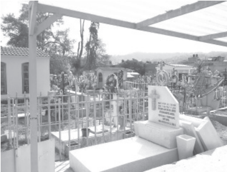
Dicha medida tiene como objetivo reducir la concentración de personas y cortar la cadena de contagios del covid-19.

- En la primera quincena de junio se han sepultado 22 personas.