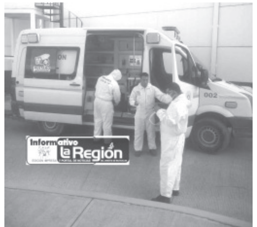
Personal de salud detectó tres casos positivos de coronavirus entre la policía de Huetamo, fueron aislados y se encuentran recuperándose en sus respectivos domicilios.

El Gobierno del Estado pone a disposición de la población el 800-123-2890 con 11 líneas para resolver todas sus dudas, así como el microsítio bit.ly/MichCOVID-19, donde encontrarán toda la información disponible sobre COVID-19.