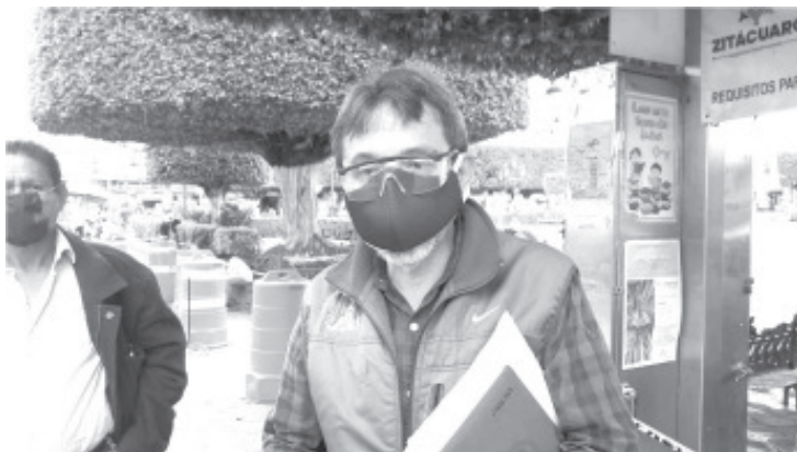
Antorcha Campesina se cuestiona que Andrés Manuel López Obrador no está atendiendo correctamente la crisis económica, ni el covid-19.