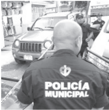
A punta de pistola los hampones le quitaron al agraviado 800 mil pesos en efectivo, los cuales eran producto de su labor como comerciante.

Ante lo ocurrido, los representantes de la ley exhortaron a la ciudadanía a no manejar dinero en efectivo en grandes cantidades y preferir las transacciones electrónicas para evitar situaciones como la citada. También, le recordaron a la ciudadanía que para la atención de cualquier emergencia está a disposición de la gente el número telefónico de emergencias 911.