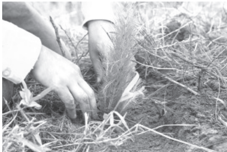
La temporada de reforestación se realizará del 9 de julio hasta los primeros días de septiembre, informó COFOM

Ante ello las solicitudes podrán ser presentadas hasta el 30 de junio en las oficinas de la Comisión Forestal del Estado.