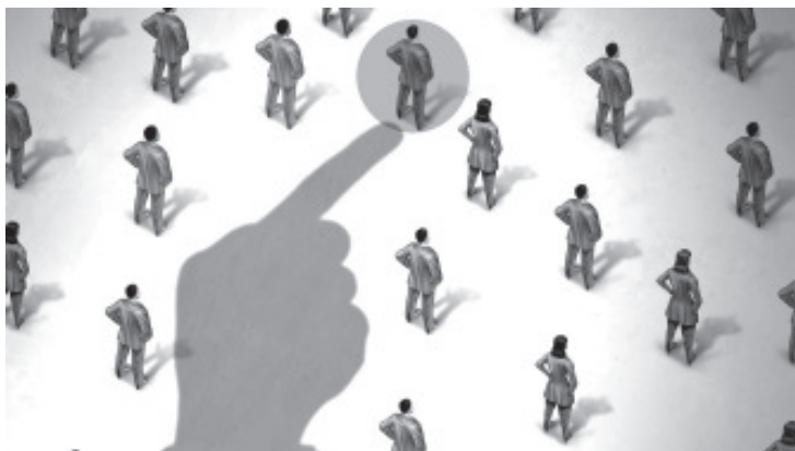
El objetivo del SNA es coordinar los esfuerzos de instituciones que ya existen para erradicar la corrupción en México

A cinco años de la creación del Sistema Nacional Anticorrupción (SNA), cuatro elementos han impedido su funcionamiento: 1) Nombramientos pendientes; 2) Medidas de austeridad que impiden realizar el trabajo de manera eficaz; 3) Descalificaciones públicas sin sustento por parte de los representantes políticos, particularmente del Presidente de la República; y, 4) Nulo compromiso de los titulares de las secretarías dependientes del Ejecutivo y de la Fiscalía