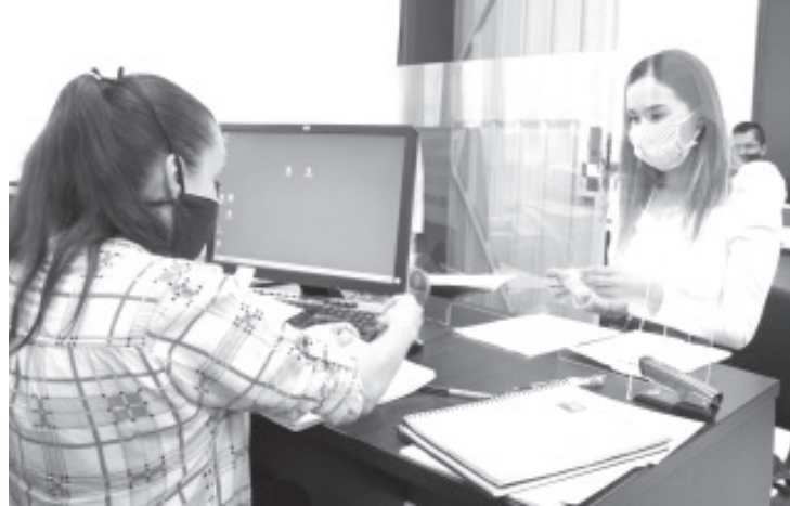
Las personas interesadas en la convocatoria, deberán entregar la documentación completa en las oficinas del Instituto de Capacitación y Servicio Profesional de Carrera de la FGE.