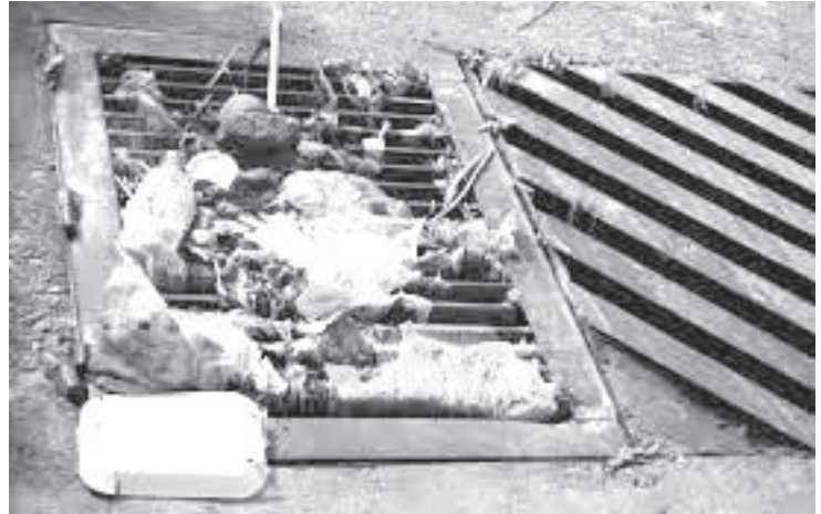
PCE exhortó a la población a cuidarse, estar al pendiente de la información de las autoridades y vigilar su entorno para evitar alguna desgracia.

forestal en el cerro Cacique lo agrega a esta lista, ya que existe la posibilidad de ocurran deslizamientos de tierra y bajada de material. Serrano Miralrío precisó que hasta ahora la temporada de lluvias de este año apenas inicia, y para hacer frente a las posibles afectaciones, existe trabajo conjunto con las coordinaciones de Protección Civil en todos los municipios, a fin de estar en comunicación