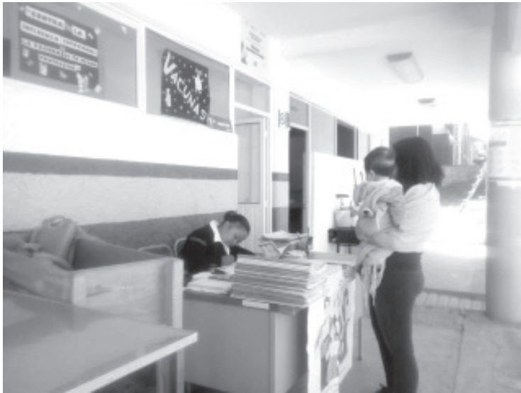
En los 9 Centros donde se hacen tomas de muestras, el sitio está delimitado con las demás áreas para evitar algún riesgo.

H. Zitácuaro Michoacán, 16 de junio de 2020.- Por: Guadalupe Solache Rebollo. Aunque muchas personas han dejado de acudir a los Centros de Salud por temor a contagiarse del covid-19, se continúa con la aplicación de las vacunas que se tienen en existencia.