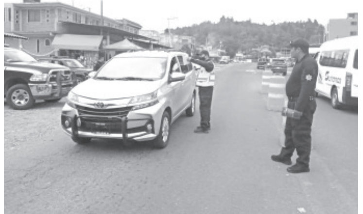
El personal exhorta a la población, a extremar las medidas sanitarias y solo acudir a espacios públicos para desarrollar actividades esenciales.

El Gobierno del Estado pone a disposición de la población el 800-123-2890 con 11 líneas para resolver todas sus dudas, así como el microsítio bit.ly/MichCOVID-19 , donde encontrarán toda la información disponible sobre COVID-19.