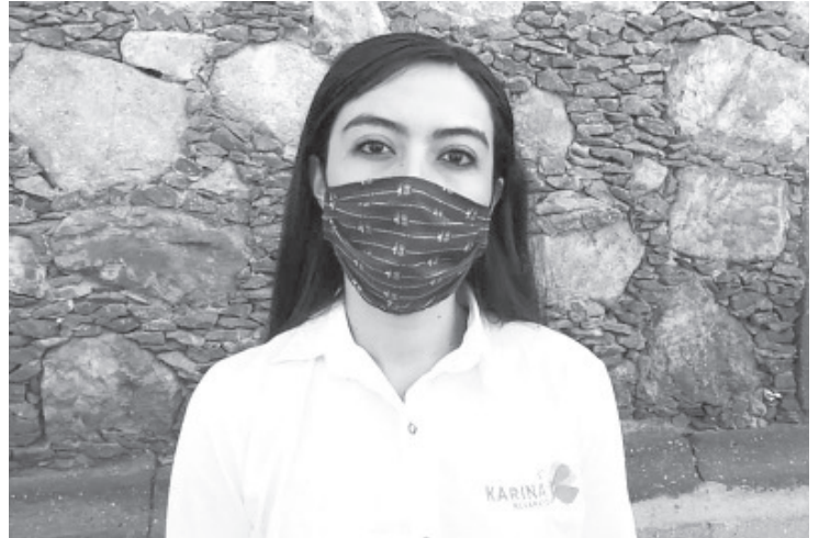
La violencia contra la mujer se ha incrementado un 30%, así lo revelan datos obtenidos de situaciones registradas en el teléfono de emergencia 911 y en la Oficina de Prevención del Delito.