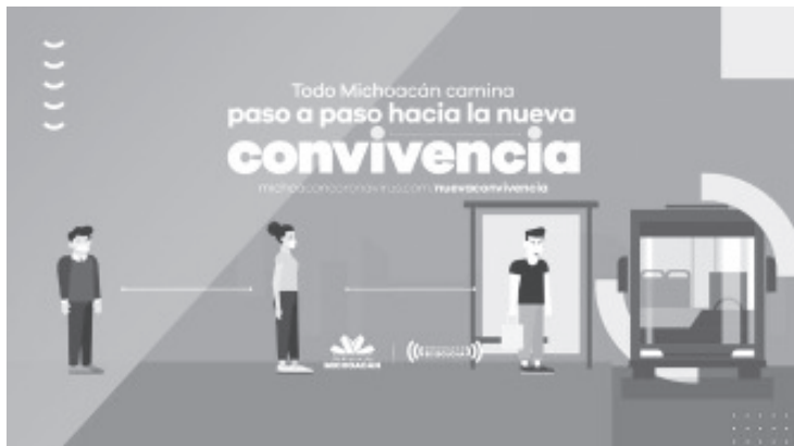
Este tipo de encuentros tendrá que ser menor a las 50 personas, evitar la presencia de adultos mayores y niños, o permanecer expuestos el menor tiempo posible.

michoacanas y michoacanos y se hará frente a la pandemia del COVID-19, para volver a estar más cerca de los nuestros a través de una Nueva Convivencia.