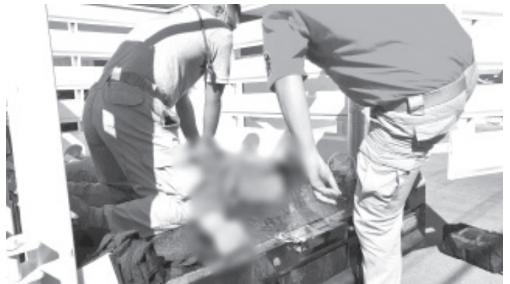
Un adolescente murió tras sufrir una descarga eléctrica luego de que por accidente tocara los cables de alta tensión.

Elementos de la Policía Municipal resguardaron la zona, más tarde al lugar arribó personal de la Fiscalía General del Estado quienes iniciaron las correspondientes averiguaciones.