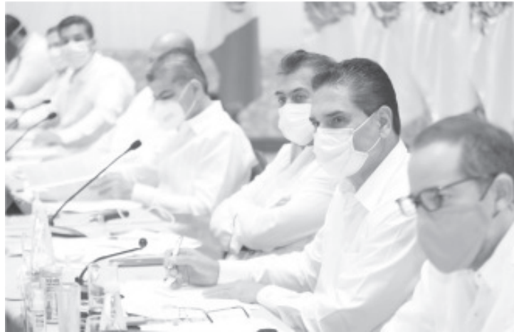
Ocho gobernadores de la región Noreste, Centro y Occidente del país, solicitaron un diálogo directo y abierto con el presidente de México, Andrés Manuel López Obrador.

Al dar lectura al posicionamiento conjunto de los gobernadores: Francisco García Cabeza de Vaca, de Tamaulipas; Enrique Alfaro Ramírez, de Jalisco; Jaime Rodríguez Calderón, de Nuevo León; Miguel Ángel Riquelme, de Coahuila; José Rosas Aispuro, de Durango; José Ignacio Peralta, de Colima; y Diego Sinhue Rodríguez Vallejo, de Guanajuato, Aureoles Conejo, destacó la importancia que amerita la crisis nacional por