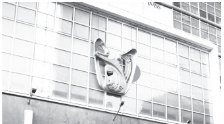
En San Luis Potosí, Industrias Sandoval S.A. obtuvo un contrato del IMSS, aunque antes el IMSS en Yucatán y Veracruz habían rechazado la propuesta porque sus ventiladores chinos carecían de registro sanitario de Cofepris.

En el acta del fallo que quedó desierto se enumeran las distintas carencias técnicas y legales de los ventiladores de esta empresa entre las que resaltan falta de certificado de Cofepris y certificado de buenas prácticas de fabricación en ventiladores.