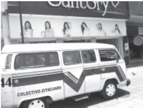
En COCOTRA estarán atentos para detectar a los chóferes que no cumplan, sobre todo en el primer cuadro de la ciudad.

H. Zitácuaro Michoacán, 05 de junio de 2020.- Por: Guadalupe Solache Rebollo. A partir del próximo lunes la Comisión Coordinadora del Transporte (COCOTRA) sancionará con 60 días de salario mínimo a los transportistas que no acaten las medidas sanitarias como: el uso de cubrebocas, sanitización del dinero, así como el lavado y