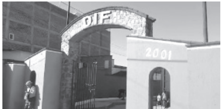
La problemática en las parejas y entre padres e hijos han ido en aumento, ante ello el DIF brinda apoyo psicológico y legal, mantiene personal de guardia.

Asimismo, Pliego Vázquez, añadió que en caso de detectar algún menor de edad en condición de calle o algún adulto mayor, sigue funcionando el albergue en caso que se requiera un resguardo temporal.