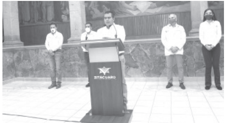
Zitácuaro está con bandera amarilla por tener actualmente 53 casos confirmados y 10 defunciones, 4 municipios permanecen en blanco por no tener casos y el resto están en color verde.

Añadió que por el momento hay personal en las comunidades y colonias donde se han registrado casos positivos de covid-19, esto para crear una forma de geolocalización y que la población sepa cómo se está presentando el virus y las precauciones que deben tomar.