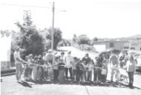
Esta pavimentación, es una acción más para mejorar la calidad de vida de sus habitantes, además de crear una vía más corta a la comunidad de Jaripitio.