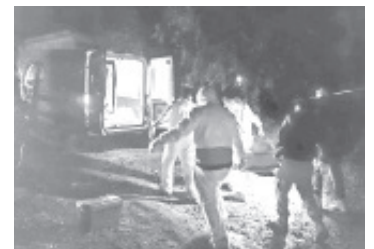
Una víctima murió en el lugar del accidente, otro fue encontrado sin vida más tarde, uno está desaparecido y otro resultó ileso.

Cabe mencionar que en estos momentos uno de los privados de la libertad sigue sin ser hallado, mientras que el cuarto agraviado está ileso, afortunadamente. Del asunto las autoridades investigadoras hicieron las actuaciones competentes para esclarecer lo sucedido.