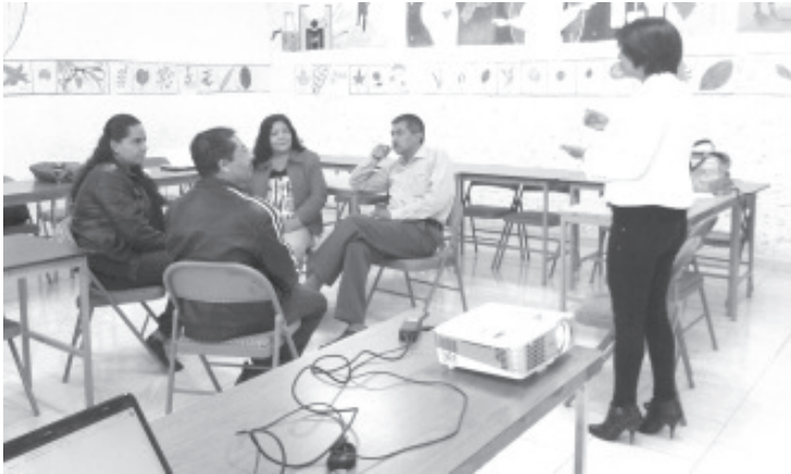
El Instituto Michoacano de Ciencias de la Educación ofrecerá durante el receso administrativo de verano 5 diplomados en línea, todos con reconocimiento oficial.

Los contenidos serán ofrecidos de manera virtual a partir del 29 de junio