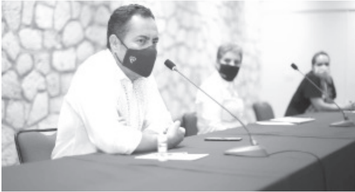
Michoacán ha registrado una de las tasas de contagios más alta del país, en Morelia tenemos cerca de 200 casos y en Lázaro Cárdenas sobrepasan los mil, no podemos seguir pensando que el coronavirus es un invento.