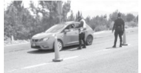
Sobre la carretera Zitácuaro-Toluca, agentes de la Policía Michoacán en coordinación con elementos estatales y federales, continúan con las labores preventivas encaminadas a hacer frente a la pandemia.

El Gobierno del Estado pone a disposición de la población el 800-123-2890 con 11 líneas para resolver todas sus dudas, así como el microsítio bit.ly/MichCOVID-19 , donde encontrarán toda la información disponible sobre COVID-19.