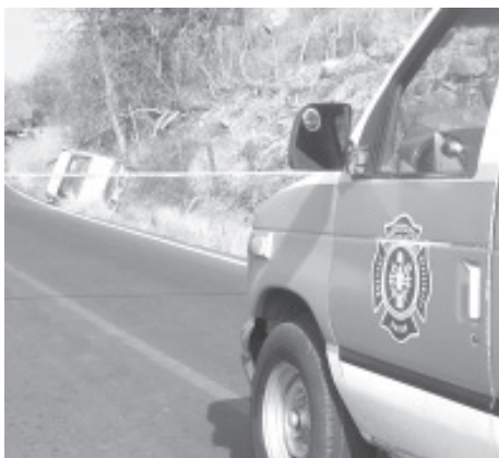
Un hombre, vecino de La Cortina, fue muerto de un disparo cuando viajaba al lado del conductor de una camioneta Nissan, Pick Up, en el camino a Camébaro.

Personal del Cuerpo de Bomberos acudió al lugar, en atención a una llamada telefónica, la camioneta estaba volcada sobre la cuneta, a la altura del