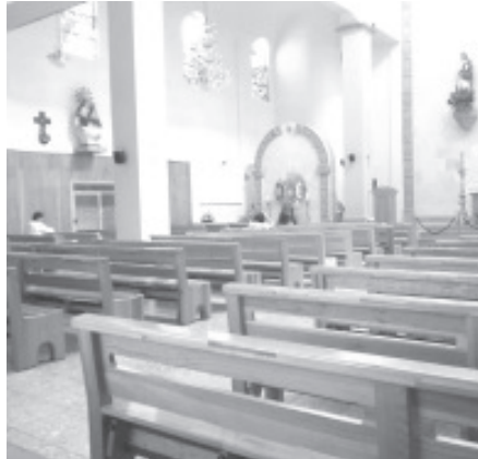
Durante las misas las iglesias católicas reducen el aforo de personas a su mínima capacidad y respetan las medidas sanitarias.

Exhortó a la población de Zitácuaro a cuidarse, acatar medidas, y tratar de no vivir con temor y miedo por las noticias que se difunden, por el contrario deben confiar en Dios y no dejar de orar.