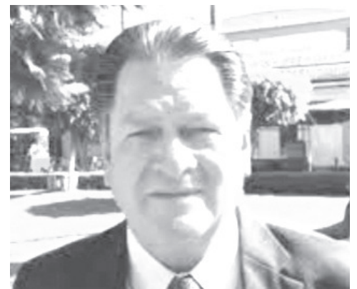
Ningún alumno será afectado en sus calificaciones, ya que los maestros deberán considerar la calificación que ya tenía antes de la cuarentena.