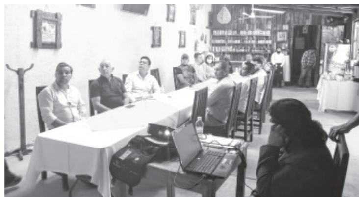
Para evitar cualquier riesgo a la salud de la población, personal de las casas funerarias del oriente del estado ha sido capacitado por la COEPRIS.

«Están conscientes del riesgo que representa no realizar todas las medidas de seguridad y se han sumado, hay mucho interés