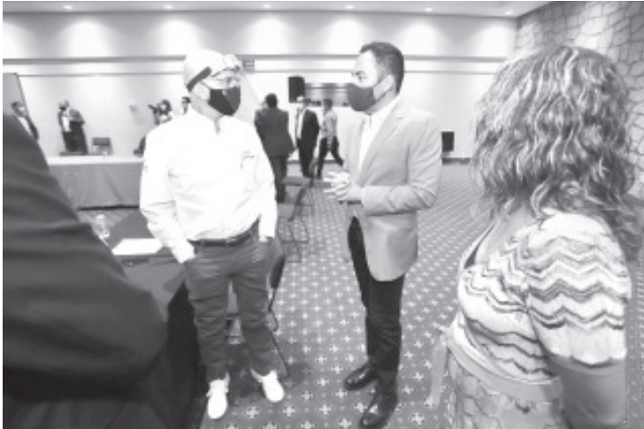
En el Gobierno del Estado se actuó velozmente ante el inicio de la pandemia COVID-19 a nivel nacional, al suspender actividades escolares antes de lo planeado por la federación.