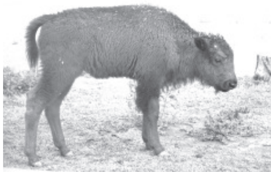
Su período de gestación dura entre 260 y 280 días, nace una sola cría que es cuidada durante un año. Los bisontes llegan a su madurez a los 3 años de vida.

Aunque solía ser bastante común observarlos en prácticamente toda Norteamérica, actualmente el bisonte americano se encuentra en peligro de extinción en México, únicamente existe una sola manada de estos animales, que habita en la Reserva de la Biósfera de Janos,