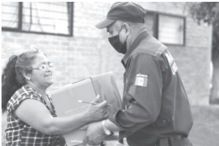
Se han registrado 519 mil 903 solicitudes en las plataformas digitales, vía telefónica o de manera presencial a través de los comités regionales de atención.

«La Policía Michoacán participa con 161 patrullas en promedio y un aproximado de 800 elementos por día, quienes de manera ordenada entregan los apoyos», concluyó.