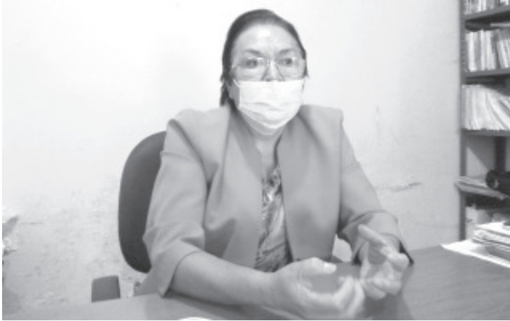
Por la falta de apoyo de las autoridades, en Zitácuaro podrían cerrar alrededor de 100 «tienditas» cuyos propietarios son personas de la tercera edad.

- Una causa es la falta de apoyo de las autoridades