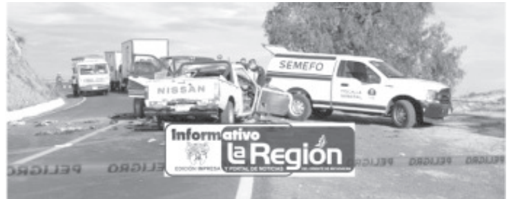
El choque frontal entre dos camionetas dejó como saldo tres muertos y cinco heridos, tragedia que se registró sobre la carretera libre Morelia-Maravatio, en el municipio de Charo.

+ Hay 5 sobrevivientes, que resultaron heridos. + El percance tuvo lugar en la carretera libre Morelia-Maravatio.