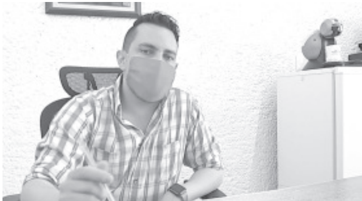
La idea es invitar a la población a qué deje de comprar en tiendas de autoservicio y lo hagan mejor en esas personas que venden sus hortalizas, frutas, verduras en la calle.

Insistió que a través de esta dependencia, durante este momento de contingencia se ha tratado de estar atentos a las necesidades de los productores, esto implica escuchar sus demandas y tratar de crear las estrategias que se requieren, esta campaña es una de ellas.