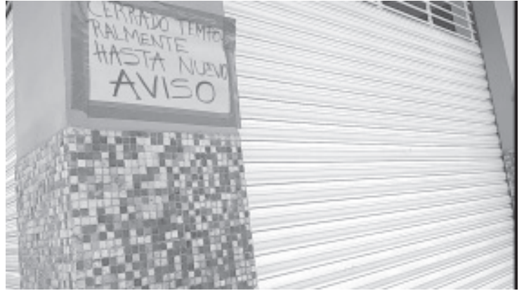
Ante el cierre de negocios cuya actividad no es esencial como los «giros rojos», el Ayuntamiento Municipal buscará alguna alternativa para que no se vean tan afectados.