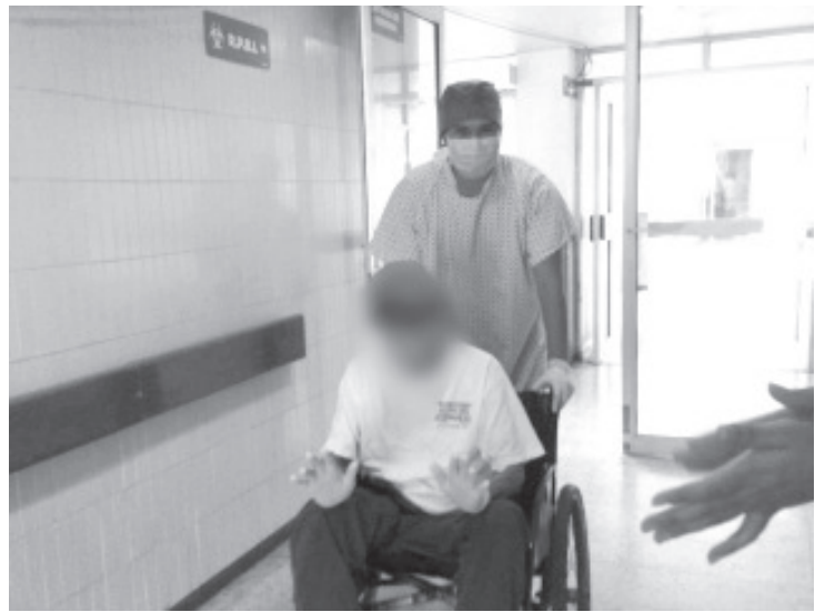
El último egreso corresponde a un hombre de 78 años, que permaneció 10 días hospitalizado bajo cuidados y atención médica.

La SSM mantiene a disposición de la población el 800-123-2890 con 11 líneas para resolver todas sus dudas médicas y de orientación para saber a dónde acudir en caso de alguna sintomatología, así como el micrositio bit.ly/MichCOVID-19 donde encontrarán toda la información disponible sobre COVID-19.