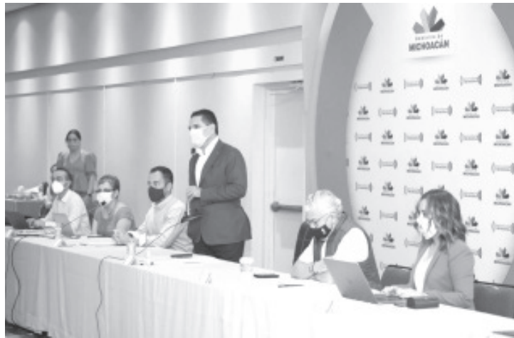
En la Nueva Convivencia todos y todas compartimos una gran responsabilidad, y si uno o más fallamos, muchas familias pueden ser perjudicadas en su salud o su economía.

«Por dos semanas diseñamos con la Secretaría de Salud, los protocolos y lineamientos que los dueños y dueñas de negocios, propietarios y directivos de empresas, deben seguir estrictamente para