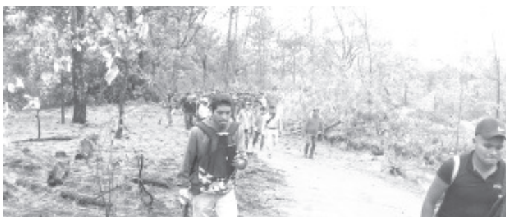
La multitud enardecida detuvo a 9 personas en el predio Piedra del Montón, supuestos talamontes a los cuales encontraron cajeteando plantas de aguacate que ya habían sembrado.

Aseguraron que a los detenidos no se les soltará hasta que se tengan acuerdos y eso se podrá dar en el transcurso de este martes, cuando se reúnan todos los representantes de los anexos junto con el de bienes comunales, «ya que al pueblo de La Zarzamora si le interesa cuidar su bosque, es lo que nos mantiene vivos», dicen los habitantes.