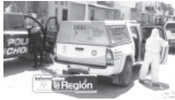
Los uniformados localizaron al interior de un domicilio a dos personas del sexo masculino baleadas, una de ellas ya sin vida. La edad de las víctimas oscila entre los 35 y los 40 años.

Asimismo, los policías hallaron en la vía pública un coche de la marca Nissan, de color rojo, con placas de circulación PFP033F de