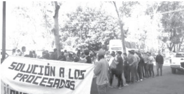
Los detenidos tenían un bloqueo con 500 vagones del ferrocarril, según los datos de las empresas afectadas brindados en aquel momento a fuentes gubernamentales.

En ambos casos el proceso de los indiciados continúa y ahora tanto la defensa de los chicos como la FGR deberán aportar más pruebas en el plazo fijado de investigación complementaria para que la autoridad judicial respectiva defina la situación legal de los imputados.