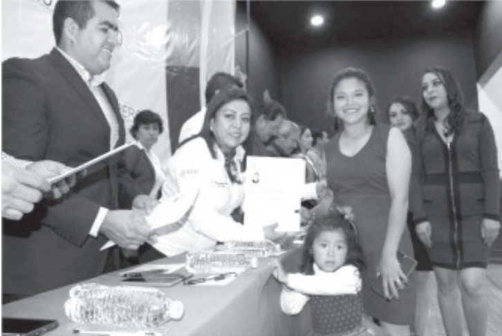
Celebra ICATMI 28 años de contribuir a mejorar la generación de ingresos de la población, principalmente de escasos recursos, a través de más de 800 mil cursos de formación laboral.

Se han realizado más de 800 mil capacitaciones dirigidas principalmente a población de escasos recursos