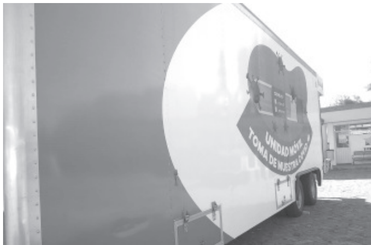
Las personas que acuden tienen que responder un interrogatorio, pasar una revisión médica para comprobar que tiene el perfil operacional del virus, y se le toma la muestra.