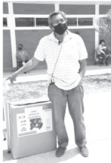
En Zitácuaro, el Gobierno estatal, en coordinación con el Ayuntamiento y aportación económica del Gobierno Federal, entregó apoyos a 20 microempresarios de giros diversos.

En el municipio de Zitácuaro, el Gobierno de Michoacán, en coordinación con el Ayuntamiento local y aportación económica del Gobierno Federal, entregó apoyos a 20 microempresarios de giros diversos, como tiendas de abarrotes, talleres mecánicos, de hojalatería, de costura, de calzado, ferretería, veterinaria, tienda de venta de alimentos, vulcanizadora y cerrajería.