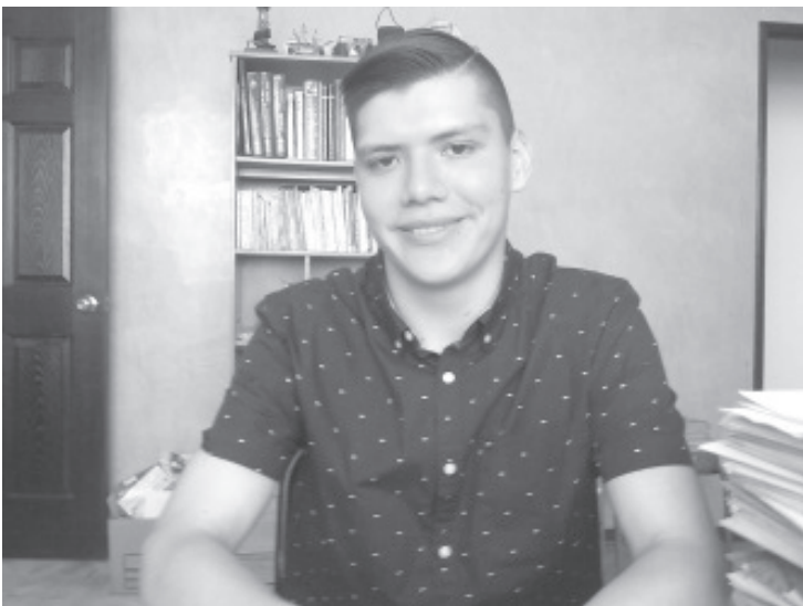
Quiero llegar a los jóvenes y que se den cuenta que a pesar de situaciones adversas, hay futuro y esperanza, que se puede salir adelante.

Añadió que se inspiró en escribir este libro, luego de que se dio cuenta el por qué había jóvenes que aún con adversidades salían adelante y por el contrario otros jóvenes que aún en situaciones privilegiadas se encargaban de desfavorecer sus vidas.