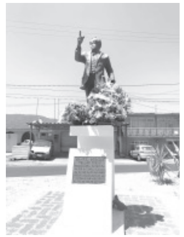
Los miembros del Club de Periodistas Manuel Buendía Tellezgirón, recordaron el 94 aniversario del natalicio del columnista nacido en esta ciudad un 24 de mayo de 1926.