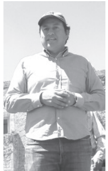
La decisión de limitar o controlar el acceso al Cacique se tiene que tomar de forma consensada, ya que en Nicolás Romero hay ejido y también comunidad.

En lo que le compete, puntualizó que como Jefe de Tenencia de Nicolás Romero estará atento a las investigaciones y se ha invitado a los pobladores a proporcionar información si saben o sospechan de quién pudo haber provocado el siniestro.