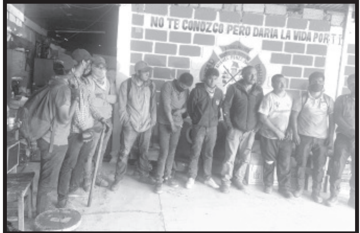
Con el apoyo de bomberos fue más fácil bajar porque llevaban lazos y no les costó tanto descender, expresó uno de los rescatados.