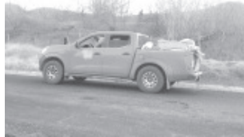
12 cadáveres del sexo masculino fueron abandonados en la batea de una camioneta con placas guerrerenses en un predio del municipio de San Lucas.

Los finados estaban en la caja de una camioneta de la marca Nissan NP300, de color rojo, con matrícula de Guerrero, la cual fue