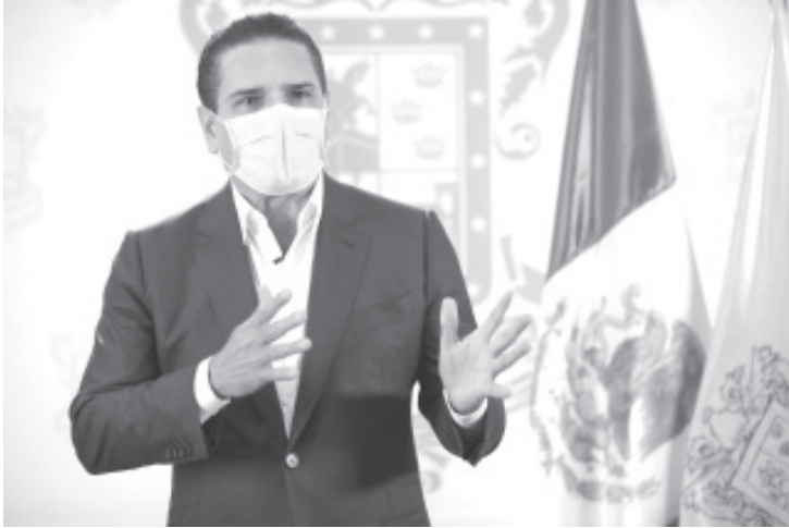
En Michoacán estamos por comenzar una Nueva Convivencia, esto significa, poner reglas claras para que la apertura de lugares se haga poco a poco, ordenadamente: Gobernador.

Morelia, Michoacán, a 25 de mayo de 2020.- De manera gradual, responsable y bajo medidas sanitarias, a partir del próximo lunes 1 de junio, Michoacán transitará hacia una Nueva Convivencia, afirmó el Gobernador Silvano Aureoles Conejo.