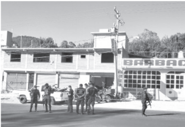
El múltiple crimen desató una fuerte movilización policiaca y militar al lugar de los hechos, a un costado del comercio «Tacos Moy», cerca de las 6 de la tarde.

El evento delictivo ocurrió a un costado de la carretera federal Zitácuaro-Morelia. Voces gubernamentales comentaron a este medio que los ahora occisos están en calidad de desconocidos. Los vecinos del lugar narraron a los representantes de la ley que únicamente escucharon diversas detonaciones de arma de fuego y posteriormente se enteraron de lo sucedido, instante en que llamaron al número telefónico de emergencias 911.