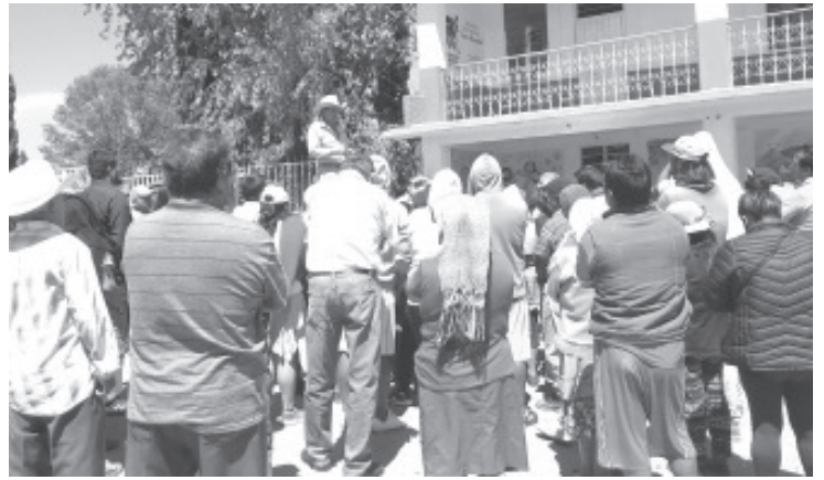
Ejidatarios y comuneros, pedirán apoyo técnico de ingenieros y especialistas a fin de crear un proyecto integral que dé respuesta al problema ambiental que se tendrá por la devastación del cerro Cacique.