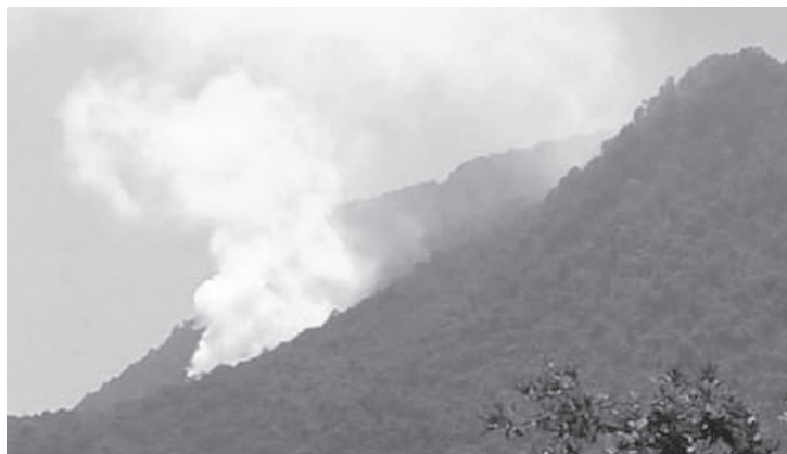
Toda la semana el cerro estará vigilado, hoy hay dos brigadas en la montaña: la del municipio y de la Reserva de la Biosfera, también voluntarios de Nicolás Romero y El Aguacate.