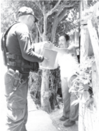
Las casi 10 mil despensas de Michoacán si alimenta ya se distribuyen en Tuxpan, Ocampo, Anganguero, Jungapeo, Juárez, Susupuato y Tuzantla, además de Zitácuaro.

-Los paquetes alimenticios ya se distribuyen en Tuxpan, Ocampo, Anganguero, Jungapeo, Juárez, Susupuato y Tuzantla, además de Zitácuaro