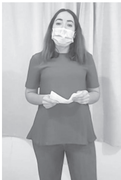
Los tres pacientes tuzantlenses fueron diagnosticados hace 2 semanas con COVID-19 y hoy han superado la lucha contra el virus, informó la presidenta.

Finalmente invitó a la población a continuar con las medidas de prevención, sana distancia y el lavado constante de manos, así como el continuar quedándose en casa si no es necesario salir, y que debemos ser pacientes para pronto podernos abrazar.