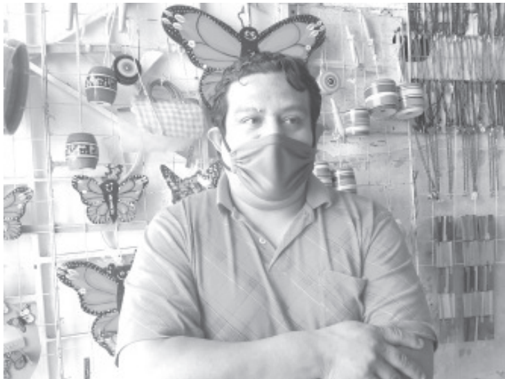
Al menos 5 personas por el momento están a punto de dejar de producir artesanía, les gusta lo que hacen, pero no tienen materia prima para continuar trabajando.

Cómo representante del sector de los artesanos, convocó a la autoridad a no dejar en el abandono a este rubro de la población y tomarlo en cuenta para la reactivación económica que se tenga, ya que es uno de los grupos vulnerables que requieren apoyo.