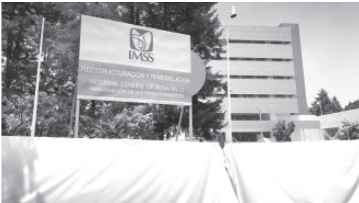
El Hospital General 32 del IMSS, uno de los hospitales reconvertidos para tratar a pacientes de Covid-19, fue reconstruido tras el sismo de 2017 con un sobre costo de 141 millones de pesos.

Esta información fue publicada originalmente por Mexicanos Contra la Corrupción y la Impunidad en: https://contralacorrupcion.mx/irregularidades-reconstruccion-hospital-imss/