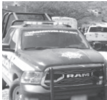
Un hombre fue asesinado a balazos frente al Rastro Municipal, ubicado en Indaparapeo, está en calidad de desconocido.

De igual manera, trascendió en la labor noticiosa que el finado es una persona de piel morena, de 1.80 metros de estatura y de pelo castaño; vestía un pantalón de color negro, una camisa verde de tela camuflada y unos tenis negros con líneas blancas y rojas. Los policías hicieron diversos patrullajes, pero al final no hubo detenciones relacionadas con el caso, mencionaron contactos allegados al asunto.