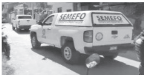
policíacos. Con relación al asunto, se pudo saber en

Ciudad Hidalgo, Mich.- Lunes 18 de mayo de 2020.- Tres hermanas de la tercera edad fueron víctimas de los «amantes de lo ajeno», quienes irrumpieron en su domicilio y aparentemente con el objetivo de robarles dinero en efectivo las agredieron de forma violenta, dos de ellas murieron y una quedó lesionada, según la información proporcionada a este medio por contactos