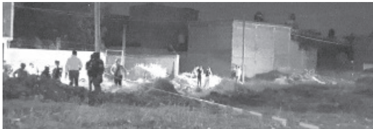
Fue localizado un cadáver de una mujer dentro de una maleta, misma que estaba abandonada en un lote baldío.

En el lugar el personal de la Unidad de Servicios Periciales y Escena del Crimen se encargó de efectuar las correspondientes averiguaciones y una vez concluidas las actuaciones de ley trasladaron el cuerpo al Semefo local en espera de que acudan sus deudos a identificarle.