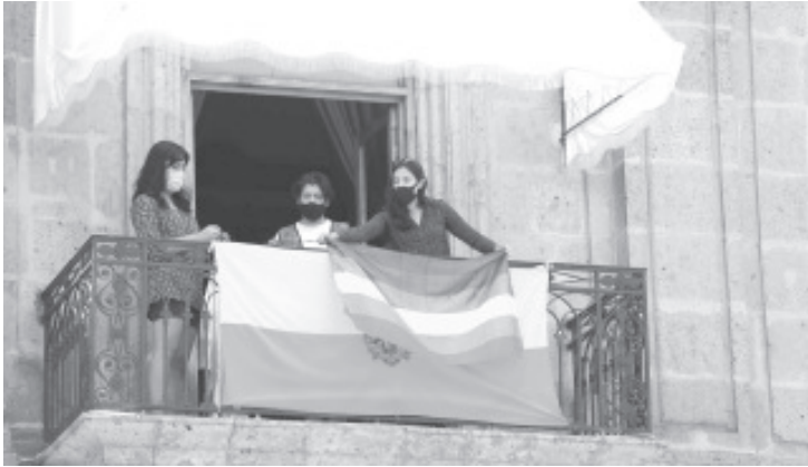
En el Día Internacional contra la Homofobia, Lesbofobia, la Transfobia y la Bifobia, se colocaron por segundo año consecutivo las banderas que identifican al movimiento en Palacio de Gobierno.