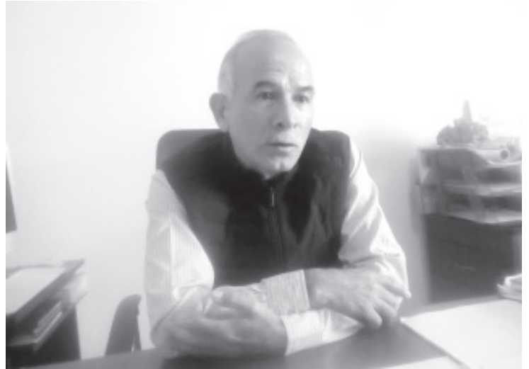
No tiene ningún costo, únicamente la persona que tenga síntomas debe acudir y responder un interrogatorio, luego se le toma la muestra mediante un hisopo de la faringe.