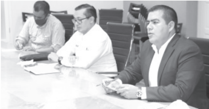
Las medidas de distanciamiento social son obligatorias, así como el cierre de comercios que expenden productos no esenciales y la detención por falta administrativa.

-Los dos casos registrados como positivos una se atiende en su casa y otra en el hospital. -55 han sido descartados y actualmente seis inciertos están en espera de sus resultados.