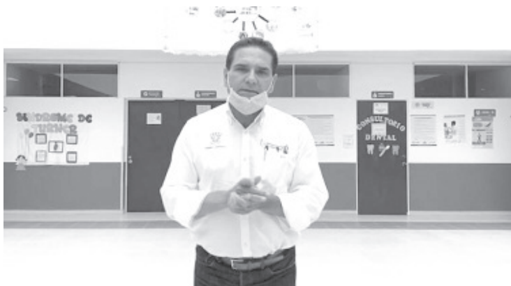
Insiste Gobernador en la urgencia de que la Federación haga llegar recursos extraordinarios e insumos para hacer frente a la emergencia sanitaria.

Morelia, Michoacán, a 19 de abril de 2020.- El Gobernador de Michoacán, Silvano Aureoles Conejo, hizo un llamado al Presidente Andrés Manuel López Obrador para que no deje solo a Michoacán e instruya lo antes posible el envío de recursos extraordinarios y de insumos que se requieren para hacer frente a la actual emergencia sanitaria.