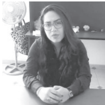
El primer crédito es hasta 6 mil pesos, dan tres meses de gracia y a partir de julio se empieza a pagar hasta terminar de finiquitarlo con ninguna tasa de interés.

«En Michoacán no somos industriales, nos debemos a las pequeñas empresas, por eso la invitación es que busquen el crédito que mejor se adapte a lo que se trabaja, es tan sencillo que hasta puede acceder a estos apoyos una persona que venda gelatinas en el jardín, la idea es ayudarlos a pasar esta situación que se vive por la contingencia», expresó.