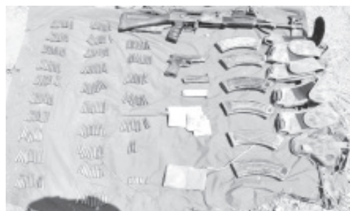
El menor de edad, llevaba dos armas de fuego y cartuchos útiles; hecho ocurrido en este municipio de San Lucas.

San Lucas, Michoacán, a 20 de abril del 2020.- Resultado de labores operativas, elementos de las secretarías de Seguridad Pública (SSP), de la Defensa Nacional (SEDENA), y de la Guardia Nacional (GN), aseguraron a un menor de edad, en posesión de dos armas de fuego y cartuchos útiles; hecho