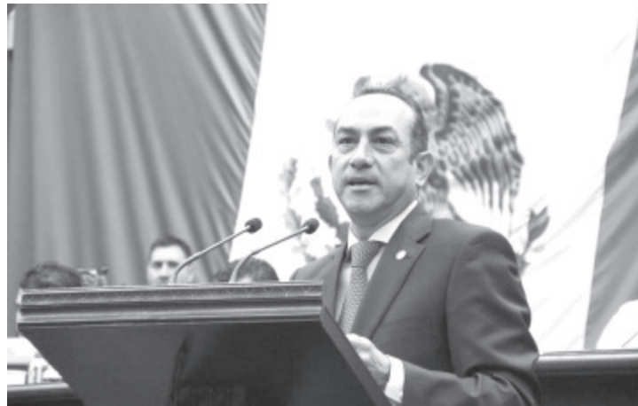
El grupo parlamentario del PRD respalda el periodo de aislamiento anunciado por el Gobernador Silvano Aureoles y el Plan Alimentario para atender a las familias.

El diputado recordó que si bien, la sociedad michoacana ha respondido de manera favorable y responsable a las medidas de prevención determinadas por las autoridades, también es cierto que han existido franjas de la población que no lo han hecho, circulando por la vía pública sin aplicar