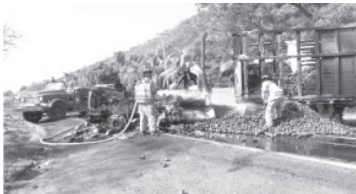
Los manifestantes gritaban consignas en contra de los uniformados y estaban armados con piedras y palos, además quemaron un camión de carga y neumáticos.

Múgica, Mich.- Domingo 19 de abril de 2020.- Un grupo de civiles bloqueó la carretera Gambara-El Letrero, donde quemó un vehículo de carga y llantas para impedir el paso de las fuerzas del orden. De acuerdo con fuentes de inteligencia policial y militar, los inconformes fueron pagados por células de la delincuencia