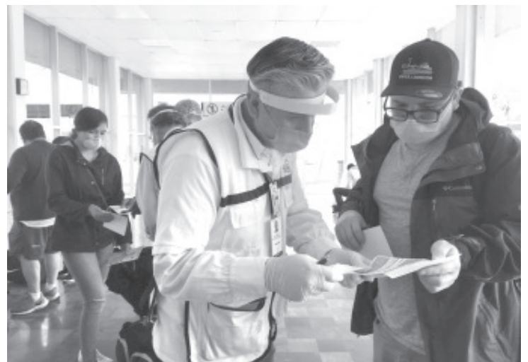
20 mil 951 migrantes de los 38 mil 800 que viajaron durante este periodo a Michoacán en 2019, ahora se quedaron en casa.

Además de la Semigrante, INM y Secretarías de Salud, en el operativo también participaron, el Instituto Nacional Electoral (INE), Procuraduría Federal del Consumidor (PROFECO), Comisión Estatal de Derechos Humanos (CEDH), Secretaría de Seguridad Pública (SSP), Instituto Estatal de Estudios Superiores en Seguridad y Profesionalización Policial (IEESSPP), Comisión Ejecutiva de Atención a Víctimas, Policía Federal y Ángeles Verdes, entre otros.