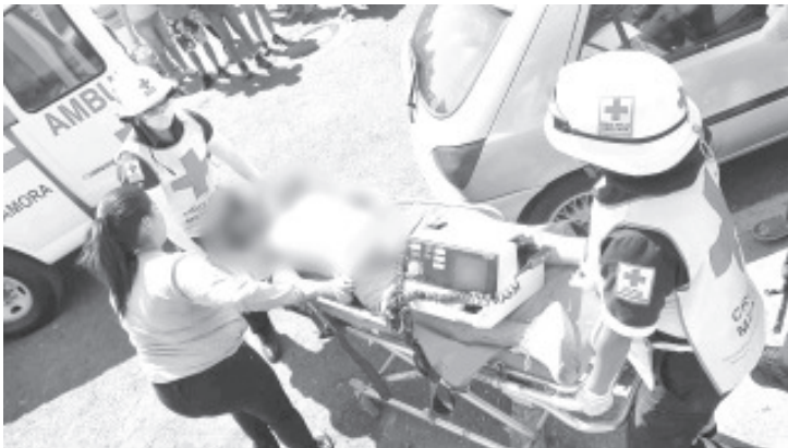
Un joven fue atacado a balazos por sujetos desconocidos y fue canalizado a un hospital donde lamentablemente murió más tarde.

De lo ocurrido tuvo conocimiento el personal de Unidad de Servicios Periciales y Escena del Crimen, mismo que acudió al lugar de la agresión para recolectar indicios y testimonios siendo iniciada la carpeta de investigación correspondiente.