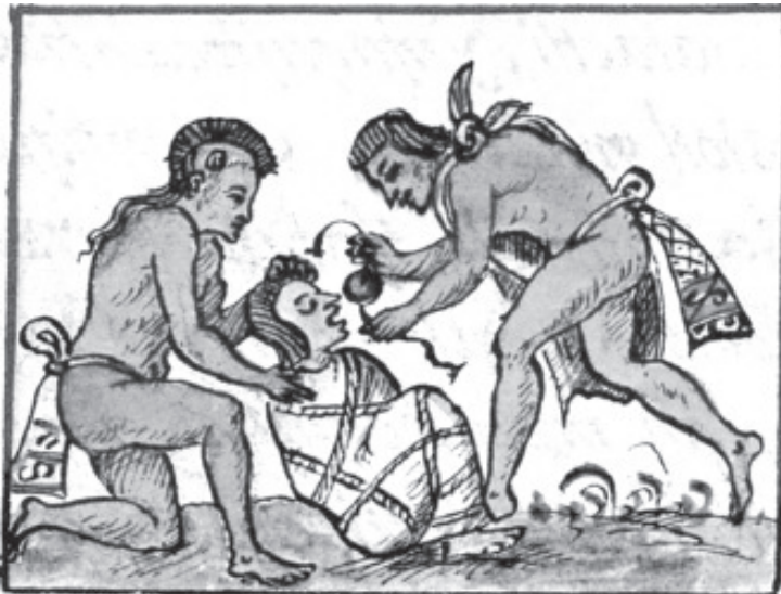
Pareciera que el continente americano era un paisaje idílico comparado con Europa en el que no ocurrían epidemias, pero nada más lejos de la verdad: David Romero. Foto: LocalMX.

Finalmente, la pandemia de influenza, llamada gripe española, en 1918 ocasionó 50 millones de muertos en el mundo y en México hubo medio millón de muertos. En ese tiempo se daba quinina a los pacientes, comúnmente usado para combatir la malaria, para disminuir la fiebre. Y en las calles se esparcía criolina, una mezcla de jabón con lejía y al igual que ahora se tomaron medidas de aislamiento. Sin embargo, la medida de salud clave que contribuye a controlar el ataque de epidemias fue la vacunación que inició en 1920. La vacunación, logro de la ciencia, es y seguirá siendo nuestra principal arma.