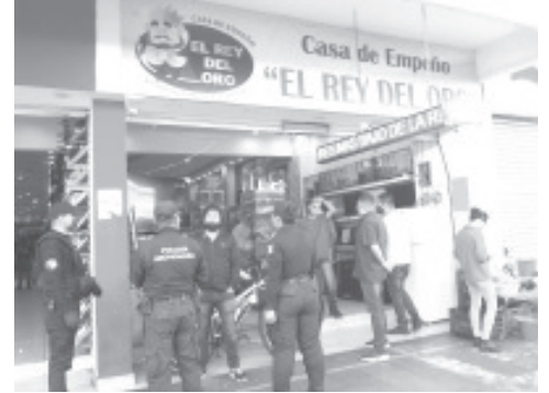
El cierre va destinado solo para negocios cuya actividad no es esencial, que venden ropa, zapatos y otros artículos que no son de primera necesidad.

La actividad comenzó desde las primeras horas del día y para ello fue necesaria la conformación de dos grupos. Notificadores de ingresos municipales para los comerciantes formales y