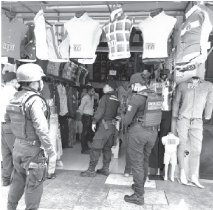
Con el apoyo de la Secretaría de Seguridad Pública municipal, en coordinación con la Guardia Nacional, cerraron 78 establecimientos no esenciales en el primer cuadro de la ciudad.