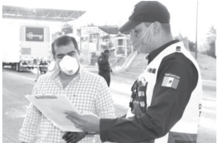
Tras confirmarse dos casos de coronavirus en Zitácuaro, habrá medidas extremas para que la población se mantenga en sus domicilios.

Asimismo en las próximas horas se tendrán resultados de 6 casos sospechosos que también se tienen en el municipio.