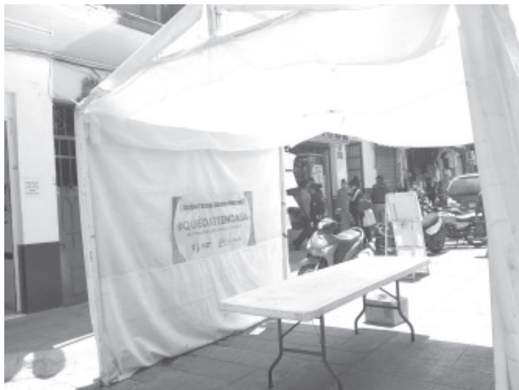
Este lunes muchos ciudadanos acudieron a realizar sus actividades cotidianas, y pocos tomaron en cuenta medidas como el uso del cubrebocas.

- Encargados de filtros fueron retirados, todo queda bajo la responsabilidad de los ciudadanos.