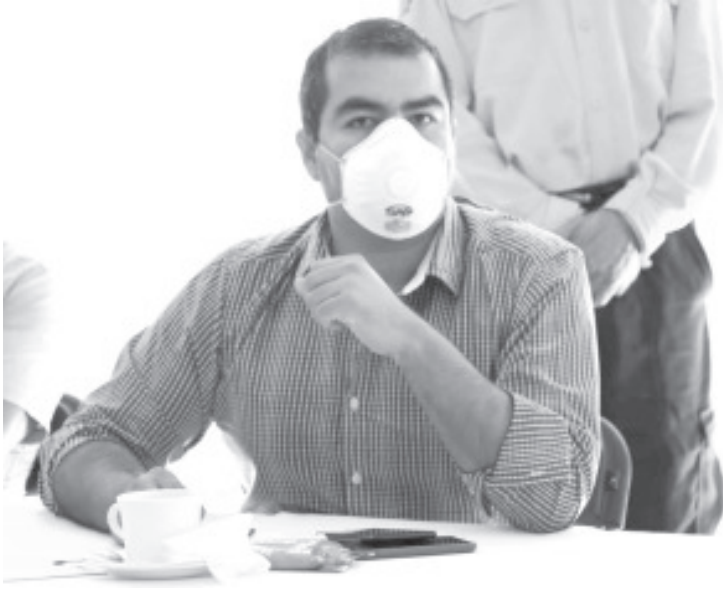
Al entrar la fase 3 del COVID 19, ayuntamiento de Zitácuaro aplicará las medidas instruidas por los gobiernos estatal y federal.

-Al entrar la fase 3 del COVID 19, ayuntamiento de Zitácuaro aplicara las medidas instruidas por los gobiernos estatal y federal.