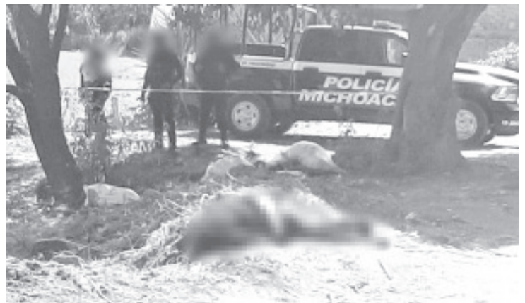
De un balazo en la cabeza fue ejecutado un hombre que está en calidad de desconocido.

Morelia, Mich.- Lunes 20 de abril de 2020.- De un balazo en la cabeza fue ejecutado un hombre, quien estaba tirado a la orilla de un camino de terracería de la colonia Monte Rubio, ubicada en la Tenencia Morelos, municipio de Morelia.