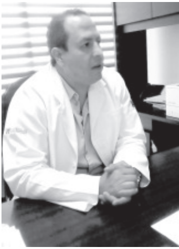
Si una persona fallece por coronavirus se le pone en una bolsa especial sellada, el área donde se encontraba el paciente será debidamente desinfectada.