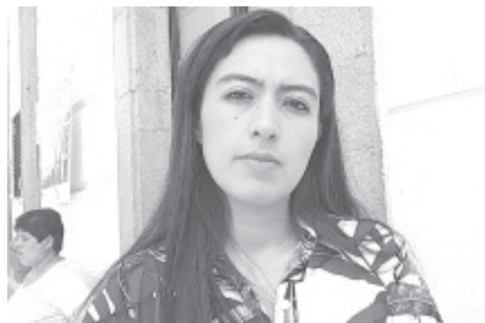
La Secretaria de la Mujer a nivel Municipal ha dispuesto de un protocolo especial para atender situaciones de violencia hacia la mujer.

Asimismo, recalco que se dispone de un albergue a nivel local que funciona de forma temporal, y si es necesario también se puede recibir la ayuda del que se tiene en la ciudad de Morelia. «Nosotros estamos haciendo lo posible para que los casos de violencia que existan lleguen hasta la fiscalía y se les de seguimiento», destacó la funcionaria.