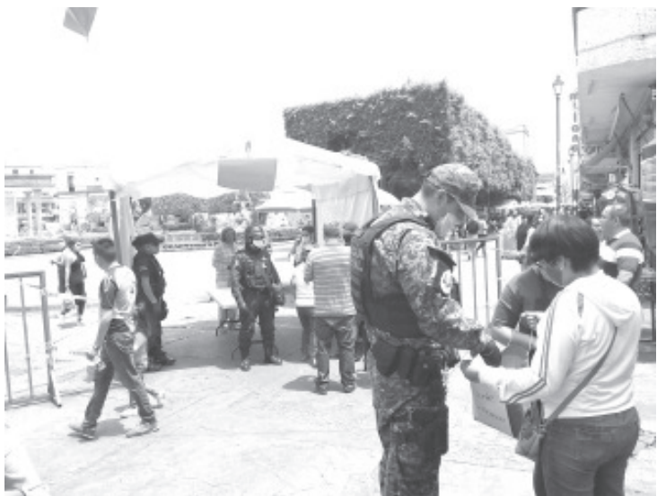
En Zitácuaro no entrará ninguna persona más sin cubrebocas al primer cuadro de la ciudad, se suman fuerzas municipales y federales.

Cabe mencionar que durante las primeras horas del día se confirmó el primer caso de Covid 19 en uno de los 19 municipios que conforman la Jurisdicción Sanitaria No. 3, ocurrió en el municipio de Susupuato, en donde el paciente perdió la vida en su domicilio, al parecer no recibió atención médica.