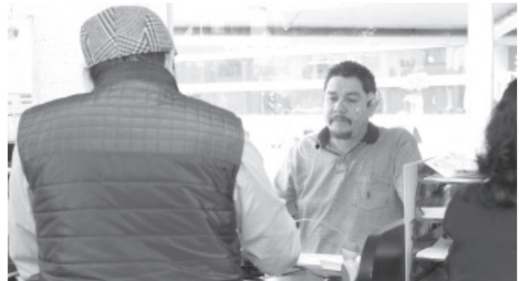
Para no sobreexponer a sus trabajadores en sus oficinas de Rentas en el estado, la SFA implementará un nuevo horario de atención al contribuyente, desde el jueves 16 de abril.

¡Gracias! Juntas y juntos trabajamos por el bienestar de México.