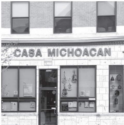
El gobierno de Michoacán está preocupado por su bienestar, no los vamos a dejar solos, vamos a estar apoyando en lo que podamos con orientación y acompañamiento.

En coordinación con organizaciones y clubes de migrantes, se han intensificado las campañas para informar a los paisanos acerca de cuáles son sus derechos