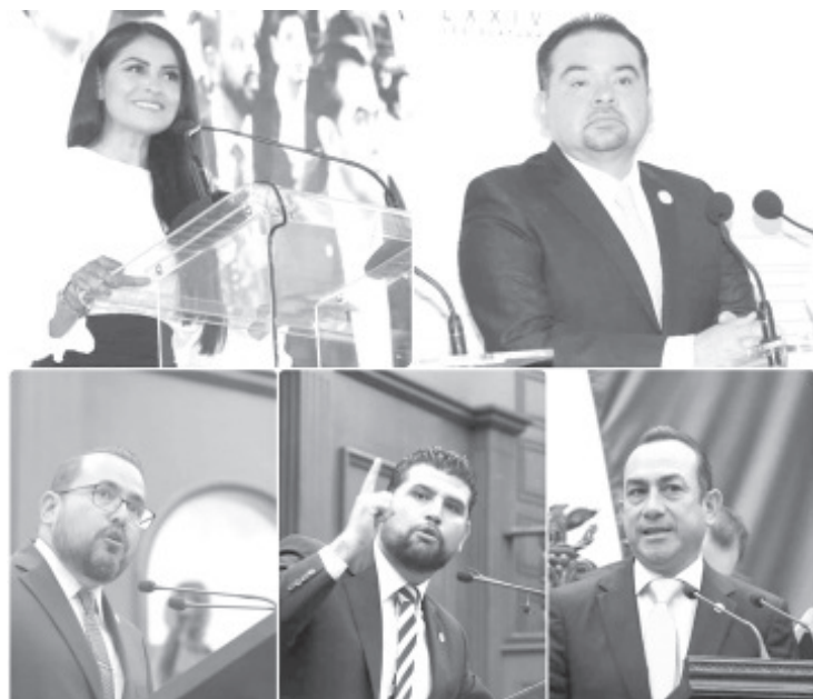
Resulta urgente que el Gobierno Federal deje de abonar a la desinformación y se concentre en asumir con toda seriedad sus responsabilidades.

-No es momento de simulaciones, no es momento del cálculo político, no es momento de escatimar recursos, no es momento de batallas distintas a la del combate al Covid-19