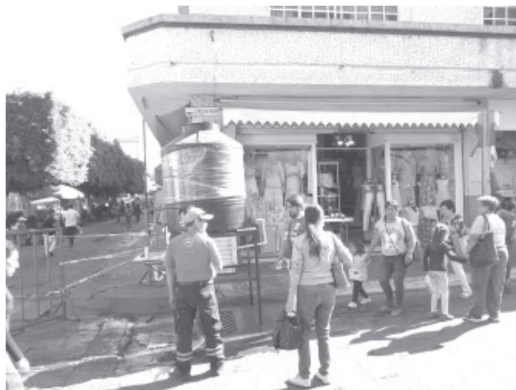
Este miércoles, encargados de los 6 filtros instalados en los accesos al jardín contabilizaron la entrada de casi 22 mil personas durante todo el día.