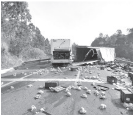
El tractocamión volcó y posteriormente un ómnibus de la línea Purhépechas se impactó contra él, la víctima viajaba en el autobús

+El tractocamión llevaba un cargamento de pollos para cocinar que terminó rogado en la cinta asfáltica.