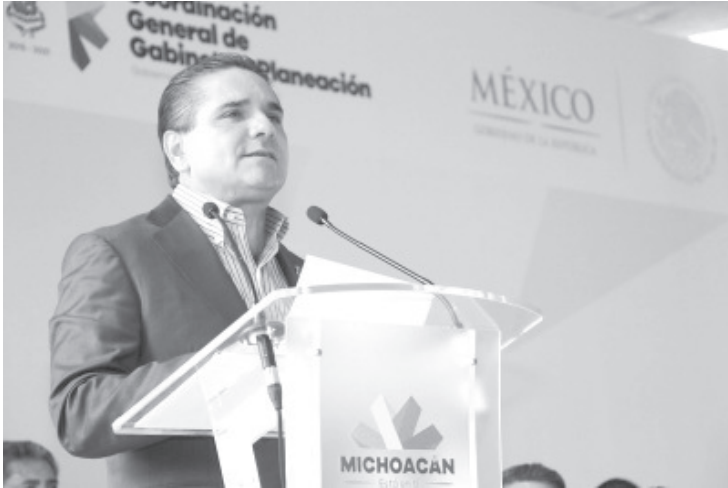
Aureoles Conejo pidió a las autoridades federales de salud, hablar con la verdad sobre la atención y respuesta que están dando a la emergencia sanitaria.

Morelia, Michoacán, a 16 de abril de 2020.- El Gobernador Silvano Aureoles Conejo pidió a las autoridades federales de salud, hablar con la verdad sobre la atención y respuesta que están dando a la emergencia sanitaria, provocada por la propagación del COVID-19 en el territorio nacional.