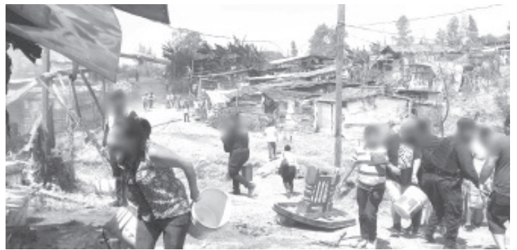
Varias casas de madera fueron devastadas por un incendio que se registró la tarde de este jueves en el asentamiento irregular Paraíso Industrial de Morelia.

Policías estatales se unieron a las labores de ayuda y después de unos minutos el fuego fue sofocado. Por último, los vulcanos eliminaron los rescoldos. Afortunadamente no hubo heridos ni fallecidos, comentaron las autoridades policiales.