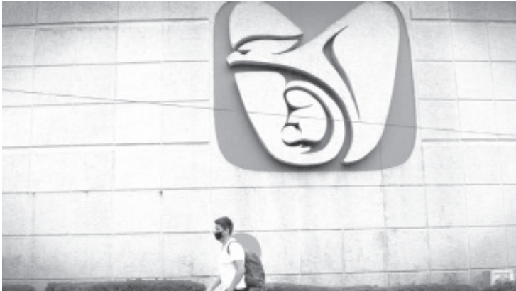
El gobierno federal siguió un inusual procedimiento exprés, de apenas cuatro días, para asignar directamente un contrato por 93 millones de dólares.

Un día después de la publicación del decreto presidencial que autorizó las compras de