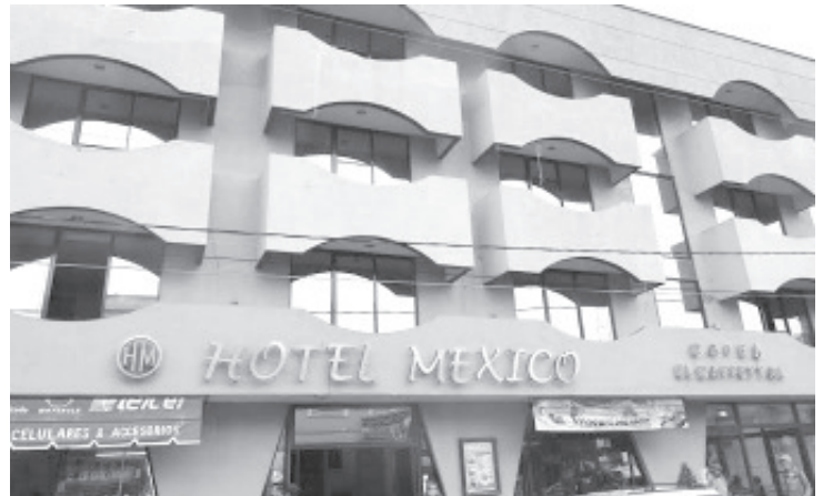
Ante la pandemia actualmente cada hotel tiene permitido funcionar solo al 15% de su capacidad, y de hecho ni siquiera llegan a esta cifra.

H. Zitácuaro Michoacán, 17 de abril de 2020.- Por: Guadalupe Solache Rebollo. Como consecuencia de la cuarentena que se vive por el Coronavirus Covid-19, los hoteles de la región oriente registran solo el 5% de ocupación.