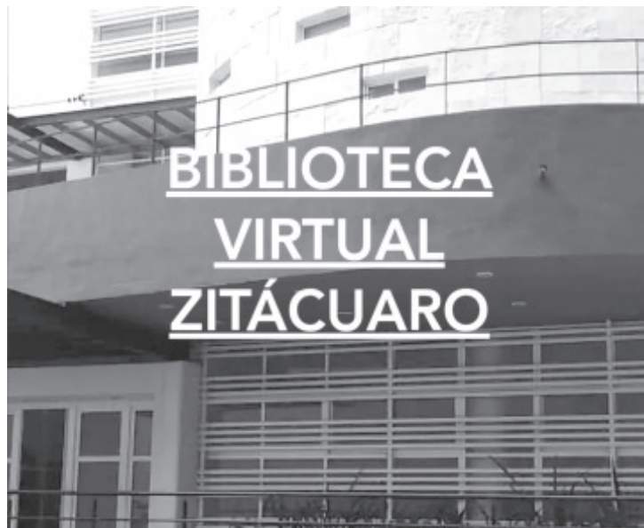
Se trabaja en la construcción de la página web de la institución, por medio de la cual se compartirán materiales interesantes y útiles para todo público.