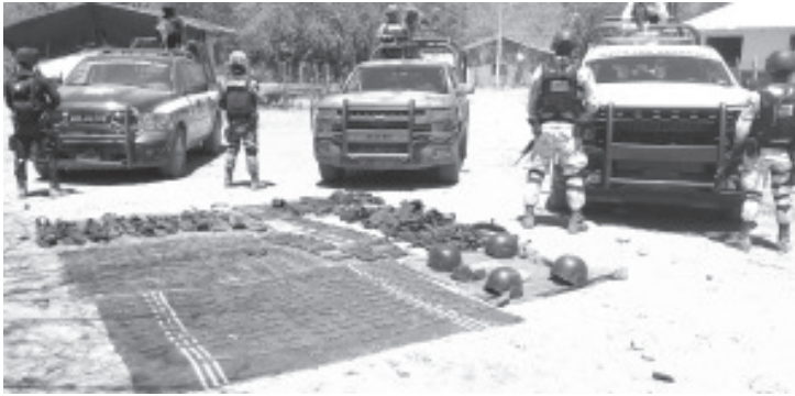
Los agentes aseguraron 11 armas, 91 cargadores, 17 granadas de fragmentación, así como dos artefactos explosivos de fabricación casera, y equipo táctico.

La SSP pone a disposición de la población michoacana el número 911, a fin de reportar y combatir actos ilícitos.