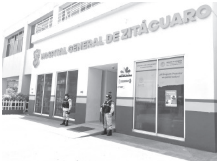
A partir de este viernes, elementos de la Guardia Nacional iniciaron el resguardo del Hospital Regional en Zitácuaro.

Esta acción se deriva de la estrecha colaboración con autoridades federales, estatales y municipales, por medio de la Mesa de Seguridad que convoca a las distintas corporaciones cada semana para