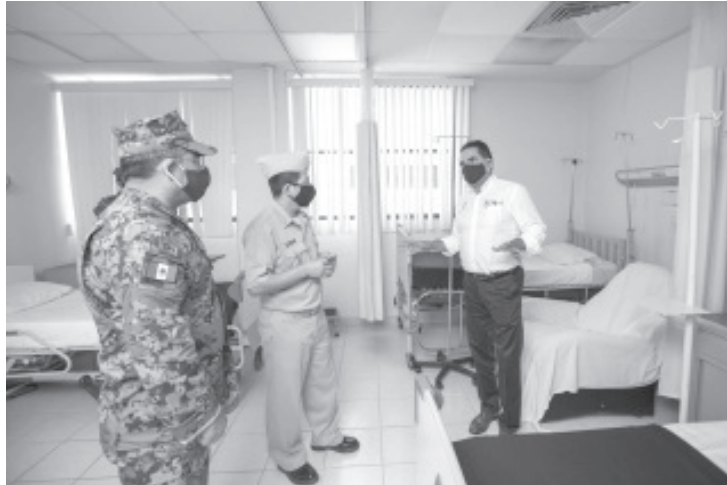
Es momento de endurecer las acciones y hacer entender a la población que si no seguimos las recomendaciones sanitarias, la cifra de contagios va a masificarse.

El mandatario hizo hincapié en que el 80