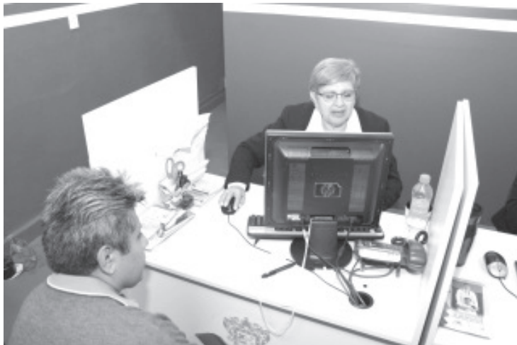
La incorporación o afiliación al Régimen de Incorporación Fiscal, no significa gasto para él o la interesada, ya que es totalmente gratis.

Para mayores informes respecto a medidas de prevención e información general sobre el COVID-19, la Administración Estatal proporciona a la población el número 800-123-2890, con 11 líneas para resolución de dudas, así como un micrositio donde encontrarán toda la información disponible sobre COVID-19, ingresando a la liga bit.ly/MichCOVID-19.