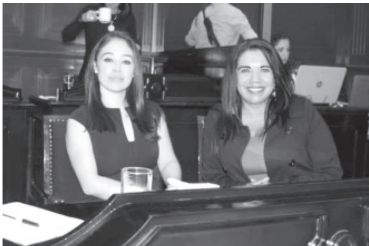
Llamaron a investigar quiénes están atrás de estas decisiones, para denunciar a los que pretenden aprovecharse de una desgracia, para apoderarse de estos espacios.