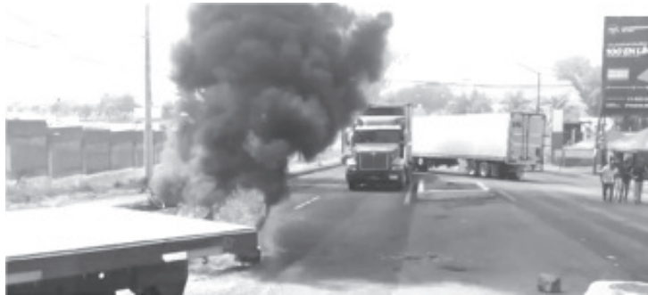
En el hospital donde atendieron a la reportera informaron que «presenta lesión en hemitórax izquierdo, en sedal, sin penetrar; está consciente y no amerita internamiento»

Debido a lo ocurrido los jornaleros incendiaron llantas y amagaron con tomar otras acciones si no se hace justicia por lo que aconteció. Representantes de gobierno ya intervienen en el caso para tratar de solucionarlo.