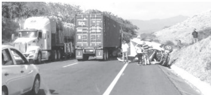
La camioneta se impactó por alcance contra el pesado tráiler, marca Kenworth, placas 52-AL-5, de una empresa refresquera.

Nuevo Urecho, Mich.- 2 de abril de 2020.- El conductor de una camioneta, murió prensado luego de que se impactó en la parte posterior de un tráiler de una empresa refresquera, la tarde de este jueves, cerca de la población de El Tejabán, en la autopista