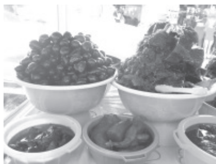
Las ventas están solo a un 10%, aún cuando han mantenido el precio del año pasado que es de 120 el kilo y 15 pesos la torta.

A las personas que quieran consumir este dulce, les aseguró que es un producto que se hace de forma tradicional, y se mantiene en el proceso todas las medidas de higiene. Ahora por el covid-19 han extremado las acciones, por ejemplo usan cubre pelo, cubrebocas, guantes y también solo una persona despacha y la otra cobra.