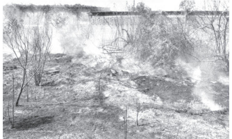
Vamos bien y pedimos a la gente del campo, que tome sus precauciones, si quieren realizar alguna quema, que soliciten el apoyo para que sea una actividad controlada.

Reiteró que es importante que toda la población esté al pendiente de este tema, en caso que se detecte algún incendio forestal de inmediato se debe reportar al número de emergencia 911.