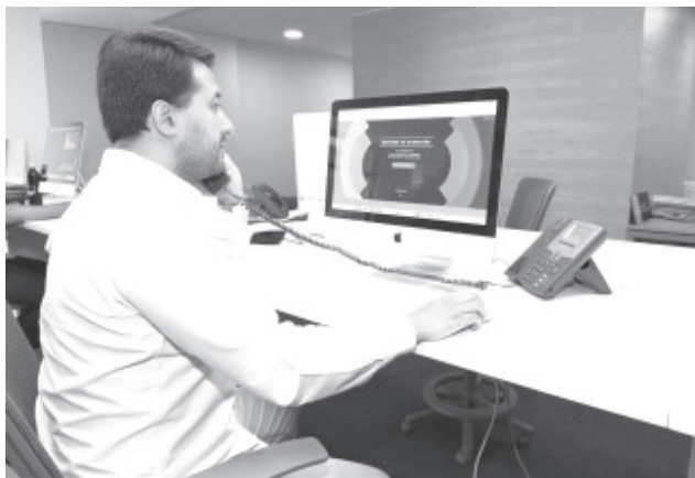
Se precisa que las y los solicitantes no deben realizar depósitos en efectivo en ningún momento del trámite.

La Sedeco y Sí Financia hacen un atento llamado a no dejarse sorprender por personas que ofrecen apoyar o agilizar el trámite, cuyos requisitos, formatos y asignación de folio se realizan de manera personal, únicamente a través de planemergentemichoacan.com .