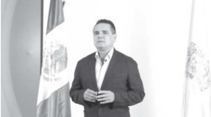
Aureoles Conejo, solicitó al presidente López Obrador, el envío urgente de medicamentos, insumos y materiales necesarios a los estados para atender a los pacientes.

Morelia, Michoacán, a 3 de abril de 2020.- Ante la contingencia sanitaria por COVID-19, el Gobernador de Michoacán, Silvano Aureoles Conejo, solicitó al presidente Andrés Manuel López Obrador, el envío urgente de medicamentos, insumos y materiales necesarios a los estados para atender a los pacientes, conforme a los lineamientos del nuevo sistema de salud federal.