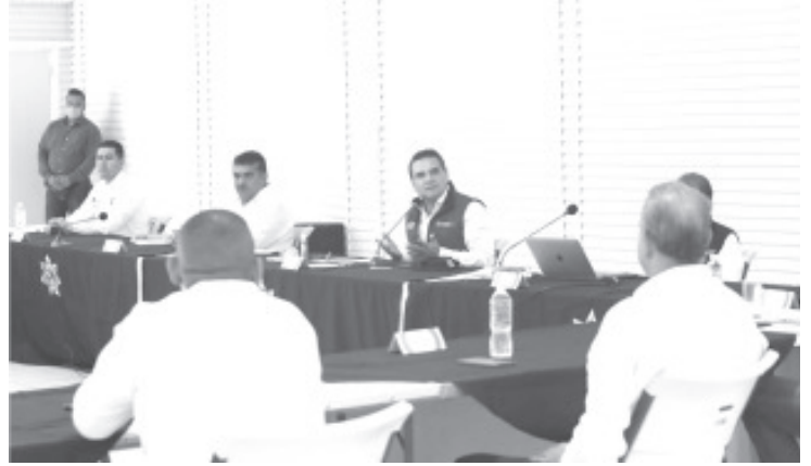
Es altamente riesgoso tomar información de fuentes desconocidas porque se puede correr el riesgo de que sea imprecisa y se tomen decisiones incorrectas.

En la reunión se les pidió a los presidentes municipales intensificar la campaña de difusión, principalmente en zonas rurales y comunidades indígenas, donde aún hay escepticismo en el tema; cerrar playas, balnearios y cantinas, colocar llaves en mercados para que la gente se lave las manos, regular tianguis, hacer perifoneo y adherirse a las fuentes de información oficiales, como el sitio https://michoacancoronavirus.com .