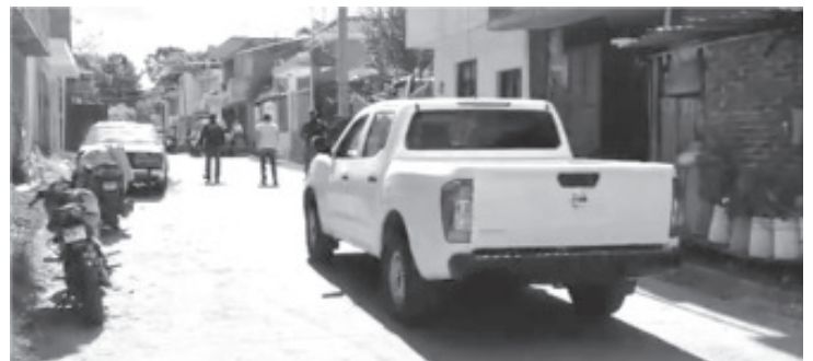
En acción operativa realizada en la ciudad de Uruapan y tras un enfrentamiento, personal de la Fiscalía detuvo a ocho personas y aseguró armas de fuego.

Voces allegadas al asunto dijeron a este medio de comunicación que se presume que los arrestados podrían estar relacionados en varios ilícitos. El tiroteo fue en las calles de la colonia Uruapan del Progreso.