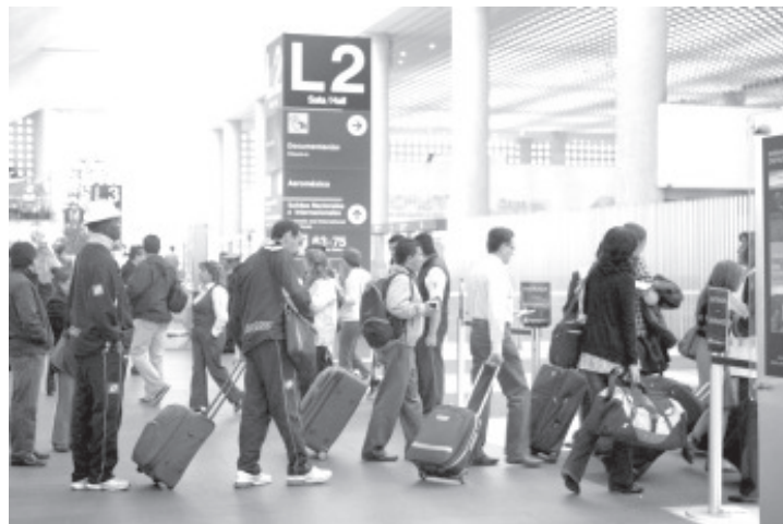
El IMSS hizo un llamado solidario a las personas que regresen del extranjero a territorio nacional, a permanecer en casa y reforzar las medidas de higiene a fin de prevenir contagios.

Al presentar síntomas respiratorios leves como: tos, fiebre, dolor de garganta, estornudos o escurrimiento nasal, es indispensable permanecer resguardados sin salir de casa. Si además de eso tiene dificultad para respirar y dolor de pecho, hay que acudir