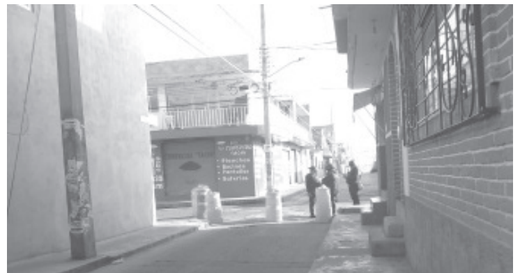
Desde las 6:00 de la mañana, que es la hora en que comienzan a instalarse los comerciantes, en todos los accesos al tianguis fueron colocados conos, elementos y patrullas para evitarlo.

«Es injusto por parte de las autoridades, nos están tratando como delincuentes porque cerraron todas las entradas con policías, no sé por qué, si somos trabajadores de Zitácuaro, somos tianguistas» lamentó uno de ellos.