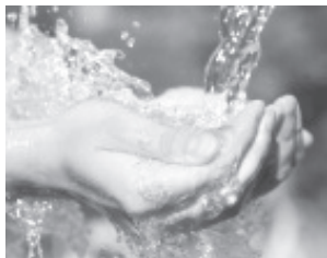
Se debe evitar dejar correr el vital líquido al lavar trastes, manos o dientes, ya que esto se traduce en un ahorro de 12 litros por minuto.

La Comisión Estatal del Agua y Gestión de Cuencas (CEAC) invitó a las y los michoacanos a comprometerse con el cuidado y conservación de los recursos naturales, siendo uno de los más valiosos el agua, ya que posibilita la existencia de la vida.