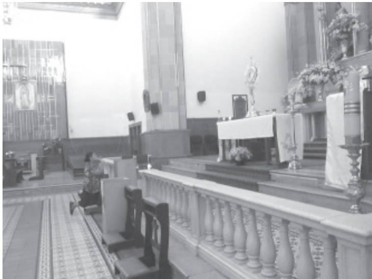
Todos los templos permanecerán abiertos para que los feligreses que lo requieran puedan realizar sus oraciones, pero no habrá misas.

«La intención no es convocar a la gente que se reúna, sino que a lo largo del día los que quieran pueden venir a bendecir sus ramos, siempre y cuando no haya aglomeración de personas», explicó el sacerdote.