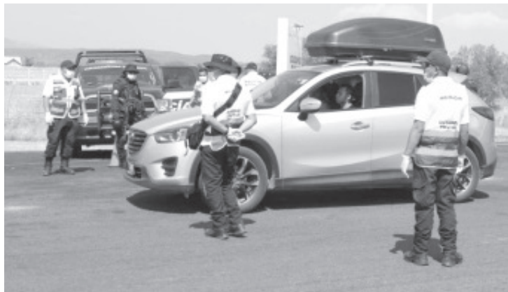
Se acordó intensificar las acciones para frenar la propagación del virus y garantizar que si no se trata de actividades esenciales, la población se resguarde en sus casas.