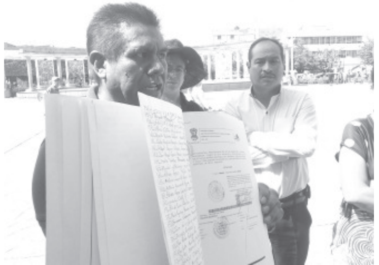
Desde 2015 al 2020 no se ha hecho ningún pago por el uso de la concesión de agua a Conagua, por el Comité saliente, denuncian.