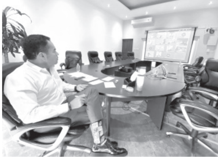
Buscar soluciones, estrategias y acciones para mantener los empleos y se tenga el menor impacto ante la contingencia es una tarea permanente del Gobierno del Estado.

El encargado de la política interna del estado se dirigió a los empresarios para reforzar la idea de que juntos, gobierno y sociedad civil, cada quien desde su trinchera haga lo conducente para que el