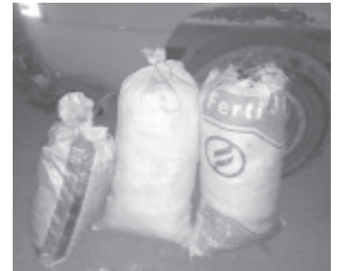
Los elementos policiales localizaron en el interior de un vehículo, tres costales con la droga, con un peso aproximado de 30 kilogramos.

La SSP pone al servicio de la población el número 911, a fin de denunciar actos ilícitos.