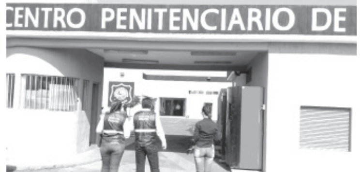
Calificación global de 7.14 otorgó la CEDH al sistema penitenciario en Michoacán, según el Diagnóstico Estatal de Supervisión Penitenciaria 2019 aplicado en 11 Centros.

El Diagnóstico Estatal de Supervisión Penitenciaria es aplicado por la CEDH para conocer la situación de respeto a los derechos