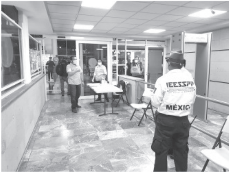
La SSM, intensificó los filtros sanitarios en la Terminal de Autobuses de Morelia, revisando a 25 mil 557 pasajeros del 21 al 29 de marzo, con 15 médicos y 30 cadetes del IEESPP.

15 médicos de la SSM y 30 cadetes del IEESPP trabajan permanente por la salud de las y los michoacanos