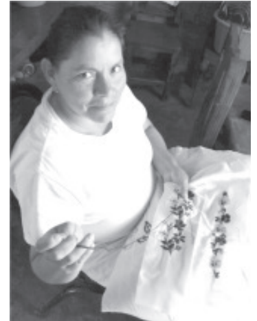
Su actividad económica contribuye al sustento de cuatro familias de la comunidad de La Y Griega, en Zitácuaro, así como a la cadena de proveedores del sector textil.