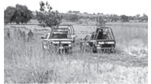
El cuerpo baleado de un hombre fue encontrado tirado en un camino de terracería que está próximo a la carretera federal Morelia-Zinapécuaro.

El cuerpo fue subido a una ambulancia de uso forense para enseguida ser trasladado a las instalaciones del anfiteatro local para la práctica de la necropsia de rigor, luego sería entregado a sus seres queridos. Mandos policiacos comentaron que fueron unos vecinos de la zona los