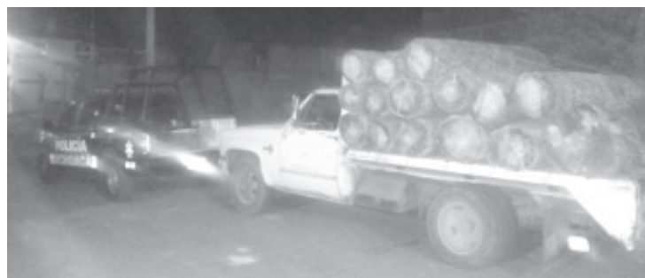
Sobre el libramiento norte de esta ciudad personal de SSP detuvo a dos con una carga de trozos de madera ilegal.