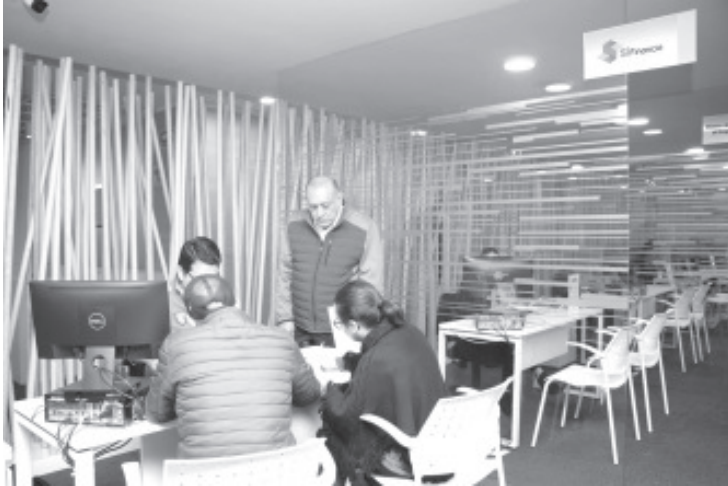
El periodo de no pago temporal también aplicará para el programa Palabra de Mujer, en sus esquemas Crédito a la Palabra y Crédito a Proyectos Productivos, entre otros.

* La medida busca estimular a las micro, pequeñas y medianas empresas en este periodo de contingencia sanitaria