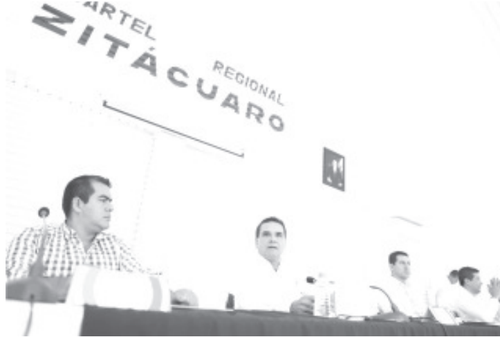
El gobernador y las y los presidentes municipales de la región oriente, revisaron los 12 acuerdos que serán implementados en coordinación con los municipios.