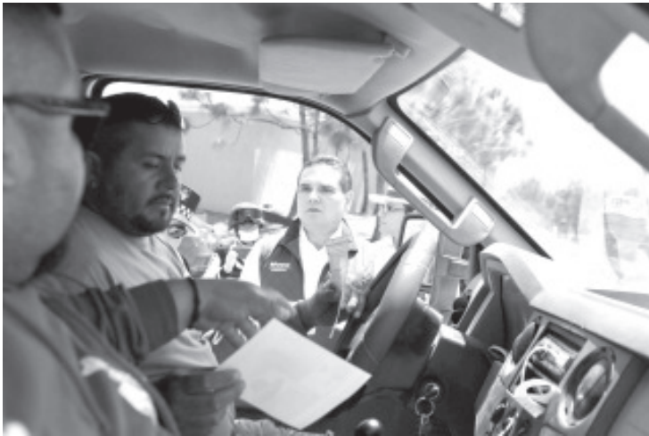
Silvano Aureoles Conejo hizo un recorrido de supervisión y encabezó personalmente acciones que se realizan en los filtros sanitarios, habló con los usuarios.

Son 12 puntos en los que se desplegaron 632 elementos de Policía Michoacán, Guardia Nacional, Ejército y Marina Armada de México