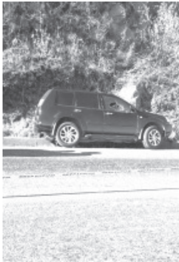
El hombre victimado está en calidad de desconocido, entre sus pertenencias no tenía ningún documento que permitiera saber sus generales.

La SSP pone a disposición de la población el número 911, para reportar cualquier delito contra el medio ambiente.