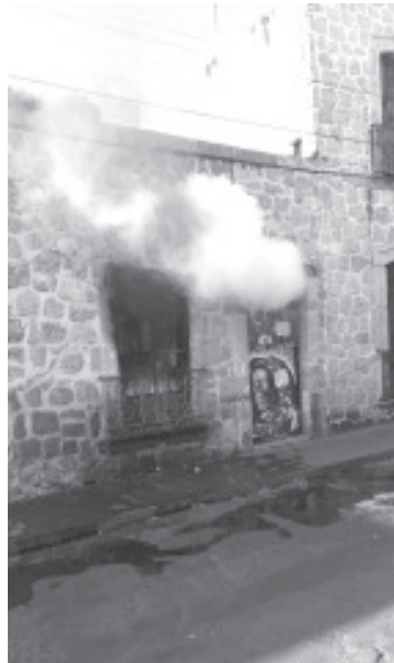
El incendio se registró en el domicilio marcado con el 440 de la calle Bartolomé de las Casas, en el centro histórico.

Por fortuna no hubo lesionados ni fallecidos a raíz del incidente, sólo daños materiales. Además se desconoce cómo inició el siniestro, refirieron fuentes policiales y de rescate.