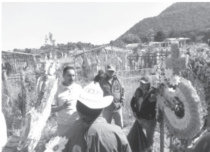
Por error de la Fiscalía de Tijuana, una familia de Ziráhuato enterró en el panteón de este lugar el cuerpo de quién pensaban que era el un familiar fallecido allá.

Aseguraron que con el intercambio de cuerpos se terminaría este calvario que han vivido desde aquel 7 de diciembre del año 2019 cuando les avisaron que su hijo y hermano había fallecido en la ciudad de Tijuana.