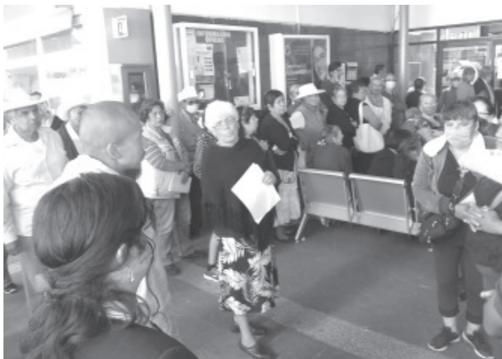
Decenas de adultos mayores se aglomeraron en la central camionera, para recibir su apoyo del Programa 65 y Más, que entrega el Gobierno Federal, sin medidas sanitarias.

Por el riesgo que representa una situación como ésta, y ante la falta de medidas por parte de representantes del Gobierno Federal, al lugar acudió personal de la COEPRIS, los cuales hicieron varias observaciones a los representantes del gobierno de la república y aplicaron la sana distancia entre los que permanecieron en la fila.