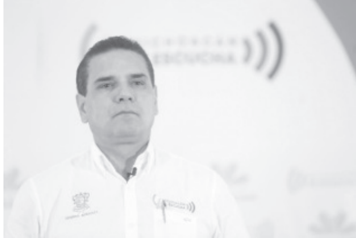
Las únicas actividades que seguirán activas, e incluso muchas de ellas con mayor intensidad, son aquellas necesarias para atender la emergencia sanitaria.

En un mensaje dirigido a las y los michoacanos, el Gobernador precisó que con esta medida las y los trabajadores que realicen una actividad que no corresponda a la rama médica, paramédica y administrativa, de seguridad pública o protección ciudadana, podrán ir a sus casas y resguardarse como el