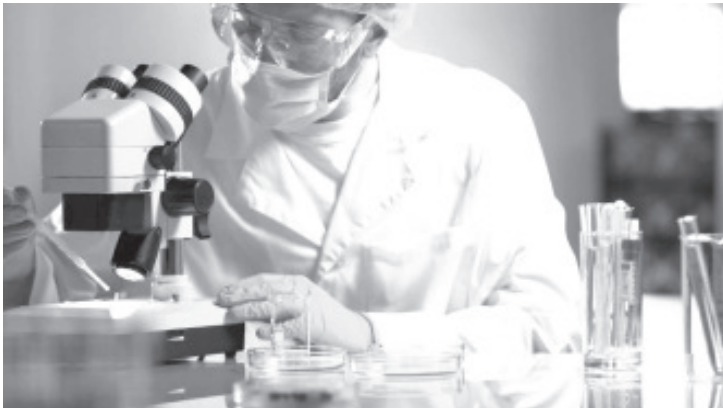
La emergencia de salud, ocasionada por el coronavirus reclama una intensa colaboración de científicos de todas las disciplinas.

El comunicado de ProcienciaMx busca así la unidad de la comunidad de CTI en estos momentos de crisis y ofrece su apoyo a las medidas que el país requiere para resolver esta difícil situación.