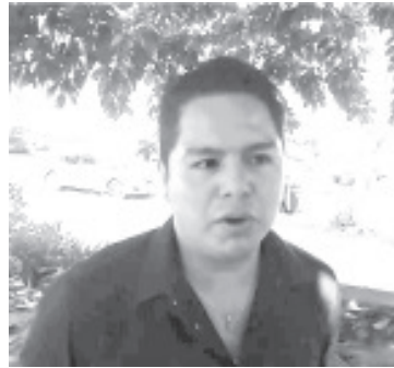
Están integrados solo restaurantes y establecimientos de alimentos para aminorar el daño por esta pandemia, que hasta ahora también afecta la economía.

El funcionario municipal, reconoció que hasta ahora ya se ven los efectos negativos en las ventas, por eso desde el gobierno se trata de hacer acciones que reduzcan el daño para ayudar a que el movimiento de la economía siga adelante y no se detenga, al menos a nivel local