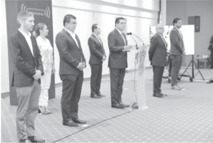
El Plan Emergente anunciado por el Gobernador contempla la ampliación del plazo del pago sin multas y recargos del Refrendo Vehicular 2020.

El paquete de estímulos incluido en el Plan Emergente anunciado por el Gobernador Silvano Aureoles Conejo contempla la ampliación del plazo del pago sin multas y recargos del Refrendo Vehicular 2020